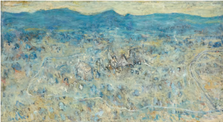
Црмница, 1949. (уље на платну, 980 x 1740 mm)