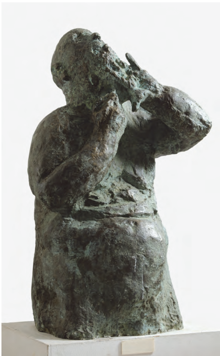
Човек који се брије, 1981. (бронза, 105 x 85 x 57 cm)