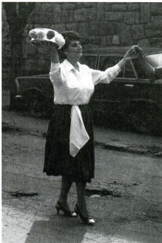
Сл. 1. Свекрва одевена у футу, са ситом у руци чији садржај сачињава пшеница, шећер, бомбоне и вреднија девизна новчаница, игра своје, свекрвино коло. Врање 1991.

национална припадност учврсти и манифестује. То се чини поступцима и симболима који су били карактеристични за период од 1990. до 1994, али улазе и нови. Током боравка на терену у августу ове године, сазнала сам да се готово сваког викенда дешава да млади пар на венчање одлази у чезама или кочијама, што је у