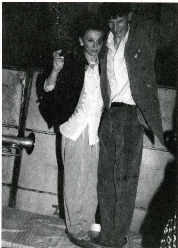
Сл. 2. Младенци у зору, на захтев старог свата, играју у тепсији. Врање 1997.

уклапа у постојећу слику о Врањанцима као веселјацима, коју они сами негују и подржавају као свој идентитетски мит 18 . Остављам отворену и могућност да се у тепсији играло у неком другом делу јужне Србије који није обухваћен истраживањем, или да је миграционим таласима пренесено из Македоније или са Косова.