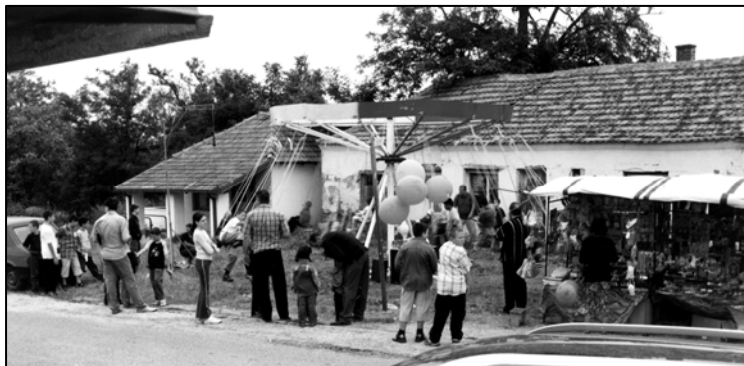
Слика 18: Сеоска слава Ранко Баришић, Зуце, 2002.