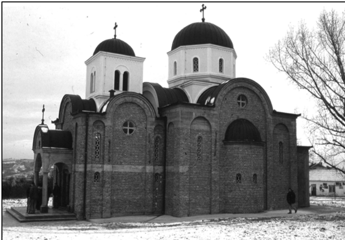
Слика 2: Сеоска црква у Зуцима Ранко Баришић, 1997.