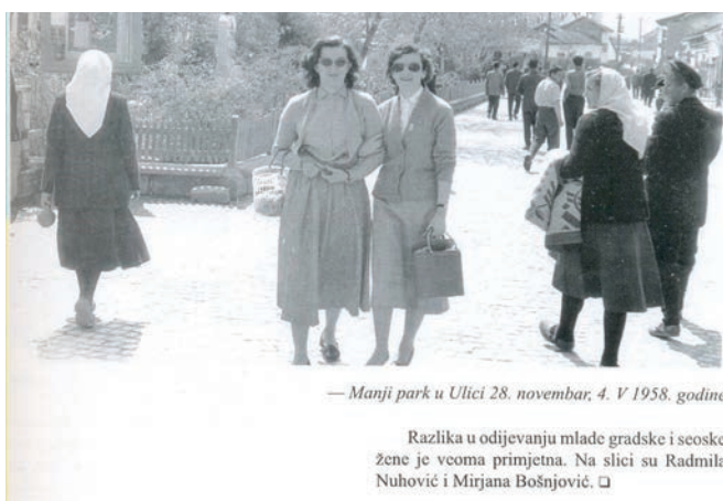
— Manji park u Ulici 28. novembar, 4. V 1958. godine