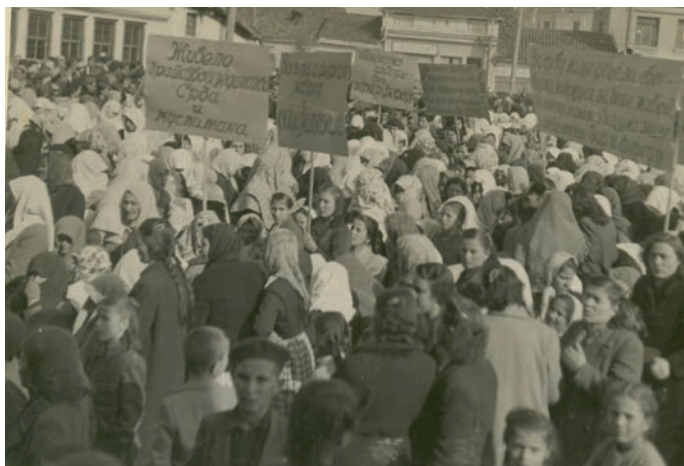
Masovno skidanje zara i feredže