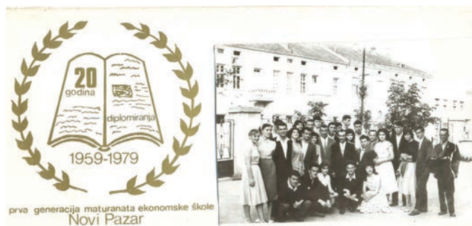
Prva generacija maturanata Ekonomske škole Novi Pazar 1959–1979.