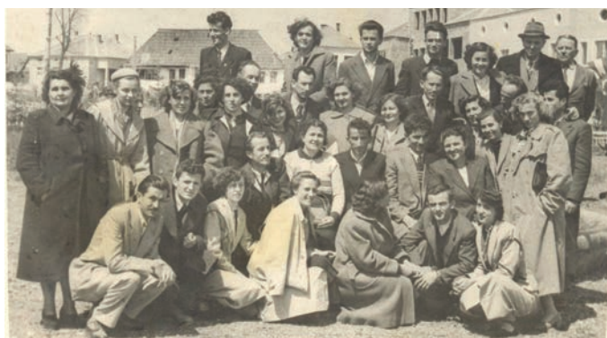
Sabor prosvetnih radnika održan u Sjenici, 31. avgusta 1954. godine. To je bio sabor za čitav Sandžak, sabor učitelja, nastavnika i profesora