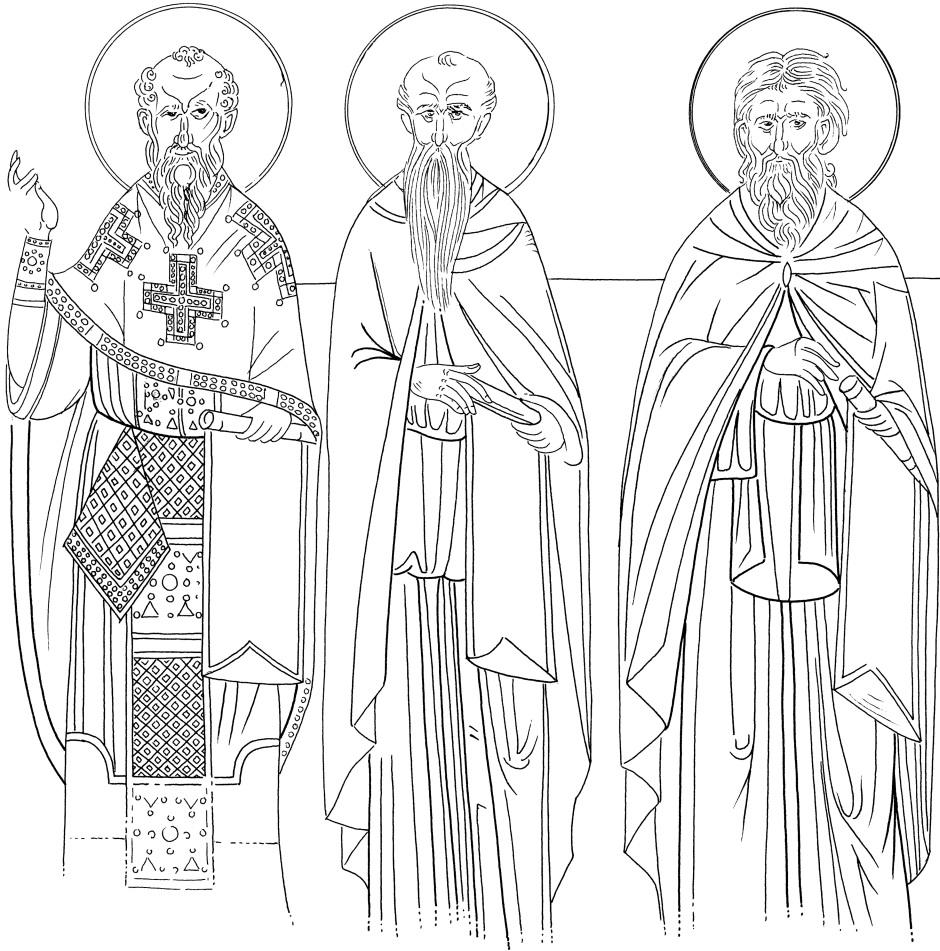
Оморфоклисија код Касторије, свети Теодор Студит, свети Пимен, преподобномученик Андреја „у Криси“

датак аналав, односно ниједан од монаха не носи омофор, овакав изглед критског преподобномученика несумњиво указује на преплитање култова и мешање иконографије светог Андреје Критског и његовог мање познатог имењака. Слична ситуација је и са представом преподобномученика Андреје „у Криси“ у менологу за октобар, Vind. hist. gr. 6 из Националне библиотеке у Бечу (друга половина XI века). 113 Свети Андреја је приказан као старији човек краће браде, како држи јеванђеље у левој руци. Насликан је у одежди архијереја. Обучен је стихар, носи епитрахил, надбедреник и омофор. Оваква представа