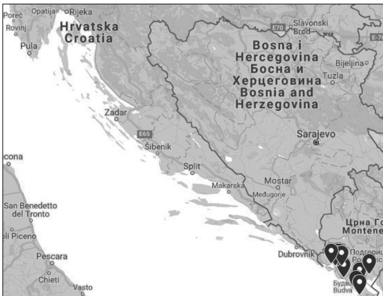
Мапа 6. Просјирање црногорских реликаја из њач. 3.2.