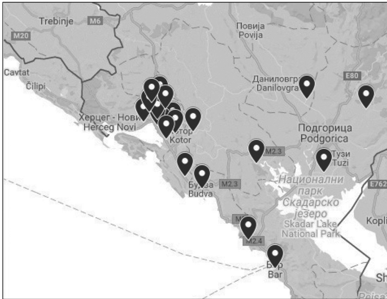
Мапа 1. Простирање црногорских реликвија из тач. 3.3.1. (= Реликти Brechung -а I, са сх. ѝ од лат. Ё.)