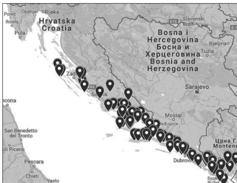
Мапа 4. Проси́рање црногорских и њиморских релика́ија из тач. 3.3. (= Релиќија Brechung -а I.) (V. фусноту у тач. 3.1.1. повише.)