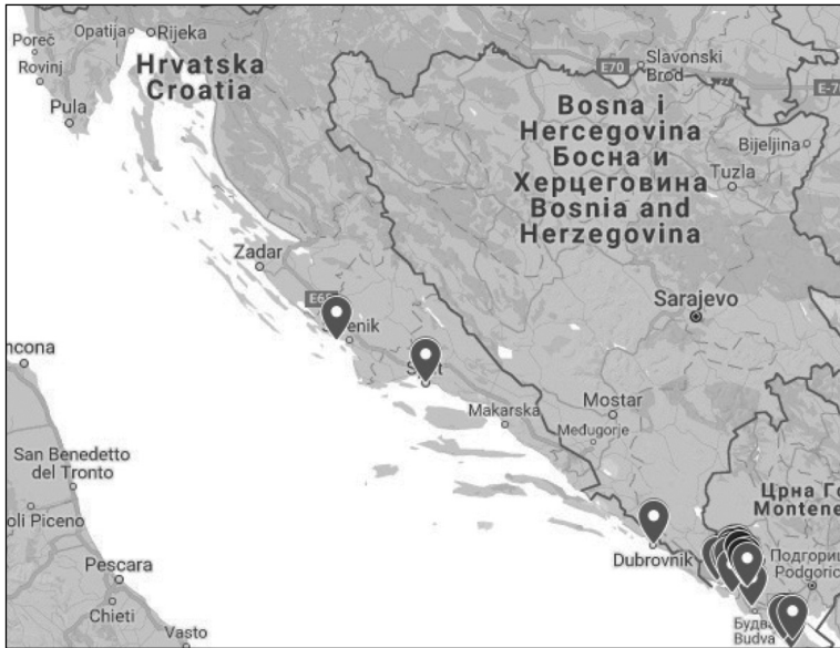
Мапа 5. Просјирање црногорских и њрморских реликаја из њач. 3.4. и 3.5. (= Реликти Brechung-a II.)