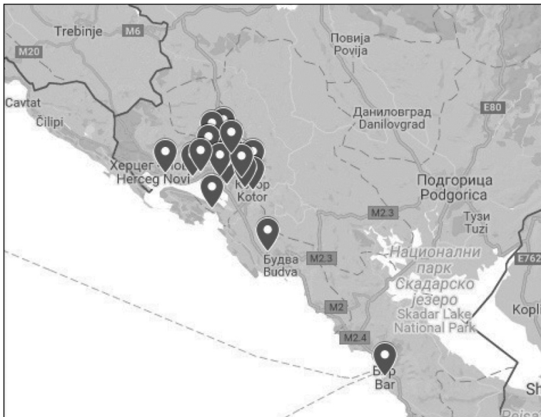
Мапа 2. Простирање црногорских реликвија из тач. 3.4.1. (= Реликвији Brechung -а II, са сх. ја од лат. Ё.)