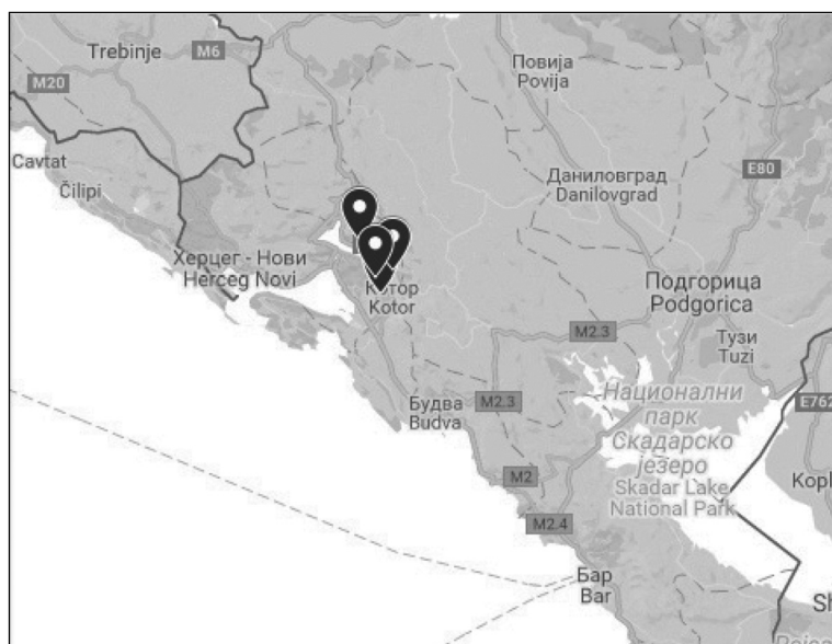
Мапа 3. Проси́рање црногорских релика́ија из тач. 3.5.1. (= Релиќија Brechung -а II, са сх. ијà од лат. Ё.)