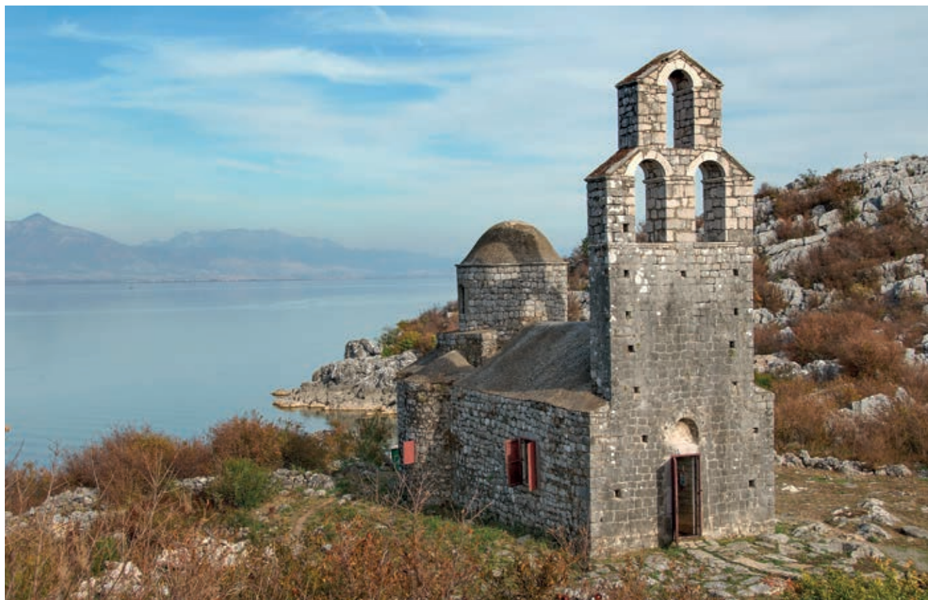
Fig. 328. Lake Scutari, Beška monastery, Church of St. George

according to the inscription above the church's entrance. 9 The Moračnik monastery, with its church dedicated to the Mother of God on the island of Moračnik, was first mentioned in 1417 in a charter by Balša II Đurđević, which suggests that he was its founder as well. 10 Along with the then prevalent maritime custom – a single-nave church – it is possible the ktetor intended that an 'Athonite' type of church, characteristic of the ecclesiastical architecture in the Despotate (fig. 351), be transferred to Zeta. It is a triconch of simple construction and reduced dimensions, stylistically representative of Zeta's architectural tradition. It was built of stone, while the shape of its vaults, arches, windows and bell-tower manifest a Gothic influence.