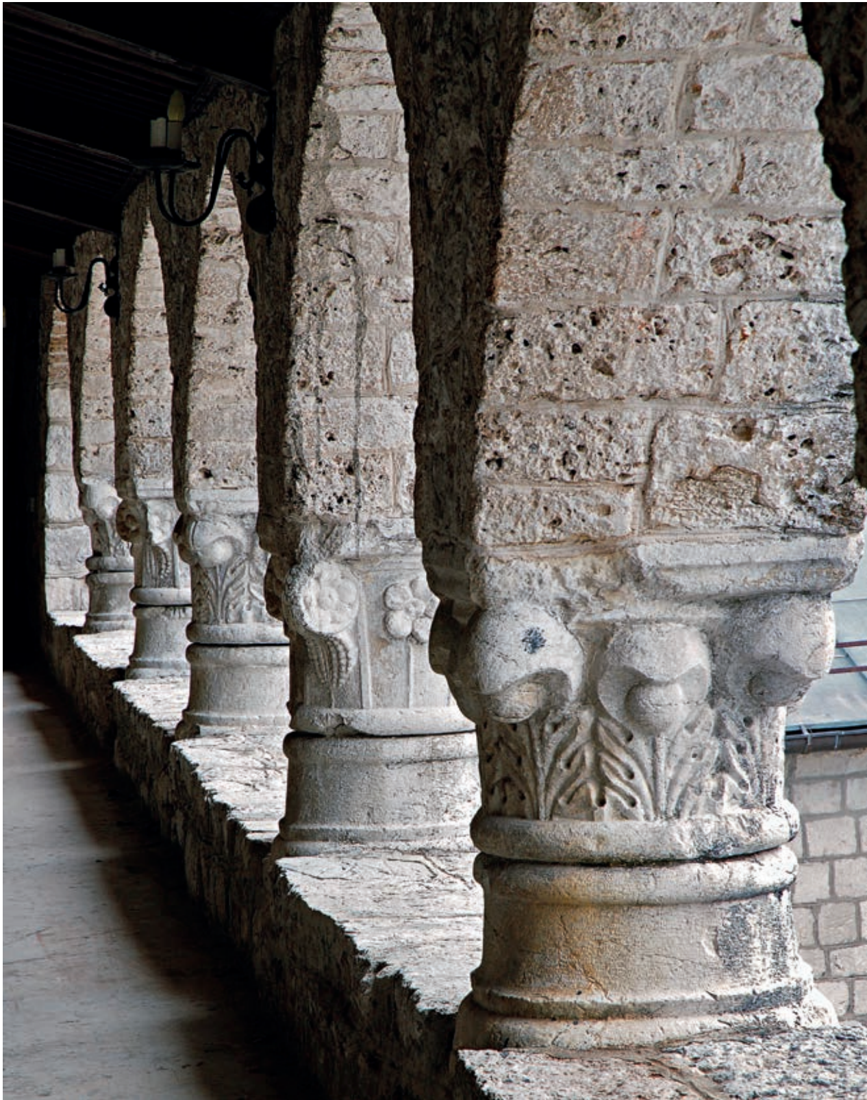
Fig. 332. Cetinje monastery, capitals, taken from the remains of the Crnojević monastery