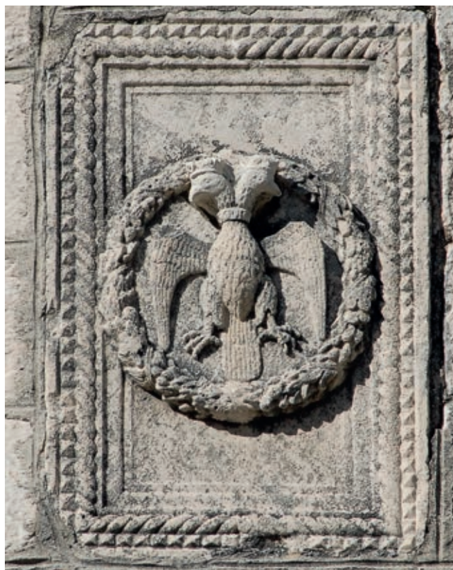
Fig. 333. Cetinje monastery, the Crnojević coat of arms, taken from the remains of the Crnojević monastery

An important segment of artistic activity in Zeta was the illumination of Cyrillic liturgical books. As the tradition of copying and decorating manuscript books in the scriptoria of the Balšić monasteries was dying out on the isles of Lake Scutari, printed books appeared. Thus, the first South Slav Cyrillic printing press, which the Crnojević installed in the Cetinje monastery in 1494, managed to print several books, among which 38 the Octoechos of the Fifth Tone (fig. 393) is outstanding for its rich decoration. 39 The notions guiding the decoration indicate their Orthodox Christian origin, the graphic ornamentation of the Cetinje editions demonstrates early Renaissance motifs, while the wooden printing blocks were probably made in the Venetian Republic. 40