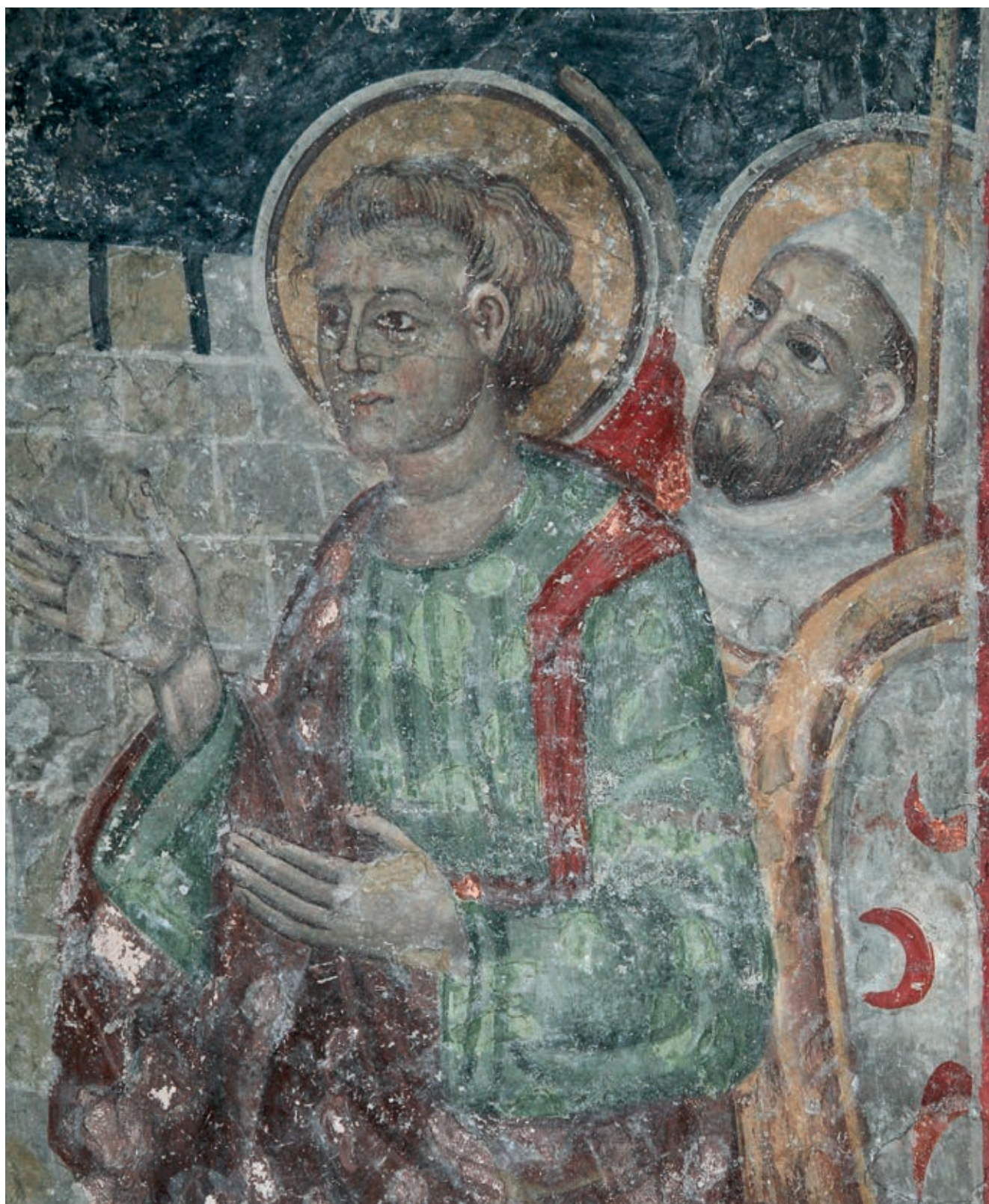
Fig. 329. Savina monastery, Church of the Dormition of the Mother of God, Crucifixion