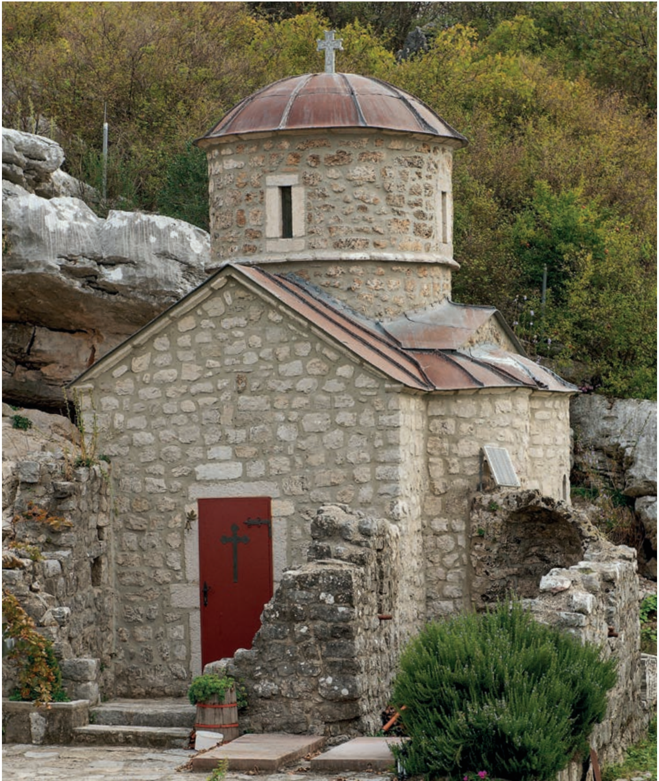
Fig. 327. Lake Scutari (Skadar), Starčevo, Church of the Dormition of the Mother of God