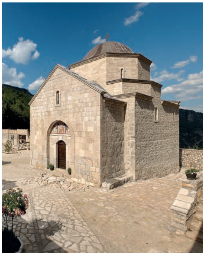
Fig. 330. Soko Fort, Church in Zagrade, view from south-west

The Church of St. George in Sopotnica was erected in 1454 below the fortified town on the Gradina hill, not far from the important town of Goražde, where Herceg Stefan used to reside in the summer. 25 The architectural concept of that church unites several stylistic expressions into an original whole. In addition to a Gothic vault and the elongated proportions of the church building itself, the Morava style sculpture, appears on its portal – an element quite unusual in the Kosača realm. As in the previously built Kosača foundations, a Raška spatial plan was also applied – to meet the requirements of the Orthodox rite. In accord with its liturgical framework, there was also a constructed stone iconostasis, which no longer exists. 26