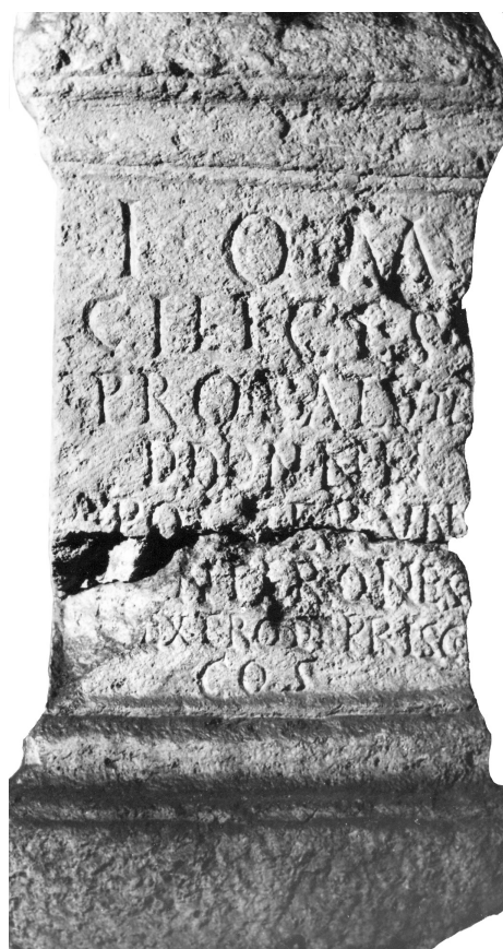
Сл. 2. – Легионарски наппис из Синџидунума (IMS I, 3), Cilices ... contirones . Северска епоха.