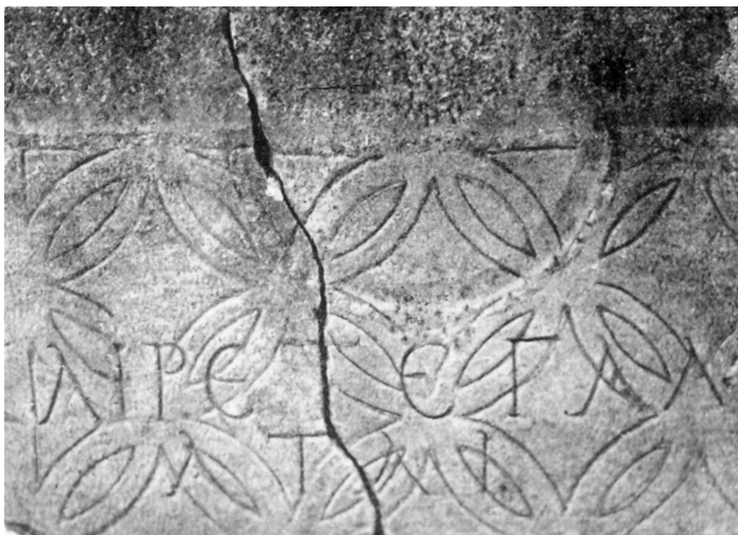
Сл. 3. – Наџџџџ из Нереза код Скуџа (IMS VI, 187).