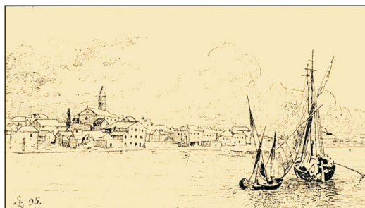
Biograd na moru

stočno od Zadra. Osnovali su ga Hrvati pored Zadra, kada je on bio neprijateljski i nedostupan rimski grad. Prvi put ga pominje Konstantin Porfirogenit polovinom X v. (τό Βελέγραδον, ή Βελεγραδα) među devet najvećih i najmnogoljudnijih gradova Dalmacije. Kada je Petro Orseola II osvojio dalmatinsku obalu (1000), Biograd dobija upravu po uzoru na autonomne rimske gradove sa izbornim vladarem na čelu. Na početku XI veka vraća se pod hrvatsku vladu kao grad isključivo podređen županu (urbs regia). Za Krešimira III Biograd postaje 1018. prestonica u kojoj se krunišu svi hrvatski kraljevi, a od polovine XI v. postaje sedište biskupije. 290