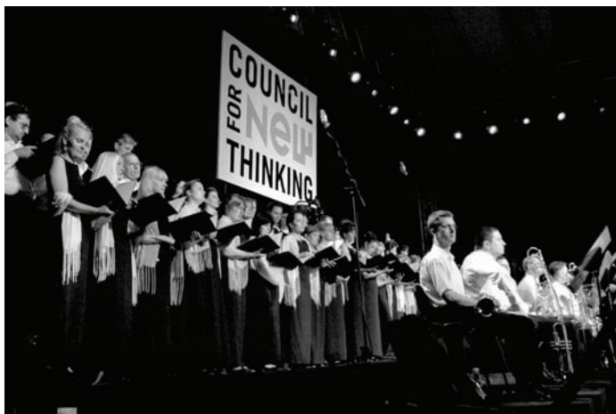
Са премијере New Ideas Symphony у Центру Сава

О овој музици као и о целокупној музици New age говори се као о „позитивној алтернативи“ али и као о „истини излазака сунца.“