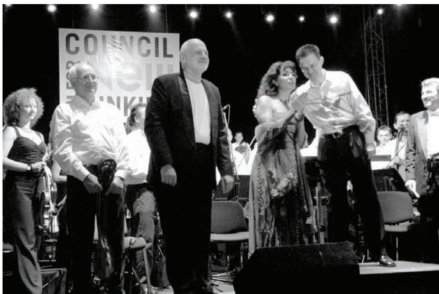
Са премијере у Центру Сава

Како естетика New age-а тежи рационалности, савладавању расцепканости модерне мисли, али критикује западњачку науку због превелике аналитичности и структурализма, покушаћемо да управо средствима из саме теорије, из самог правца, да не анализирамо и не цепкамо, већ да интегришемо појаве, доносећи синтетичне закључке.