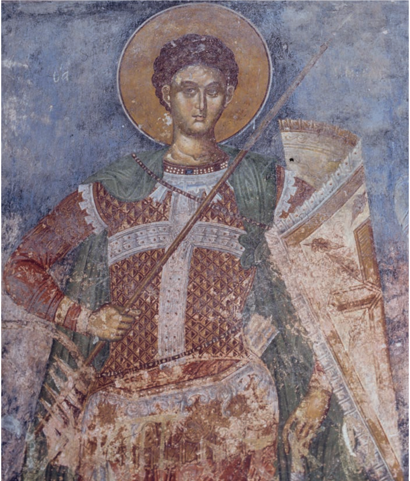
Fig. 302. Treska, Church of St. Andrew, St. Demetrios