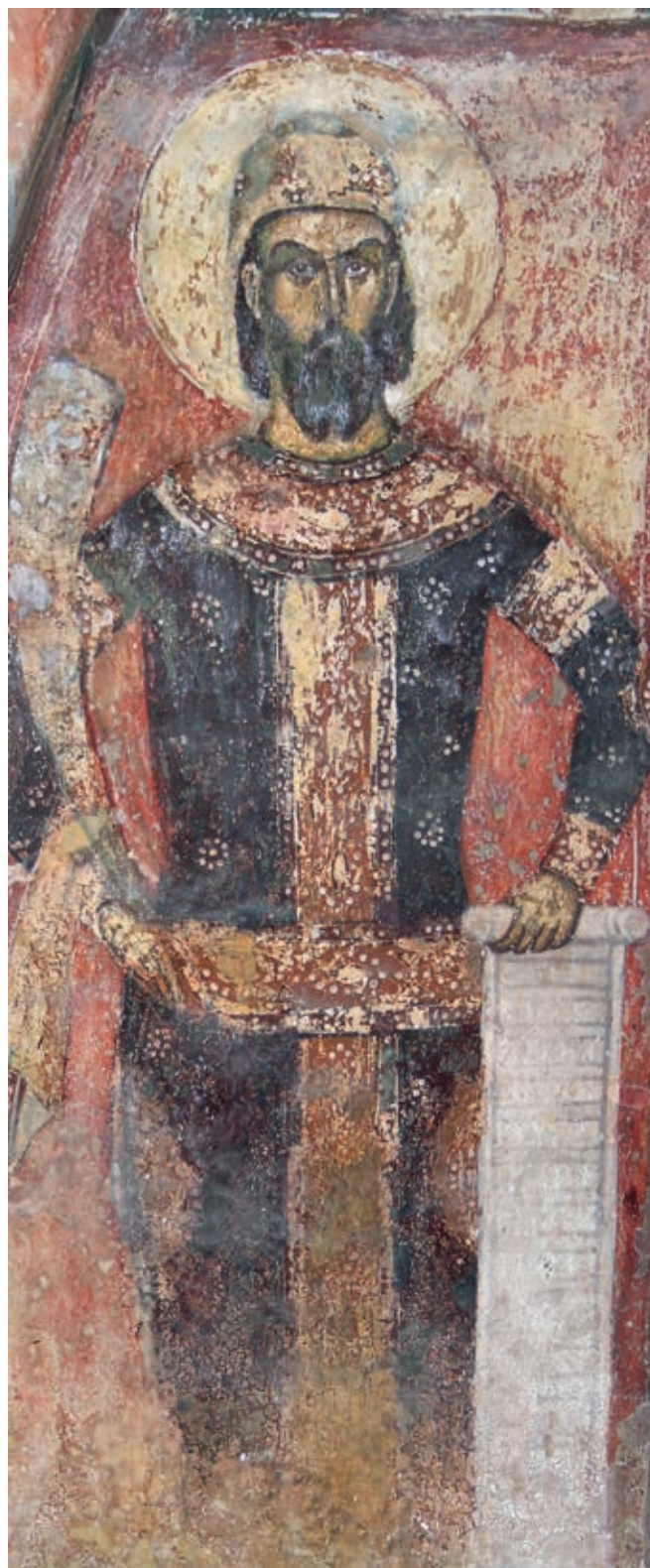
Fig. 299. Marko's Monastery, Church of St. Demetrios, portrait of King Marko