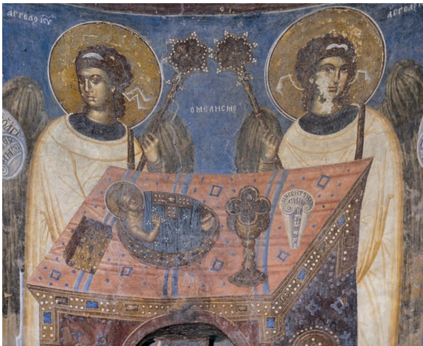
Fig. 301. Treska, Church of St. Andrew, the Officiating Bishops, detail

includes the frescoes in the katholikon (between 1365 and 1377). 21