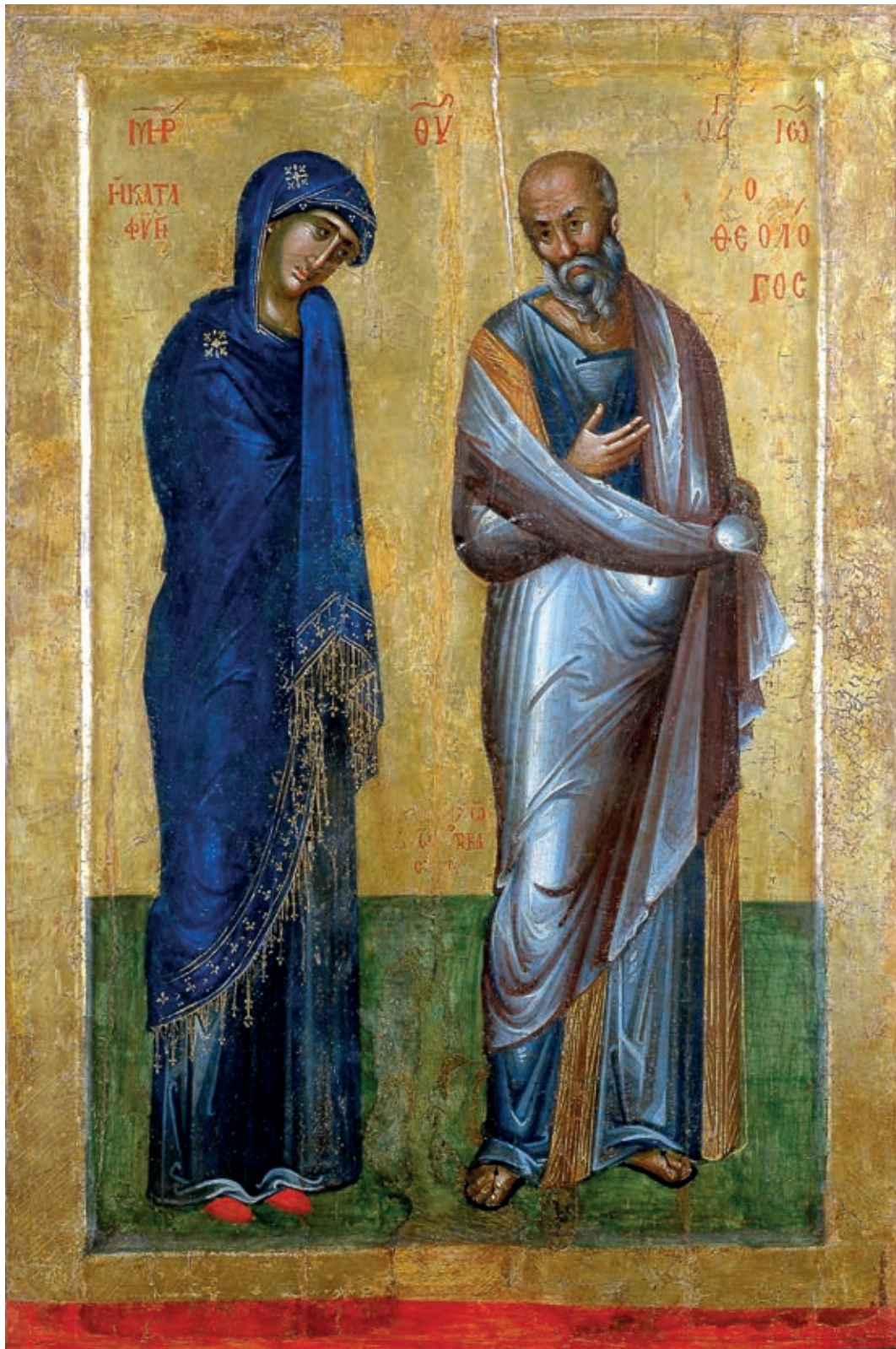
Fig. 304. Double-sided icon from Poganovo monastery, Mother of God Kataphyge with St. John the Theologian, NIAM - BAS