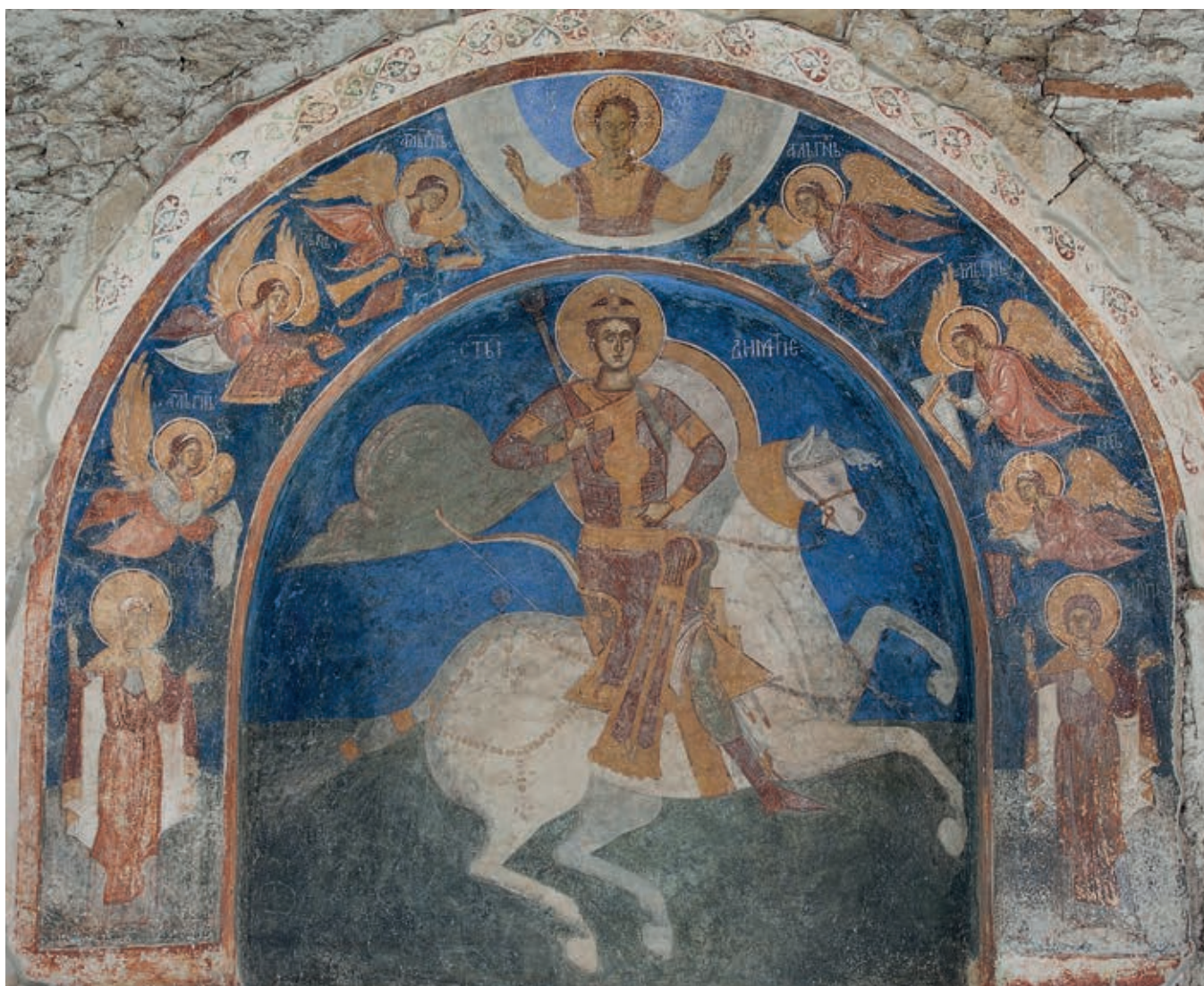
Fig. 300. Marko's Monastery, Church of St. Demetrios, lunette of western portal, St. Demetrios

the patronage of Archbishop of Ohrid Grigorije II (the side chapels and the façade of the Mother of God Peribleptos, The Holy Mother of God Hospital, Peštani, St. George in Rečica, the St. Clement monastery). 19 It has long since been pointed out in scholarly circles that the extraordinarily expressive power of the leading artist among them sets him apart as one of the best painters in the second half of the 14 th century. The painters from a second workshop, on the outskirts of Skopje, matched their work, based on the more conservative