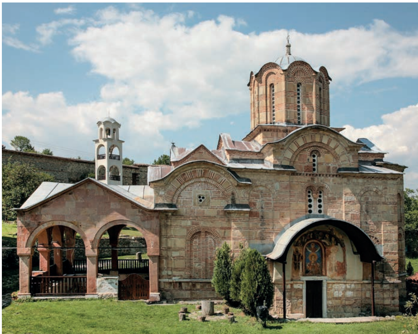
Fig. 298. Marko's Monastery (Markov manastir), Church of St. Demetrios

Novak had an older church on Lake Prespa's Mali Grad island, dedicated to the Mother of God (built as long ago as 1344/45), restored and re-decorated with a new layer of frescoes. 11 The recently torn down Church of St. George in Rečani, outside Prizren, where an unknown Serbian voivoda was buried circa 1370, 12 is testimony to the ktetorial endeavours of the nobility in the Kosovo and Metohija area, which were ruled by Vukašin Mrnjavčević.