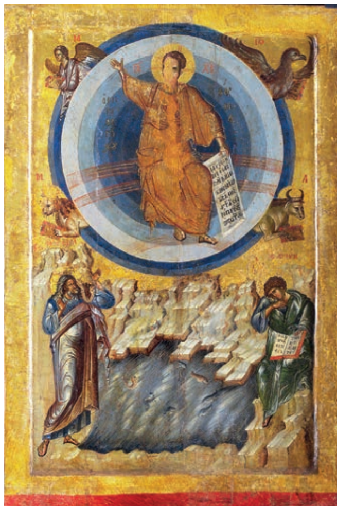
Fig. 305. Double-sided icon from Poganovo monastery, Miracle in Latomos, NIAM - BAS

Serbian Church. It could have been secured through the bishops, that is, the bishoprics on the Mrnjavčević territory subordinate to Peć (the Debar, Donji Polog bishoprics and the Skopje Metropolitanate). Although this relationship cannot be fully clarified due to the lack of sources, one should not lose sight of the fact that, in post-Nemanjić Serbia, the Serbian Church officially did not give its full support to Lazar until the time of Patriarch Spiridon (1380).