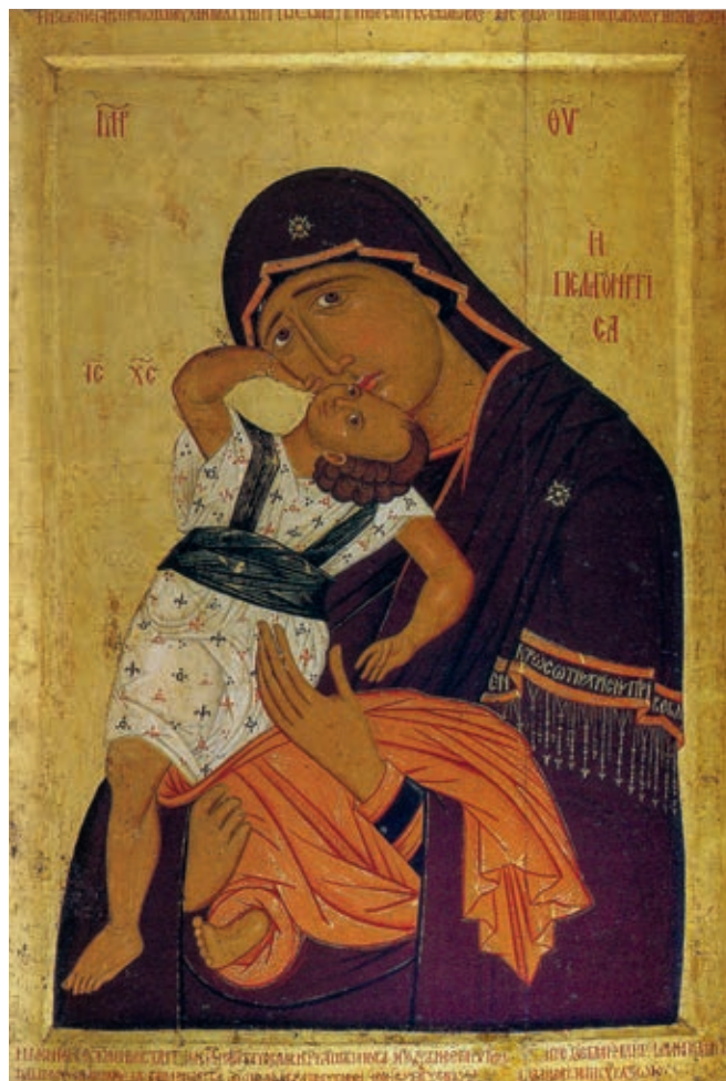
Fig. 307. Icon of Mother of God of Pelagonia, work of the painter Makarije the Hieromonk, Zrze monastery

painting in the second half of the 14 th century in churches in the Skopje, Ohrid, Prilep and Kostur areas, and the Ohrid and Prespa lake-basin, serve as proof. 36 Thus, one of the favourite hagiographic compositions, the Heavenly Court, is found prior to Marko's Monastery in Zaum, on the façade of the western porch of the Mother of God Peribleptos in Ohrid, in Treskavac, and immediately after in the Church of St. Athanasios in Kostur and in the Šiševo monastery. 37 A special iconographic variant of the Deesis, the image of Christ and the Mother of God