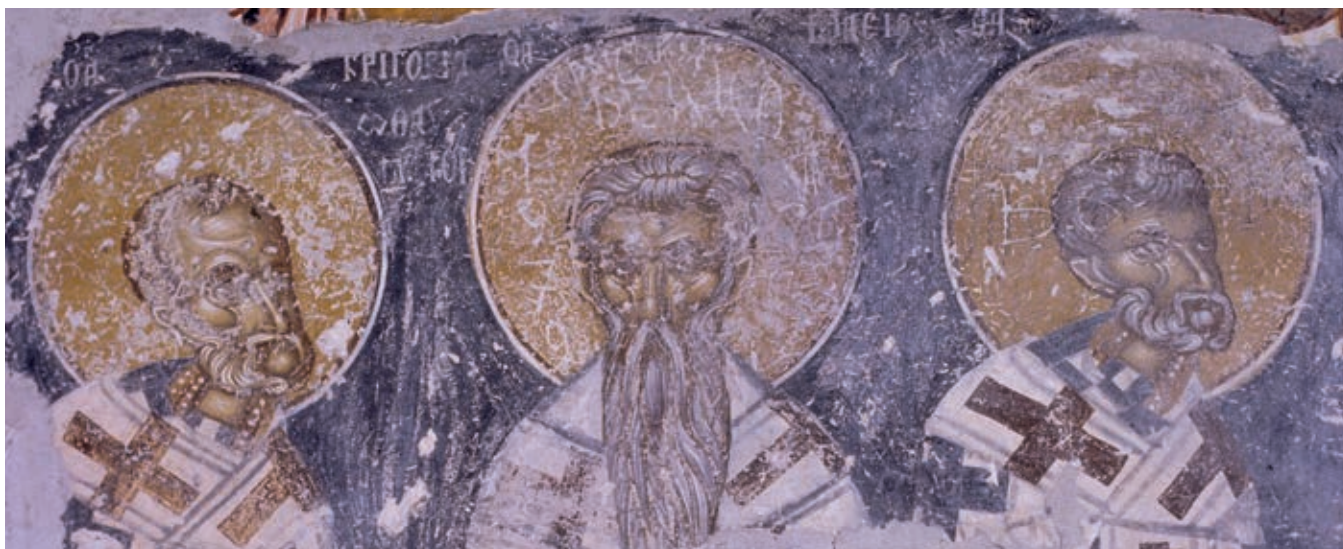
Fig. 303. St. Nicholas of Šiševo, altar, Holy bishops