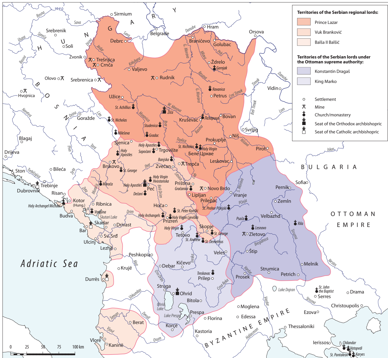
Fig. 308. Serbia in the time of the regional lords, c. 1385

in their youth, during the building and painting of the narthex of the family endowment in the Zrze monastery. 39 Along with the idea of emphasising the figure of Christ the Priest, there was a desire to express certain moments of the Holy Eucharist in pictures (Psača,