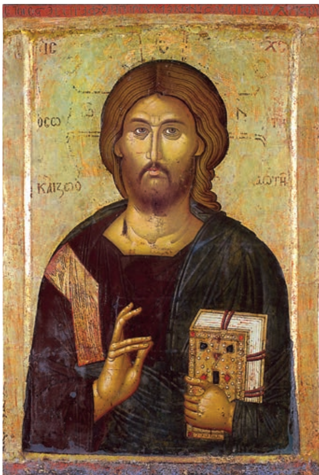
Fig. 306. Icon of Christ the Saviour and Life-Giver, work of the painter Jovan the Metropolitan, Zrze monastery