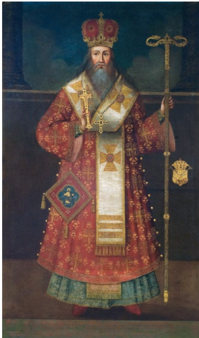
Сл. 20. Јов Василијевич, Патријарх Арсеније III Црнојевић, 1744. (МСПЦ, Двор Патријаршије)

Током аустријско-турског рата 1737–1739. године у Хабзбуршку монархију пребегао је и српски патријарх Арсеније Јовановић (1724–1748). Започело је постепено одумирање Српске патријаршије, која је одлуком турских власти 1766. године и укинута. После више векова страдања и сеоба средиште српског етничког простора, српске културе и идентитета трајно је измештено из своје колевке.