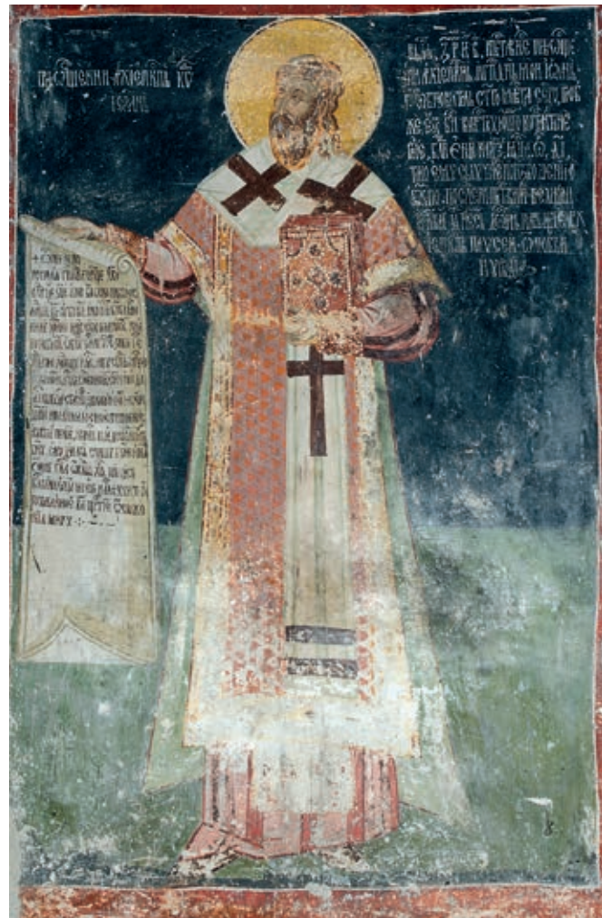
Сл. 16. Пећка патријаршија, црква Светих апостола, ПАТРИЈАРХ ЈОВАН, РАД СЛИКАРА ГЕОРГИЈА МИТРОФАНОВИЋА, 1620

немуслимати, имали статус султанових поданика другог реда, такозваних зимија . Према у то време распрострањеном тумачењу једног стиха из Курана , зимије су имале право да живе и стичу имовину у Земљи ислама под условом да у стању очигледне понижености исламској заједници плаћају порез – џизју . 11