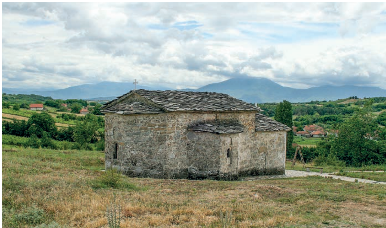
Сл. 15. Велика Хоча, црква Светог Јована

Мораве и Дрине формирана Краљевина Србија, нова држава којом је владао римско-немачки цар Карло VI Хабзбург (1711–1740). Чињеница да се двеста километара северно од Митровице и Приштине налазила српска држава узнемиравала је османске бегове на Косову и Метохији. Ситуација се није битно променила ни после аустријско-турског рата 1737–1739. године, када је Краљевина Србија престала да постоји. У свести српских народних првака она је и даље опстајала као политички идеал и географски појам, а после аустријско-турског рата 1788–1791. године на њеним некадашњим територијама почело је да се формира језгро модерне српске државе. Страх од све извеснијих политичких промена нагонио је Османлије да организованим насељавањем Албанаца и исламизацијом Срба мењају етничку структуру Косова и Метохије. Започети током Рата Свете лиге и интензивирани у другој половини XVIII века, ови процеси су на врхунцу били током XIX столећа, када су Срби