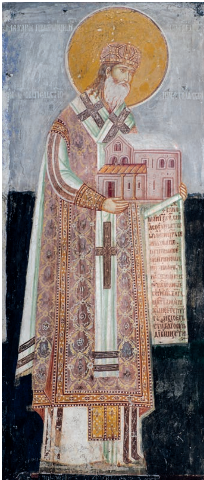
Сл. 13. Пећка патријаршија, припрата, портрет патријарха Макарија Соколовића, 1565