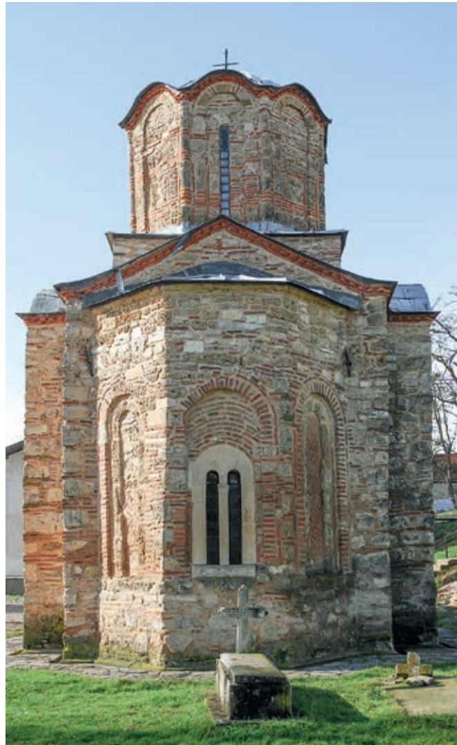
Сл. 14. Будисавци, црква Преображења Господњег, прва половина XIV века, обновљена 1568. године

Демографске прилике у XVIII столећу нису довољно истражене, али се претпоставља да су и после закључења мира у Сремским Карловцима 1699. године Срби били најбројнија етничка заједница на Косову и Метохији. На демографски раст српске популације у послератном периоду неповољно је утицало слабљење централне власти и јачање утицаја неколицине беговских породица албанског порекла. У процесу који је познат под називом чиџлучење бегови су од хришћанских домаћинстава одузимали право на коришћење аграрних земљишта (баштина) и стварали сопствена газдинства (читлуке). На тај начин не само што су осигуравали