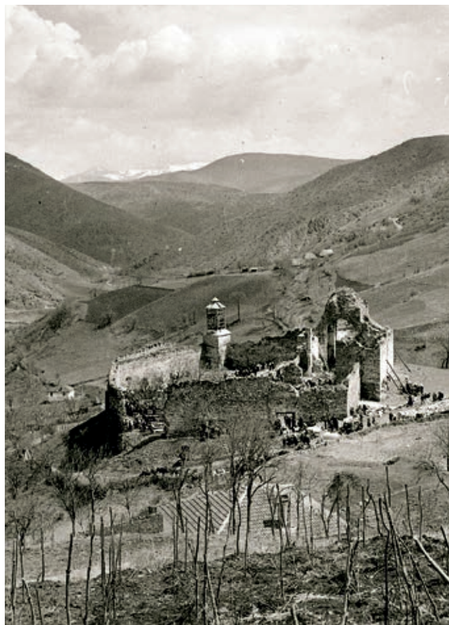
Сл. 18. Манастир Бањска као турска тврђава и џамија

Један од важних аспеката кризе у коју је запало монаштво у Османском царству непосредно се дотичао организације Српске цркве, будући да су црквени обичаји налагали да се старешине за обудовеле епархије траже међу угледним јеромонасима. То, међутим, није била једина сметња којом је османски правни систем ометао рад Српске цркве. Архијереји, који су у средњем веку чинили највиши слој друштвене и културне елите, у Османском царству били су деградирани на статус зимија и раје. Њихова улога у духовном животу православних хришћана третирана је као привредна делатност и формално дефинисана као експлоатација државних добара. Ова добра су у пореским књигама представљена као фискалне јединице мукайџе , које су православним архиепископима издаване у једногодишњи закуп. 14 Из таквог правног тумачења проистекле су две основне новчане обавезе које су православни архиепископи имали према османским пореским властима. Једна