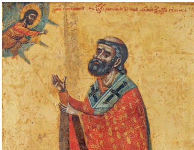
Сл. 19. Зограф Јован, СРПСКИ ПАТРИЈАРХ ПАЈСИЈЕ (1614–1647), 1662/1663, ДЕТАЉ (НАЦИОНАЛНИ МУЗЕЈ У РАВЕНИ)

новобрдски владика Дионисије и рашки владика Силвестар, он је обновио више средњовековних цркава. Посебан значај имала је обнова саборног храма пећког манастира, где је смештено седиште реорганизоване Српске цркве. 16 Реорганизација је у првом реду подразумевала уређивање односа пећког архиепископа с пореским властима, које су укључиле Српску цркву у правни систем као фискалну јединицу под службеним називом Пећка ѱаѿријаршија . Уједно је утврђен износ новчаних обавеза старешина Српске цркве. Од средине XVI до краја XVII века српски патријарси су сваке године државној благајни уплаћивали 100.000 акчи годишњег одсека , а приликом свога ступања на дужност и ступања султана на османски престо још 100.000 акчи пешкеша. Пешкеш су плаћали и православни епископи, који су такође били у обавези да поседују правно важеће берате. Када га је велики везир Рустем-паша (1555–1561) именовоао за ѿаѿријарха Пећи и ѿодручних месѿа , патријарх Макарије је државној благајни предао око 3.350 млетачких дуката или дванаест килограма злата највеће финоће. 17