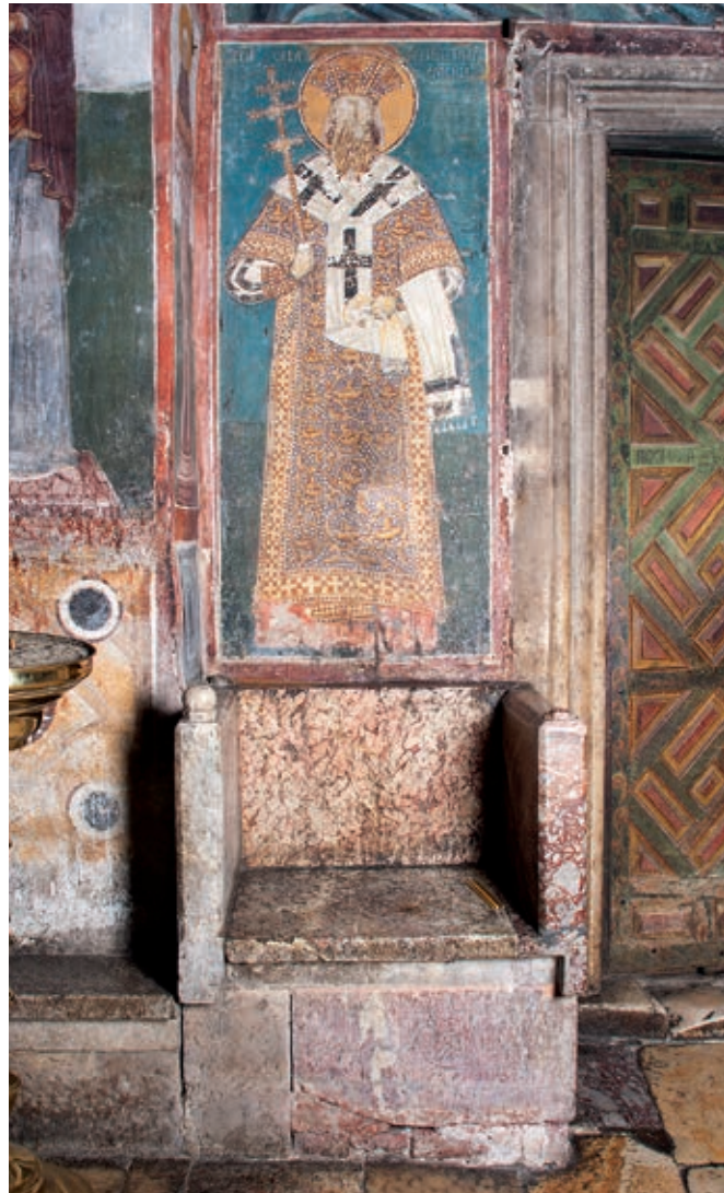
Сл. 2. Пећка патријаршија, припрата, архијерејски престо с представом светог Саве Српског

Ветернице. С византијске стране остале су долина Лепенца до Качаничке клисуре и Биначка Морави. Косово и Метохија и даље су чинили граничну област, али са српске стране. 8