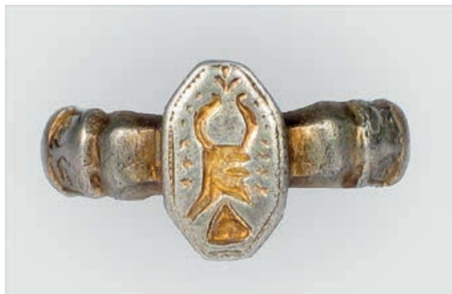
Сл. 12. Ново Брдо, СРЕБРНИ ПРЕСТЕН С ГРБОМ ЛАЗАРЕВИЋА, ПРВА ПОЛОВИНА XV ВЕКА (НМБ)

Притисак Турака с временом се све више одражавао на живот на Косову и Метохији. Показатељ промене околности била је и чињеница да се боравиште владара помера ка северу, у поречје Велике Мораве, где ничу и владарске задужбине. За владарем, природно, ишао је и старешина Српске цркве, па Жича поново добија на значају. Упади и пустошења Турака постају од друге половине треће деценије XV столећа све чешћи, од чега највише страдају властелинства и незаштићени манастири. Једино су још градови представљали сразмерно сигурна уточишта. Прилике су се нагло погоршале после првог пада деспотовине 1439, односно 1441, када је поклекло Ново Брдо. Обнова државе 1444. није била праћена обновом привредног живота у ранијем обиму јер је присуство Турака било такоређи свакодневно. Због несигурности имовине и изгледа за зараду Латини из Приморја све чешће заобилазе рударске насеобине на Косову и Метохији. Косово је још једном било поприште крвавог сукоба Турака и хришћана – године 1448, кад је угарски губернатор Јанко Хуњади једва спасао живу главу. Пошто се султан Мехмед II после освајања Цариграда 1453. окренуо покорвању Српске земље, било је само питање времена када ће се турска најезда обрушити на земљу и градове Косова и Метохије. Као и приликом првог освајања, Ново Брдо је најдуже одолевало, а његовим падом у руке Османлија 1. јуна 1455. Косово и Метохија постали су део Османског царства. 28