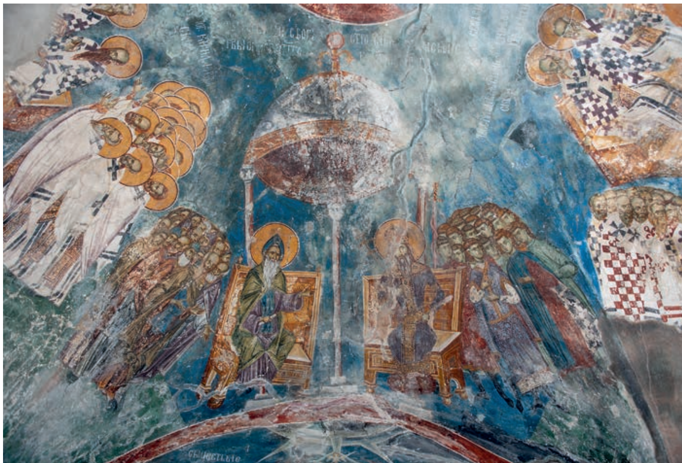
Сл. 5. Пеџка патријаршија, црква Светог Димитрија, Сабор светог Симеона Српског и светог краља Милутина, 1322–1324

краљ Драгутин пружио уточиште, и провале Татара до Призрена и Дрима 1283. године наступило је столетно раздобље мира. 13