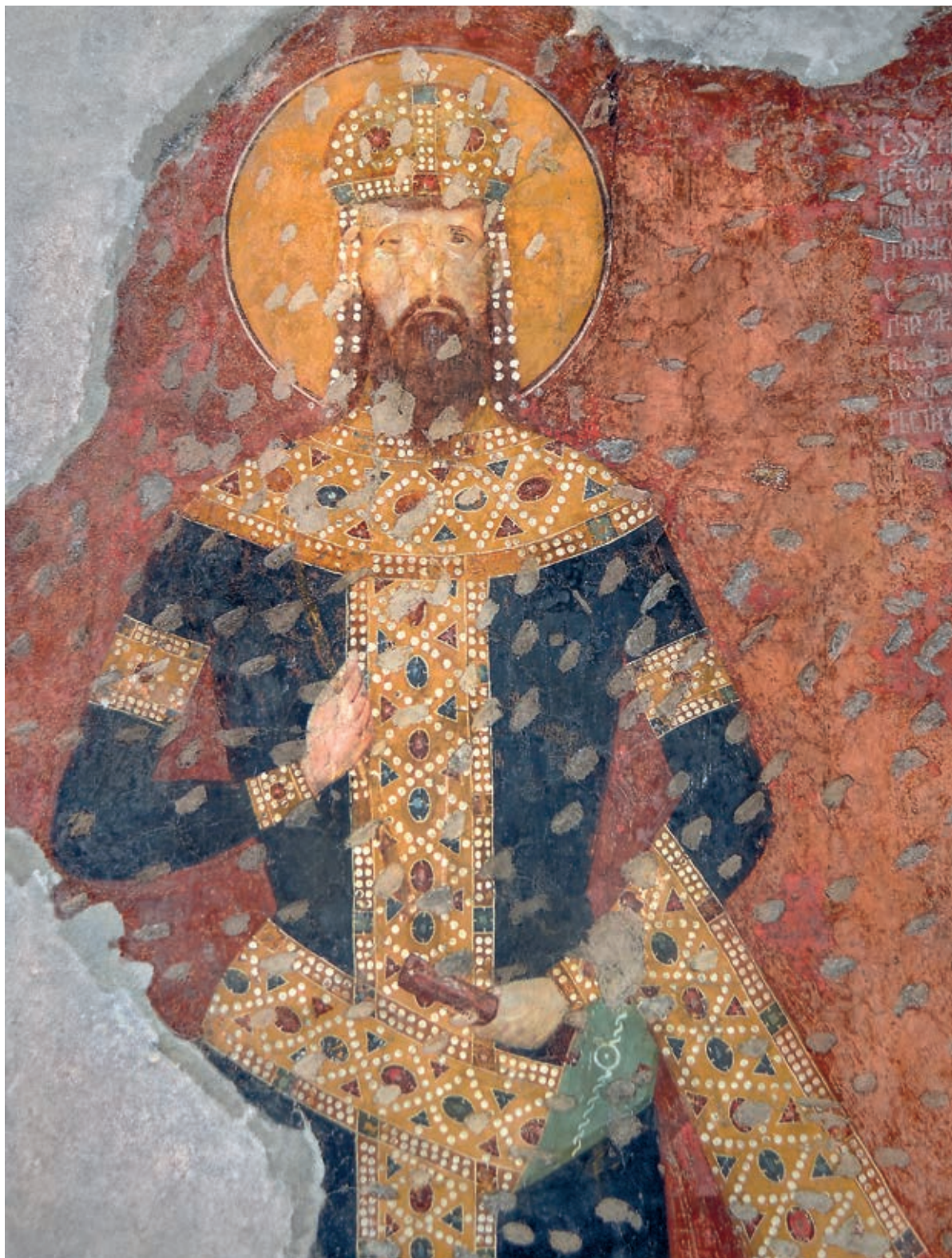
Сл. 3. Призрен, Богородица Љевишка, краљ Стефан Урош II Милутин, 1310–1313