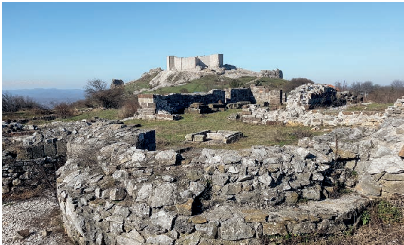
Сл. 11. Ново Брдо, поглед на остатке саборне цркве и цитаделу

пораз збио у политичком, привредном и духовном средишту Српске земље, што Косово и Метохија одиста јесу били током већег дела XIV века. 24