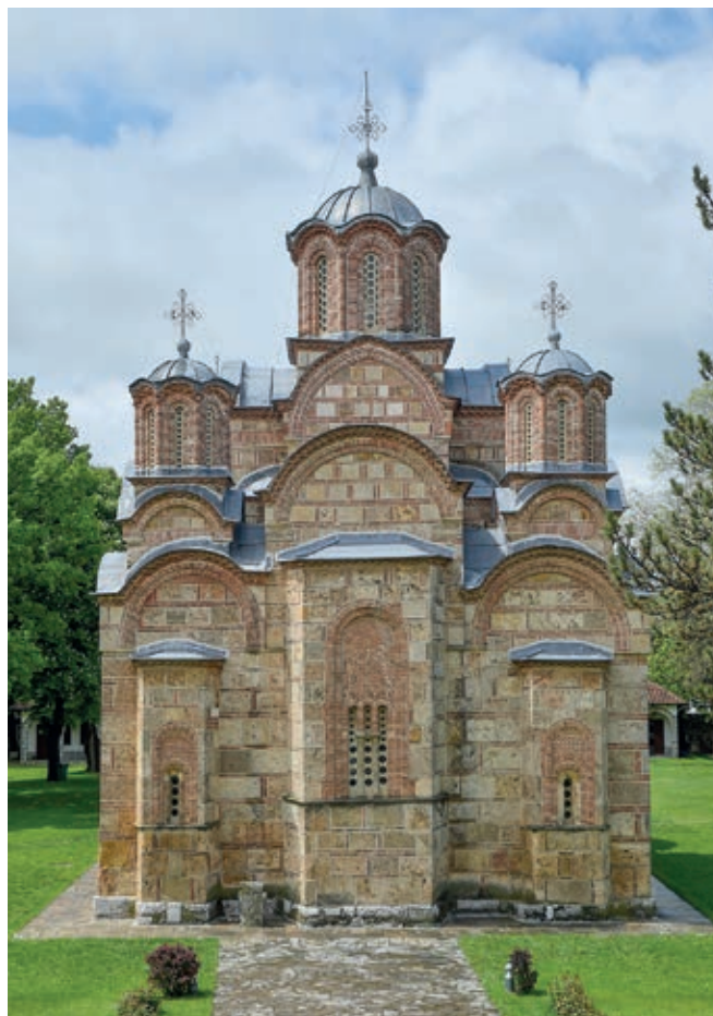
Сл. 4. Манастир Грачаница, католикон

Вести о збивањима на Косову и Метохији и њиховом значају за српску државу веома су оскудне до последње четврти XIII века. Положај уз границу није