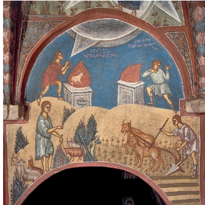
Сл. 6. Дечани, црква Христа Пантократора, наос, Прича о Каину и Авељу

је мошти Јевстатија I, свог претходника на трону Светог Саве, у Пећ, а тада су, по свој прилици, тамо премештене и жичке реликвије. Упоредо с тиме, објављивања моштију и канонизовање архијереја који су били сахрањени у Пећи давали су манастиру одлике „светог места“. Архијереј није само ишао за владаром већ је из разлога безбедности био принуђен да резиденцији у средишту државе да предност. У време архиепископа Никодима и Данила II резиденција у Пећи постала је стално боравиште архиепископа, потом патријараха, мада првосаздана катедрала у Жичи није заборављена. И Никодим и Данило подигли су у пећком манастиру цркве у којима су себи припремили место вечног починка (сл. 68). 17