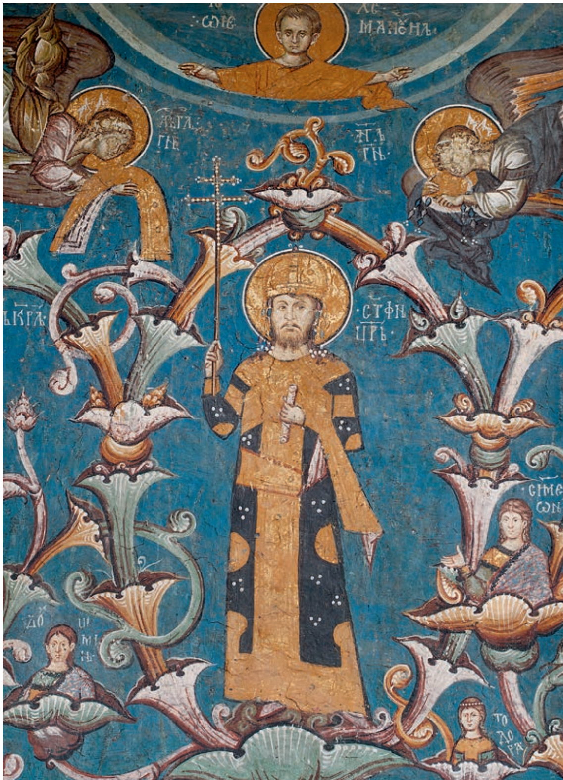
Сл. 9. Манастир Дечани, црква Христа Пантократора, припрата, Лоза Немањића, 1346–1347, детаљ: цар Душан