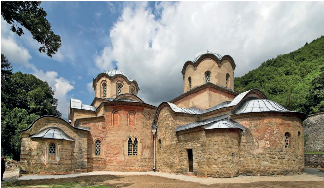
Сл. 1. Пешка патријаршија, цркве Светих апостола и Богородице Одигитрије с параκлисом Светог Николе

византијске војно-управне јединице основане након слома Самуиловог устанка – Бугарске, са седиштем у Скопљу. Северно од ње основана је тема Србија, чију је територију, према садашњем стању извора, немогуће прецизно одредити. И промене у црквеној организацији оставиле су трајан печат на област Косова и Метохије. У границама Охридске архиепископије (Архиепископије Бугарске) основане су и епископије са седиштима у Липљану (античка Ulpiana ) и Призрену (можда античка Theranda ), чиме је дат одлучујући подстицај обнови градског живота и у тим областима. Није познато када је и у ком виду дошло до те обнове. Поменути градови су зацело већ били у функцији као урбана насеља пре 1018. године. Липљан се помиње 1018. као један од градова Самуиловог царства чији су се житељи добровољно покорили цару Василију II. 4 У Призрену је обновљена или