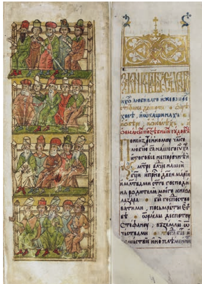
Сл. 10. Препис Новобрдског рударског законика деспота Стефана Лазаревића, око 1580. године

чију су главнину чинили Лазареви и Вукови одреди, збио се на Косову пољу на Видовдан 1389, на територији Вука Бранковића. Неизвестан до самог краја, обележен погидијом кнеза Лазара и султана Мурата и повлачењем турске војске с попришта, бој на Косову изазивао је код савременика и потоњих поколења различите утиске и тумачења. Иако је на хришћанској страни због султанове погидије у први мах слављена као хришћанска победа, битка на Косову је према својим последицама, али и у историјском памћењу, доживљена као пораз. Предање је славило херојски подвиг српске војске и смрт њеног заповедника, а жалило за „Српским царством“, којем је пораз на Косову учинио крај. Таква представа код доцнијих генерација зацело је почивала не само на сазнању о погидији српског владара већ и на чињеници да се