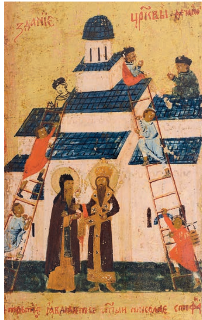
Сл. 8. Житијна икона светог Стефана Дечанског, рад зографа Лонгина, 1577, детаљ: изградња Дечана (МСПЦ)

Услед успона рударства и трговине живнули су и стари градови или никли нови тргови у близини рудника и на путевима промета њихових производа. Привредна и политичка конјунктура изгледа да