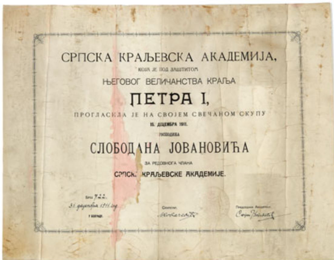
Диплома о проглашењу Слободана Јовановића за редовног члана Српске краљевске академије (15. децембар 1911; 31. децембар 1911) (АКЦДПП)