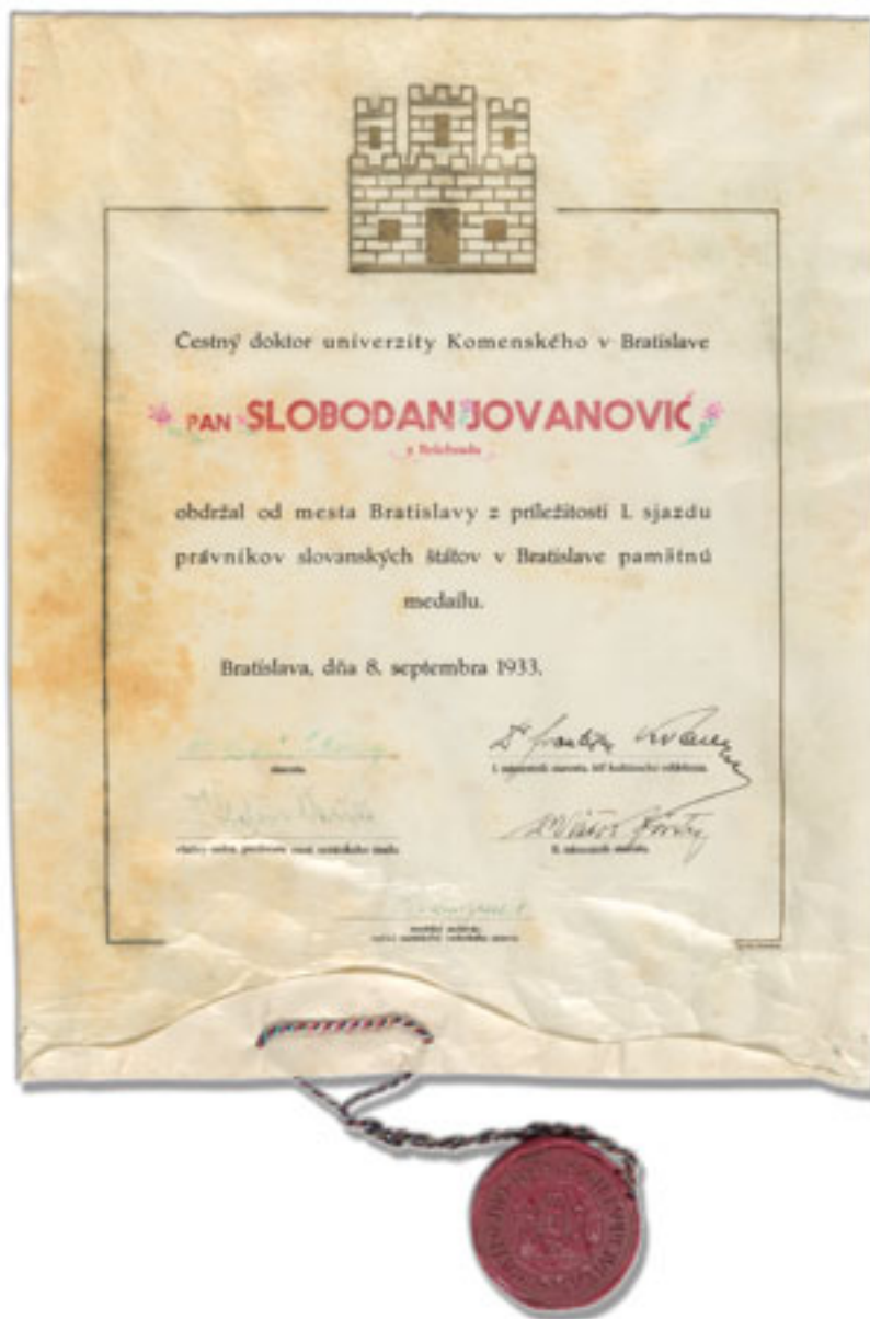
Диплома почасног доктора правних наука Универзитета у Братислави (8. септембар 1933)