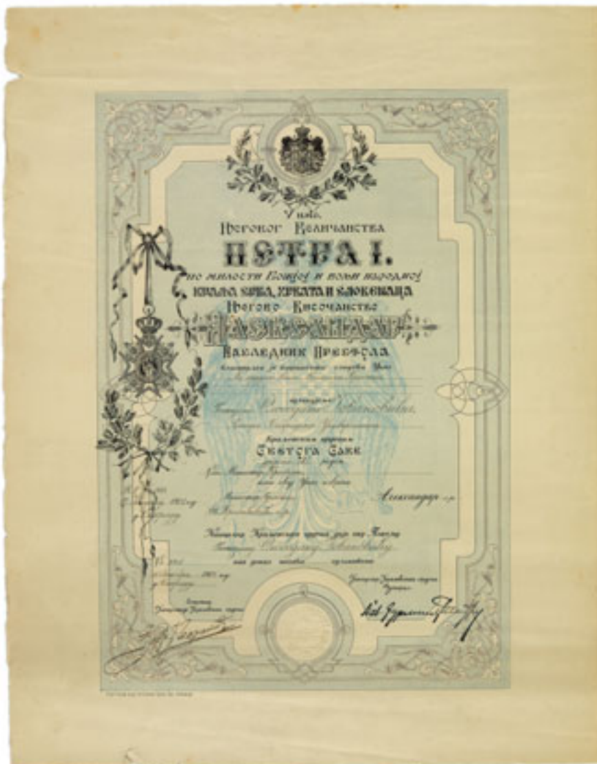
Повеља о указу наследника престола Александра (у име краља Петра I) којим је одликован Слободан Јовановић Краљевским орденом Светог Саве II реда (27. јануар 1921; 11. октобар 1921)