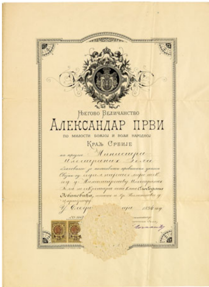
Указ краља Александра I (Обреновића) о постављењу Слободана Јовановића за аташеа Краљевског посланства у Цариграду (1894) (АКЦДПП)*