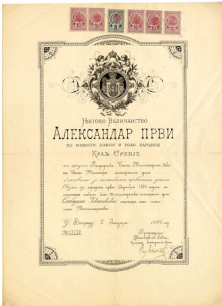
Указ краља Александра I (Обреновића) о постављењу Слободана Јовановића, секретара V класе, за секретара IV класе Министарства иностраних дела (31. децембар 1895; 2. јануар 1896) (АКЦДПП)