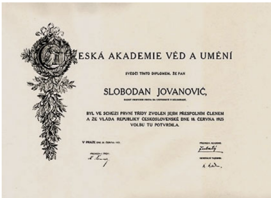
Диплома о иностраном чланству у Чешкој академији наука и уметности (Праг, 29. јун 1925.) (АКЦДПП)