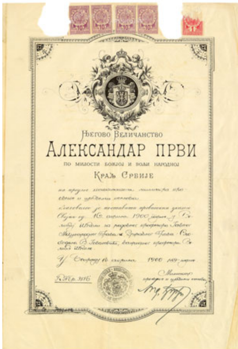
Указ краља Александра I (Обреновића) о постављењу Слободана Јовановића за редовног професора јавног међународног права и државног права (16. април 1900)