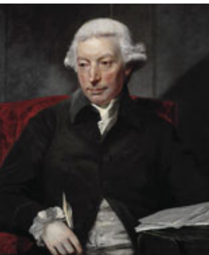
Адам Фергусон (1723–1816), шкотски филозоф и историчар

распарчале: „Војна је мисија [функције] основна, историјски најстарија мисија државе, на коју су се остале мисије тек у току времена накалемиле. Ова констатација могла би бити једна врста посредног доказа, да је држава доиста постала из рата“. 690