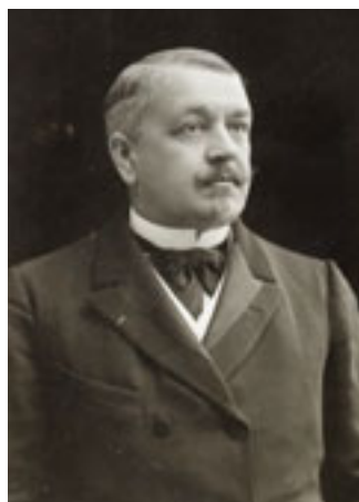
Леон Диги (1859–1926), француски правник, стручњак за јавно право, професор на Универзитету у Бордоу

о коме је говорио Кант. Онима који су примећивали да се од појединца не може захтевати подвргавање каквој било државној власти, него само оној која је рационално организована, Хегел је одговарао да је рационалност државне организације релативно историјски појам. Обухваћена историјским процесом, држава пролази кроз непрестане мене које је воде према све потпунијој рационализацији: с историјског гледишта свако државно уређење које у датом тренутку постоји, самим тим што постоји, јесте за тај тренутак рационално. Идеологија Француске револуције стављала је појединца с његовим правима изнад државе, и у начелима слободе и једнакости имала је апсолутно мерило за променљиве историјске организације државе. Хегел, напротив, стављао је државу изнад појединца као највишу форму његове властите моралности, и за дату државну организацију узимао је да је довољно оправдана тиме што је успела да се оствари у току историјског процеса. Идеалистичка филозофија у тумачењу Хегеловом пружила је метафизичку основу конзервативној политици, која је бранила постојеће стање и приклањала се свршеном чину 714 .