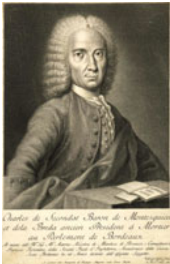
Монтескје (1689–1755), француски филозоф, писац и политички теоретичар