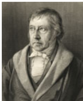
Георг Вилхелм Фридрих Хегел (1770–1831), немачки филозоф

У XIX и првој половини XX века опште учење о држави називало се и наука о држави, учење о држави и опште државно право. Без обзира на назив, повезивало је две области – основне филозофске, правне и политичке поставке, и правна знања о појединим деловима државног живота. У књигама посвећеним држави основне поставке су обично биле филозофски промишљене. Основе општег учења о држави представљају, у ствари, филозофију државе. Јовановић је током студија у иностранству на правним и државним факултетима у Минхену, Цириху и Женеви студирао немачко опште учење о држави. Иако се у вези са Јовановићевом теоријом државе најчешће помиње Јелинекова (Georg Jellinek) теорија, једино се за Блунчлијево учење о држави може рећи да га је Јовановић следио у свом промишљању државе. Због тога Блунчлијева теорија заслужује посебну пажњу. У фуснотама рада „О суверености“ и „О дводомном систему“ Јовановић није навео годину издања Блунчлијевог тротомног дела о модерној држави коју је користио. У овим фуснотама најчешће је упућивао на параграфе и поглавља, а ређе на странице