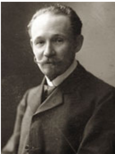
Слободан Јовановић из времена када је био професор Правног факултета у Београду

Књига је била уџбеник за студенте Правног факултета. То, међутим, не умањује њен значај, као што не умањује значај многих капиталних дела која су била уџбеници, скрипта или чак нередиговане студентске белешке са предавања. Довољно је сетити се Аристотелове Меџафизике (μετὰ τὰ φυσικά) и Хегелових (Georg Wilhelm Friedrich Hegel) предавања. Јовановићево дело далеко надмашује уџбенике који су писани само да задовоље педагошке потребе високошколске наставе. Садржају његове књиге највише одговара наслов Држава из 1936. године јер је од првог издања била реч о општем учењу о држави, целовитој студији о држави, која представља једну од најстаријих тема филозофских, правних и политичких теорија. Јовановић је разматрао општи појам државе, теорију настанка државе, различите филозофске теорије о држави и друштву, појам државне суверености, однос државе и права, правну државу и самоограничење државе поделом власти и дводомним парламентарним системом.