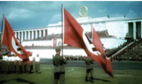
Јовановић је критички анализирао европске тоталитарне системе, комунистички у Совјетском Савезу, национал-социјалистички у Немачкој и фашистички у Италији.

Кад је излагао теорију постанка државе, Јовановић је имао у виду најопштији појам државе. У уводу у