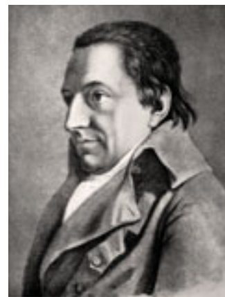
Јохан Готлиб Фихте (1762–1814), немачки филозоф

Почевши од Фихтеовог (Johann Gottlieb Fichte) учења, Хегелове филозофије права и разматрања појма умног права (Vernunftrecht), 660 преко општег учења о држави (allgemeine Staatslehre), 661 до теорије државног права (Staatsrechtslehre), изучавање појма државе заснивало се на филозофској традицији у којој је промишљање државе било предмет политике као практичне филозофије (ἐπιστήμη πρακτική). 662 Позната је Кантова (Immanuel