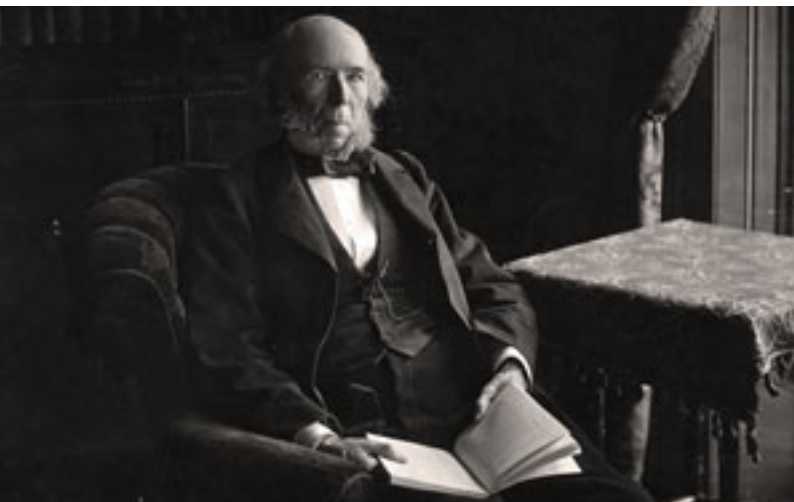
Херберт Спенсер (1820–1903) енглески филозоф, биолог, социолог и политички теоретичар