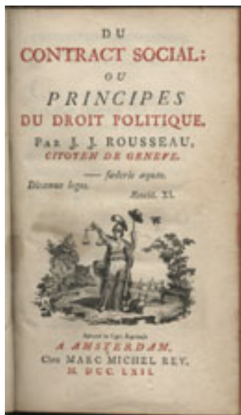
Жан Жак Русо, Друштвени уговор , издање из 1762. године