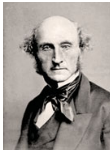
Џон Стјуарт Мил (1806–1873), британски филозоф

За Јовановића су право и држава нераздвојиви јер право прожима цео државни систем. За разлику од морала, право је скуп правила друштвеног живота која се морају извршавати. Да би правила друштвеног живота имала правни карактер, први је услов да се организује виши ауторитет који гарантује њихово спровођење. Ако право не може да постоји без државне власти, онда је „јасно да су немогућа и та природна права која би имала да постоје пре постанка државе и организовања њене власти“: „Природна права била би управо contradictio in adjecto “. 718 Другим речима, пошто појединци пре постанка државе нису могли имати никаква права, њихови акти нису могли имати правни значај. У предржавном