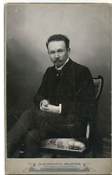
Слободан Јовановић

Према индивидуалистичкој теорији, циљ друштвених промена је напредак. Напредак је, међутим, људски појам: „У природи се не може уочити никаква тежња према напретку. Природно одабирање постоји, истина, али оно је срачунато само на то да се постигне извесна сагласност између материјалне средине и оних организама који у њој живе“. 736 Јовановић наглашава да је способност прилагођавања релативна способност која може, али не мора да буде показатељ савршенства оних који је поседују: „Сасвим је могуће да је извесна материјална средина таква да се њој могу прилагодити само несавршенији организми; на пример у северном појасу могу опстати само несавршенији биљни организми“. 737 Из закона природног одабирања се може извести закључак да спољашња природа