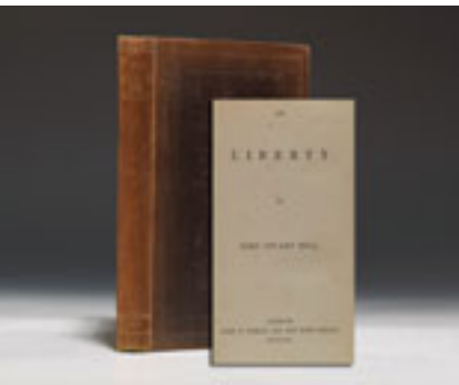
Прво издање књиге О слободи ( On Liberty ) Џона Стјуарта Мила из 1859. године

државе није схватао као скуп свих правила које држава прописује, већ само оних која регулишу односе између појединаца. Као и свака употреба силе, тако и државна принуда може бити оправдана само онда када треба спречити нечије насиље. Држава има право да брани поданике једне од других али не и појединца од њега самог, јер се ту њена сила сукобљава са слободним уверењем које је неприкосновено. Мил је сматрао да је спречавање повреде других појединаца једини принцип који треба апсолутно да влада свим поступцима друштва према појединцу: „Једина сврха ради које власт може с правом да се користи против воље било кога члана једне цивилизоване заједнице, јесте да спречи повреде других“. 730 Никога, међутим, не треба присиљавати да ради оно што би по туђем мишљењу за њега лично било добро. Према Милу, индивидуа одговара пред друштвом само за оно што уради другоме, а не и за оно што уради себи самом, јер над собом има неограничено право самоуправљања, пошто је она сама господар свога духа и тела.