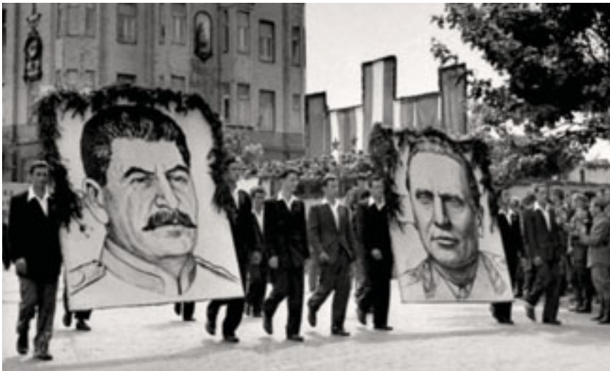
Првوماјска парада 1946. године

што ће рећи свемоћном. Уздајући се у једну тако случајну ствар као што је генијалност једног диктатора, или наслањајући се на једну тако хипотетичну ствар као што је Марксова социјална теорија, тоталитаризам је потпуно уништио личну слободу, огласио своје вође за свемоћне, а своје доктрине за непогрешиве“. 767 Јовановићев начин ограничавања државне свемоћи у парламентарном систему заснива се на самоограничавању неограничене власти законодавног тела, преко његове поделе.