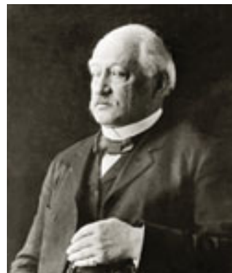
Пол Лабанд (1838–1918), немачки правник, професор права на Универзитету у Кенингсбергу и Стразбуру, стручњак за уставно право

књига. Драгоцен критички преглед немачке, француске, енглеске и америчке литературе о држави дао је у предговору своје књиге о држави, написаном априла 1906. године.