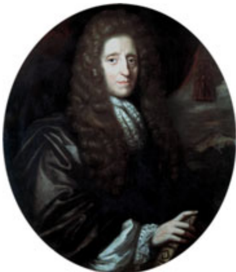
Џон Лок (1632–1704)

стању, сваки уговор је био лишен обавезности, пошто обвезна снага уговора не долази од појединаца који га закључују, већ од државе која гарантује његово извршење.