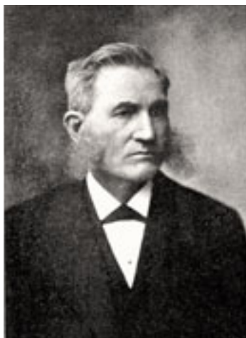
Лестер Ворд (1841–1913), амерички ботаничар, палеонтолог и социолог, први председник Америчког социолошког друштва