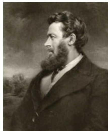
Валтер Беџет (1826–1877), писац, аутор Енлјеске усћавности , утицао на политичка схватања на Балкану