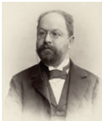
Георг Јелинек (1851–1911), доцент за филозофију права и професор државног права у Бечу и општег државног права у Хајделбергу