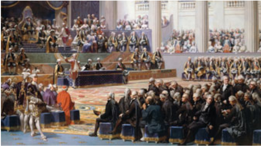
Скупштина сталежа, 5. маја 1789. године

први сталеж – свештенство и други сталеж – племство. Пошто је „племство крвнички мрзео“, Сјејес је сузио појам француског народа, свдећи га, у ствари, на један његов део који је назван нацијом. Јовановићу је, међутим, ближе Мирабоово (Honoré Gabriel Riqueti, comte de Mirabeau) схватање народа од Сјејесовог. Мирабо је покушао да избегне термин „нација“ (nation), предлажући да се скупштина не назове Националном скупштином (Assemblée nationale), већ „Представници француског народа“ (Représentants du peuple français), што се могло односити и на целину (народ) и на део народа (пук, масу): „Ово име ‘Народна скупштина’ Мирабо је сматрао као велику погрешку [јер] говорећи у име целог народа, трећи ред [сталеж] допуштао је себи ствари на које раније није смео ни да помисли“. 756 Према Јовановићу, народ, нација, народност, без обзира на назив, представља скуп свих држављана, односно цео народ који је организован у држави. Под народом Јовановић је подразумевао јединствену целину састављену од различитих „друштвених редова“. Говорио је – „народ, то смо сви“ ми. 757 Исто важи и за државу – „то смо сви“ ми.