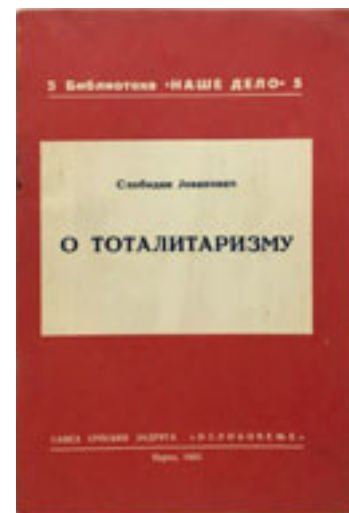
Слободан Јовановић, О тоталитаризму , Париз, 1952.

Јовановић је након Другог светског рата, у раду О тоталитаризму објављеном у Паризу 1952. године поново разматрао питање суверености. Закључио је да је тоталитаризам извитоперио идеју суверености: „У доба стварања суверених држава, сувереност је означавала њихову независност од сваке друге власти, независност како од папе, тако и од Свете Римске Царевине, која је као и папа потраживала неку врсту врховног надзора над хришћанским државама. Независна држава имала је без сумње могућности да сама своју надлежност одређује и у томе смислу била је свенадлежна. У пракси, она није своју надлежност преко мере ширила. Демократија, бар у прво време, гледала је шта више да државну надлежност сузи. Тек тоталитаризам је покушао да државу доиста начини свенадлежном,