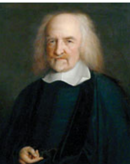
Томас Хобс (1588–1679), филозоф, представник британског емпиризма