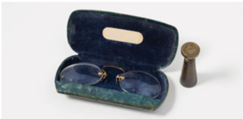
Наочаре и печат за писма Слободана Јовановића (АСАНУ, ЗСЈ, 14891/179, 180,)

већу способност прилагођавања одређеној друштвеној средини не морају заиста бити и бољи друштвени елементи: „Постоје и такве друштвене средине у којима успевају гори друштвени елементи, а не бољи“. 745 Као пример Јовановић наводи Исуса Христа и његове следбенике који су били избачени из оновременог друштва. Упућује на аналогију природе и друштва. Спољна природа прилагођује организме према себи, као што и друштво прилагођује појединце према једном општем калупу, који може бити и добар и лош: „Они који се такмиче за што бољи положај у друштву, неминовно се спуштају на општи друштвени ниво и зато је њихова утакмица пре конзервативна него револуционарна снага у друштвеном развоју“. 746 Због тога, закључује Јовановић, та врста утакмице не може да изазове никакве друштвене промене.