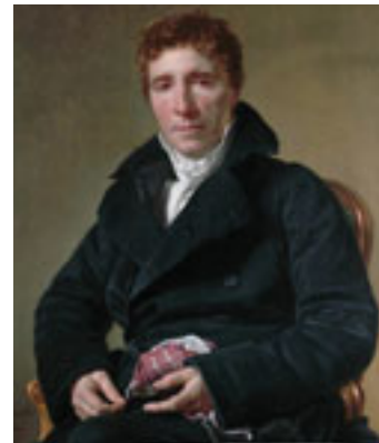
Емануел Жозеф Сјејес (1748–1836), један од најзначајнијих теоретичара Француске револуције