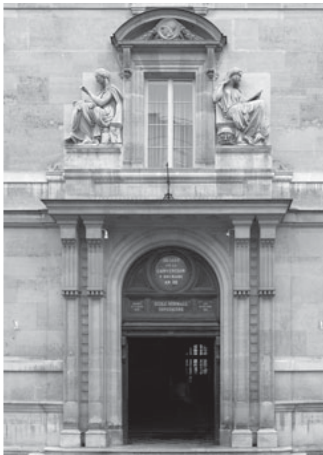
Висока редовна школа (l'École normale supérieure), Париз