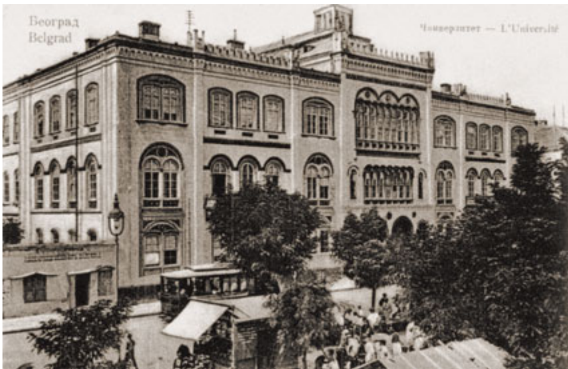
Велика школа (Универзитет у Београду) 1907.