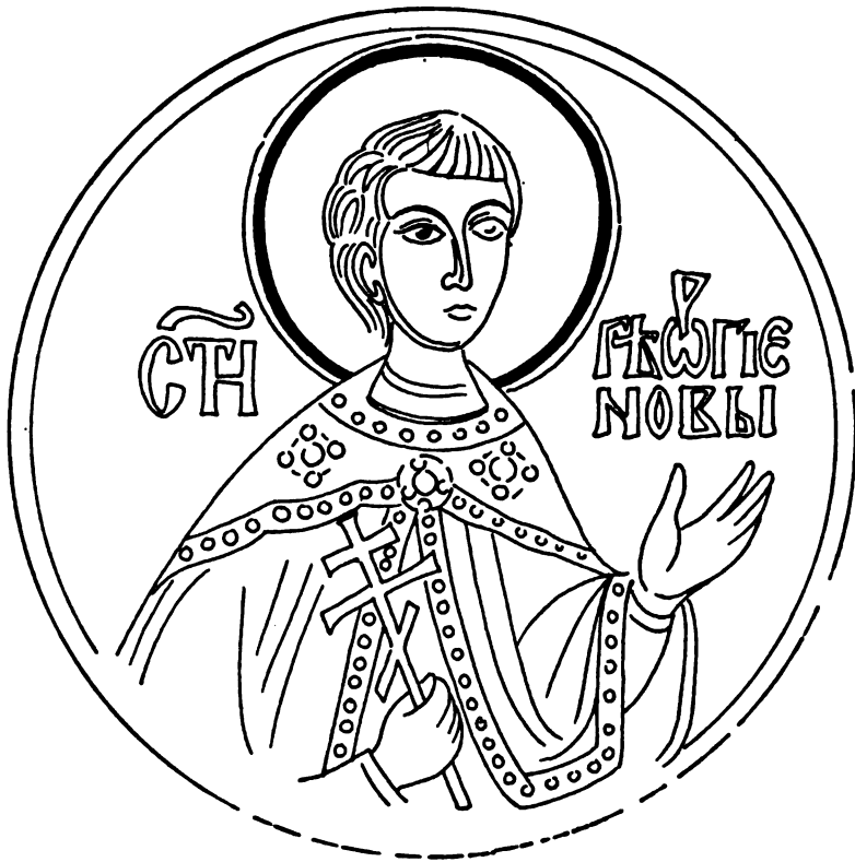
Свети Георгије Нови, црква св. Ђорђа у Темској, наос, 1576. (цртеж Д. Тодоровића)

крстом мученика у десној руци, сличан је другим светитељским фигурама: носи пространу црвену горњу хаљину са широким рукавима, испод које се само око врата опажа део доње, беле боје, док рамена и предњу страну прекрива једноставна декоративна мрежа правих линија са великом атрафом на средини. 68 Костим је, види се, био уобичајен и сродан осталим у цркви, па једино издужено младо лице и тамна капа од крзна, купастог облика — опет са назначеном троугаоном површином у доњем делу, овде нешто већом — представља трајне црте приказа кратовског светитеља. 69 Капа на његовој глави