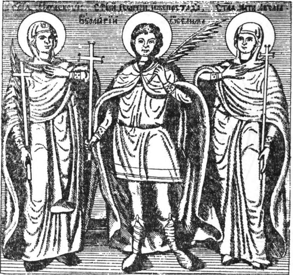
Света Петка, свети Георгије „који пострада у Бугарској од Селима“ и мајка Ангелина Бранковић, Стематографија Христофора Жефаровића,

ликови словенских светитеља, у Стематографији Христофора Жефаровића из 1741, 71 у барокној одећи, иако изведени са познавањем одређених узора, већ су напустили традицију. 72 Жефаровић очевидно није имао у рукама спис свештеника Пеје који је пружао основу за другачије приказивање његових црта. Састав софијског књижевника, уосталом, остао је непознат чак и образованим црквеним личностима све до XIX века. 73