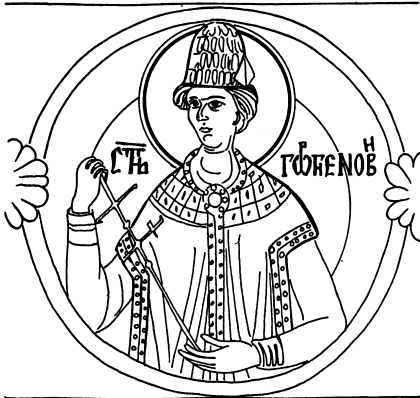
Свети Георгије Нови, црква св. Јована Претече у Јашуљи, припрата, средина XVII века (цртеж Д. Тодоровића)

сликана је у том смислу и знатно касније, на пример 1632. или 1635. у Благовештењу Кабларском, где је била различита од других, ниског округлог облика — дакле, не као шубара, али са троугаоним пољем у виду исечка на предњој страни, истакнутијим него на другим примерима.