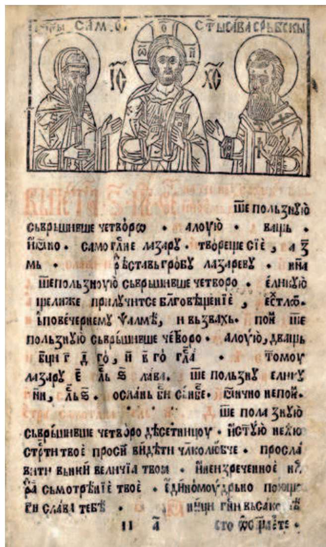
Fig. 400. Deesis with Saint Simeon and Saint Sava, Pentekostarion, edition of Mrkšina Crkva, NLS, И 49

Drawing on the manuscript tradition is also a feature of the graphic decoration in the first two Mileševa publications, the Psalter with Appendices (1544) and Euchologion (1546), which is reduced to a small number of simple headpieces and initials, whereas the decoration of the Psalter with Appendices from 1557 is of a totally different character, as most of the initials were unskillfully copied from the Cetinje Psalter. 42