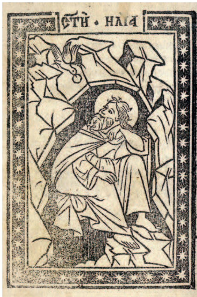
Fig. 397. Saint Elijah in the Cave, Miscellany of Jakov of Kamena Reka, NLS, И 98

formulae, which were thereafter used only sporadically, such as the Imago pietatis in Vićenco's Octoechos , Mode 5–8 reprinted around 1560, 28 should probably be sought in the new historical circumstances and changes in the spiritual and cultural climate. In the ethnic Serb territories, this was marked by the restoration of the Patriarchate of Peć in 1557, whose priests tried to preclude the spread of Roman Catholic influences. 29