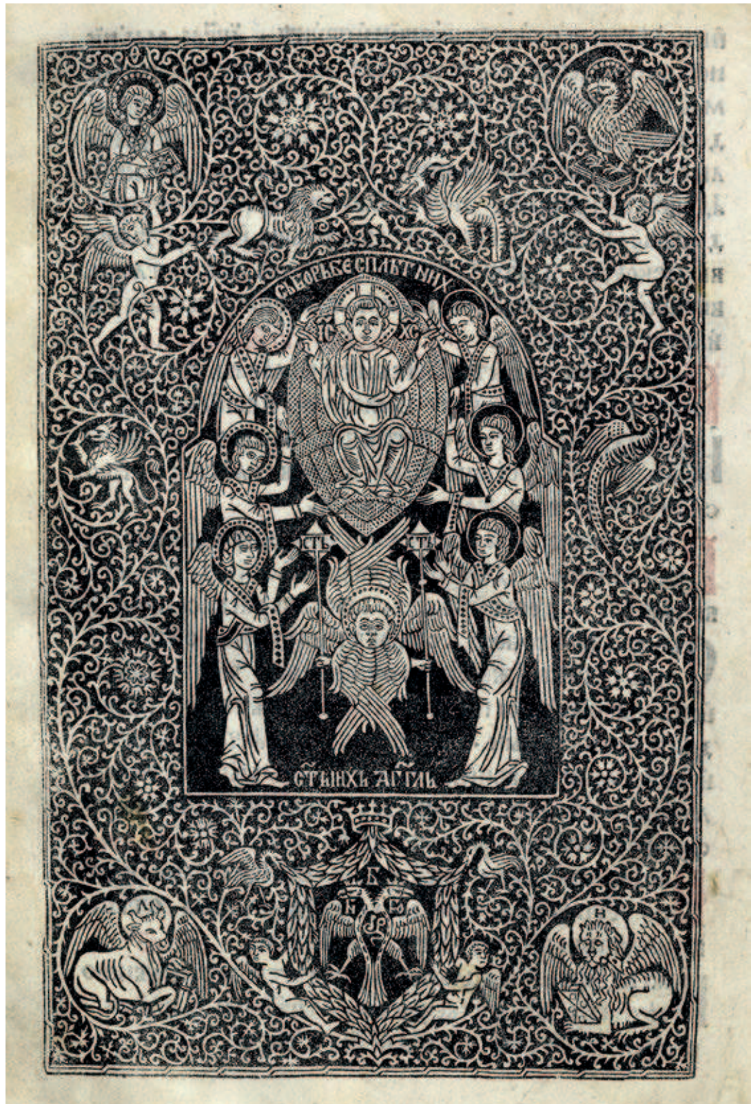
Fig. 393. Synaxis of Incorporeal Angels, Octoechos , Mode 5–8, edition of Đurađ Crnojević, Dečani monastery, Dečani 156