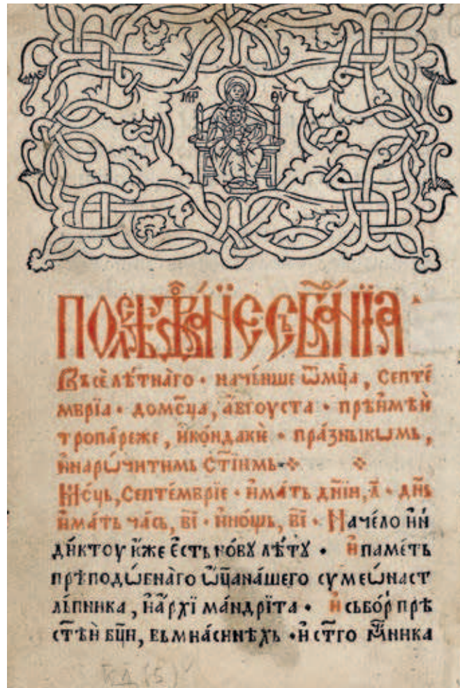
Fig. 398. Headpiece with Mother of God Enthroned, Psalter with appendices, edition of Božidar Goraždanin, NLS, И 83

Unlike the Rujno Tetraevangelion , printed in 1537, where, with the exception of initials and headpieces, there are