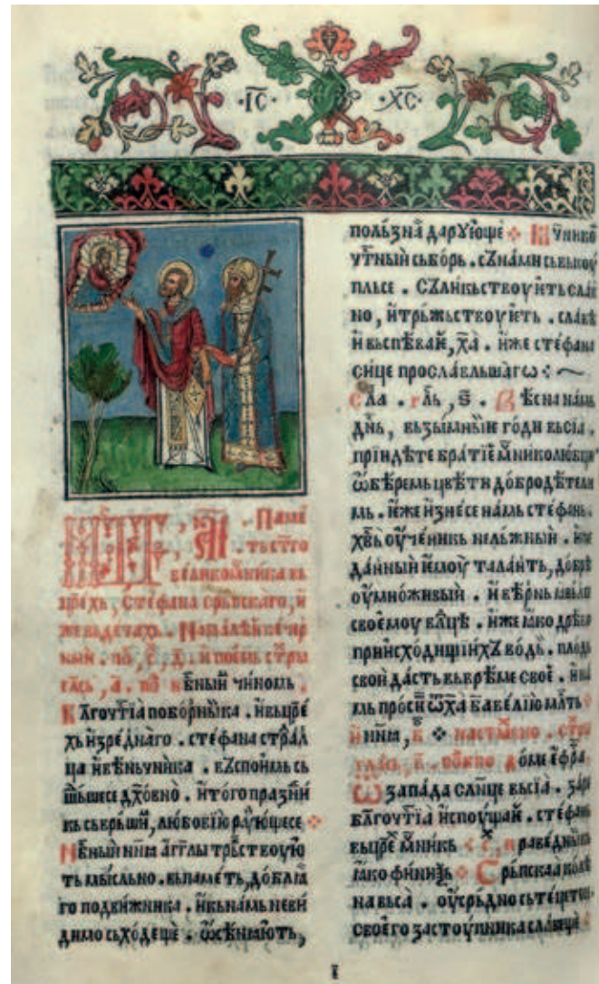
Fig. 395. Saint Nicholas Leading Stefan of Dečani to Christ, Festal Menaion, edition of Božidar Vuković, CBL, W 149

Vićenco's second publication, the Prayer Book (Miscellany for Travellers), is totally dominated by West European iconographic patterns. Their inclusion was largely due to the nature of the content and purpose of the edition, largely published for the needs of a broader range of believers. 25 Here, too, is a printed frame around the text, stamped with four rectangular woodcut blocks. Engraved on the top and lateral blocks are stylised floral and geometric aniconic motifs with inserted figural representations of angels, putti, prophets and other figural depictions borrowed from the inventory of graphic decoration of contemporaneous Renaissance books. However, this edition is primarily recognisable by the illustrations stamped at the bottoms of the pages showing events from the life of the Mother of God, Christ's childhood and passion, produced following West European iconographic formulae (fig. 396). Their literary model was the religious-didactic text Meditationes vitae Christi , 26 which, as a devotional text, was hugely popular with Roman Catholics in late medieval and early modern times. In addition to these figural representations, also particularly outstanding are the two vignettes depicting The Holy