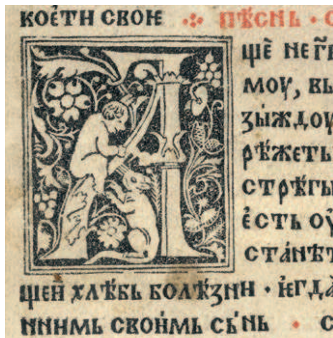
Fig. 392. Initial of letter 'A', Psalter with appendices, edition of Đurađ Crnojević, NLS, II 41

to Hades and the Three Hymnographers. 7 Particularly interesting is an illustration with engraved depictions of the three hymnographers in the foreground, whereas the first church of the Cetinje monastery is most probably depicted in the background. 8 Unlike the central compositions, which, with the exception of a few details, largely adhere to the iconographic formulae of Eastern Christianity, the sumptuous border is almost completely executed in the spirit of Renaissance visual poetics. It is composed of densely entwined and stylised vine branches with flowers, with winged putti and real and fantastical animals framed by vine tendrils, whilst the symbols of the four evangelists are depicted in the corners. 9