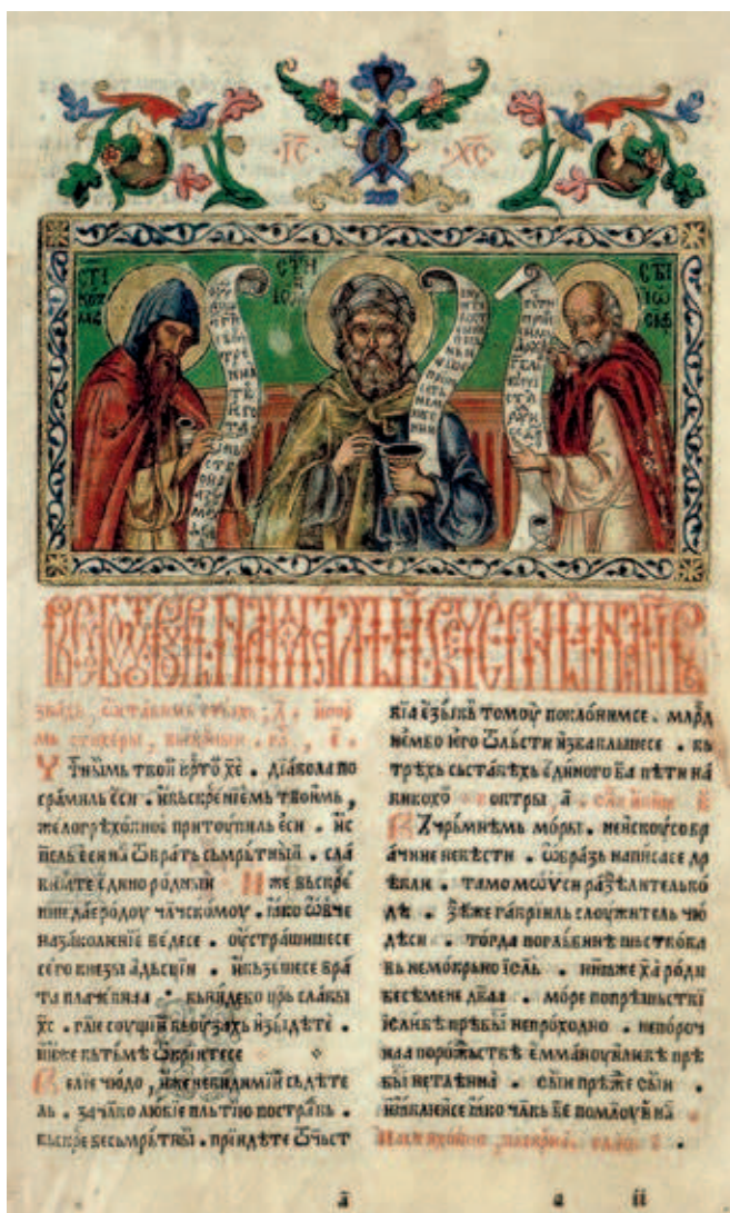
Fig. 394. Three Melodists, Octoechos, Mode 5–8, edition of Božidar Vuković, Krka monastery

ordered a large number of woodcut blocks, which, with a few negligible thematic and iconographic exceptions, follow the artistic tradition of Eastern Christianity. Engraved in them, besides a number of scenes from the Cycle of the Great Feasts, 13 are waist-length portraits of the most prominent saints of the Christian Church, which, apart from their illustrative and didactic functions, also served a role in praying. After a reprint in 1536, four of the woodcut blocks were also used for the Octoechos,