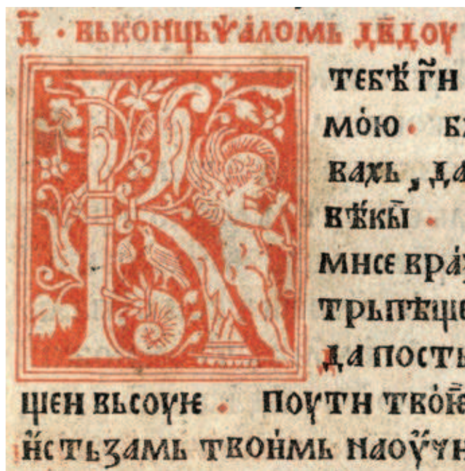
Fig. 391. Initial of letter 'K', Psalter with appendices, edition of Đurađ Crnojević, NLS, II 41