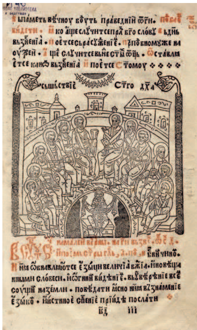
Fig. 399. Descent of the Holy Spirit on the Apostles, Pentekostarion, edition of Mrkšina Crkva, NLS, И 49