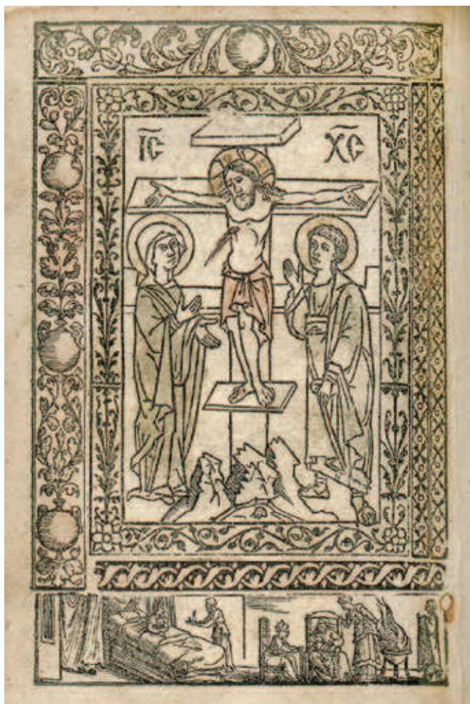
Fig. 396. Crucifixion, Prayer Book (Miscellany for Travellers), edition of Vićenco Vuković, RSL