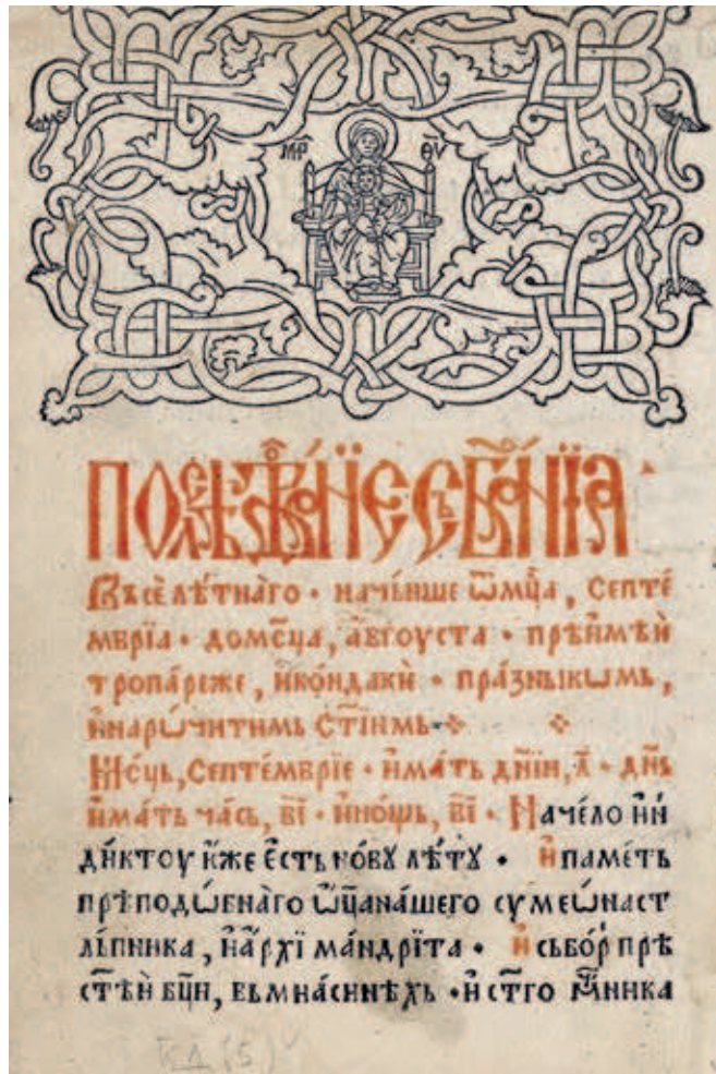
Сл. 398. Заставица с Богородицом на престолу, Псалтир с последовањем, издање Божидара Горажданина, НБС И 83

одштампаним настојањем Божидара Горажданина и његових синова, Ђурђа и Теодора Љубавића. 36 Овај украс, који се састоји од мањег броја преплетних заставица и витичастих иницијала, готово да се и не разликује од украса рукописних књига, с тим што су у два случаја унутар заставице унети и мали ликови Богородице на престолу (сл. 398) и попросја црквених отаца Василија Великог и Јована Златоустог. 37 Међутим, поред поменутих, као и заставице прекопиране из цетињског Октоиха првогласника, у Служабнику је отиснута и једна ренесансна декоративна вињета са изрезаним мотивима рога изобиља,