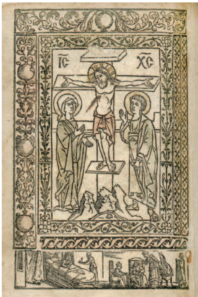
Сл. 396. Распеће, Молитвеник (Зборник за путнике), издање Вићенца Вуковића, РНБ