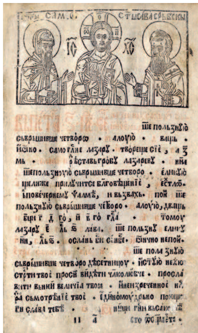
Сл. 400. Деизис са светим Симеоном и светим Савом, Триод цветни, издање Мркшине цркве, НБС И 49

птицама и цвећем, 38 која је, по свему судећи, купљена у некој од радионица у Венецији заједно с другом штампарском опремом.