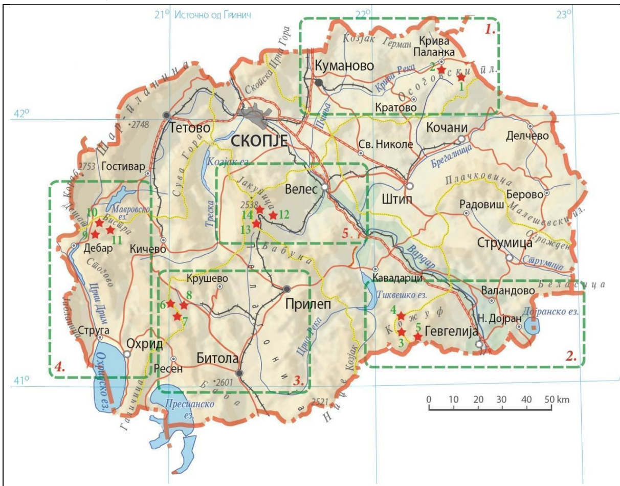
Слика 1: Примерок на истражувањето во Република Северна Македонија