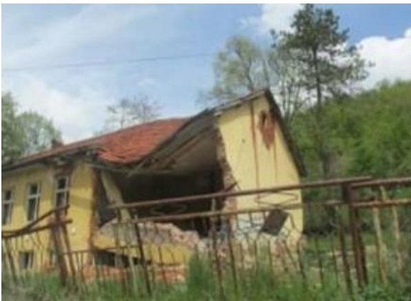
Слика 1: Зграда на селското училиште во с. Церово

Одржливиот развој на руралните простори подразбира социоекономски промени кои не ги нарушуваат долгорочните цели со кои се одржува дефиниран регионален капитал (економски, социјален, еколошки) со текот на времето (Hediger и соработниците 1998). Бидејќи руралната економија и, генерално, опстанокот и развојот на руралните простори, во голема мера, зависат од географските услови на областа (клима, природни потенцијали, предел, физичко-географски ограничувања, но, исто така, и социоекономски услови и демографски карактеристики), одржливиот развој на руралните простори, т. е. рамнотежа помеѓу економските и природните елементи, со почитување на социјалното опкружување, се наметнува како неминовност (слика 1 и слика 2).