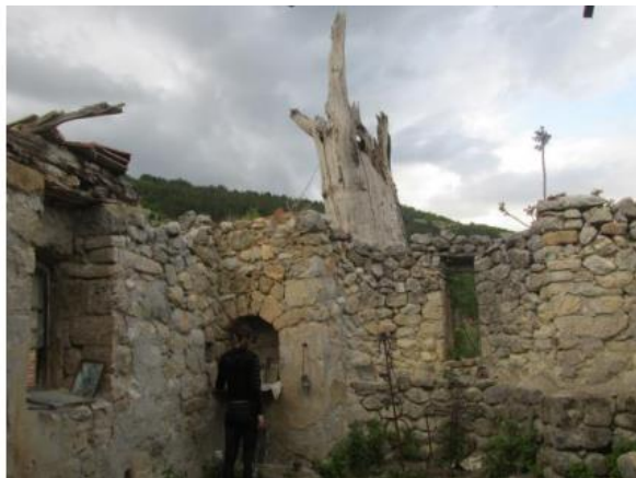
Слика 2: Црква во с. Градашница (Пирот)