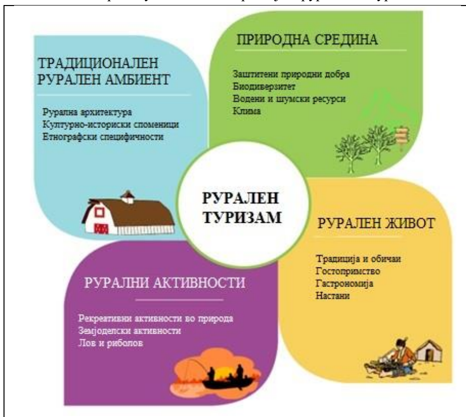
Слика 4: Клучни елементи на руралниот туризам

локалната заедница. Имајќи предвид дека овие елементи меѓусебно комуницираат, недостигот на еден од нив значително ги ограничува шансите за развој на руралниот туризам во една област.