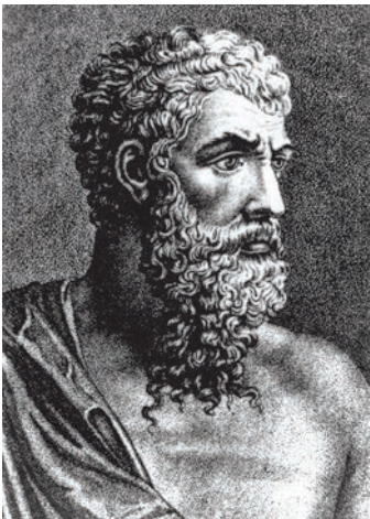
Аристофан (445–385 г. п. н. е.), пјесник, комедиограф. Најзначајнији представник античке комедије. На њега се Дучић осврће кад разматра друштвену одговорност умјетника.

пјесништва, долазе остварења у којима „пред нама искрсава судбина бића које у себи носи божју искру, али не може проникнути ко га је у овај свет послао и коме се на крају враћа. То је део и продужетак оног дубоког, нуминозног доживљаја који је Дучић имао на 'страшној међи'" (2007: 85). 211