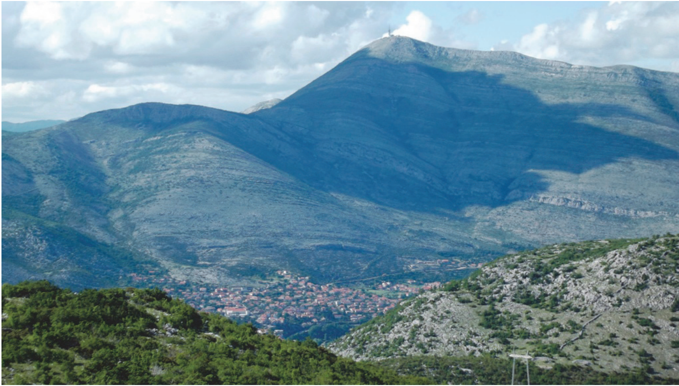
Леотар, планина изнад Требиња. Кључни интимнопоетички топоним Дучићев.

премало сликања пута којим се ходило до одређеног закључка што се нуди као императив, ма како он био блиставо срочен.