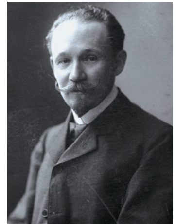
Слободан Јовановић (1869–1958)

Друга особина која чвршће везује Блаіо цара Радована и Јуіџра са Леуіџара , а која није нарочито карактеристична за Дучићев пјеснички опус, јесте изразита афористичност, у смислу концентровања мисли у поенте што претендују на језгровитост, духовитост и вјечну актуелност. Није ријеткост да се ове двије Дучићеве књиге – посматране као некакав диптих, два дјела са међусобним органским јединством вишег реда, двије близаначке књиге – називају збиркама есеја. Остаје отворено питање колико је, у композиционом смислу, есејистичка грађа успјела да услови њихов облик. И сам довољно проблематичан за дефиницију, прелазни огледни жанр према начелима своје структуре наспраман је раније апострофираним афоризму, као основу положеном у структурни темељ Блаіа и Јуіџара . Док есеј настоји да сагледа и обухвати тему, да медитира над њом, није