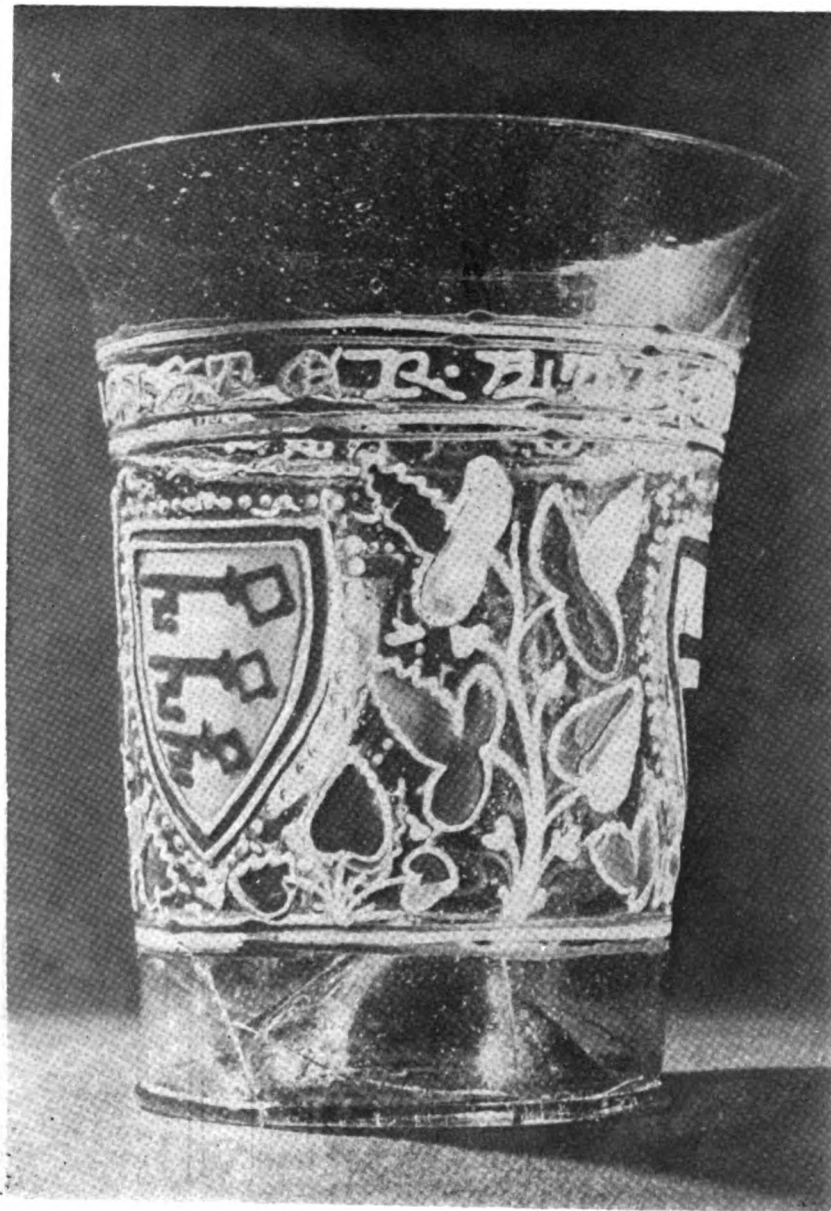
Сл. 1. Алдревандинова чаша, Британски музеј. (по Н. Тait)