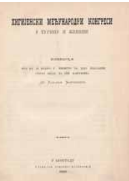
Књига Хиџијенски међународни конгреси у Турину и Женеви (1883)

Крајем 1881. године основао је Прво београдско друштво за гимнастику и борење, не само да би његови чланови телесно јачали већ и да се у „њему спреме учитељи гимнастике и борења, који би доцније направили мрежу гимнастичких дружина по целој Србији“. Из друштва су касније проистекла два друштва, Грађанско гимнастичко друштво „Душан Силни“ и Соколско друштво.