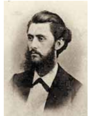
Владан Ђорђевић, 1871/72. година