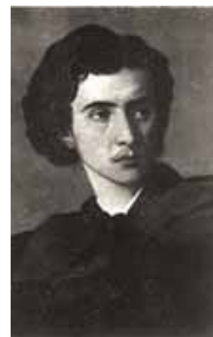
Владан Ђорђевић као лицејац (1857)

По наговору историчара Панте Срећковића, Владан је са Правног прешао на Јевтаственички (Природњачки) одсек Лицеја. За време распуста био је са пушком на Лицејској барикади близу Калемегдана, коју су лицејци подигли када је Ашир-паша почео бомбардовање Београда. Ту је одлучио да напише роман Кочина крајина , који је убрзо објавио у часопису Видовдан , да би ускоро роман био издат и као засебно издање. У роману је подстицао национална осећања код омладине и тежњу за ослобођењем. Бавио се и превођењем па је са француског превео Молијеров комад Тврдица .