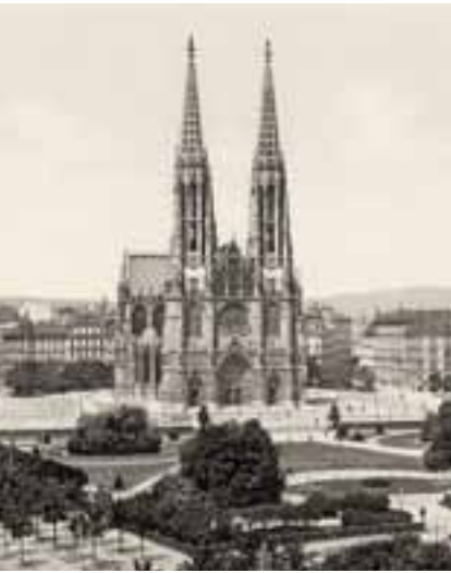
Беч у XIX веку