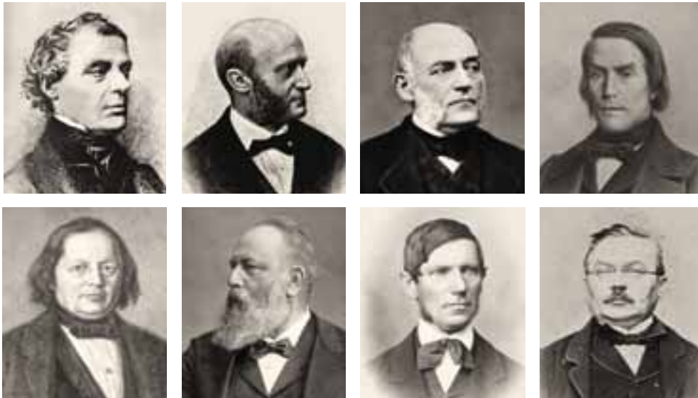
Најистакнутији професори који су предавали Владану Ђорђевићу: Јозеф Хиртл, Ернест Брике, Карл Рокитански, Јохан Ополцер, Јозеф Шкода, Теодор Билрот, Карл Артл и Фердинанд Хебра

Владан је био нарочито одушевљен професором Хиртлом који је вршио изврсне анатомске дисекције, лепо предавао и јасно писао, па се за њега причало да „говори као Цицерон а пише као Хајне“. Импресиониран Хиртлом, Владан је убрзо почео да преводи његову Дескриптивну анатомију и да на састанцима „књижевног“ друштва студената из Србије „Задруга“, које је основао, чита одломке из ње. У преводу је увео низ медицинских термина који у нашем језику до тада нису постојали.