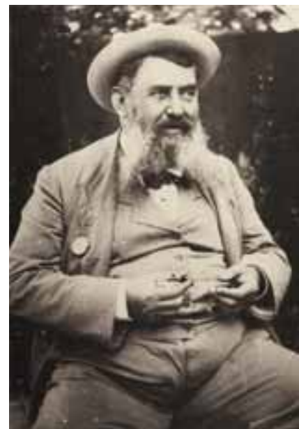
Владан Ђорђевић за време служења затворске казне

У таквој ситуацији, појавиле су се и идеје да краљ Петар покуша да „окупи стару гарнитуру бивше Владанове владе“ и да се „Владан врати у политику“. Прављене су комбинације да се именује за шефа Конзервативне странке чије је организовање одобравао и краљ. Владан више није намеравао да се бави политиком, хтео је да се посвети завршетку недовршених дела и њиховом сређивању.