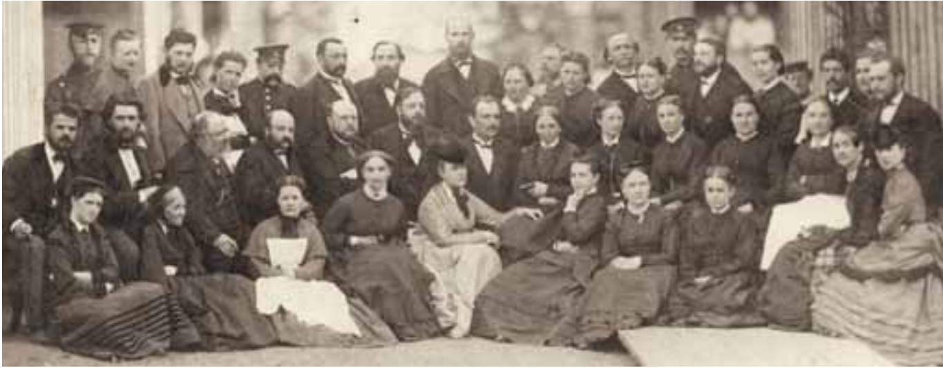
Владан Ђорђевић (у другом реду, други слева), војни лекар у пруском санитету, у француско-пруском рату, са лекарима и добровољним болничаркама. Франкфурт на Мајни, 1871. година.