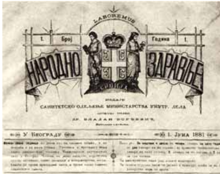
Први број часописа Народно здравље