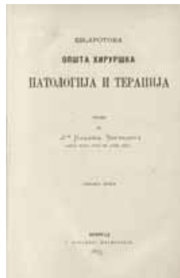
Књиге Народна медицина у Срба и преводи Вевелове историје индуктивних наука и Билројове опште хируршке патологије и терапије

са кнезом Миланом спријатељио и само уз повремене, углавном краће сукобе, њихово пријатељство трајало је све до смрти краља Милана, тј. до 29. јануара 1903. године. Генерал Јован Белимарковић је добро предвидео да ће се Владан ослободити „републиканских бубица“ и да ће постати монархиста и одани обреновићевац.