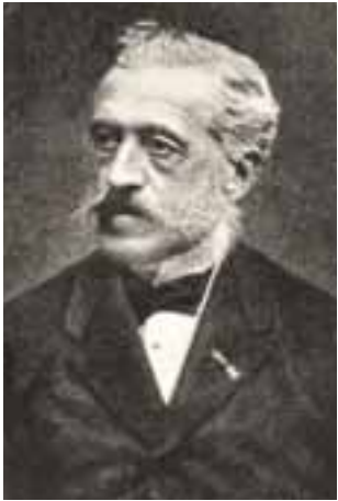
Бернхард фон Лангенбек (1810–1887)

дуж реке Рајне и да их притом лечи, превија и негује. После успешно одслужене „пробе“, Владан је крајем децембра 1870. године премештен у Франкфурт на Мајни и постао је „ kgl. prusischer ordinirender Arzt des Reserve-Lazarethes N°1 “ од 300 постеља, са месечном платом од 100 талира и потпуним издржавањем у болници, у којој је три месеца управљао са два павиљона од по 20 постеља, у којима су претежно лечени француски рањеници.