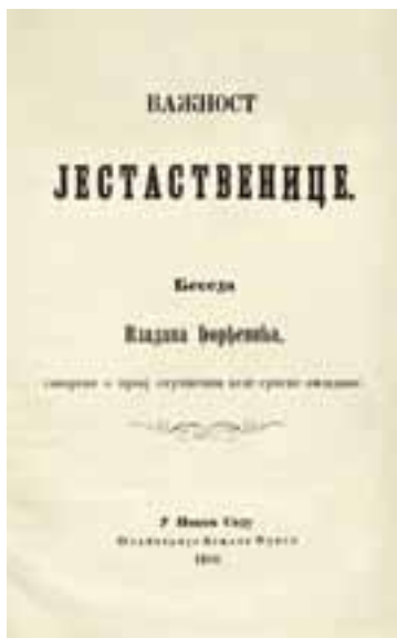
Беседа В. Ђорђевића Важности јестасџвенице , објављена као засебна књига

секретара, Владана Ђорђевића. Ново друштво било је у стању да приступи извршавању замисли Владимира Јовановића, уредника Слободе у Женеви, да створи Уједињену омладину српску и организовању прве скупштине у Новом Саду (15–18. августа 1866) на којој је одржао беседу Важности јестасџвенице , која је (1866) штампана у Новом Саду као засебна књига.