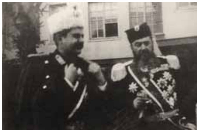
Владан Ђорђевић као председник владе са краљем Александром

Политиком извршавања преузетих обавеза, Владан је све до „Ивандањског атентата“ на краља Милана (24. јуна 1899) успевао да поврати поверење страних кредитора. Уверен да ради на корист државе и народа, настојао је да „отаџбину излечи од партизанског рака ( carcinoma politicum ) и приступи државној хирургији“. Да би то постигао, био је одлучан и ригидан, не обазирјујући се на противнике. Руководећи се принципом да „слободе нема без одговорности“, веровао је да у постојећим условима може гушити политичке слободе, слободу штампе, збора и договора, чак и личне слободе, и заводити ред, рад и законитост.