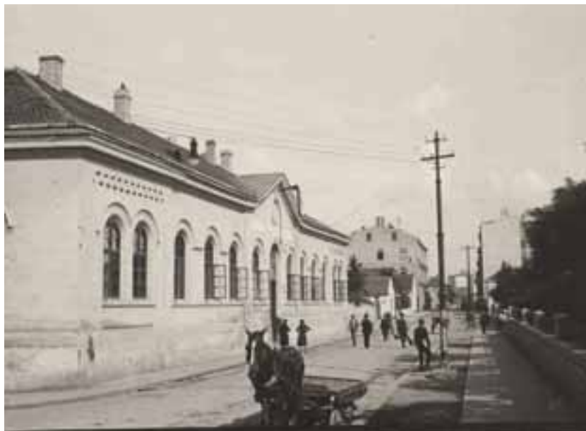
Стара зграда Управе града Београда. око 1930. године.

О поменутиим комбинацијама он бар у почетку није много знао или, ако је и знао, у њих није веровао. Кад је званично са њима упознат, сматрао је да је боље да он делује из позадине, као идеолог, уредник и издавач партијског гласила, што је захтевало финансијска средства која нису имали, нити су их могли добити.