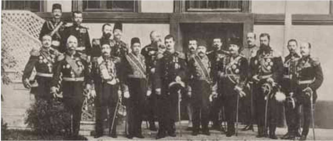
Цариградски снимак Њ. В. Краља Александра I са свитом, фото-разгледница. Снимак је направљен у време посете краља Александра Обреновића, јуна 1894. године. У првом реду здесна је Владан Ђорђевић, српски посланик у Цариграду.

Александра Турској (1894), током које је султан поменуте уговоре усмено прихватио, али их је на наговор саветника касније отказао.