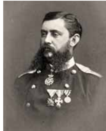
Владан Ђорђевић (1876)