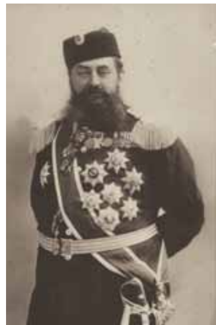
Владан Ђорђевић, санитарски пуковник, око 1895. године; штампана фотографија