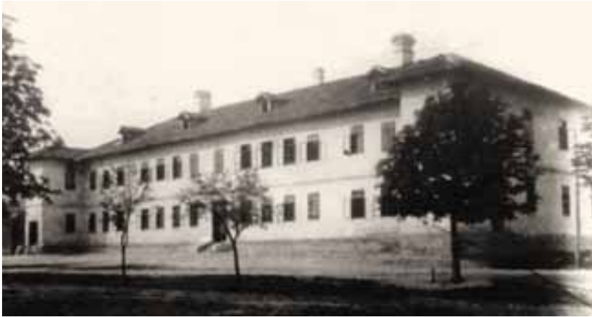
Зграда палилуске касарне у којој је од новембра 1839. до 1848. била смештена Војна болница (МНТ, ЗМСЛД, инв. бр. Т:11.7.1128)