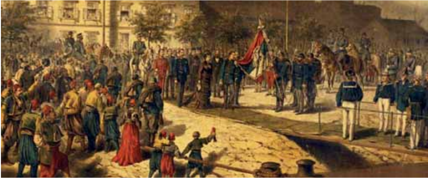
Кнез Милан Обреновић креће у рат 1876. године

У Кишињеву било му је понуђено место „статског совјетника“, што је био чин између пуковника и генерала, што је поново одбио са образложењем као и неколико година раније, када му је нуђена катедра хирургије на неком руском универзитету.