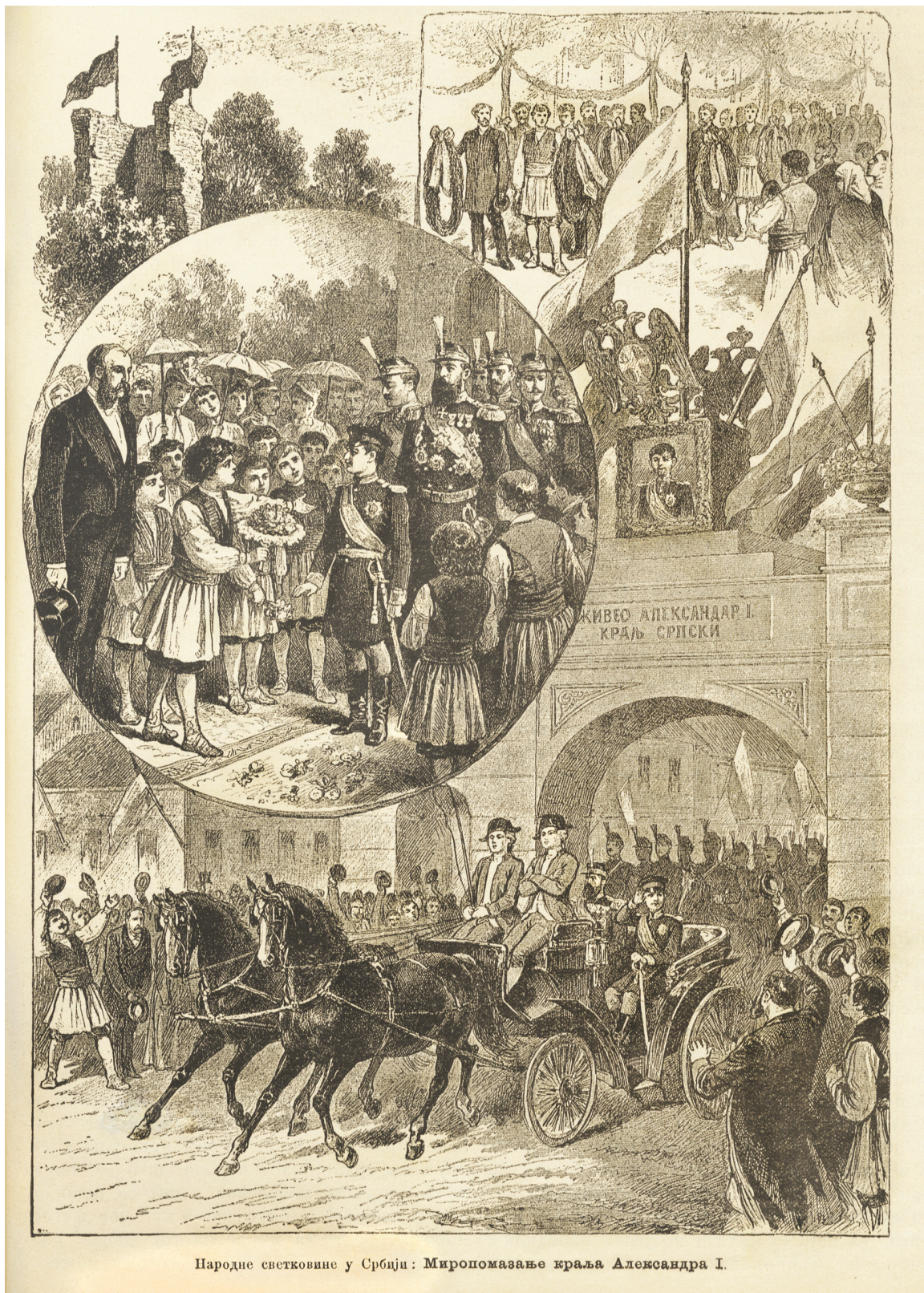
Народне светковине у Србији: Миропомазање краља Александра I.