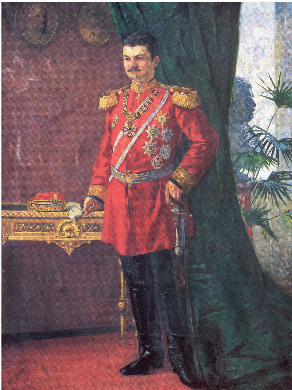
СЛ. 4. МАРКО МУРАТ, ПОРТРЕТ КРАЉА АЛЕКСАНДРА ОБРЕНОВИЋА, 1894, УЉЕ НА ПЛАТНУ, ВОЈНИ МУЗЕЈ У БЕОГРАДУ