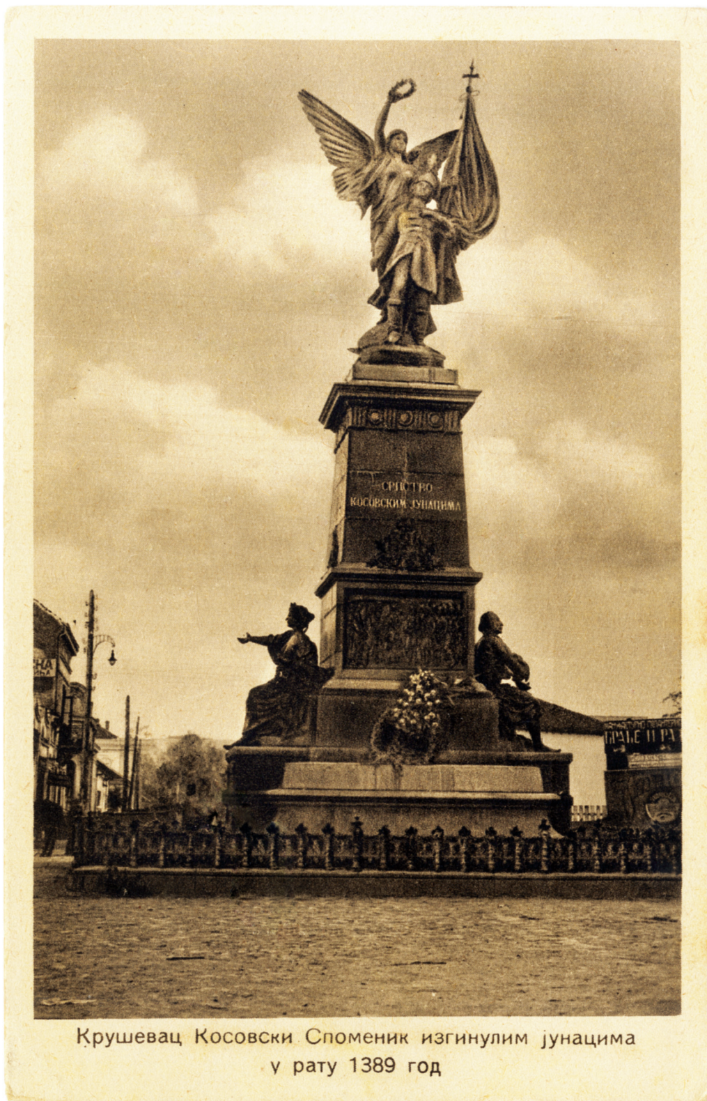
СЛ. 3. ЂОРЂЕ ЈОВАНОВИЋ, СПОМЕНИК КОСОВСКИМ ЈУНАЦИМА, 1889–1904, КРУШЕВАЦ