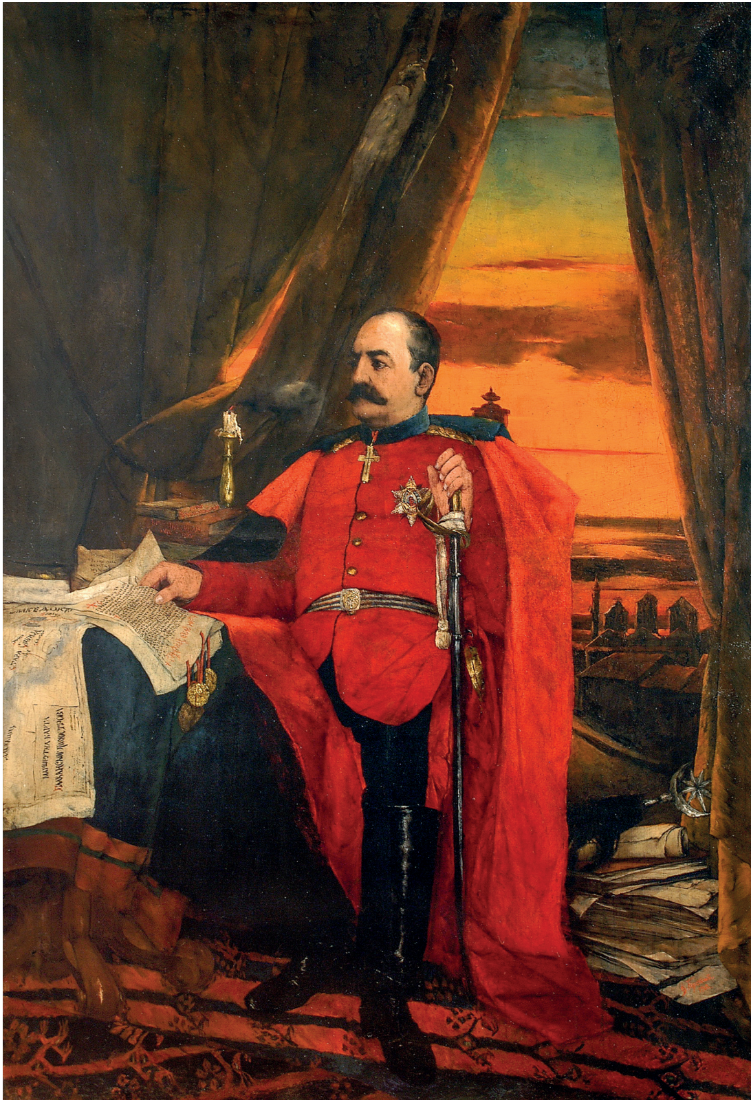
СЛ. 5. ЂОРЂЕ КРСТИЋ, ПОРТРЕТ КРАЉА МИЛАНА ОБРЕНОВИЋА, 1902, УЉЕ НА ПЛАТНУ, ЕПАРХИЈА НИШКА СРПСКЕ ПРАВОСЛАВНЕ ЦРКВЕ