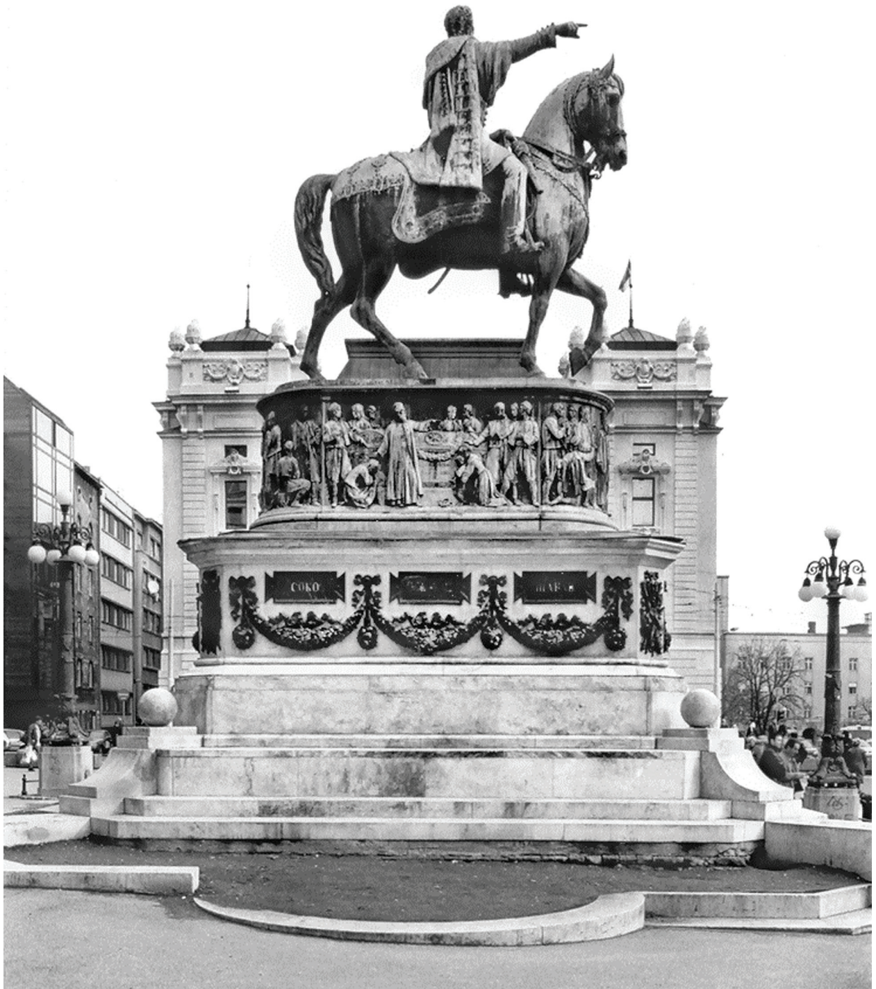
СЛ. 1. ЕНРИКО ПАЦИ, КОЊАНИЧКИ СПОМЕНИК КНЕЗУ МИХАИЛУ У БЕОГРАДУ, 1882.