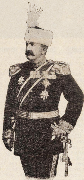
† КРАЉ МИЛАН I.

Данас када смо се сви уверили, да пут на Косово води само преко Ссфије и Велбуџа, право је, да се сетимо и сени човека, који је први до тог уверења дошао и за то деценијама, како сада видимо, неоправдано осуђиван. Сада после овете Сливнице код Штипа и Кочана мирно ће у српској земљи почивати његове српске кости, а дух његов у овим борбама лебдео је пред победоносним српским легионима и показивао је пут онима, који су те легионе водили, оним многобројним славним официрима, које је српској војсци Он спремио и као Краљ и као командант активне војске.