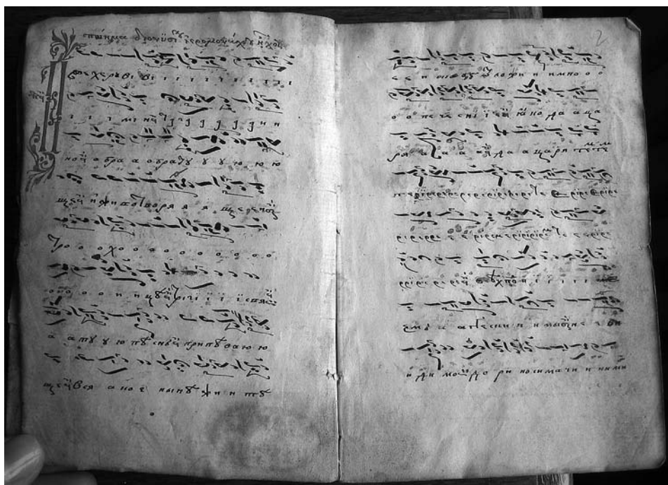
Херувика јеромонаха Дионисија, глас I, рукопис МР I 1, ff. 1v—2v