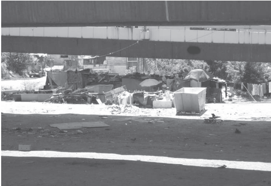
Слика 4. Детаљ из насеља, испод моста „Газела“ (Фото Л. Дивјак, јун 2007)

Уцерице и страћаре у којима су породице живеље биле су склепане од картона, старог лима и других неграђевинских материјала. Кућерци су били приземни, често састављени од само једне просторије, малих површина (20–30 m 2 , што даје сваком члану домаћинства површину између 3 и 6 m 2 ) 6 . Биле су без темеља и адекватне термичке изолације, а подови махом земљани. Представљале су само пуки заклон од неповољних климатских елемената (што и нису омогућавале у потпуности). Куће су биле натрпане једна поред друге, а такав хаотични приказ био је последица и недостатка унутрашњег простора, који се надокнађивао интензивним коришћењем дворишног. Иако дворишта нису ограђена, унутар насеља се знало који део простора припада којој породици. Оне су га користиле за складиштење материјала који скупљају, као оставу, за кување, спавање или доколицу и игру деце, све то у зависности од годишњег доба. (Изглед насеља из јуна 2007. приказан је на илустрацијама 1, 2, 3, 4 и 5). У насељу није постојала основна комунална инфраструктура. Воде није било, а није постојала ни канализациона мрежа (фекална и кишна), које има у свега трећини ромских насеља у Србији 7 . Најчешће се тоалет налазио у импровизованим пољским кабинама, а вода и отпадне материје су се разливале у околну земљиште. Насеље није било прикључено на