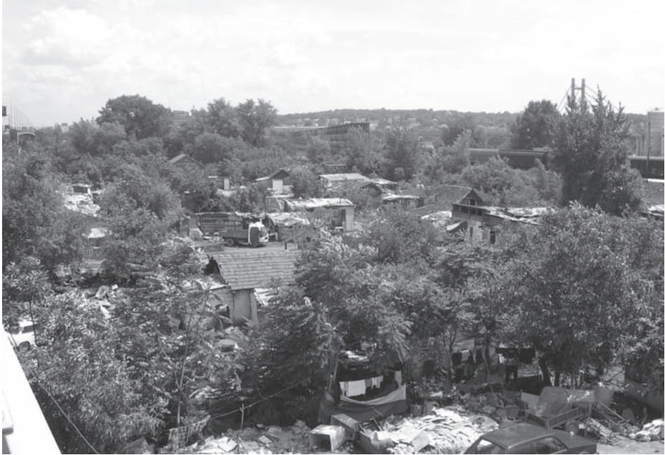
Слика 1. Изглед насеља „Газела“

та 3 . Образовни статус Рома је врло низак: петина регистрованих Рома је неписмена, нешто мање од трећине има завршену основну школу, средњу школу има нешто мање од 8% Рома, док је проценат са вишом и високом школом укупно битно испод 1%. За децу у чак 20% ромских насеља школска установа је готово потпуно недоступна (јер живе у дислоцираним и просторно сегрегираним насељима где не постоји редован превоз). Више од три четвртине ромске деце живи у породицама које немају стабилан извор прихода. Најчешће навођени извори зараде су повремени или привремени (по правилу) физички послови и скупљање секундарних сировина.