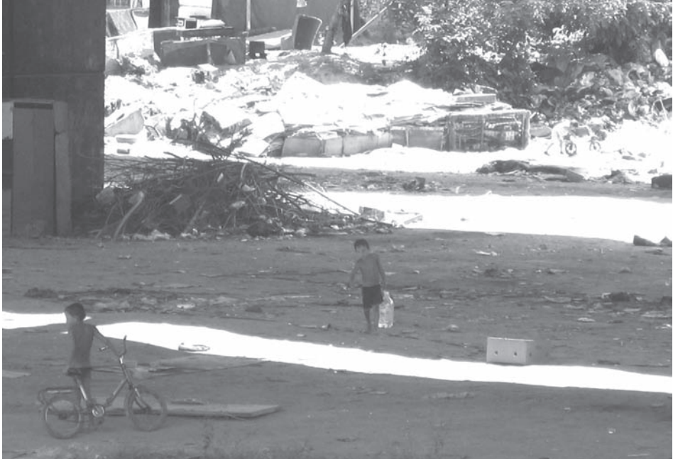
Слика 5. Животне прилике у насељу „Газела“ (Фото Л. Дивјак, јун 2007)

електроенергетски систем, али су се житељи у великом броју сналазили и повезали своје скромне електричне уређаје „на бандеру“. Не само да су због овога били чести кварови уређаја (неки житељи су се жалили и да струја коју су извели до својих кућа није довољно јака да би се укључио фриџидер), него је постојала и опасност по животе људи. Реалне и присутне биле су и опасности од пожара и епидемија.