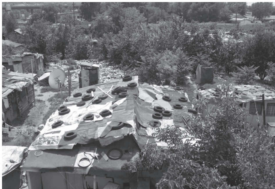
Слика 2. Једна од већих барака са импровизованим кровом у насељу „Газела“ (Фото Л. Дивјак, јун 2007)

Слам (од енглеске речи slum ) је стамбено насеље у којем је социјална и енвајерментална ситуација до те мере лоша да негативно утиче на здравље, социјално и психичко стање житеља 4 . Ова насеља беде карактерисана су веома малим кућама, изграђеним од најлошијих неграђевинских и углавном отпадних материјала. Овде основна комунална инфраструктура не постоји, а читава насеља су затрпана како домаћим отпадом, тако и секундарним сировинама које становници прикупљају и чувају у близини својих кућа. Сламови најчешће настају као импровизована привремена склоништа, али временом постају стална насеља. У њима владају најгори нехигијенски услови живота. Житељи сламова су у великој мери искључени из локалног друштва, а околина према њима и њиховим насељима показује висок степен одбојности.