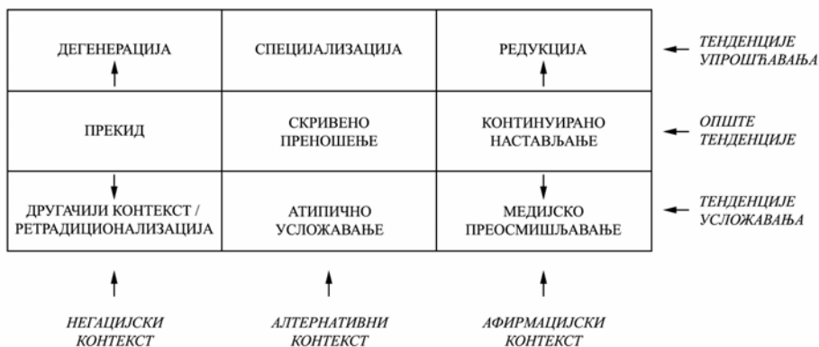
Схематска представа 1. Илустративна представа елементарног система промене/трансформације традиционалног модела народне религије Срба

могућности да конструишемо јединствену илустративну представу елементарног система промене/трансформације традиционалне народне религије (видети схематску представу 1). У оквиру овако конципираног система, као што се види, уочавамо симетрично укрштање основних тенденција и контекста карактеристичних за савремени оквир народне религије Срба.