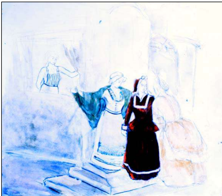
Сл. 18: Г. Брауновић, Три ћакулоне, четврта на прозору , (грађански женски костим)