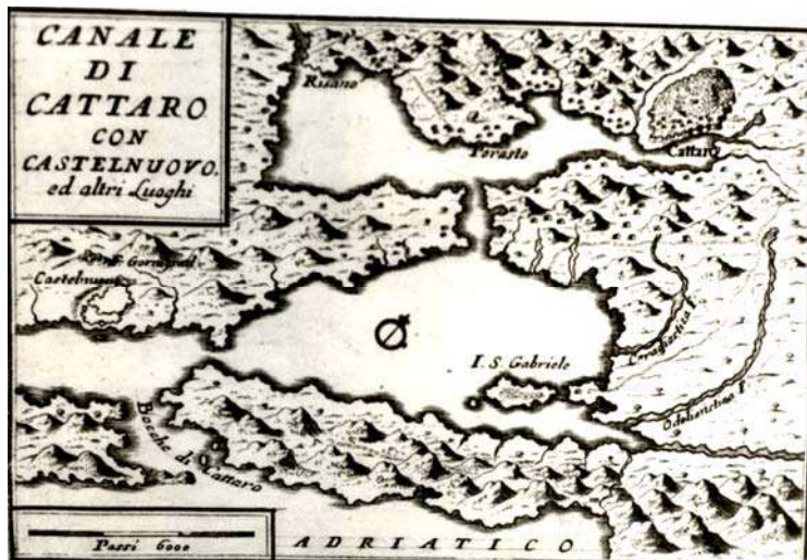
Сл. 1: Р. Coronelli, Бококоторски залив XVII век , бакорез, Венеција 1688.

Након двоековне владавине Турака, 1687. године, заузећем северозападног дела Боке Которске, остварене су вишедеценијске тежње Венеције да заокружи своју владавину над целим простором Боке Которске. Смена власти и промена друштвеног система није имала пресудан значај за будућност овог дела залива, већ је произвела промене у демографској, етничкој и културној сфери. 1