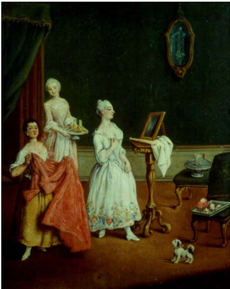
Сл. 14: Pietro Longhi, La toeletta , Венеција XVIII век