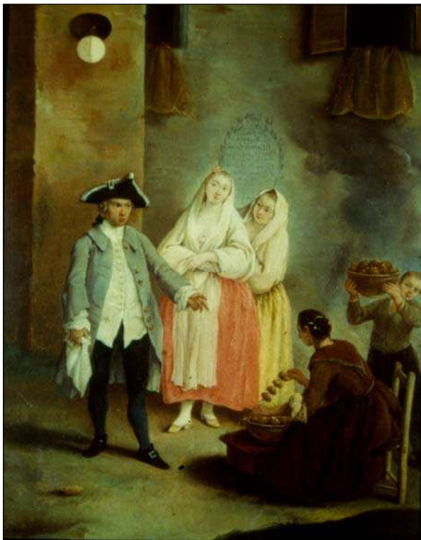
Сл. 13: P. Longhi, La venditrice di 'fritole' , Венеција XVIII век