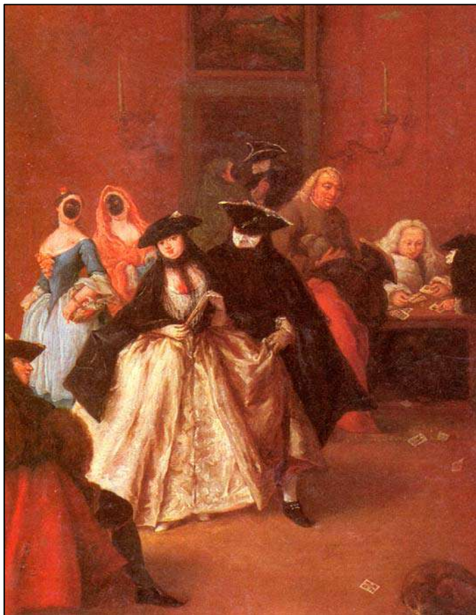
Сл. 12: P. Longhi, Il Ridotto , Венеција XVIII век