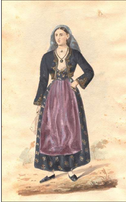
Сл. 10: Н. Арсеновић, Жена , Рисан, Бока Которска, Етнографски музеј у Београду, ил. инв. бр. 868