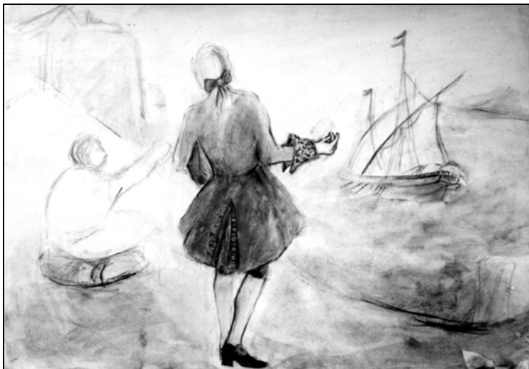
Сл. 3: Г. Брауновић, Грађански мушки костим (барокни господин са погледом на море)

његова функција била је подигнута на виши степен – степен адмирала луке. Дужност му је била да, поред поморско-маритивних питања, води бригу о увозу и извозу робе, санитарним прегледима, као и о процени поморских штета. 50