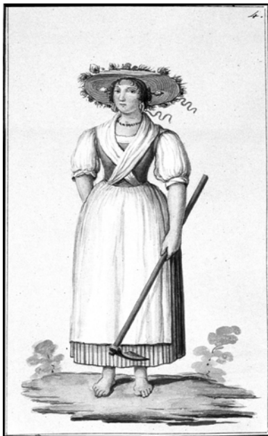
Сл. 9: Costumi marchigiani del primo ottocento , Museo della mezzadria, Senigallia

До изражаја су дошли акултурацијски процеси, контакти између сеоске и градске културе, копненог залеђа и јадранске обале. Бројним, модерним и луксузним одевним предметима репрезентовани су друштвени статус и економска моћ породице. Носиоци традиционалног женског костима били су из редова новодосељеника. Овај костим су донели из матичних области, а неки његови делови су ношени од стране староседелачког становништва православне вероисповести и у ранијим периодима. Носиоци овог типа одевања, посебно они из новоствореног грађанског слоја, са економским развојем су све брже прихватили одевне предмете који су били импорт са Запада. Традиционални женски