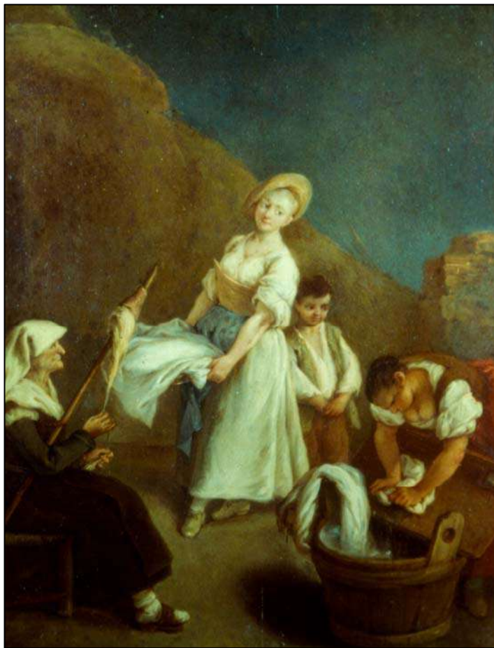
Сл. 15: P. Longhi, La lavandale , Венеција XVIII век