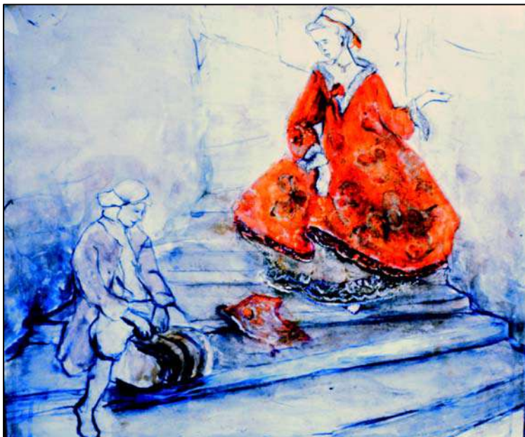
Сл. 22: Г. Брауновић, Барокна дама и просјак , (грађански женски костим)