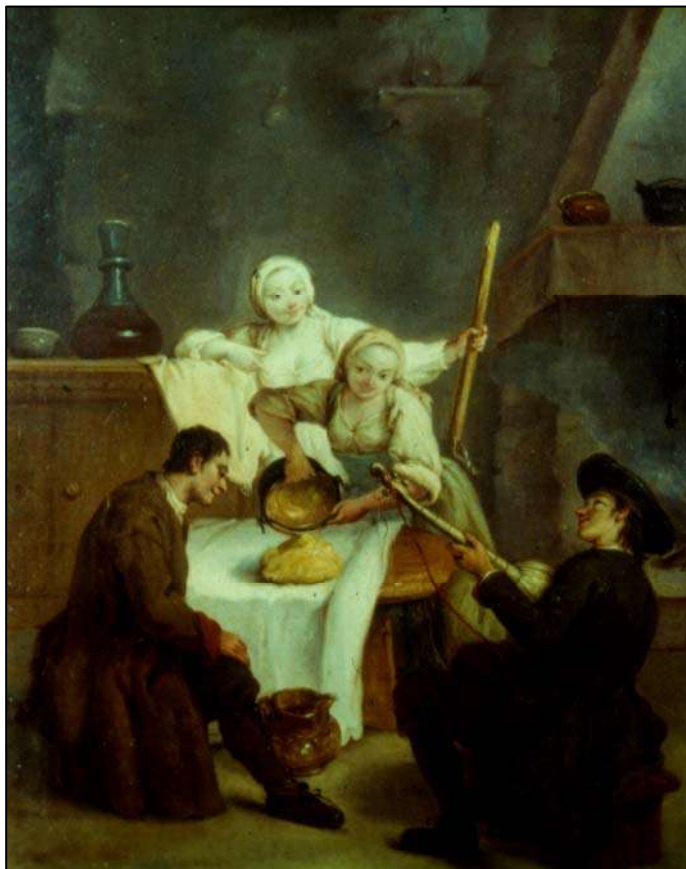
Сл. 16: P. Longhi, La polenta , Венеција XVIII век