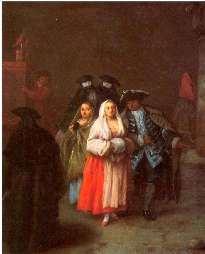
Сл. 11: P. Longhi, Il "mondo novo" , Венеција XVIII век