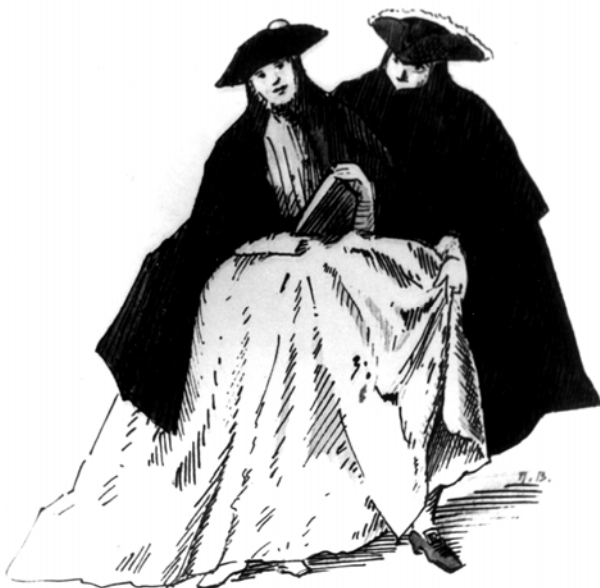
Сл. 5: P. Longhi, Il Ridotto , Венеција XVIII век

док су поморци овога краја, путујући и долазећи у додир са културним и уметничким центрима по свету, постали носиоци новог начина живота, уносећи у своју средину и дом нове утицаје.