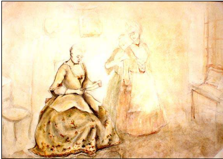
Сл. 17: Г. Брауновић, Дама са писмом , (грађански женски костим)