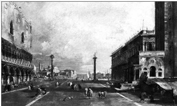
Сл. 2: F. Guardi, La Piazzetta , Венеција XVIII век

Међутим, да би се ова значајна одлука могла доследно спровести у дело, било је потребно имати на располагању више земље него што ју је стварно било. Велики број породица није је уопште добио, или је била добијена неплодна земља. Како је тада највећи део руралног становништва своју егзистенцију заснивао на обради земље и гајењу стоке, не чуди што је свакодневно долазило до сукоба и насилног присвајања земље. Млетачка власт је била