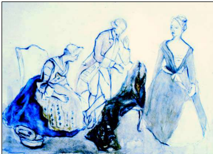
Сл. 19: Г. Брауновић, Служавка са господом , (грађански женски костим)