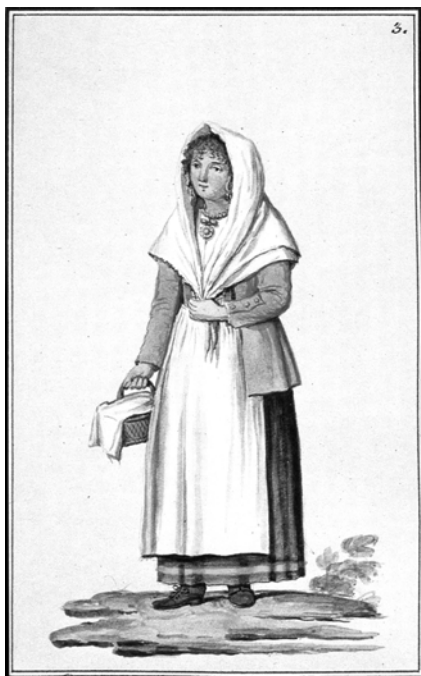
Сл. 7: Costumi marchigiani del primo ottocento , Museo della mezzadria, Senigallia

Хронолошки посматрано, овај одевни предмет био је у употреби у традиционалном костиму током целог 18. века, а своје трајање наставио је и у временима која су следила и постао је део фиксиране народне ношње. 152