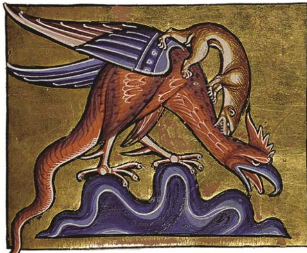
Сл. 1 – Базилиска напада ласица, минијатура из Абердинског бестијарија, почетак XIII века, преузето са https://www.abdn.ac.uk/bestiary/

Услед веровања да се излеже из петловог јајета, базилиск је од почетка XIII века познат под именом basilecoc , како је најпре наведен у бестијарију односно Књизи о животињама Пјера из Бовеа или Петра Пикарђанина. И овај аутор описује његово излегање из јајета које израста у утроби петла након што напуни седам година, на коме лежи крастача. Након што се излегне, он има главу и тело петла, али му је реп као у змије. Пошто је изузетно отрован, погледа који усмрћује, једини је начин да се он убије помоћу кристалне посуде кроз коју човек може да га види, али не и он њега. (Mélanges 1851, 213–214). У тадашњим и познијим бестијаријима, базилиск је визуелно приказиван на овај начин – са главом, телом и крилима петла, али змијским репом.