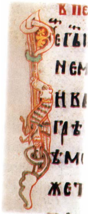
Сл. 4 – Базилиск, минијатура из Мирослављевог јеванђеља, fol. 15r; преузето из: Д. Мрђеновић, В. Топаловић, В. Радосављевић, Мирослављево јеванђеље. Историјат и коментари , Службени лист : Досије, Београд 2002, 10.

Представе базилиска у српском средњовековном ликовном изразу још су старије и од оних забележених у писаним изворима. Тако је базилиск препознат још на тринаест минијатура из Мирослављевог јеванђеља (fol. 7v, 15r, 18r, 22v, 31r, 70v, 71r, 75v, 81v, 87r, 89v, 95r, 166v). Он се јавља са увек идентичним карактеристикама: у форми која обједињује тело птице са оштрим канцама, реп змије и главу змаја (Ognjević 2014, 10)/