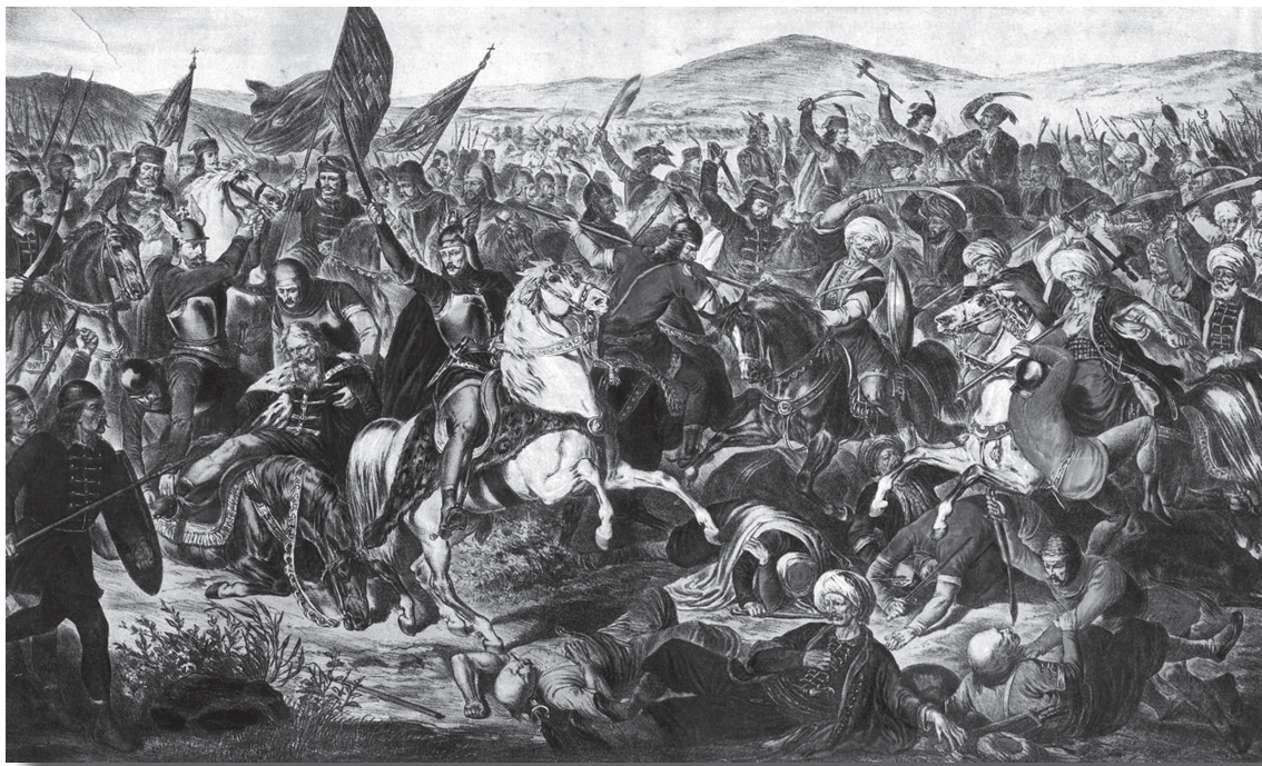
Адам Стефановић, Косовски бој , (1870)

познато, простор није истозначан већ постоје делови простора који имају своје изузетне специфичности, разликујући се од других, мање значајних тј. профаних територија.