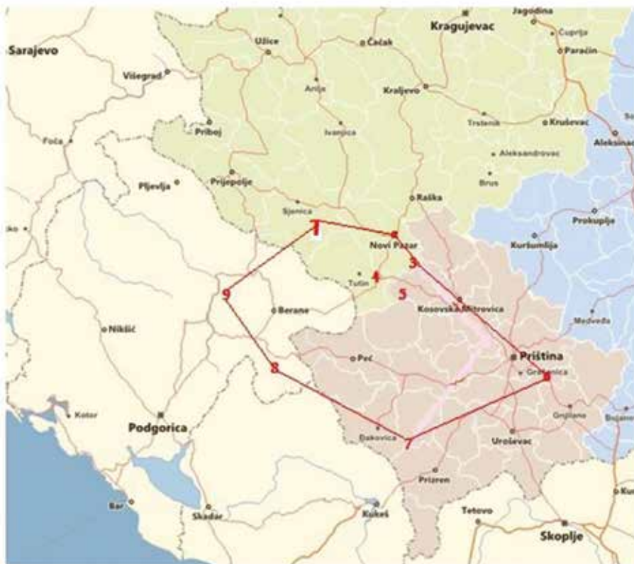
Графички приказ обрађеног ареала