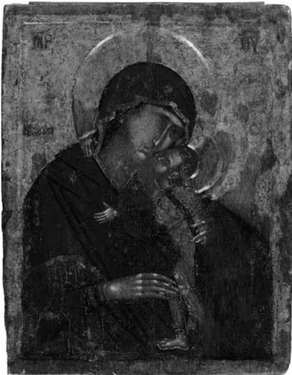
Богородица Милостива, Солун, почетак XIV столећа

(100x76), на којој је мали Христос представљен како стоји на десној страни Богородичиног крила, судећи по натпису ὙΔΩΡ ΤΟ ΠΡΙΝ ΜΕΝ ΕΚ ΠΕΤΡΑΣ ΡΥΕΝ ΞΕΝΩΣ ΕΥΧΗ ΠΡΟΗΧΘΗ ΤΟΥ ΠΡΟΦΗΤΟΥ ΜΩΥΣΕΩΣ ΤΟ ΝΥΝ ΔΕ ΤΟΥΤΟ ΜΙΧΑΝΑ ΣΠΟΥΔΗ ΡΕΕΙ ΟΝ ΣΩΖΕ ΧΡΙΣΤΕ ΚΑΙ ΣΥΝΕΥΝΟΝ ΕΙΡΗΝΗΝ, cf. Rhoby , Byzantinische Epigramme , 116–118, првобитно је свакако била украс неке