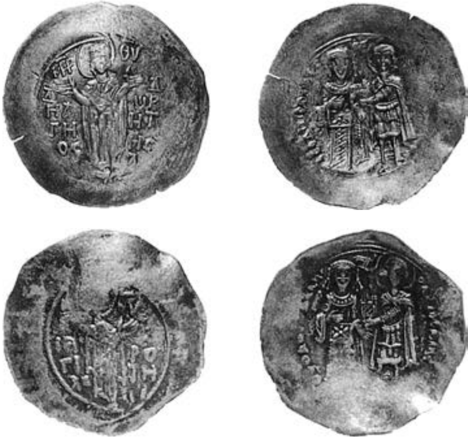
Сребрњаци Теодора Анђела, 1224

време се јавља на бакарном новцу кованом у Цариграду под управом Латина, а нешто касније и у Бугарској цара Константина Тиха. 239 С друге стране, читав низ високих световних и црквених достојанственика у Царству XI и XII столећа, од најближих сродника василевса до архијереја у удаљеним епархијама, попут Марије Комнине, синовике Манојла I, Никите, митрополита Селевкије исавријске или Михаила, епископа Ореона на северу Евије, на аверсима својих печата имали су Богородицу у трочетвртинском профилу с истим натписом. 240 Да је