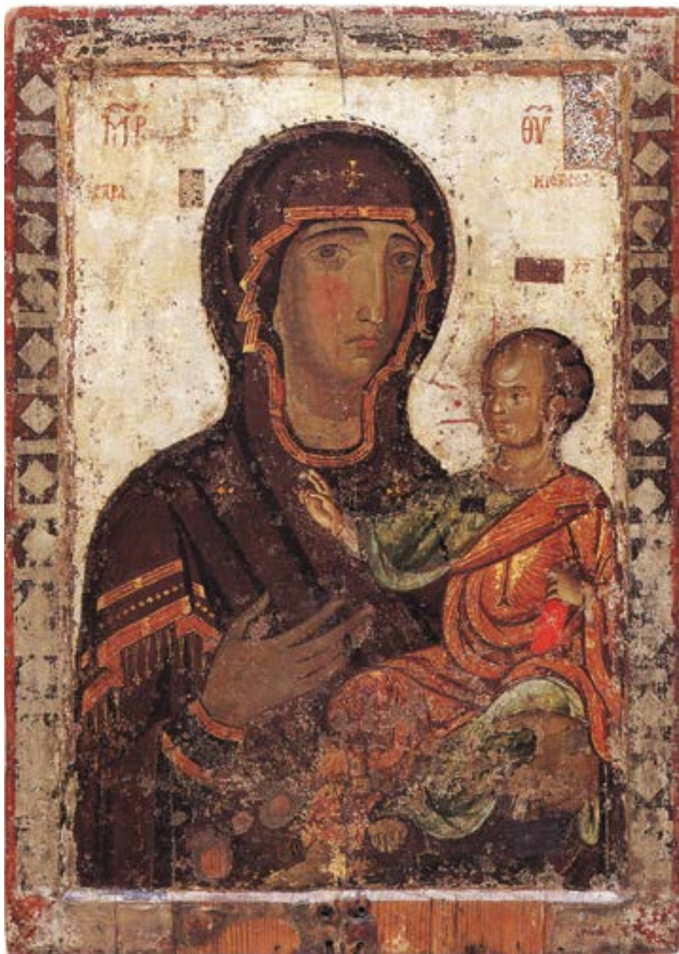
Литијска икона Аракиотисе, Лагудера, 1192