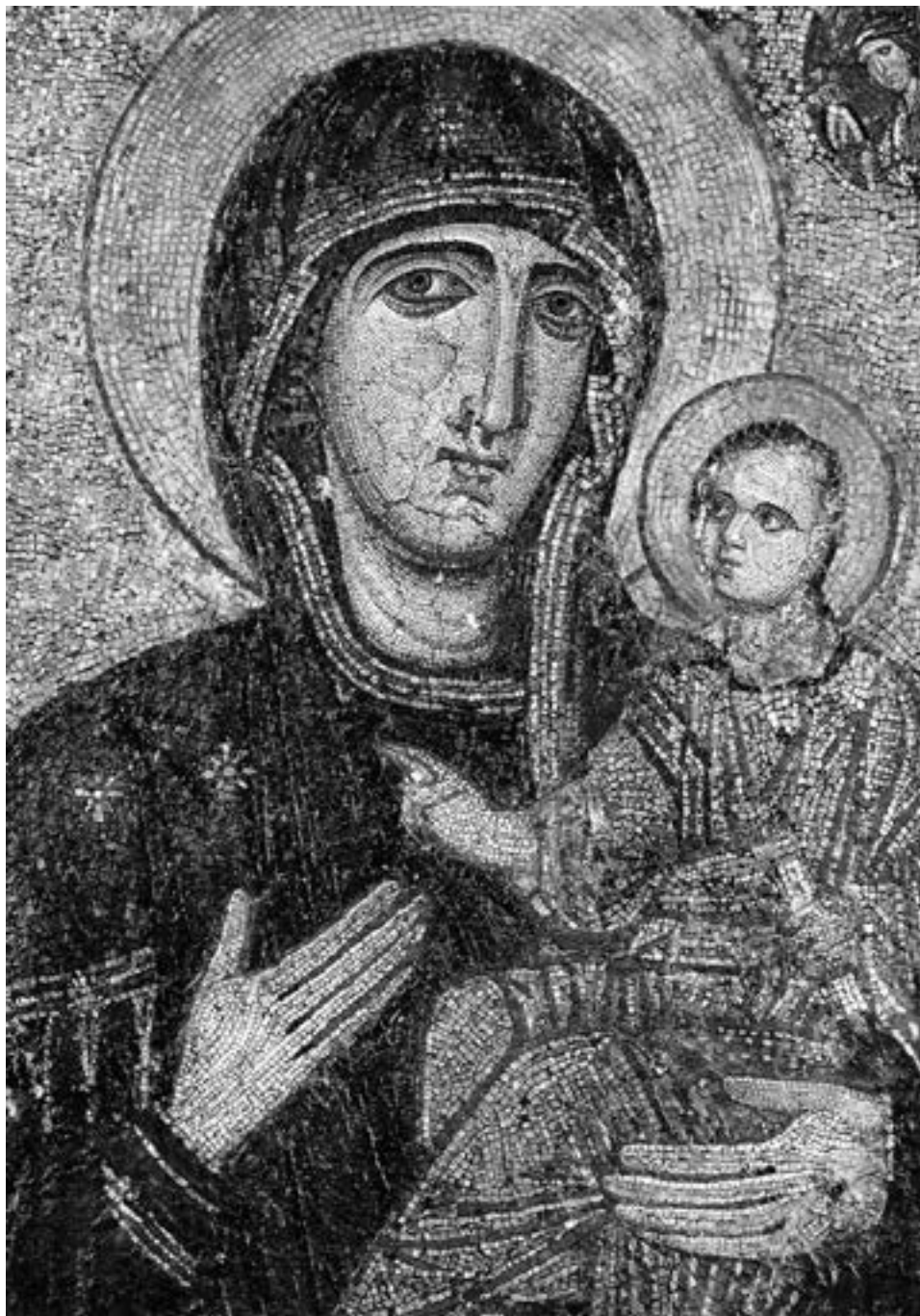
Мозаична икона из васељенске патријаршије, око 1100