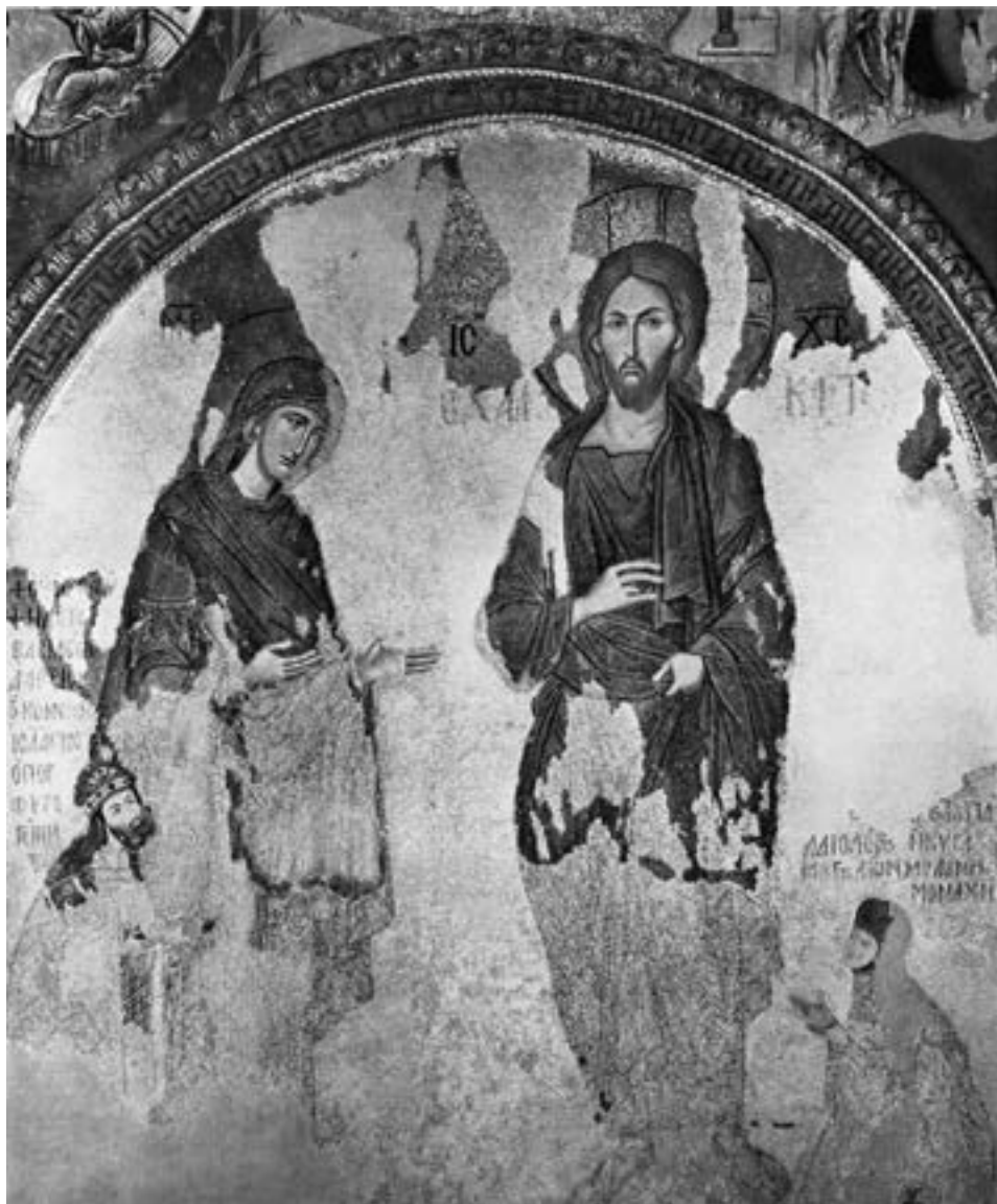
Мозаик са источног зида нартекса манастирског католикона Христа Хоре, око 1320

талне композиције која је у Хори вероватно красила зид иза Исаковог саркофага пре 1118, 216 што потврђују његове речи ἐν νεότητί μου или