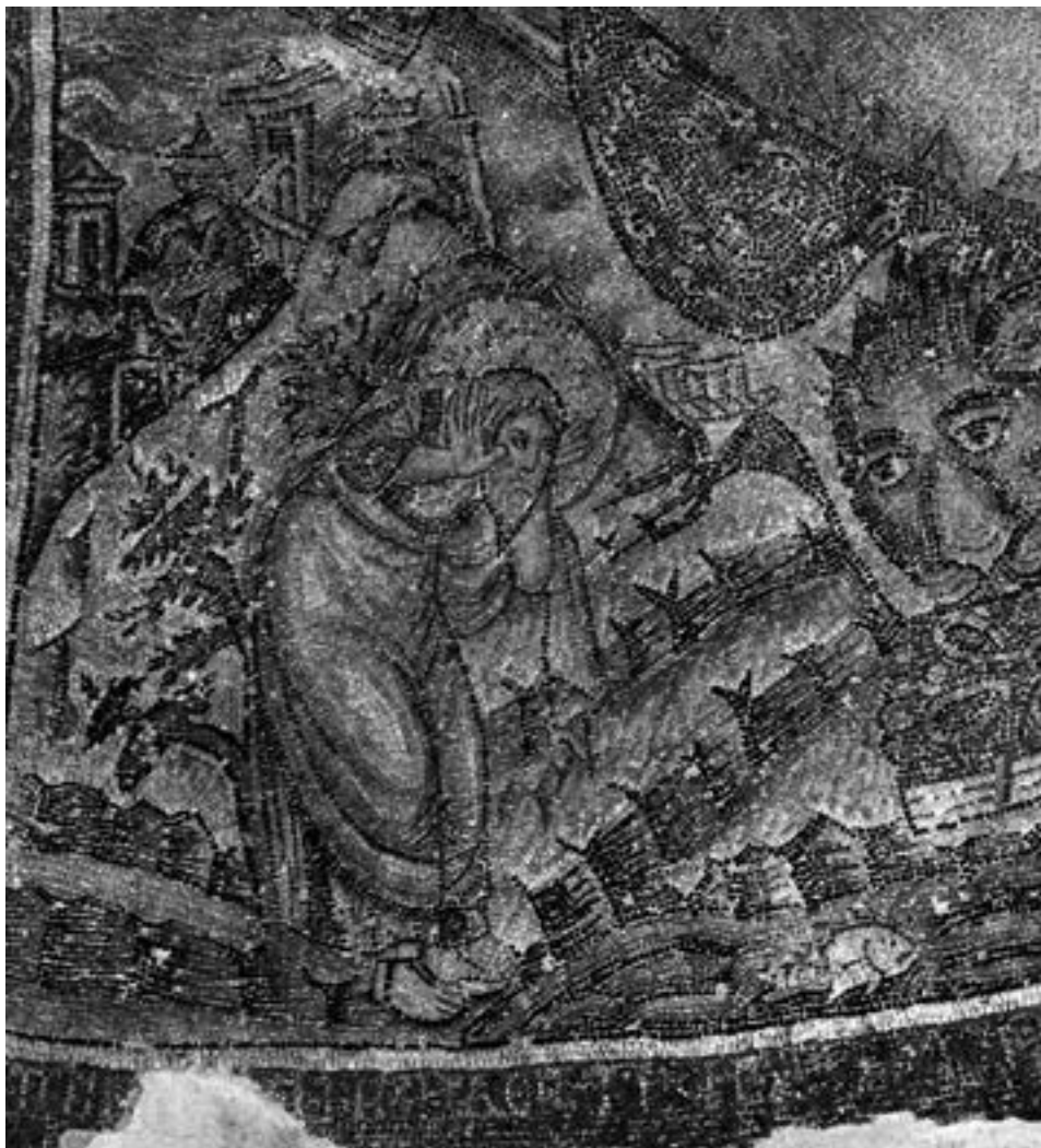
Пророк Језекиљ, детаљ солунског мозаика

је парафраза Исаијиног слављења Месије – \text{ΙΔΟΥ Ο Θ(Ε)Σ ΗΜΩΝ ΕΦ Ω ΕΛΠΙΖΟΜΕΝ Κ(ΑΙ) ΗΓΑΛΛΙΩΜΕΘΑ ΕΠΙ ΤΗ ΣΩΤΗΡΙΑ ΗΜΩΝ ΟΤΙ ΑΝΑΠΑΥΣΙΝ ΔΩΣΕΙ ΕΠΙ ΤΟΝ ΟΙΚΟΝ ΤΟΥΤΟΝ.} 104 Разорени град и колиба на врховима гора, с