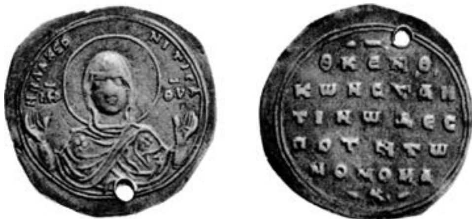
Сребрњак Константина IX Мономаха (1042–1055)

у којем описује надалеко познато чудо које се сваког петка, по заласку сунца, током вечерње службе, дешавало у влахернском храму. На десној страни цркве, гледано ка истоку, у посебном проскинитару чувана је Богородичина икона прекривена богато украшеном катапетазмом. 171 По свршетку уобичајених молитви у припрати, која није била довољно пространа да прими велики број верних, те су они стајали и у портицима атријума древне базилике, отварају се врата наоса, а наочиглед чинодејствујућих и знатижељне масе присутних верника одигривало се велико чудо – ношена невидљивом силом налик ветру, тешка драперија је лебдела у ваздуху откривајући икону испод ње. 172