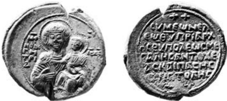
Печат Симеона II, антиохијског патријарха, прва половина XIII века

путањама литије пише у свом опису Цариграда и Добриња Јадрејкович око 1200 – будући новгородски архиепископ бележи да је икона Одигитрије ношена широм престонице до најудаљенијих четврти на Златном рогу, у део града који је носио име по патрикију Петру (τὸ Πετρίον) и у Влахерне. 287