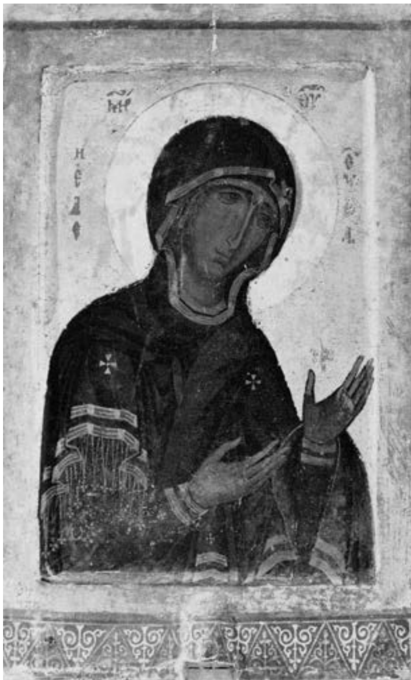
Литијска икона Богородице Елеусе, испосница Светог Неофита на Кипру, 1182/3