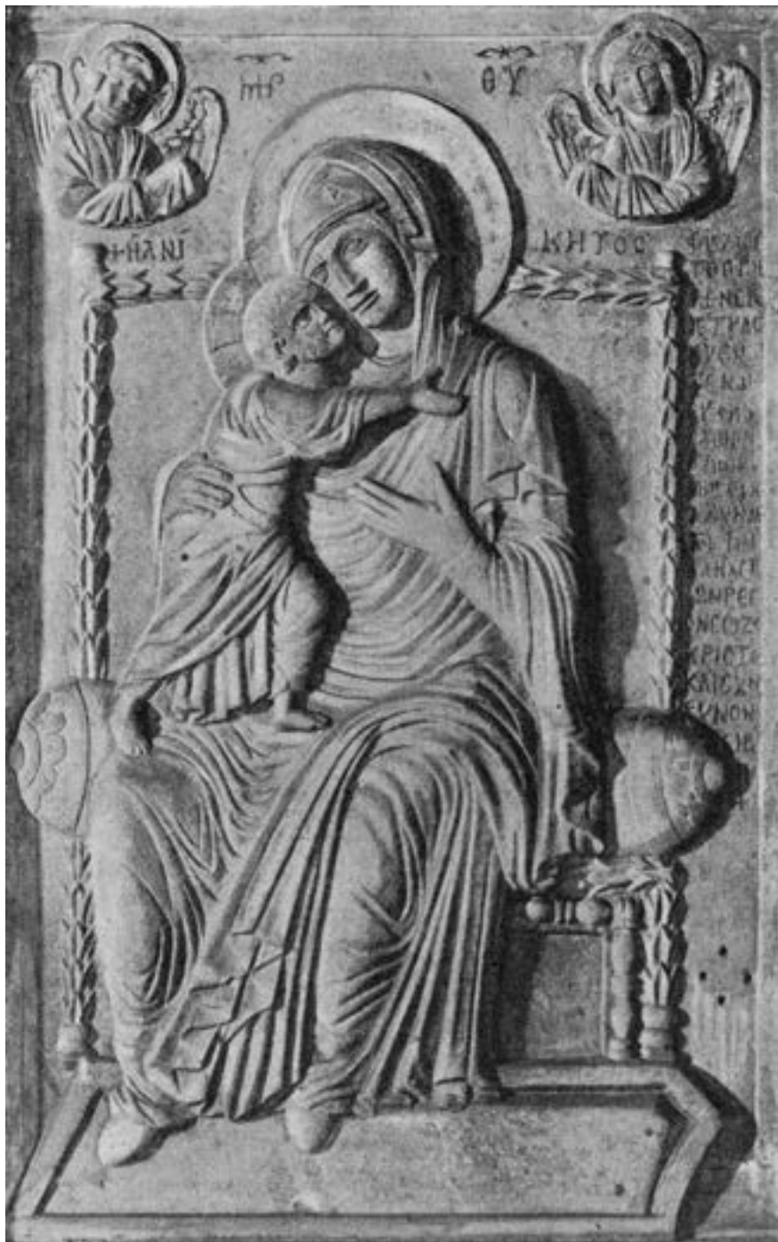
Богородица Непобедива, Свети Марко у Венецији, XIII век