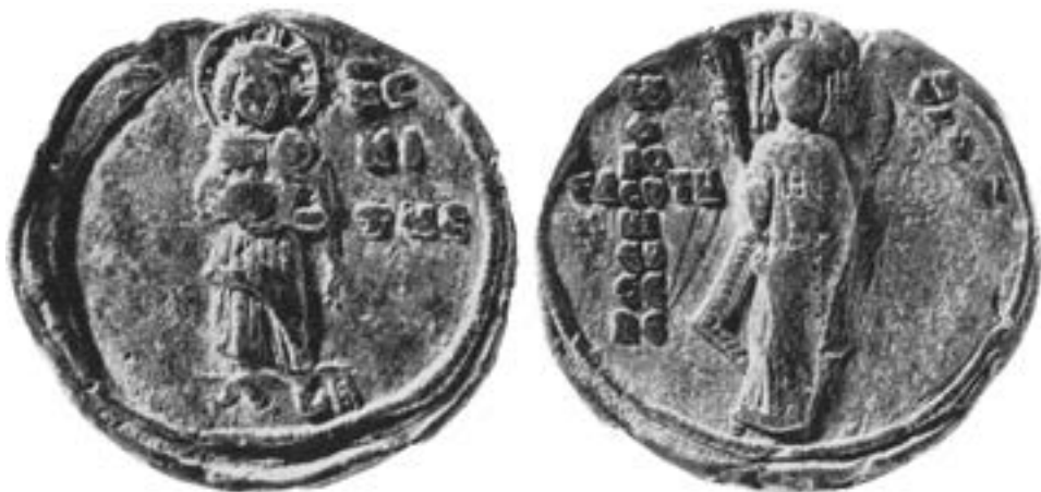
Печат царице Ефросине Дукене, супруге Алексија III Анђела (1195–1203)