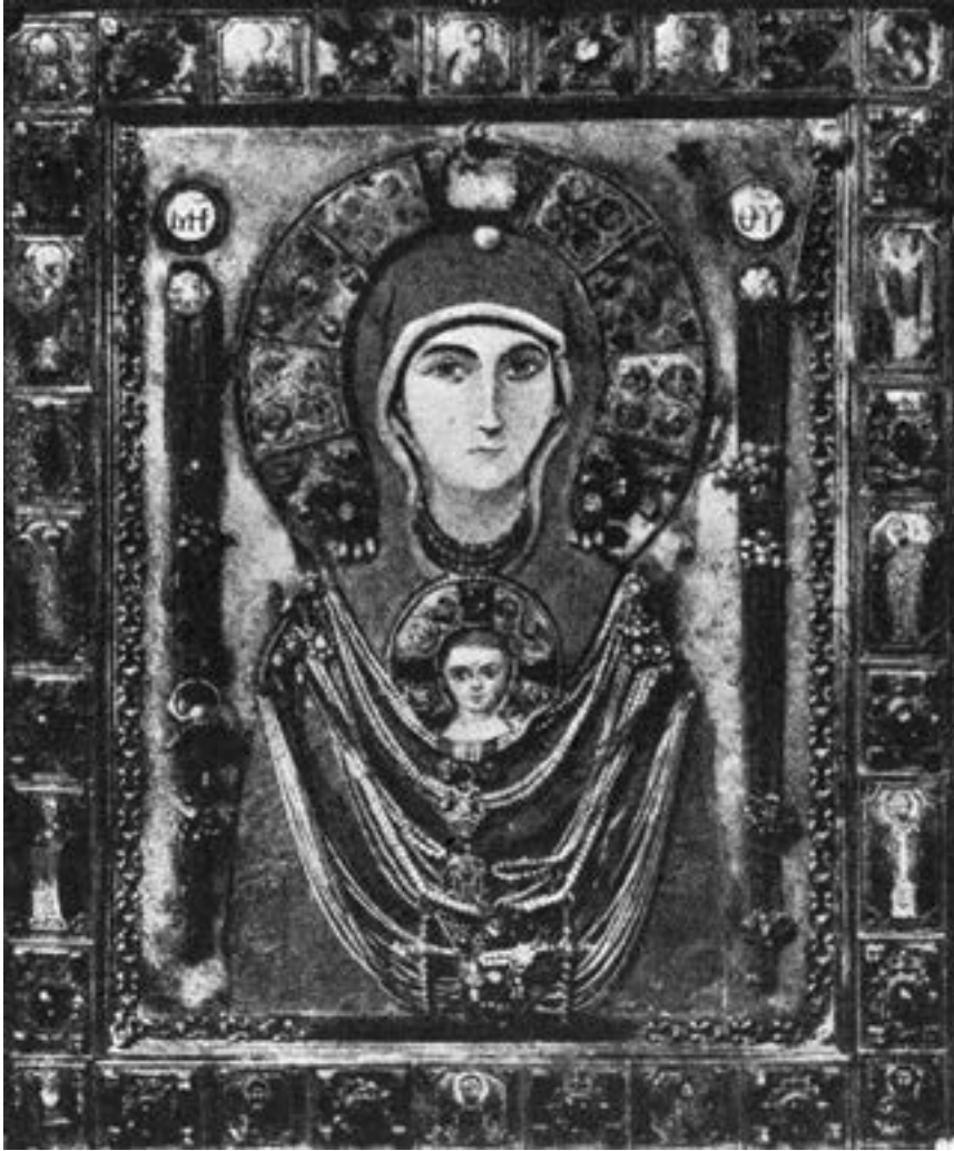
Стара фотографија иконе из Светог Марка

са натписом изведеним у емаљу ΜΝ(ΤΗ)Ρ Θ(Ε)Υ и драгим камењем које је красило нимбове сасвим је прекривала позадину око Богородичиног попрсја. 367