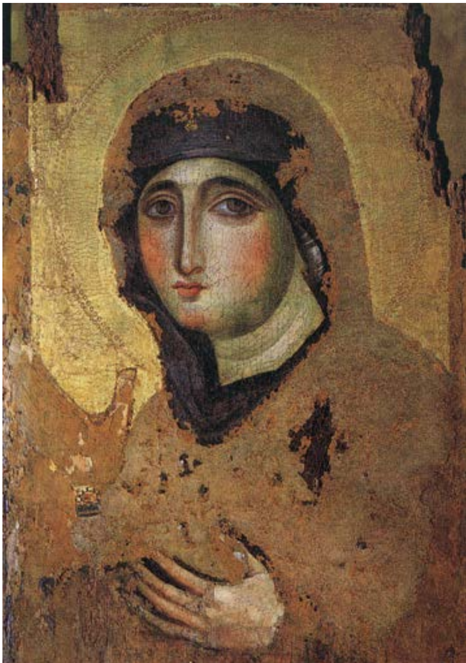
Богородичина икона из римске цркве Santa Maria del Rosario, почетак VIII столећа