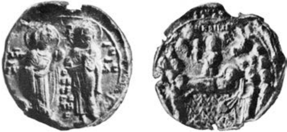
Печат из збирке Лихачева, Санкт Петербург, XII столеће

епиграма очувана у препису, 416 њен други ктитор, поменути Јован Комнин, потоњи монах Игњатије, придружио је манастиру приликом обнове почетком XII века, и очеву кућу у суседству. Тада подигнут манастирски католикон до данас је очуван под именом Ђул џамије, на обали Златног рога, у старој градској четврти τὰ Δεξιοκράτους. 417 Андроник II Палеолог је манастир поклонио као метох александријској патријаршији, 418 чији су представници у њему одседали неколико наредних деценија, најкасније до априла 1370, када је после више спорова, манастир враћен под јурисдикцију васељенског патријарха. 419 У оба престоничка манастира, нарочито поштована Христова представа могла је бити изведена на дасци или на зиду. 420