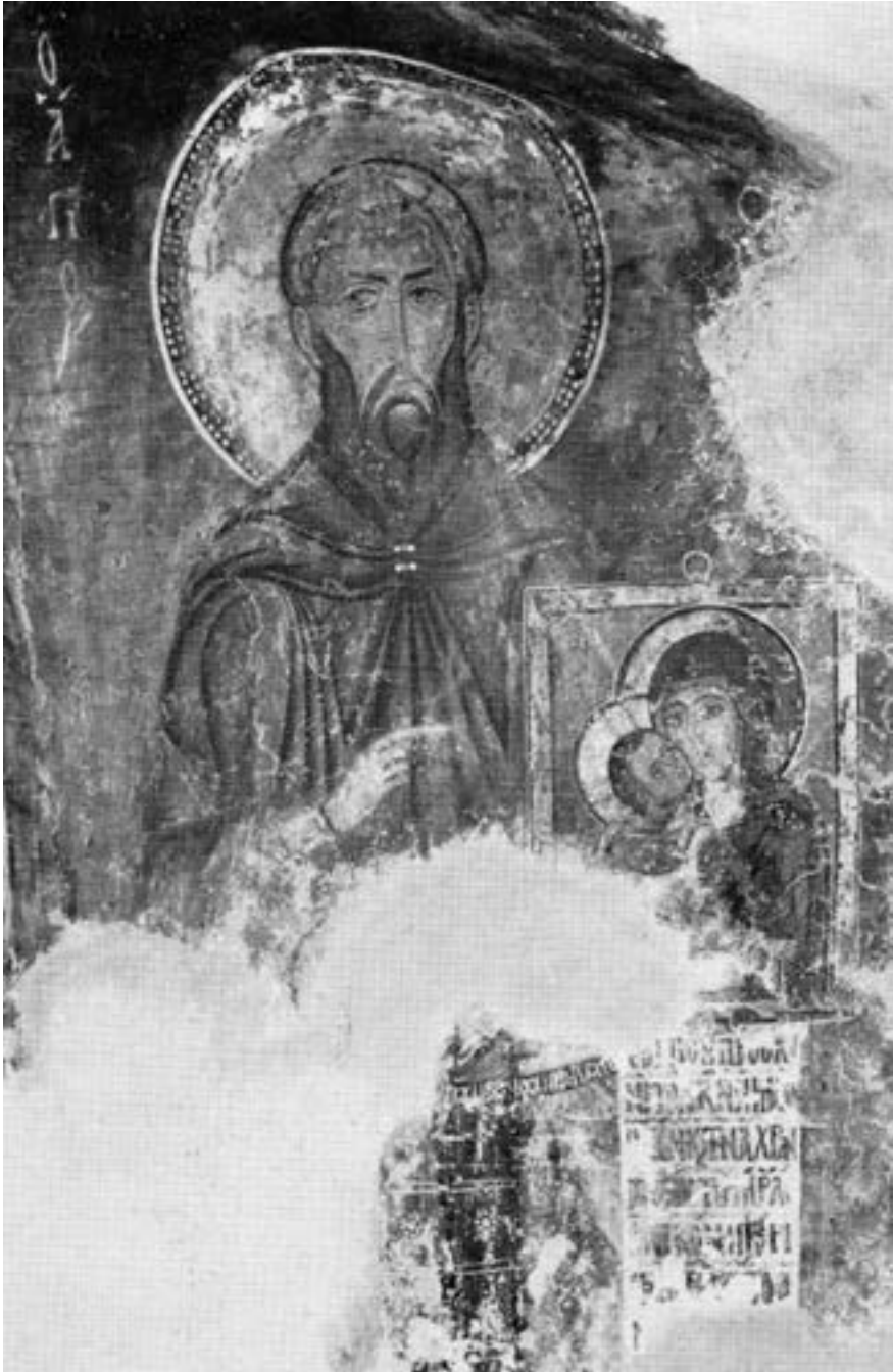
Свети Стефан Нови, фреска уз олтарску преграду Неофитове испоснице, 1195/6