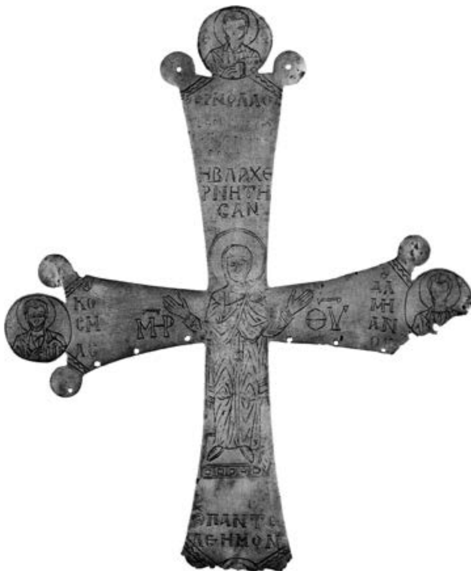
Литијски крст, XI век

бројном пратњом тајно улази у влахернски храм, где се по отпеваним химнама и усрдним молитвама, поново одиграло убичајено чудо , а василевс с добром надом потом кренуо у рат. 177 Исто сведочи и житије светог Кирила Филеота. Према сопственом казивању, овај побожни