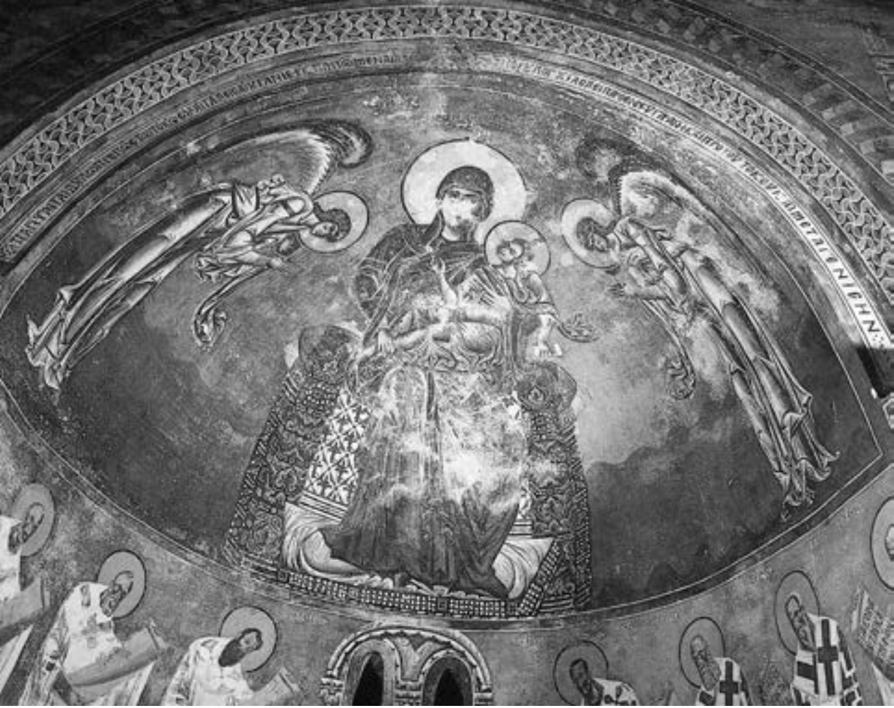
Олтарска конха Светог Георгија, Курбиново, 1191

синодалном акту помиње као почивши. У акту патријарха Матеја I, издатом око 1400, налази се помен још једне иконе која је уживала нарочито поштовање и била предмет поклоњења (просκύνημα), а такође непозната из других извора. У питању је икона Богородице τῆς Μαυκοῦριωτίσσης, која се чувала у једној од цариградских цркава посвећених светом Димитрију. 452