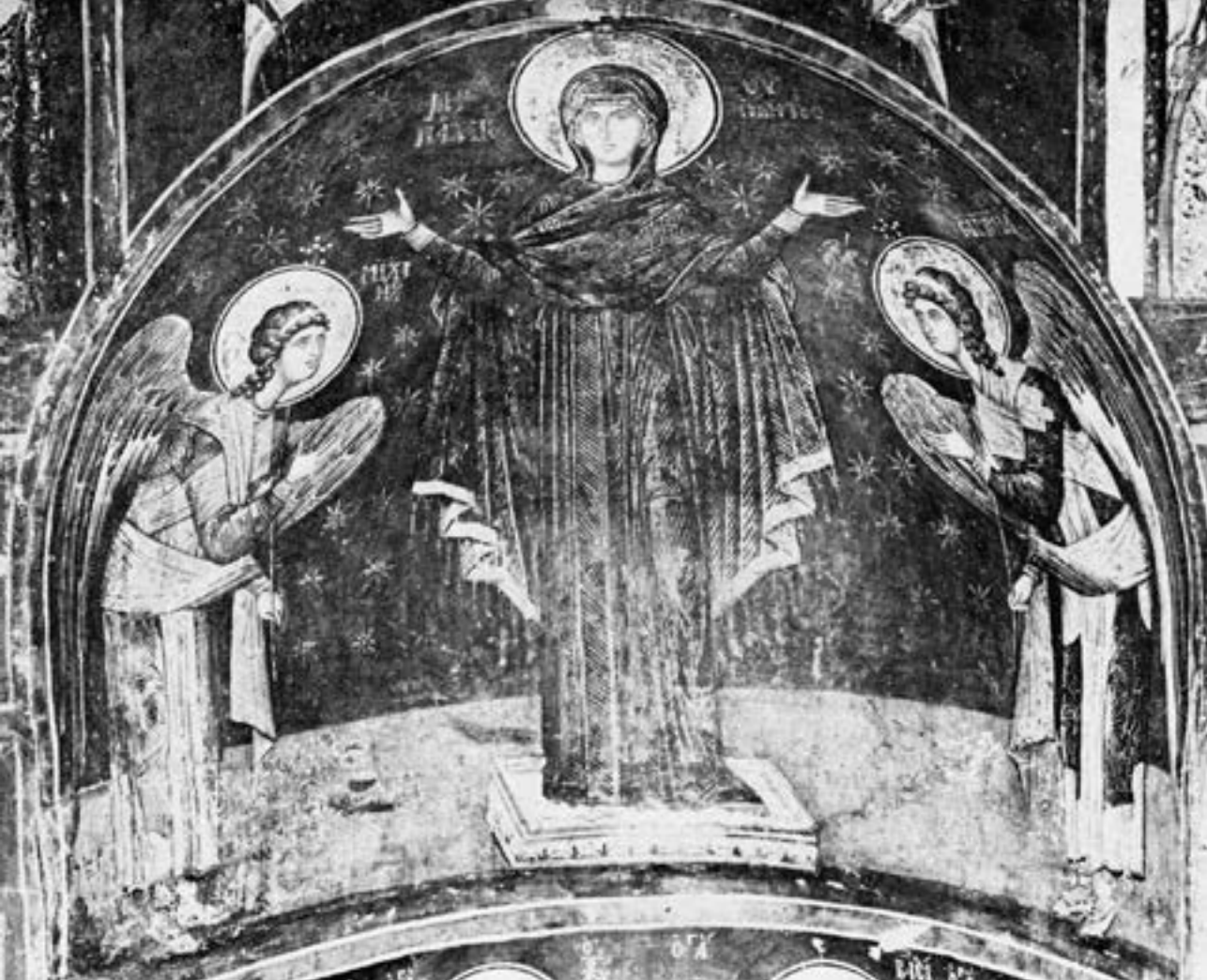
Полукалота олтарске апсиде Светог Николе Орфана у Солуну, 1310–1320

тичког музеја у Атини (XIII век). 527 Култ Нерукоѿворене Богородице 528 се ширио из познатог светилишта τῆς ἀχειροποιήτου у Солуну, које се под овим именом у писаним изворима први пут јавља код Кантакузина, 529 а његово порекло објашњава беседа коју је, највероватније у шестој деценији XIV века, уочи празника светог Димитрија у овој цркви одржао познати солунски правник, Константин Арменопул. Представа Богородице са Христом у наручју се на чудесан начин преобразила у Богомајку која уздигнутих руку призива Сина Господњег. 530 Богороди-