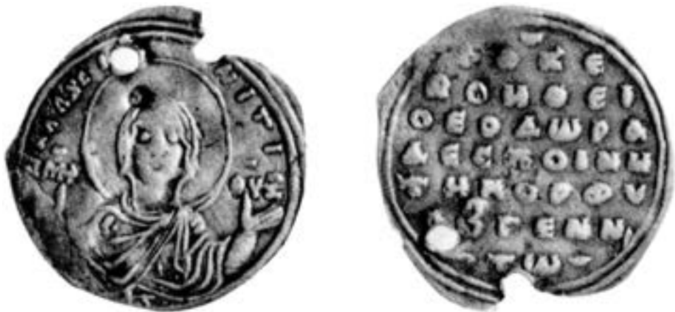
Сребрни милиарсион царице Теодоре (1055/6)