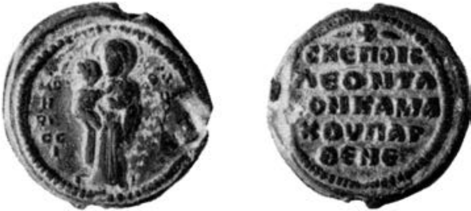
Печат Лава, митрополита Камаха, око 1082