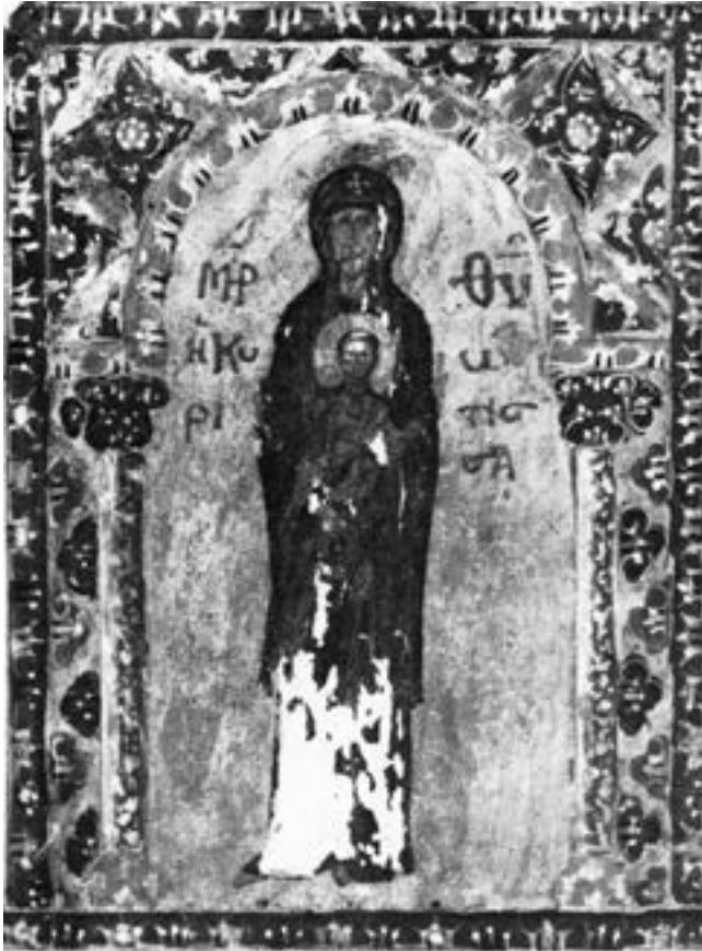
Минијатура из псалтира венецијанске Марџијане (cod. gr. 565, fol. 50v), прва половина XII века

руку свештенослужитеља. 350 Над главним улазом у есонартекс храма налазила се још једна представа Кириотисе. 351 Изнад Богородичиног