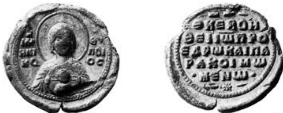
Печат Јована, проедра и паракимомена, XI век