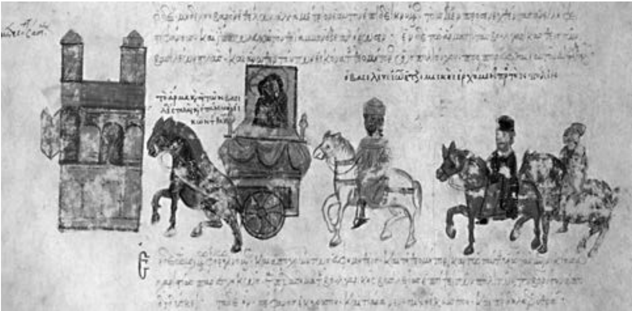
Тријумфални улазак василевса Јована Цимискија у престоницу, мадридски рукопис Историје Јована Скилице (fol. 172v), почетак XIII века

ријском походу Романа III Аргира на Алепо у лето 1030, исти писац сликовито описује расуло које је захватило ромејске одреде после првог сукоба са сараценским ратницима. У паници напуштен војни табор, скупа са царским шатором препуним разних драгоцености, опленили су војници алепског емира, а спас у бекству према Антиохији морао је да потражи и сам василевс. Као највећа вредност, једино је спашена Богородичина икона, за коју Псел каже да је ромејски цареви са собом носе у свим ратним походима као предводницу и заштитницу целе војске. 91 И док су још средином X столећа, у строго утврђеном