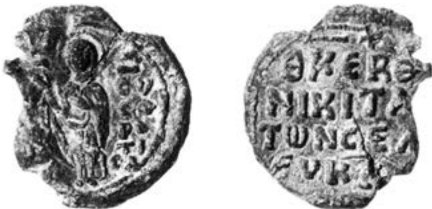
Печат Никите, митрополита Селевкије исавријске, XI столеће

нарочито поштованог Богородичиног лика сачувана на већ поменутој синајској икони. 242