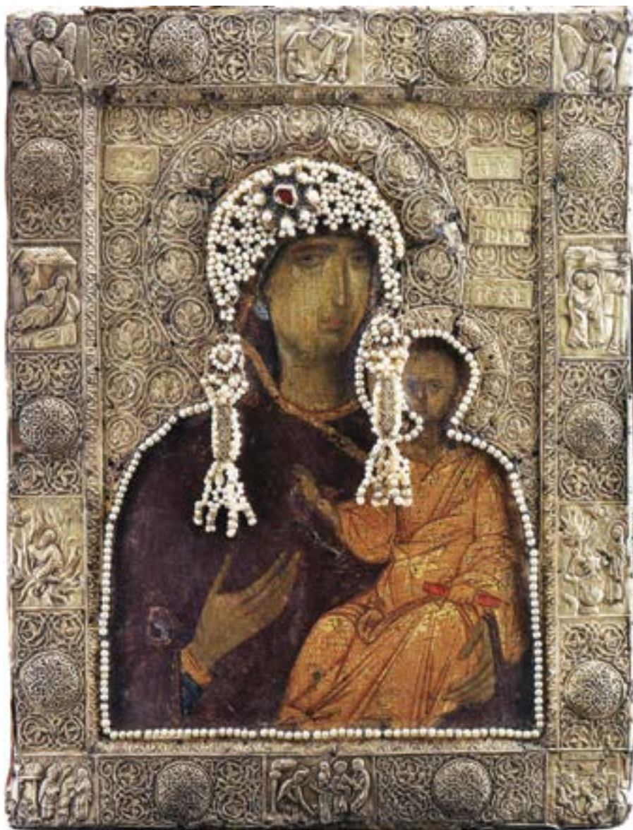
Икона из Благовештењског сабора московског Кремља, друга половина XIV века

Михаило и Гаврило, у ниши на северној фасади цркве Светог Николе у селу Зрзе, 270 а исти ликови се налазе и на предњој страни иконице од