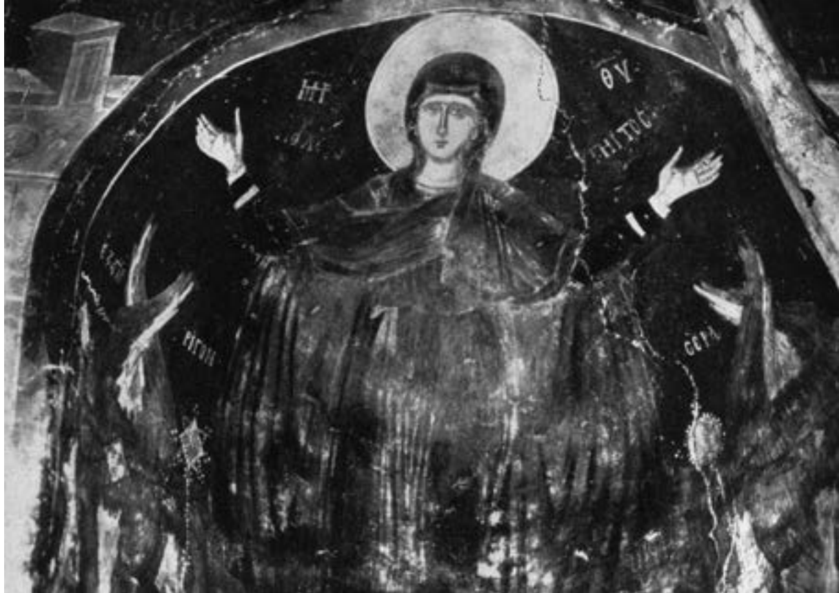
Олтарска конха костурског Светог Николе τοῦ Κυρίτζη, крај XIV столећа

Василевс Андроник II Палеолог је престонички манастир Богородице τῆς Ψυχωστρίας даровао архиепископу Прве Јустинијане и целе Бугарске Григорију, 535 који је на трону охридске цркве поуздано био између 1313/4. и 1327. Ктитор двокуполног спратног ексонартекса Свете Софије у Охриду наручио је из престонице две велике литијске иконе за своју архиепископију, 536 Богородицу са Христом на левој руци сигнирану као η ΨΥΧΟΣΤΡΙΑ којој се клањају арханђели Михаило и Гаврило, са Благовестима на полећини (94,5x80,3) – вероватно репли-