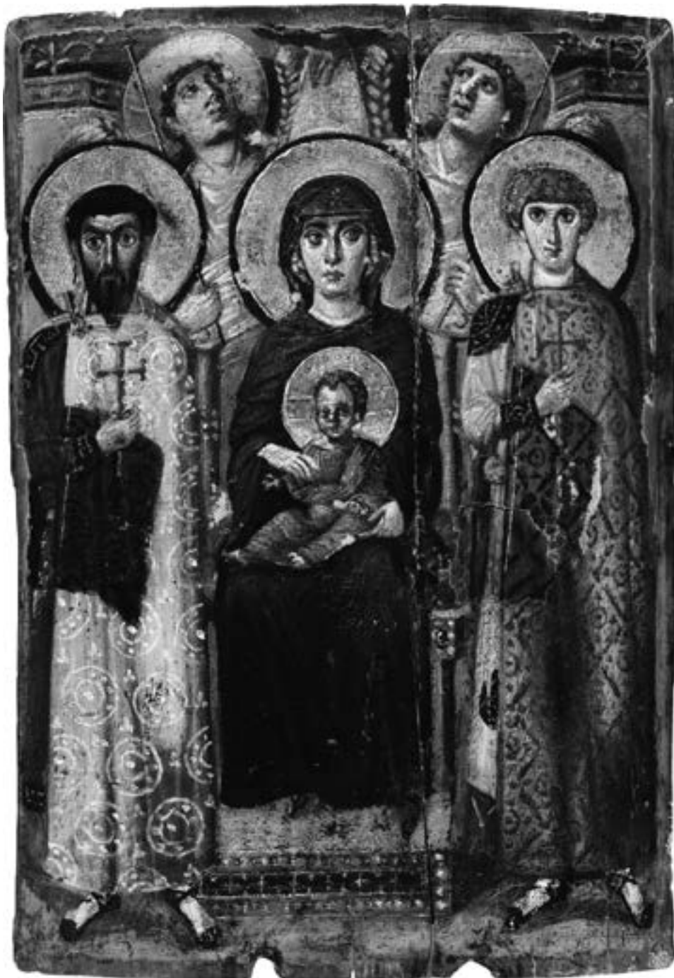
Икона Богородице са Христом, светим Теодором и Георгијем, Синај, VI столеће