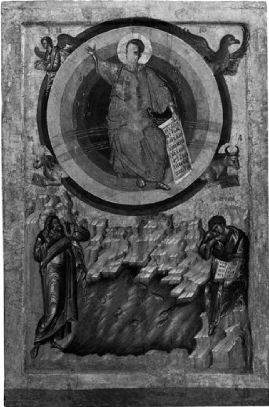
Полеђина литијске иконе василисе Јелене из Поганова, крај 1371