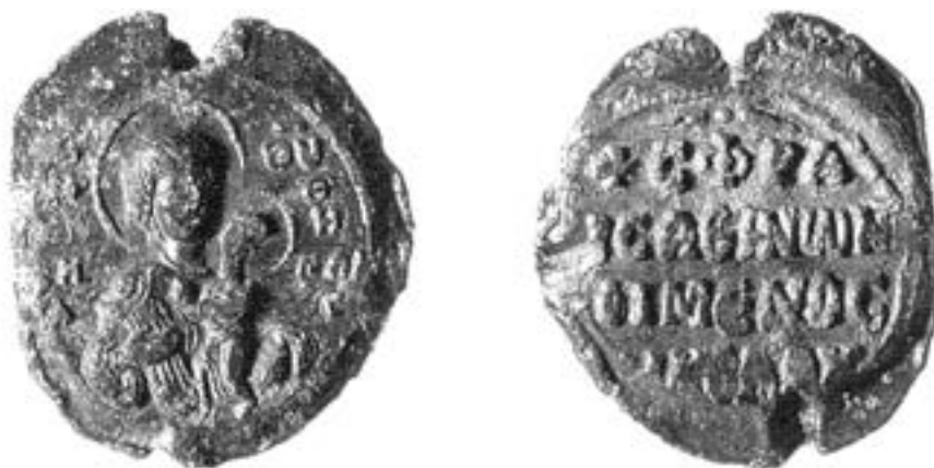
Печат митрополита Атине Николе Агиотеодорита, 1160–1175

камењем још се 1394/5. чувала у седишту атинске митрополије, у древном Партенону, у параклису десно од олтара. 429