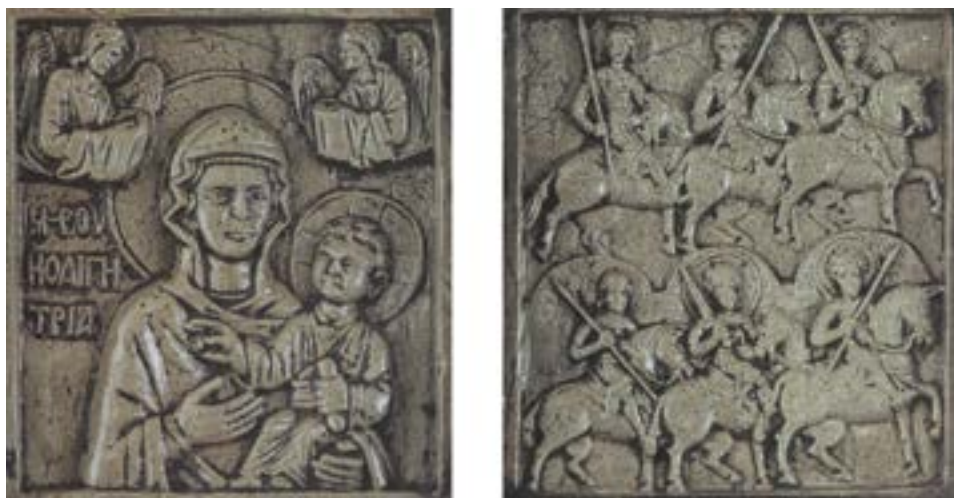
Двострана иконица од стеатита, Ватопед, крај XIV столећа

Култ иконе Богородице Одигитрије у потпуности је уобличен до друге половине X столећа, 281 у житију свете Томаиде Цариградске, 282 написаном за владавине Романа II (959–963), манастир се назива по икони ... τῶν Ὁδηγῶν (τῆ νῦν καλουμένη Ὁδηγητρία) σηκῶ, која је уторком, рано изјутра, ношена у литији. 283 Према двојници анонимних ходочасника са Запада из XII столећа, икону Богородице чији епитет они преводе са deducatrix (путеводитељица), и на којој је Мајка представљена са Христом у наручју, насликао је свети апостол Лука. 284