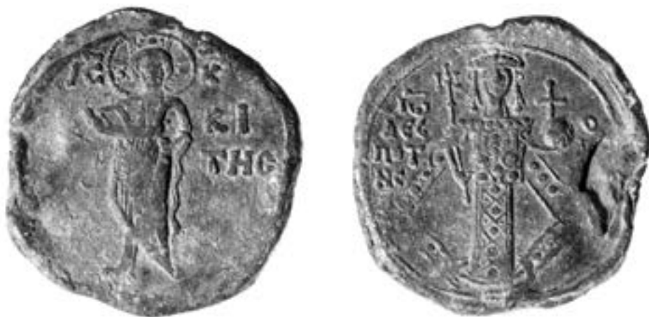
Печат Јована III Ватаца (1222–1254)

сликан како десницом испред својих груди даје благослов, док у левој руци држи отворену књигу са добро познатим јеванђеоским речима ΕΓΩ ΕΙΜΙ ΤΟ ΦΩΣ ΤΟΥ ΚΟΣΜΟΥ Ο ΑΚΟΛΟΥΘΩΝ ΕΜΟΙ ΟΥ ΜΗ ΠΕΡΙΠΑΤΗΣΗ ΕΝ ΤΗ ΣΚΟΤΙΑ ΑΛΛ ΕΞΕΙ ΤΟ ΦΩΣ ΤΗΣ ΖΩΗΣ (Јов. 8.12–13). 231 На сувреним и нешто млађим оловним печатима Христос држи затворени кодекс. Најстарији поуздано датован печат припадао је августу Ефросини Дукени, 232