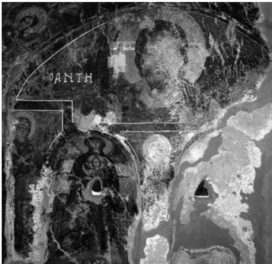
Богородичина црквица на североистоку Китире, крај XIII столећа

ексонартекса, на основу стилских одлика и портрета цара Стефана, супруге му Јелене и њиховог сина, које је још почетком XIX века на једном од зидова унутрашње припрате видео француски путописац Кузинери, датује се у деценију која је уследила српском освајању Сера 1345. године. 163 Уз олтарску преграду јавља се још једном, у древној солунској