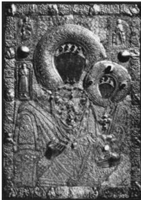
Богородица Артокоста, Венеција, друга половина XIV века