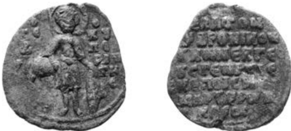
Свети Георгије Купериот на печату севаста Андроника Дуке, позни XII век