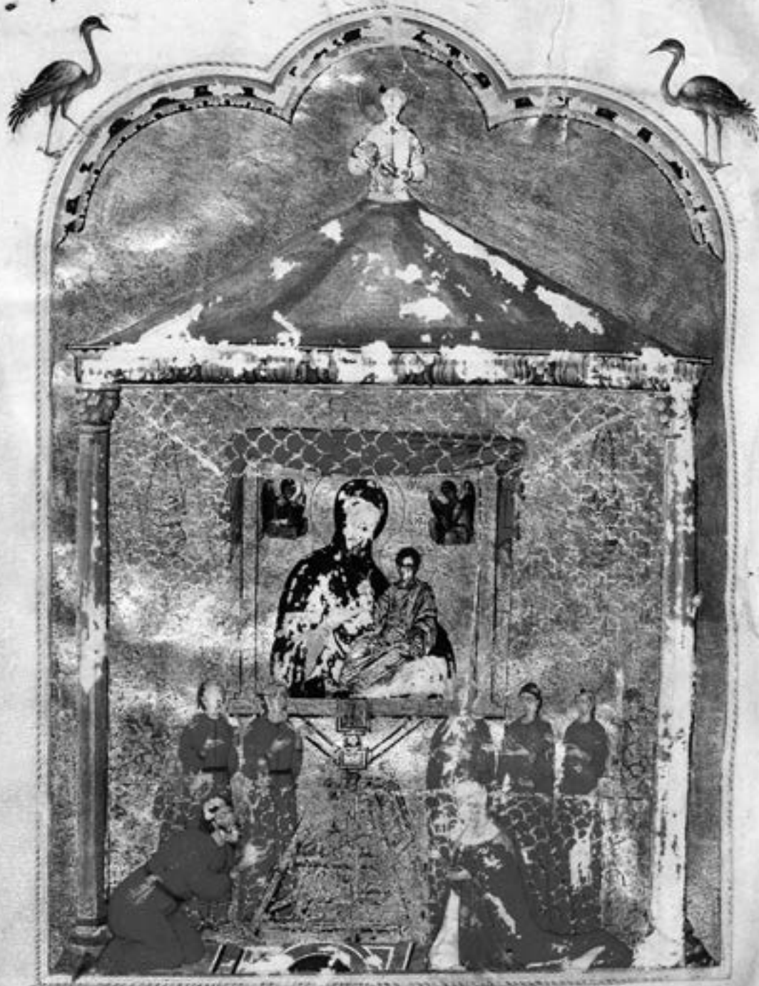
Поклоњење икони Богородице Одигитрије, Хамилтонов псалтир (fol. 39v), око 1300