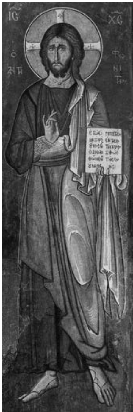
Лагудера на Кипру, 1192

Лава Афтенда, католикону манастира Богородице του Αρακος , крај Лагудере, на северним обронцима планине Троода, на Кипру. 152 Христу се са североисточног ступца обраћа Богородица Елеуса, која у руци носи развијени свитак са текстом добро познате заступничке молитве, 153 док је са јужне стране, такође у првој зони, поред Христа насликан патрон храма – Мати Божија η Αρακιότησσα κε Καίχαριτομένη , као најстарији сачувани пример иконографског типа Богородице Страсне, са надахнутом молитвом ктитора, исписаном с обе стране њене фигуре, односно престола. Пред крај рOMEЈСКЕ власти на острву, у доба самозваног кипарског цара Исака Комнина (1184–1191), 154 може се датовати и старији слој зидних слика у цркви Христа Антифониота, смештеној на падинама Киренијског масива које се спуштају према морској обали, неких тридесетак километара североисточно од Никозије. 155 Овај католикон