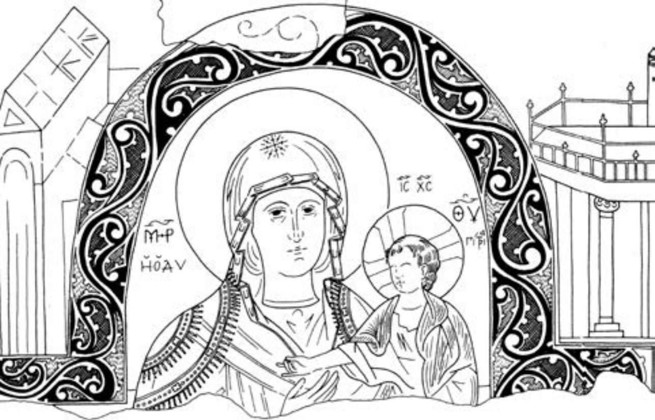
Фреска изнад улаза у наос Богородичине цркве, Доња Каменица, 1323–1330