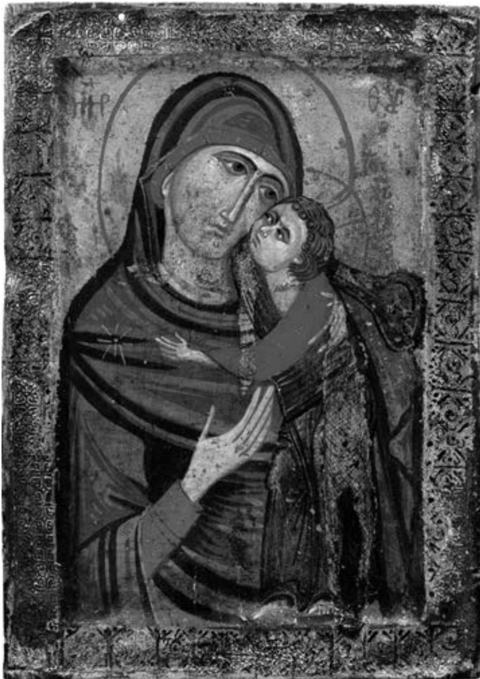
Икона из синајске збирке, XIII век