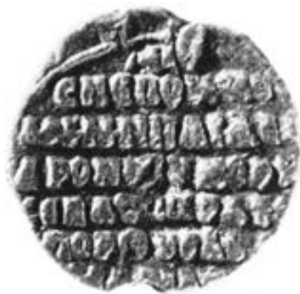
Печат Марије Комнине, синовице Манојла I (1143–1180)