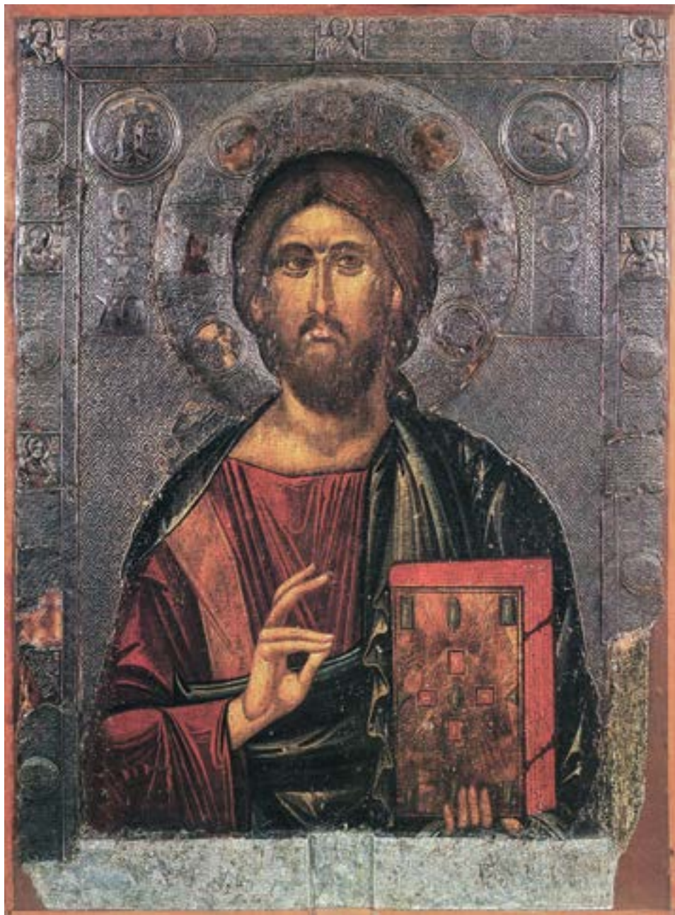
Литијска икона Христа Душеспаситеља, Охрид, око 1320