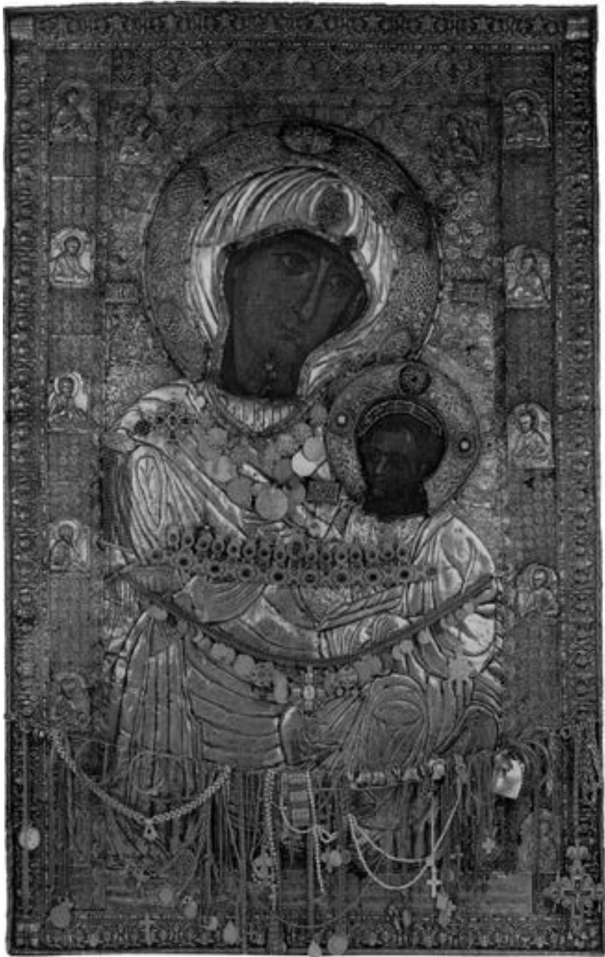
Богородица Портаитиса, Ивирон, XI столеће