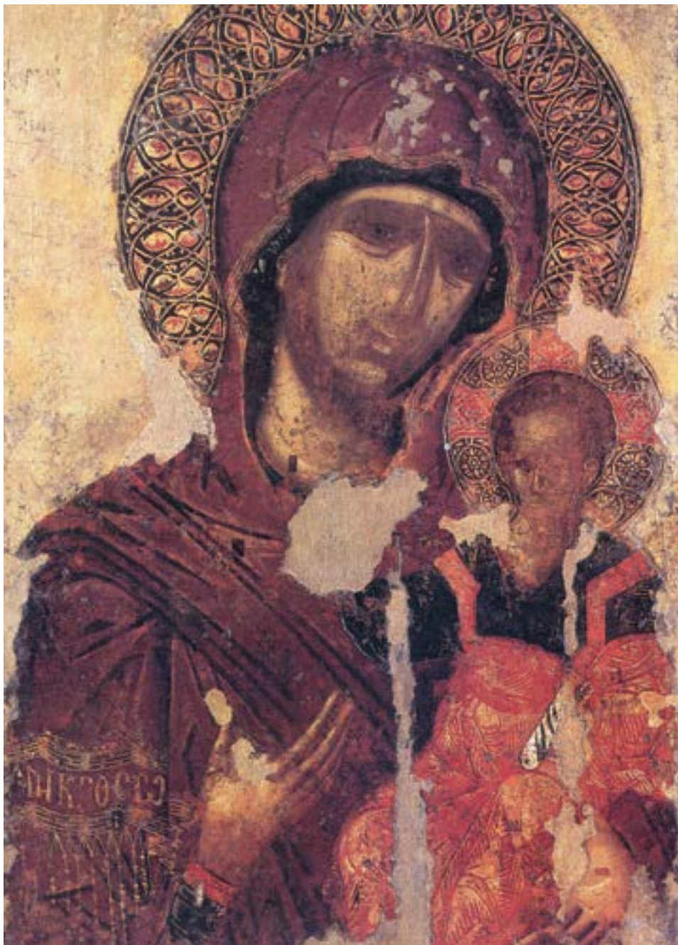
Панагија Димосијана, Крф, крај XIV века