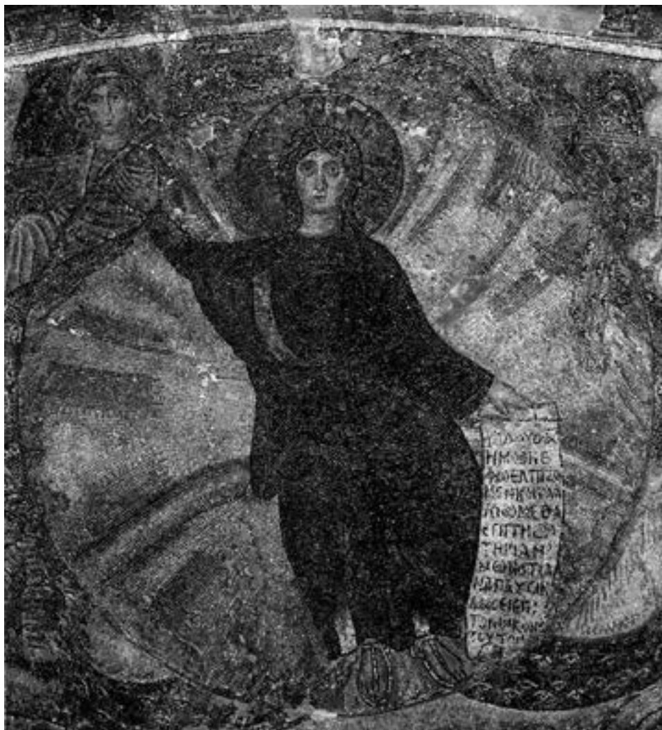
Исус Христос, средишњи део солунског мозаика

леве и десне стране светлосне ауре, те високо уздигнута Христова десница, такође се као мотиви срећу у Исаијиној апокалиптичној визији. 105 Композиција је уобличена на основу текста још једног великог пророка, Језекиља и његовог виђења Бога у слави на реци Хо-