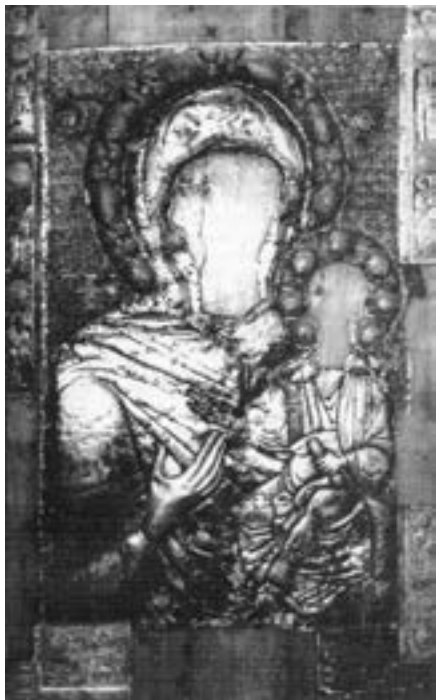
Метална оплата Богородице Икосифинисе, XIV–XIX столеће