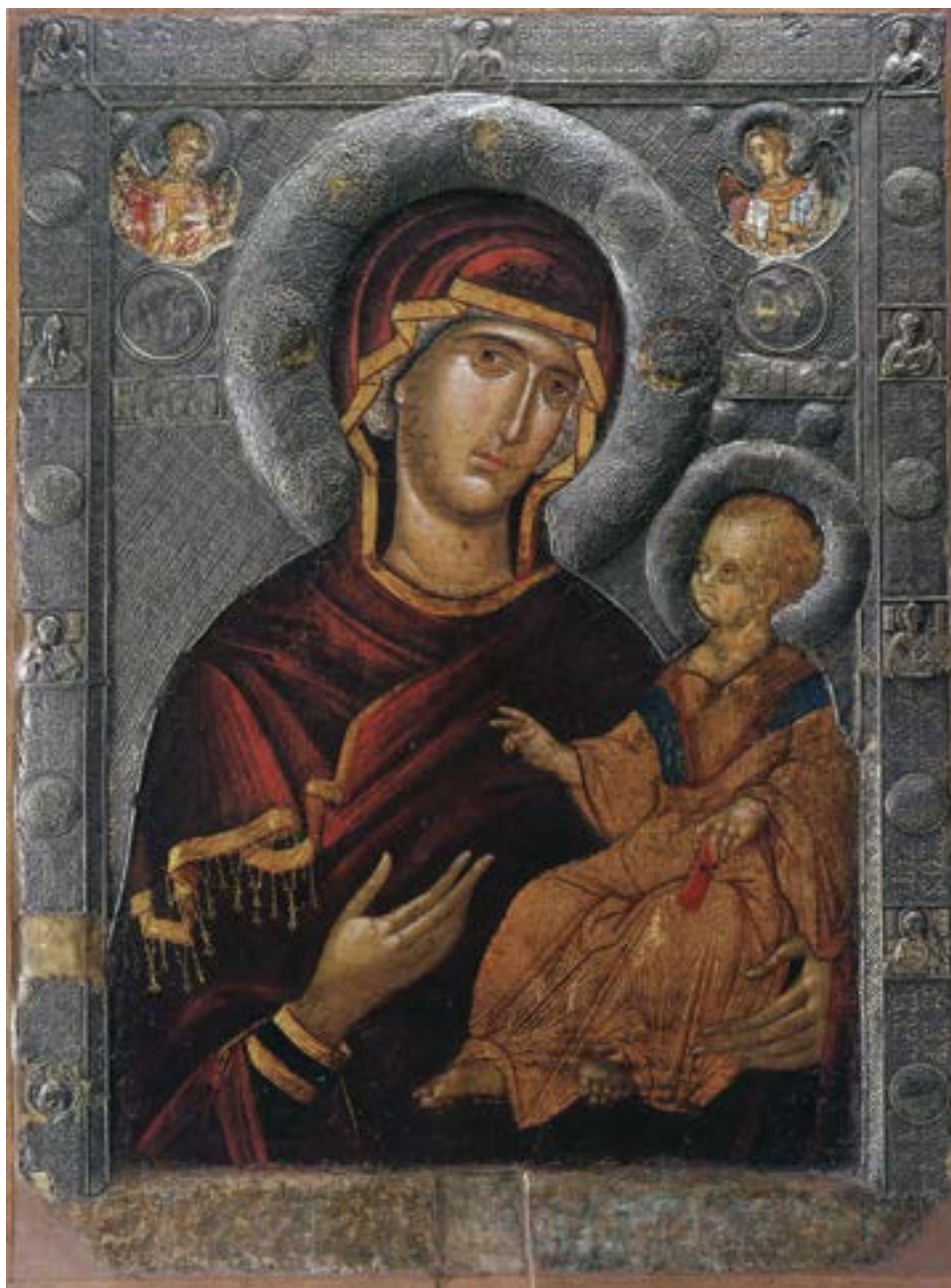
Литијска икона Богородице Психострије, Охрид, око 1320