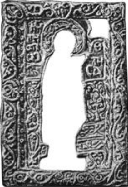
Погрешно отиснута оплата за иконицу Агиосоритисе, Свети Марко у Венецији