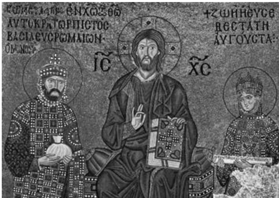
Исус Христос, василевс Константин IX Мономах и августа Зоја, јужна галерија Свете Софије у Цариграду, 1042–1055

Приповест је, по Евергетидском синаксару, 132 читана одмах после легенде о икони из Бејрута, 133 на јутрењу у Недељу православља, прве недеље ускршњег поста. 134 Постоји неколико верзија ове приповести, од којих је најстарија сачувана у већ помињаном латинском опису цариградских светиња, који је почетком XII столећа саставио анонимни енглески ходочасник. 135 За највећу драгоценост цркве Богородице Халкопратијске аутор је сматрао представу Христа – supra in altare , највероватније мозаик, у полукалоти олтарске апсиде параклиса посвећеног Спаситељу.