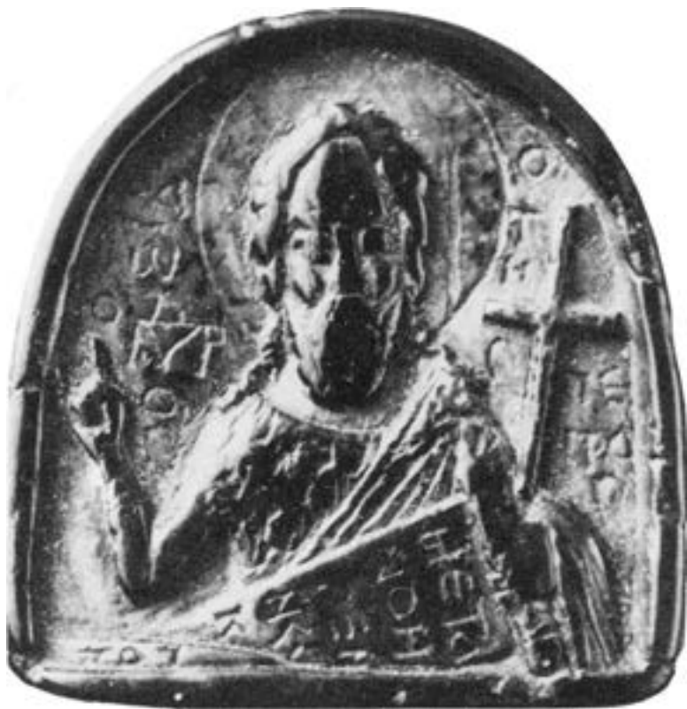
Иконица од црног стеатита, XIII столеће

чин лик, с правом се може претпоставити да их је насликао мајстор из Цариграда, у последњој четвртини XIV века, пре погибије наручиоца и ктитора манастира краља Марка, на Ровинама 17. маја 1395. 544 На хипотезу да је Претечина икона реплика нарочито поштоване слике патрона престоничке обитељи упућује готово истоветна представа на