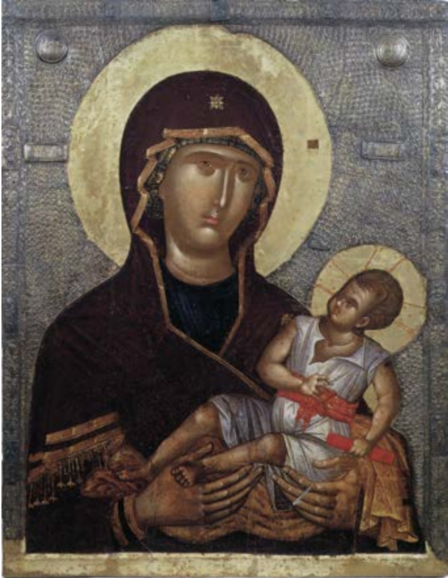
Престона икона Богородице Психосострије, Охрид, после 1334

ка патроналне иконе престоничке обитељи, 537 и као њен пандан икону допојасног Христа са натписом Ο ΨΥΧΟΣΩΤΗΣ и Распећем на полеђини