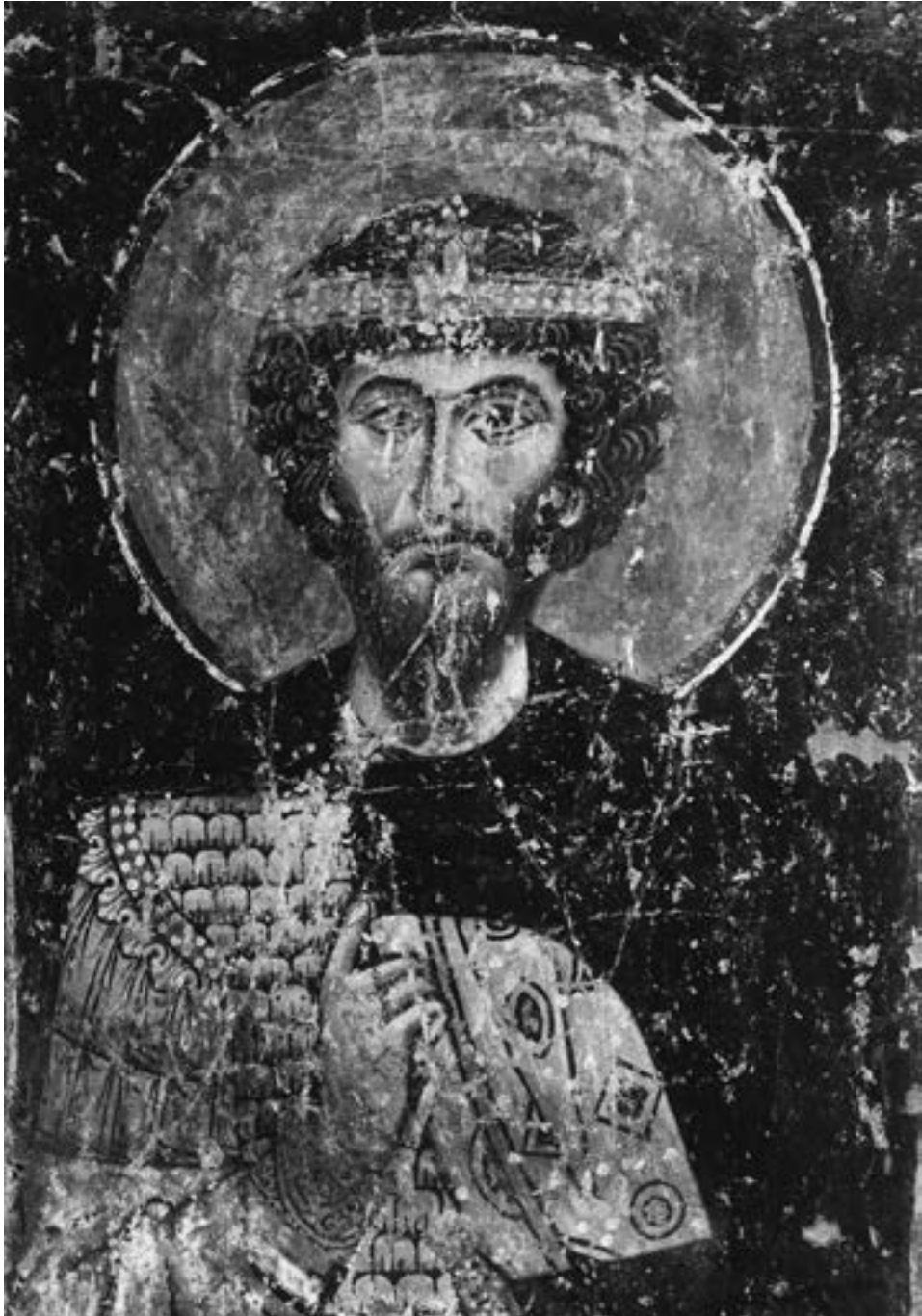
Свети Теодор Стратилат, Космосотира у Вири, 1152