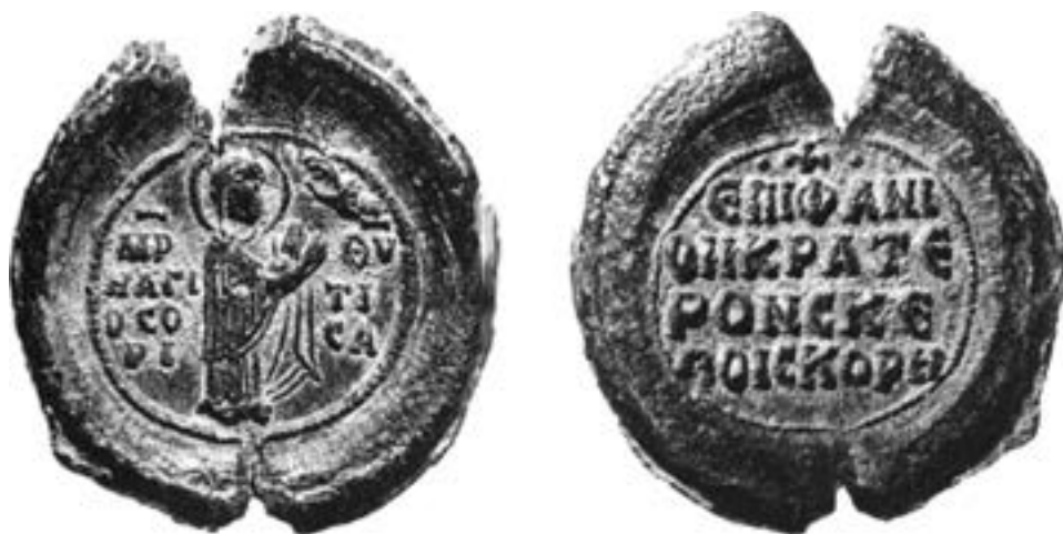
Печат Епифанија Кратера, XI столеће

енкомиону монаха Евтимија из 887/8, 243 настао по жељи цара Аркадија (395–408), 244 док је по познатој легенди о проналаску Богородичиног ма-