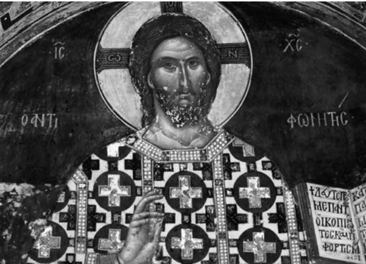
Католикон манастира Светог Јована Претече код Сера, средина XIV века