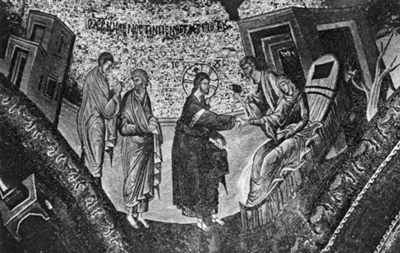
Исцељење Петрове таште, нартекс Хоре, око 1320

вобитни зидни украс око саркофага, чије је извођење средином друге деценије XII столећа наручио Алексијев син Исак. Само је нека тешка, из извора незнана болест могла натерати младог кесара, који је тек закорачио у трећу деценију живота, 221 да размишља о свом гробу. Наду у оздрављење изразио је зидним сликарством. Централно место на источном зиду овог простора, намењено Христовом лику који је нешто пре тога исцелио оца наручиоца, 222 било је окружено представама излечења од разних болести, која су јеванђеоски текстови приписивали сину Господњем. 223