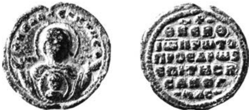
Печат протопроедра и царског ризничара Јована, XI столеће

човек је средином XI века, сваког петка, без обзира на доба године, пешачећи преваљивао између педесет и шездесет километара у једном правцу до Цариграда, 178 да би се у Влахернама поклонио Богородици и по свршетку вечерње враћао назад, у своје приморско село, Филеу, на црноморској обали. 179