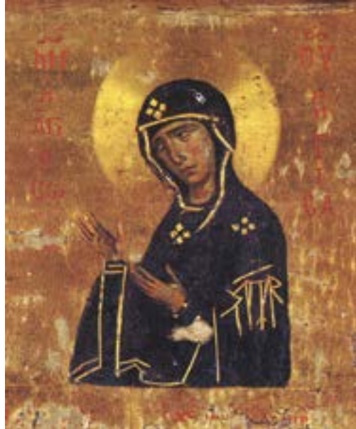
Детаљ са синајског хексаптиха

фориона, забележеној у грчком рукопису X века из париске Националне библиотеке (бр. 1447), израду другог реликвијара од чистог злата и украшеног драгим камењем, 245 с натписом τοῦτο τῇ Θεοτόκῃ προσκομίσαντες τὸ σέβας, τῆς βασιλείας ἠσφαλίσαντο κράτος, наручио царски пар василевс Лав I (457–474) и августа Вирина. 246 Црквени простори у којима су чувани у изворима су називани по овим реликвијарима, 247 те је на-