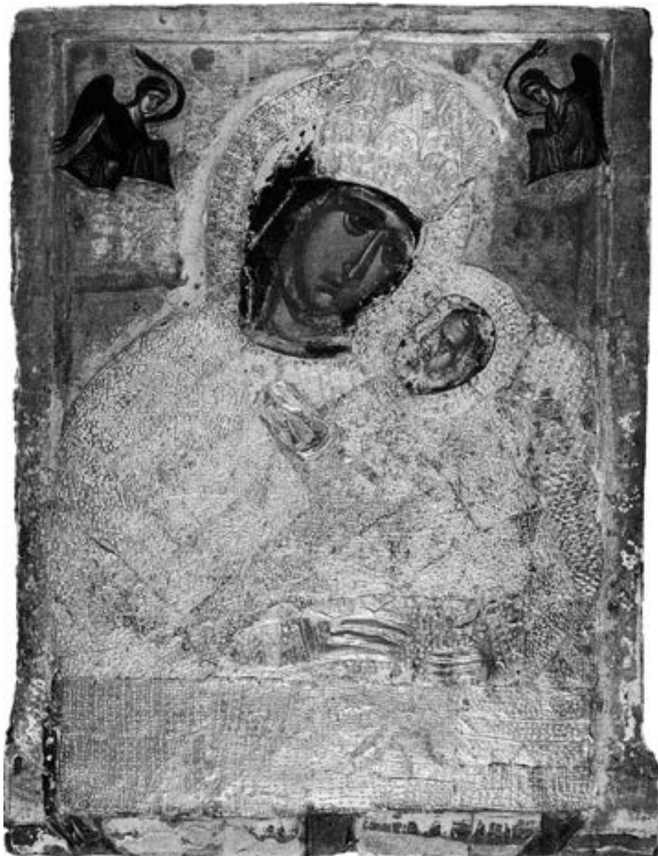
Литијска икона са Наксосу, друга половина XIV столећа

у Атени постојале две нарочито поштоване Богородичине иконе, в. стр. 235. Бојени слој на икони, услед вишевековне богослужбене употребе, данас је готово потпуно истрвен, а она смештена у нови оквир са металном оплатом из 1700. Манастир је