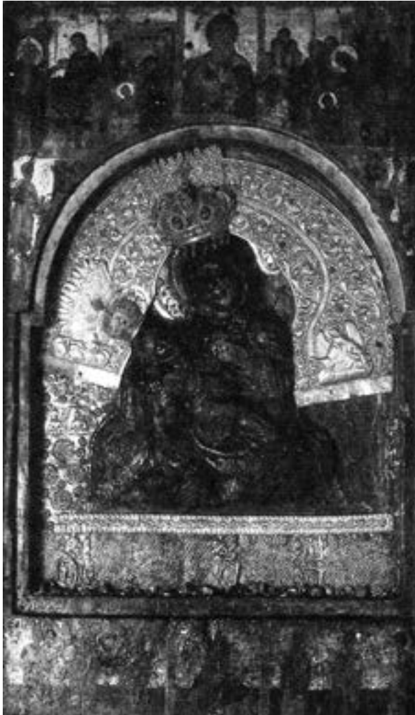
Богородица Мегаспилеотиса, друга половина XIII века

ге стране, на основу неколико истоветних оловних печата са стојећом Богородицом Орантом сигнираном као \text{H } \Theta\text{E}\text{O}\text{C}\text{K}\text{E}\text{Π}\text{A}\text{C}\text{T}\text{O}\text{C} на аверсу и светим ратницима у пуној ратној опреми Георгијем и Теодором на полеђини, 484 може се претпоставити да је и Бојом чувано сестринство, које