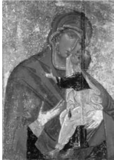
Богородица Толгска (III), почетак XIV столећа

икони Богородице Толгске из истоименог манастира под Јарослављем, данас у московској Третјаковској галерији. 196 Икона пронађена у олта-