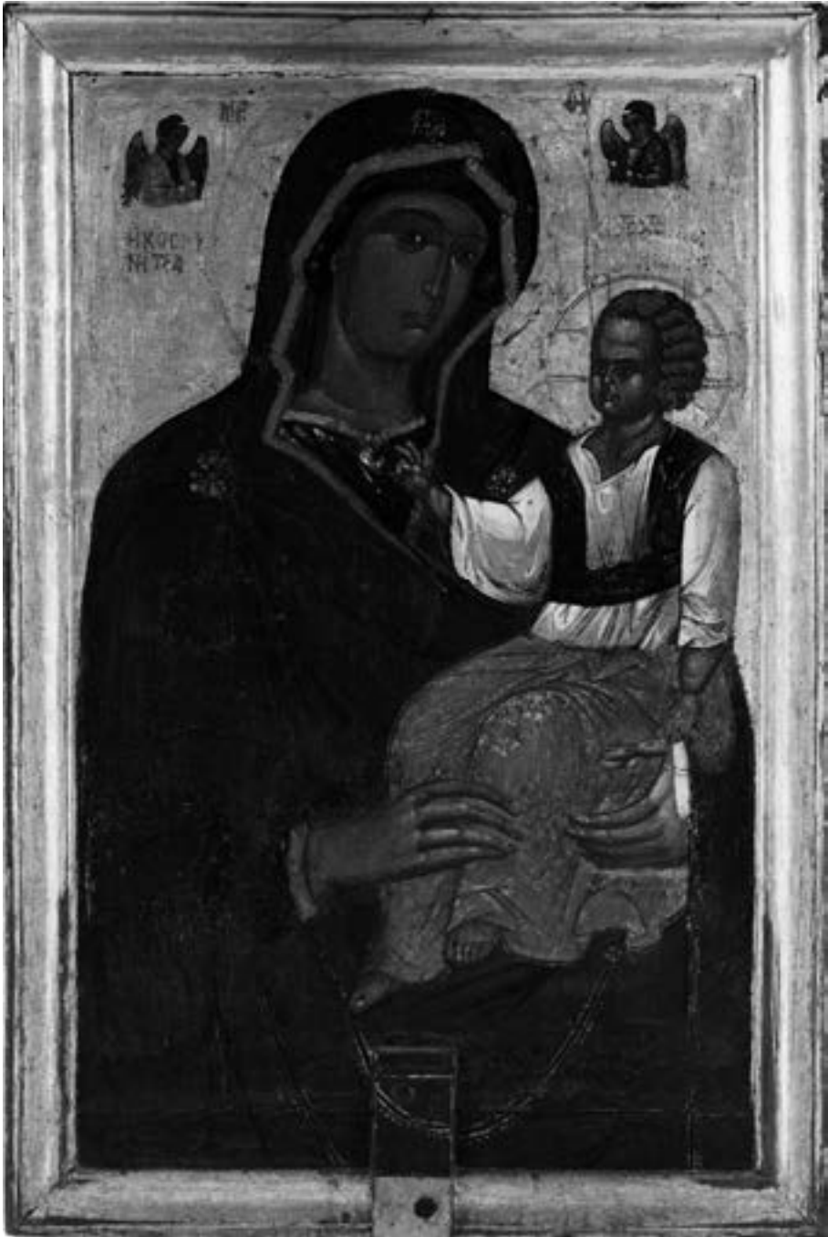
Литијска икона Богородице Косинице, Хиландар, друга половина XIV века