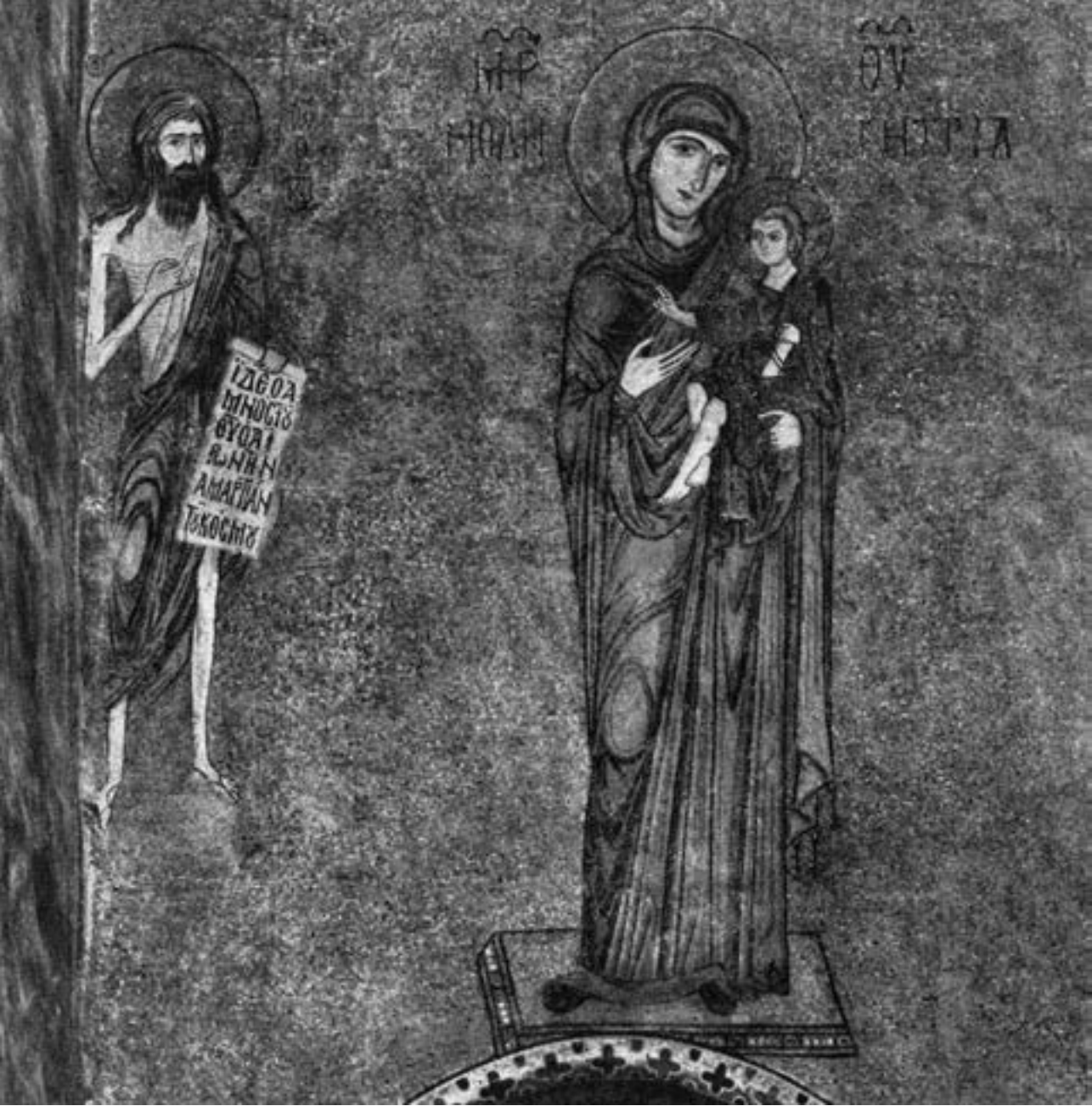
Мозаик изнад северне апсиде дворске цркве у Палерму, 1142/3

на Акрополита и супруге му Марије Комнине Торникине Акрополитисе, с краја истог столећа, из Третјаковске галерије у Москви, 261 затим