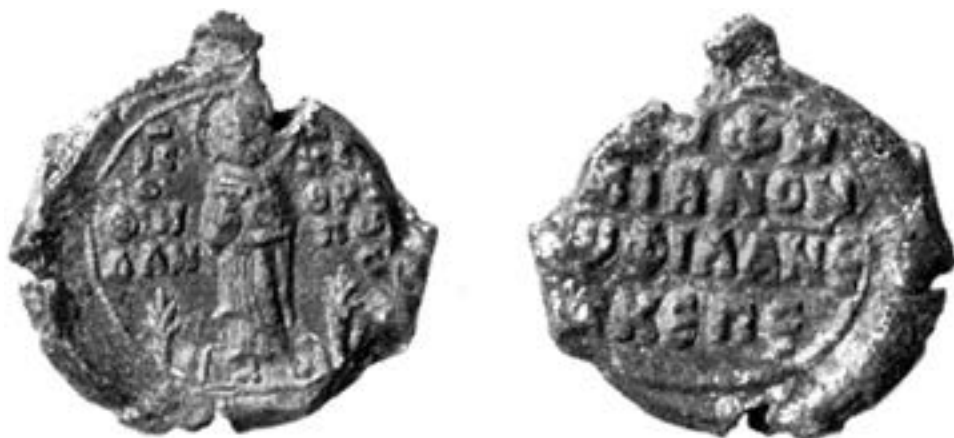
Печат Ефимијана из манастира Христа Филантропа, XII столеће