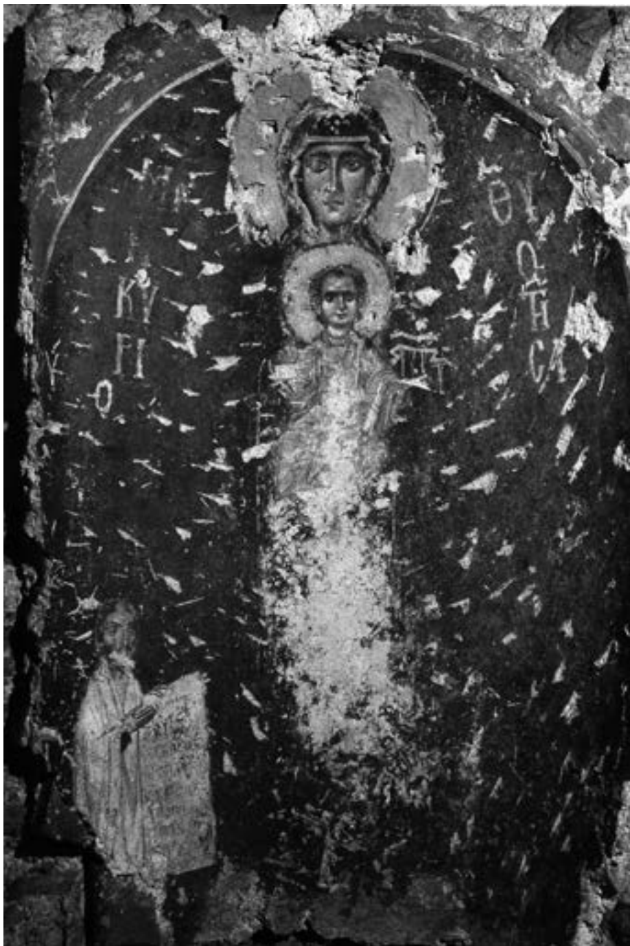
Фреска из Календерхане, средина XII столећа