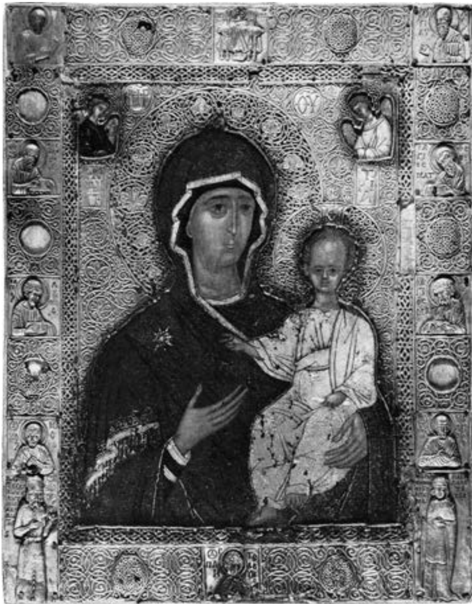
Икона Константина Акрополита и супруге му Марије, крај XIII столећа

дар Пападопулине својој сестри Аријанитиси – сачувана је само оплата од позлаћеног сребра, 263 и млађа, с краја истог века, у манастирској