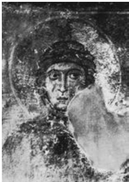
Света Теодора, нартекс солунске Свете Софије, друга половина XI века