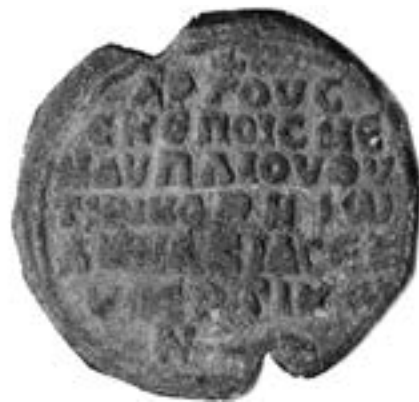
Печат Јована, митрополита Арга и Нафплија, око 1200

мозаична икона с почетка наредног века из Народног музеја у Софији, 262 две оковане иконе из ватопедске ризнице, старија с почетка XIV века,