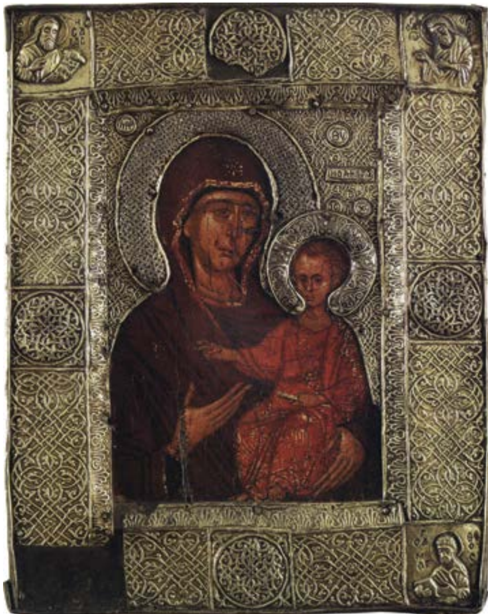
Богородица која истаче уље, Ватопед, крај XIV века

τῆς Πέτρας у Верији, а убрзо по смрти жене, Теодор 1328. прима монашки постриг у Ватопеду, у коме се, приложивши своју задужбину са свим њеним поседима, две године касније и сам упокојио, Vatopédi , I, 333–337, 344–361, n os 62, 64; II, 389–400, n o 144; ватопедска икона с оплатом (52x42) може се препознати међу осталим које ктигатор својом опоруком из октобра 1325. завештава Претечином манастиру – καὶ ἕτερον