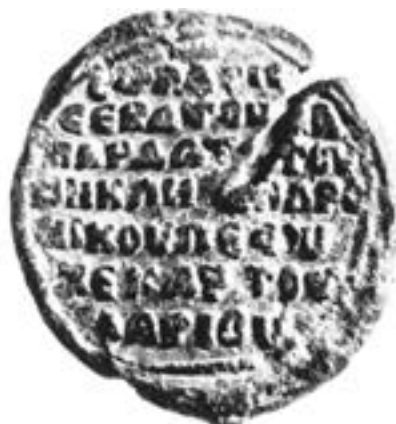
Печат севаста и хартуларија Андроника Лапарде, 1166–1183

била предмет личне побожности сведоче окови две иконице из ризнице Светог Марка у Венецији, 241 док је допојасна сликана реплика овог