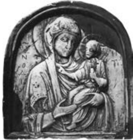
Иконица од сивозеленог стеатита, XIII столеће