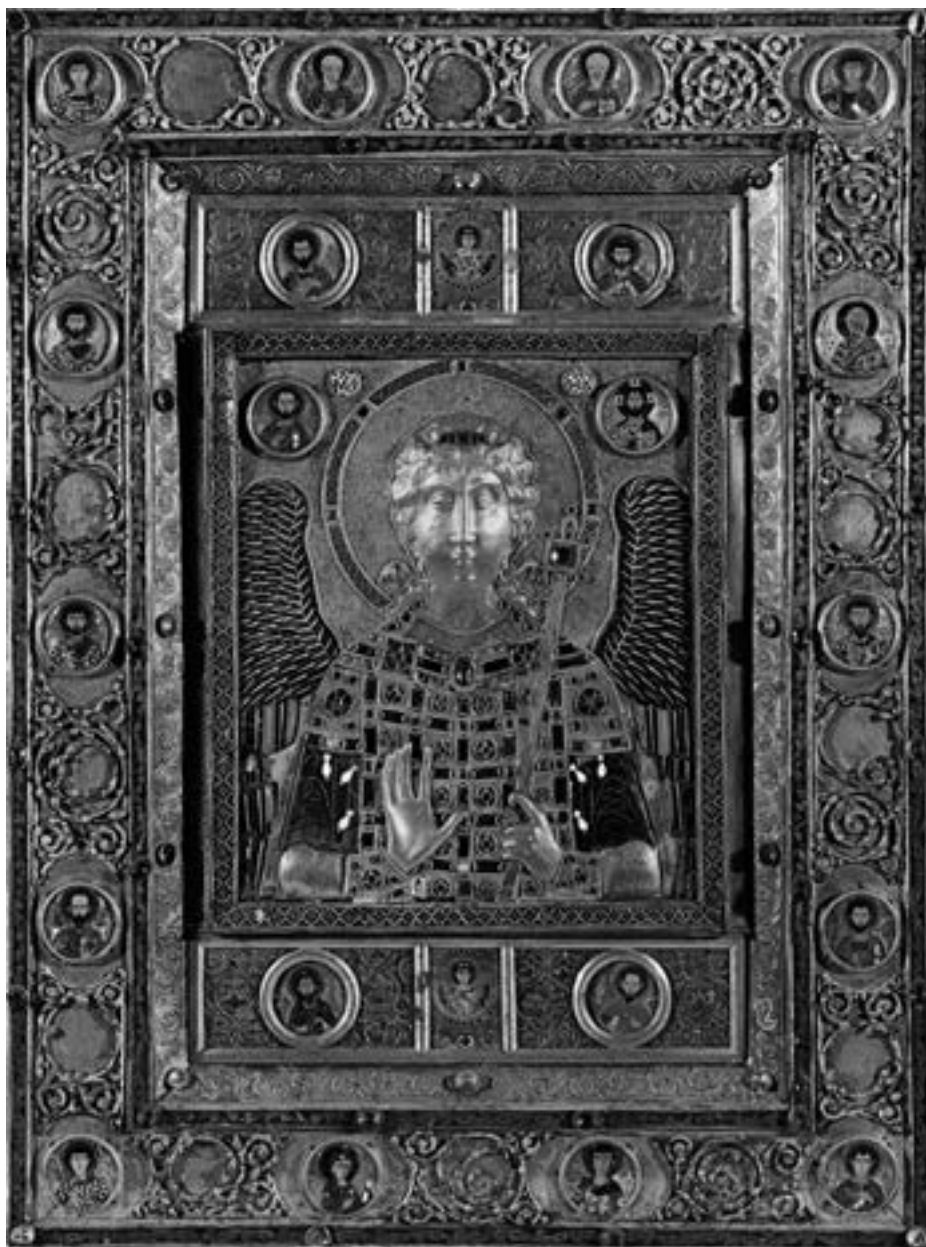
Икона арханђела Михаила, X столеће