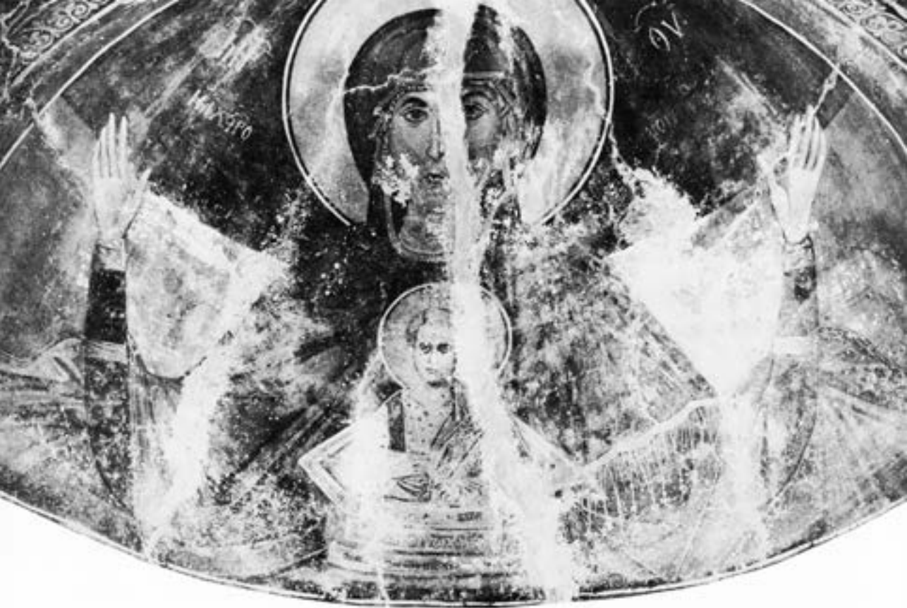
Полукалота олтарске конхе Малих светих врача, Охрид, око 1340

ца Оранта се врло ретко јавља на иконама, 531 док с друге стране представља уобичајен украс полукалота олтарских конхи, те је вероватно на овом месту била насликана и у древној солунској базилици. Најстарији познати пример из Сопоћана упућује и на могуће време настанка прототипа у Солуну. 532 Осим рановизантијских мозаика са зооморфним и биљним мотивима, 533 једини фигурални зидни украс базилике, представе севастијских мученика, до данас је сачуван у њеном јужном броду и по својим стилским одликама се датије у време краткотрајног Солунског царства (пре 1230). 534