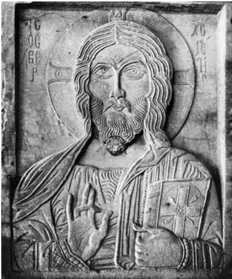
Престона икона Христа Доброчинитеља, серска митрополија, трећа четвртина XIII столећа

Κουτεριώτης. 421 Да је у близини Цариграда постојало значајно свети- лиште овог ратника и мученика Христовог, сведочи Никита Хонијат