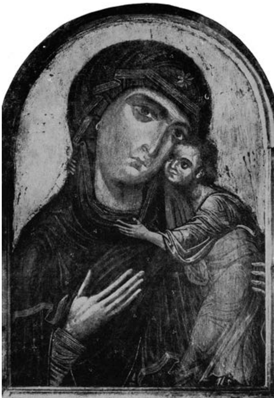
Средишњи део олтарске пале из цркве Светог Шимуна у Задру, XIII столеће