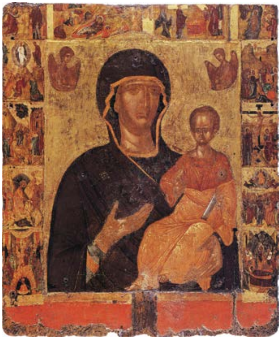
Литијска икона, Византијски музеј у Атини, крај XIV века

Теодори, Стратилат и Тирон, и свети Нестор. 271 У синајској збирци се чувају две иконе Богородице Одигитрије са Христом из прве половине