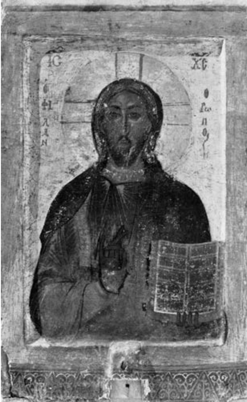
Литијска икона Христа Филантропа, испосница Светог Неофита на Кипру, 1182/3