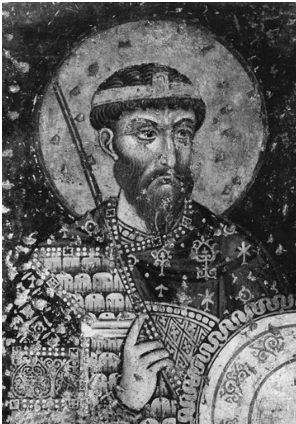
Свети Теодор Тирон, Космосотира у Вири, 1152