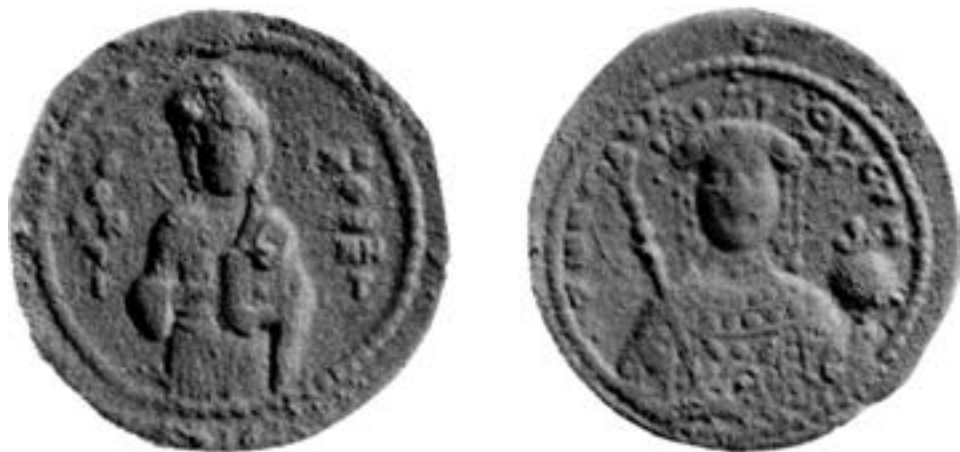
Златна номизма царице Зоје, крај пролећа 1042

њено тело је похрањено у саркофаг са златном и сребрном оплатом, 128 у параклису тог Ἀντιφωνητοῦ, 129 уз цркву Богородице Халкопратијске. 130 Задужбина још једне августе је почетком наредног столећа поседовала икону Христа Антифонита, престоничко сестринство Богородице Ке-харитомени, чији је оснивач била супруга Алексија I Комнина (1081–1118) Ирина Дукена. 131