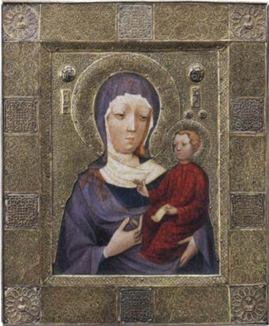
Пресликана икона Богородице из Лијежа, прва половина XIV столећа

дичине цркве у Доњој Каменици. 269 Из друге половине столећа (око 1370) јесте и фреска Мајке са Дететом, којима се клањају арханђели