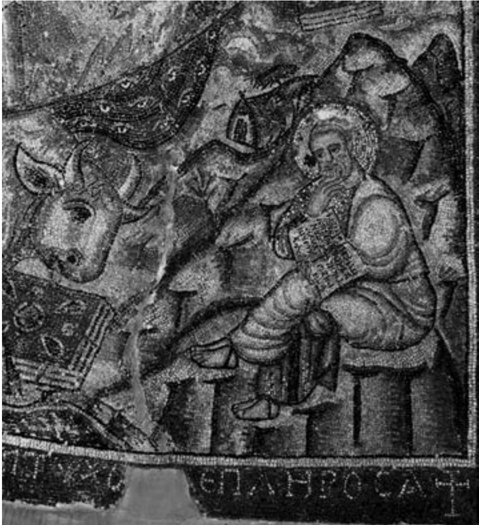
Пророк Исаија, детаљ солунског мозаика

вару – Христос, са развијеним свитком у руци, који седи на дуги као на престолу, у облаку светлости који носе небеска бића с многооким крилима, лице човечије и лице лавово с десне сѝране, а с леве сѝране лице волујско и лице орлово , река с представама риба и персонификацијом у дну мозаика – готово су дословна илустрација текста ове пророчке визије. 106 С том разликом што тѣсбара прѣсѣпта љѣа , носећи богато украшена јеванђеља, овде постају најстарији познати приме-