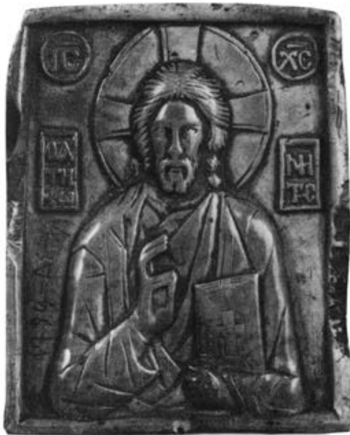
Иконица од зеленог стеатита, почетак XV столећа