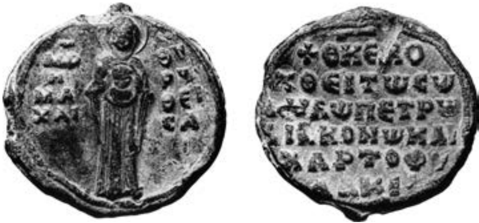
Печат Петра, ђакона и хартофилакса, око 1100

стантина. 38 На аверсима ових печата, који се датују у крај XI, односно средину наредног столећа, 39 фронтално је приказана Богородица у пуној фигури са сигнатуром Μή(τη)ρ Θ(εο)ῦ ἢ Μαχαρωθεΐσα, како обе-ма рукама испред себе придржава медаљон са попрсјем Богомладенца. Очувани сфрагистички материјал и горе наведени описи Цариграда омогућавају да се култ ове иконе прати у раздобљу дужем од једног столећа уочи IV крсташког похода. Будући да се не помиње у млађим изворима, највероватније је постала плен латинских освајача града. 40 Испосницу Богородице тоῦ Μαχαρᾶ на источним падинама планине Троода на Кипру, тридесетак километара југозападно од Никозије, која је касније прерасла у манастир, основао је средином XII столећа палестински анахорета Неофит са својим учеником Игњатијем. 41