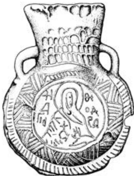
Оловна ампула за свето миро, XI столеће

поштовање икона. Залечивши бол у крстима миром истеклим из иконе, преобратио се и одрекао јереси у којој је до тада живео. 72