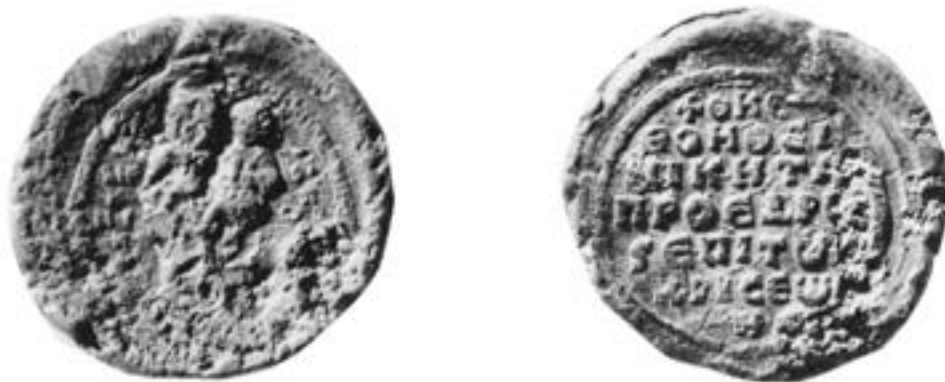
Печат проедра Никите, XI столеће

у манастиру Христовог Васкрсења, из акта који је у среду 9. маја 1324. издао цариградски синод. 450 Овај је манастир обновио велики логотет, полихистор и хроничар Георгије Акрополит († 1282), а ктиторска права наследио и икону светог имењака свог оца манастиру, највероватније, поклонио његов најстарији син Константин, 451 који се у