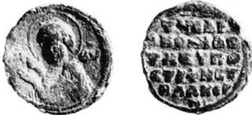
Печат влахернске цркве, XI век