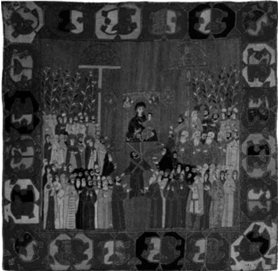
Катапетазма, Државно-историјски музеј у Москви, крај XV века

носача, стварајући додатни утисак да икона лебди у ваздуху непридржавана људским рукама. Упркос оштећењима бојеног слоја на овој фресци, видљив је преко десног рамена дијагонално пребачен упртач о који је, на левом боку, 292 био заденут доњи део дрвеног држача иконе. 293