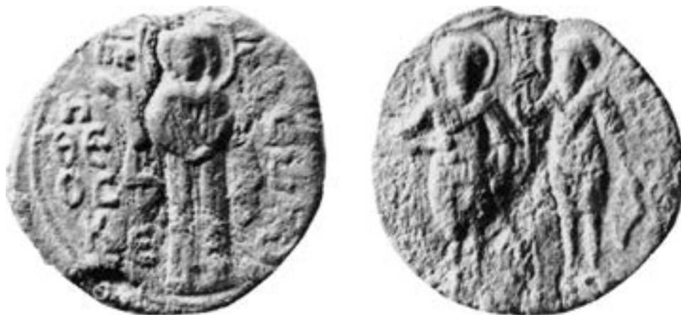
Богородица Теоскепастос (аверс), свети Георгије и Теодор (реверс)