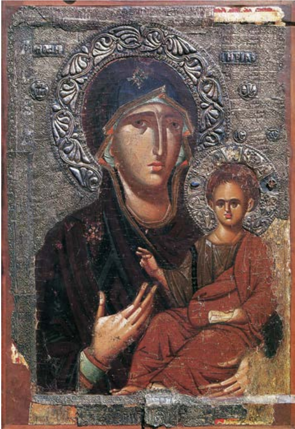
Литијска икона из Охрида, друга половина XIII века