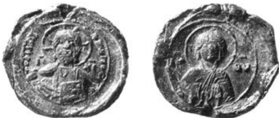
Печат Филантроповог манастира, XII век

τοῦ Φιλανθρώπου основао је пре 1107. 400 и у њему касније био сахрањен василевс Алексије I Комнин. 401 Делио га је зид од суседног