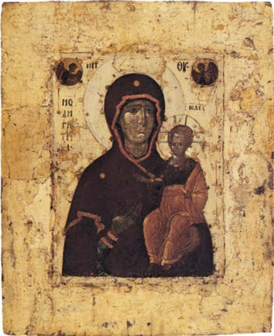
Одигитрија из Музеја Кремља, крај XIV столећа

стеатита из ватопедске ризнице, на чијој полеђини је ескадрон светих ратника у два реда, које предводи свети Георгије Диасоритис, за њим у горњем реду јашу свети Димитрије и Прокопије, а у доњем свети