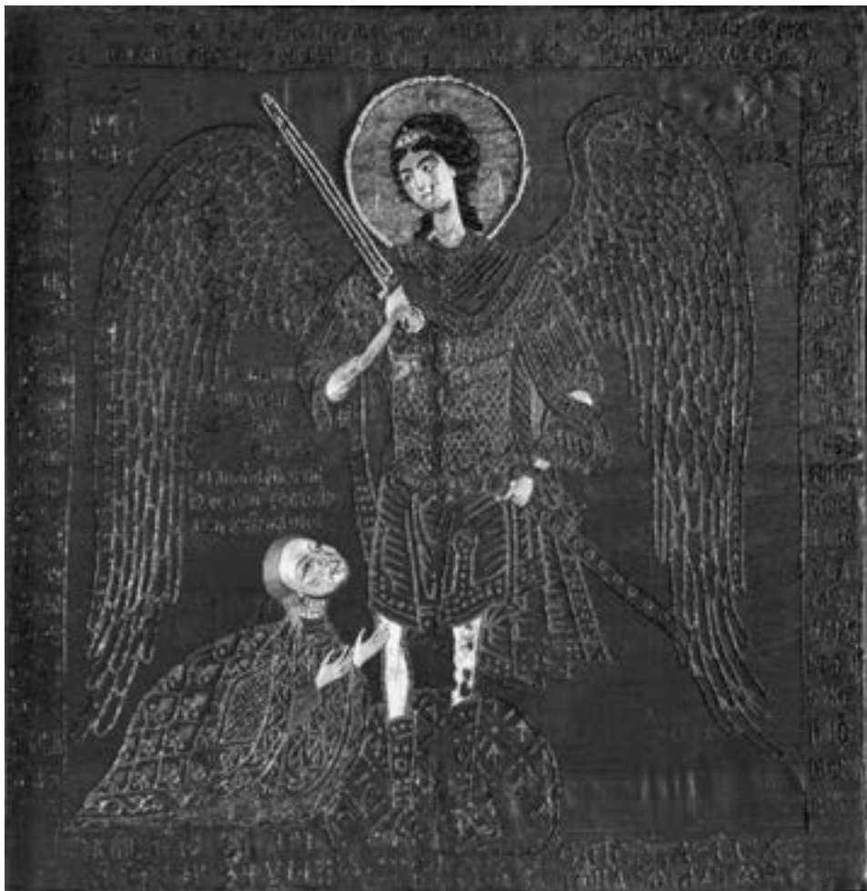
Катапетезма Манојла Палеолога из Урбина, почетак XV века

(освећеној 547). 383 А чудотворну моћ су имали и обични предмети који су долазили у додир са сликаним представама. 384 Тако се за уже, о које је било окачено кандило испред лика светог Стефана Првомученика, изнад улаза у Свети бунар, приповедало да је нарочито делотворно код