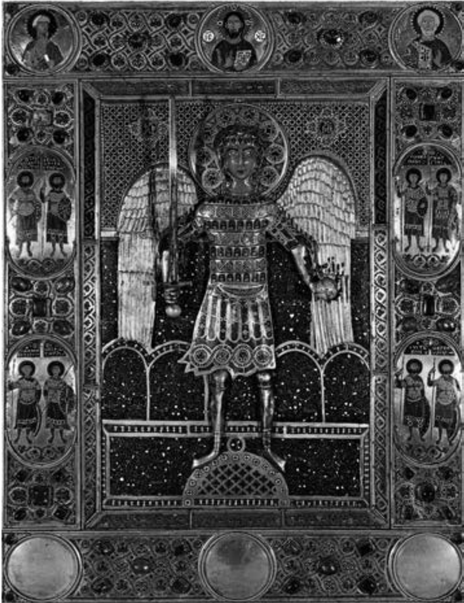
Икона арханђела Михаила, XI век