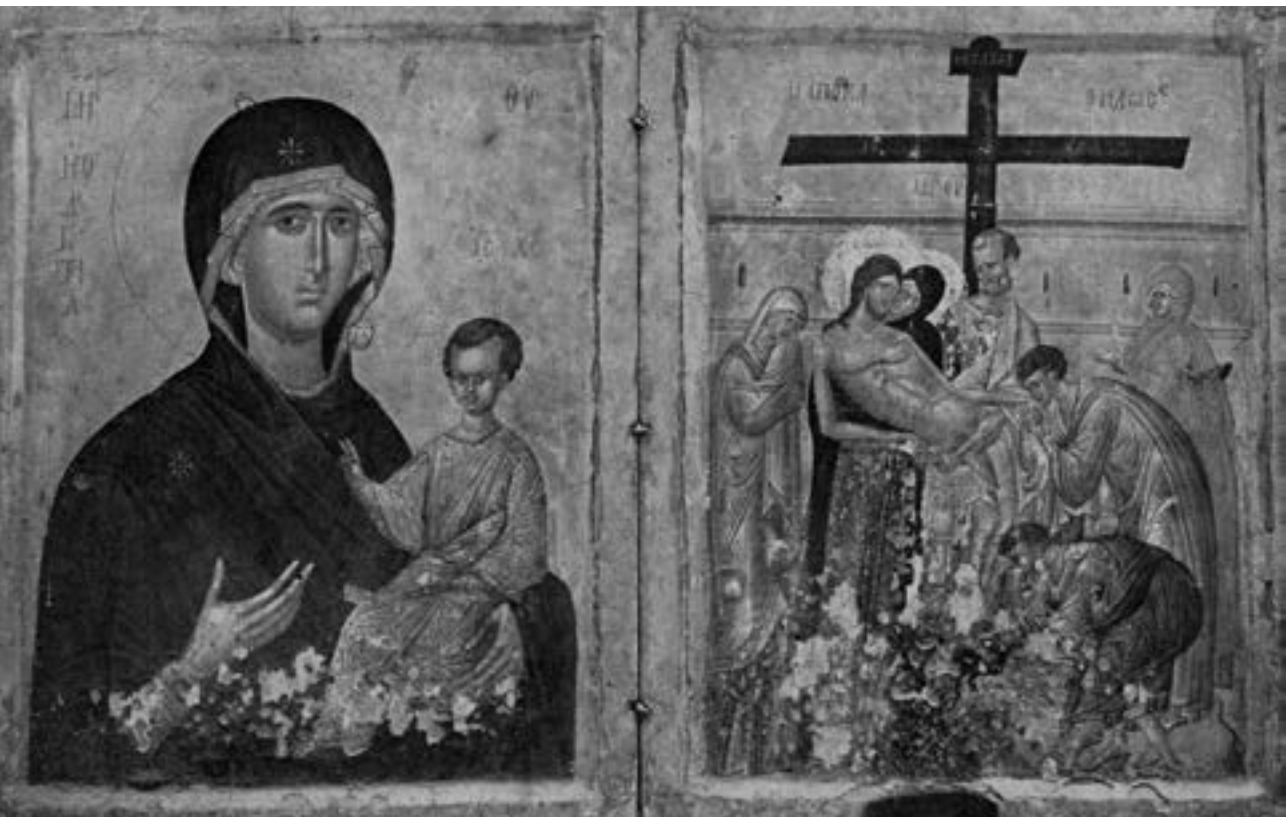
Двојна икона, Синај, прва половина XV столећа

Сваког уторка у литији је проношена улицама престонице, напред су ступали мушкарци, а за њима жене, појући химне у част Богородице. На челу поворке смењивала су се тројица свештенослужитеља носећи велику икону, која је сама одређивала правац кретања литије, до тога да је дејством силе невидљиве учесницима, заустављала поворку пред Христовом представом испред Спасове цркве, 285 и мимо воље свог носача, окретала се и клањала лику Сина Господњег. 286 О