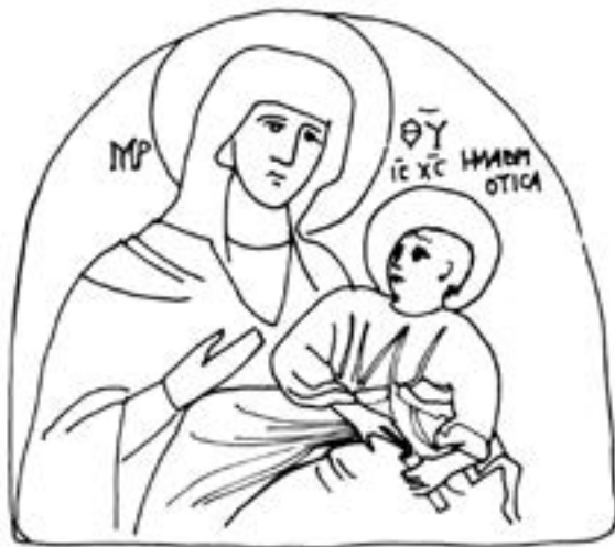
Богородица Мавриотиса код Костура, друга половина XIII века

иконе светог Николе о тнс стегнс с краја XIII столећа из истоимене цркве близу Какопетрије, на северним обронцима планине Троода, на Кипру, 524 или нешто старије фреске допојасне Богородице са Христом на левој руци, означене као Η ΜΑΒΡΙΟΤΙΣΑ, над зазиданим јужним улазом у католикон овог манастира близу Костура. 525