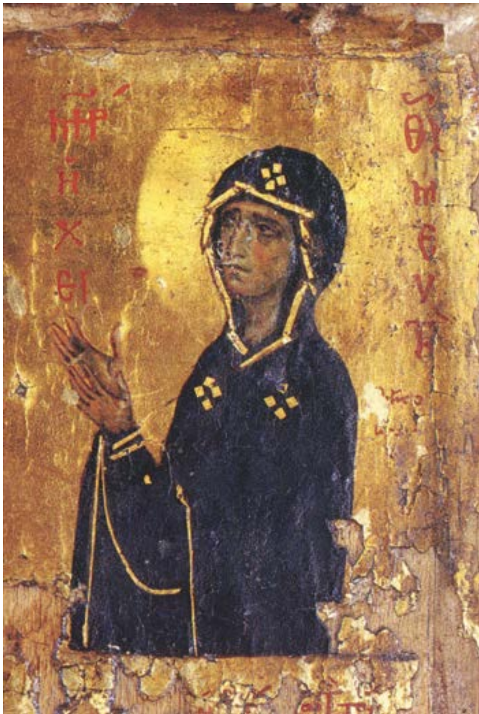
Богородица н хеимеути, детаљ са синајског хексаптиха, XII век