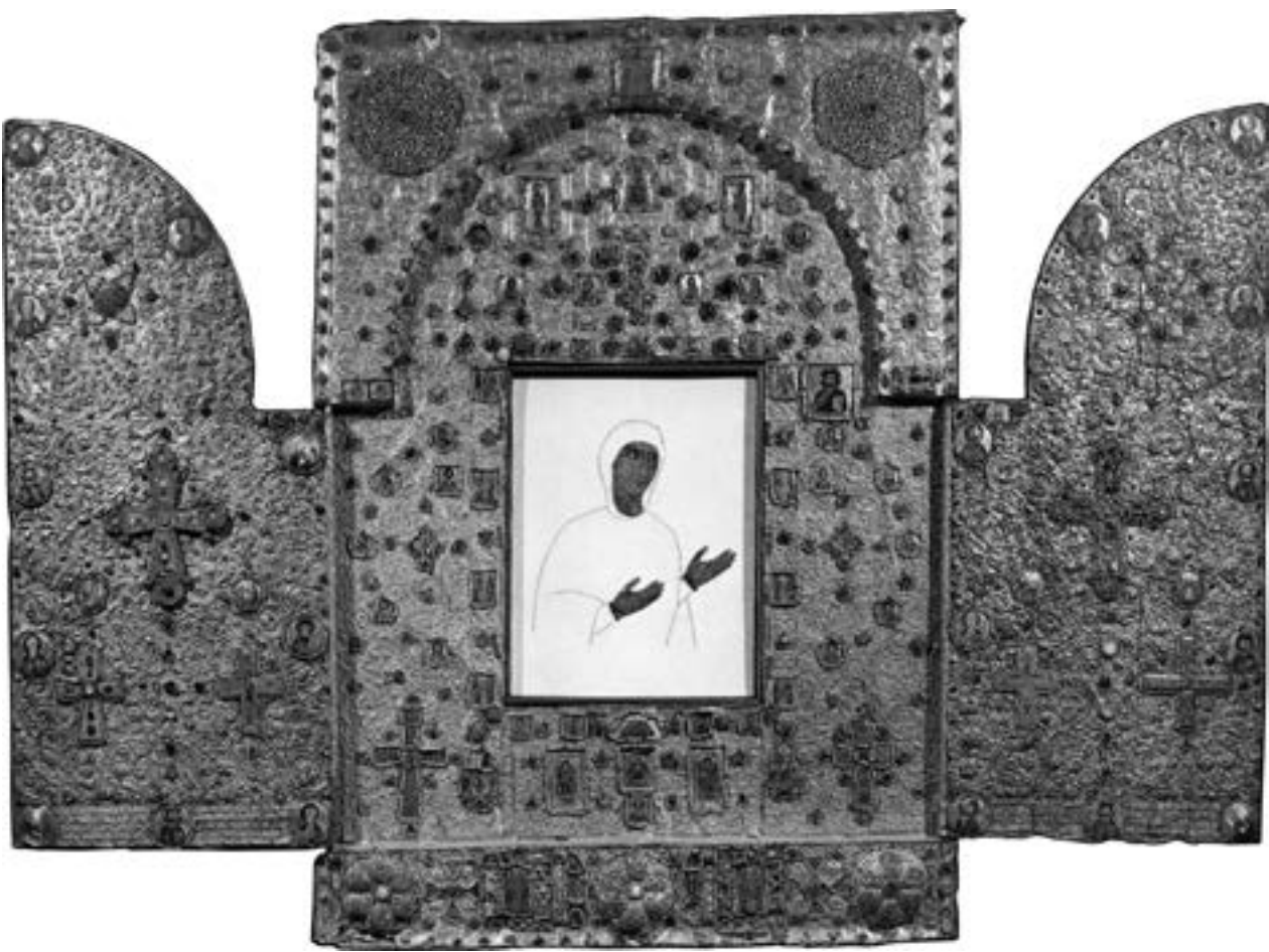
Триптих из Гелати, око 1125

на у олтару Велике цркве, њоме су помазивани верни. 376 О овој икони пише и руски Аноним крајем XIV столећа, уз објашњење да су сузе са ње потекле када су Латини покушали да је однесу. Исти аутор бележи још да су сузе, налик бисерима, сакупили црквењаци и да су се могле видети и у његово време, а сама икона која је исцелила многе болесне, чувана је под посебним киворијем у северном броду храма. 377