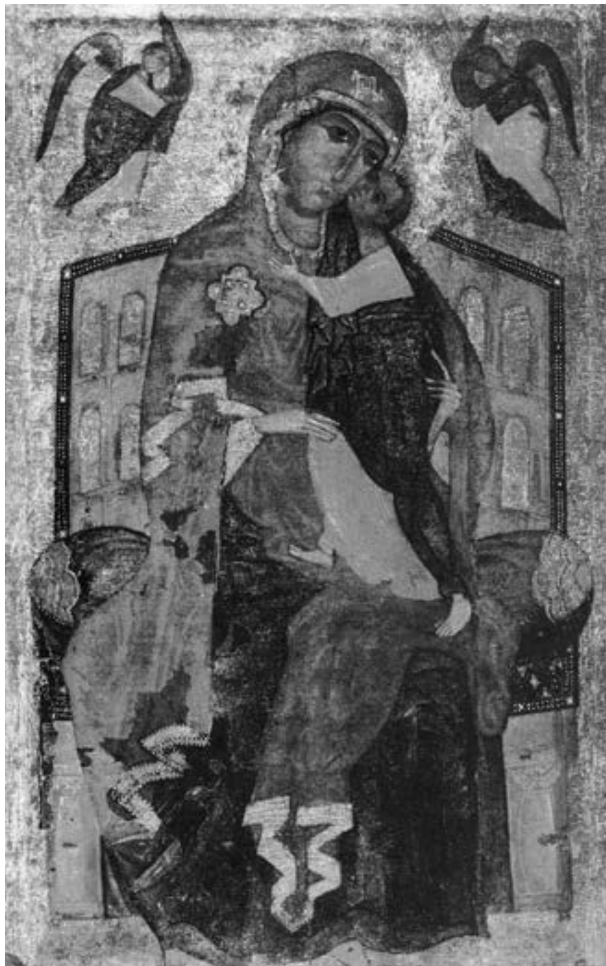
Богородица Толгска (I), XIII столеће