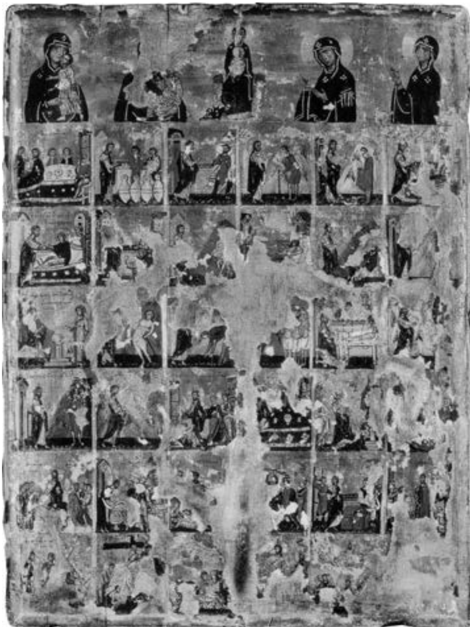
Део синајског хексаптиха са представама најпоштованијих цариградских икона Богородице и догађајима из Христовог овоземаљског живота, XII век