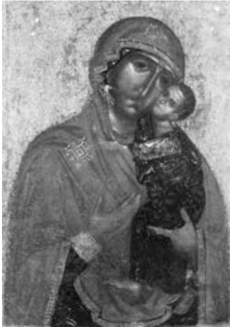
Богородица Толгска (II), почетак XIV века