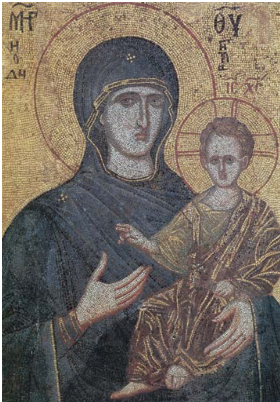
Мозаична икона из Ираклије Понтске, почетак XIV века