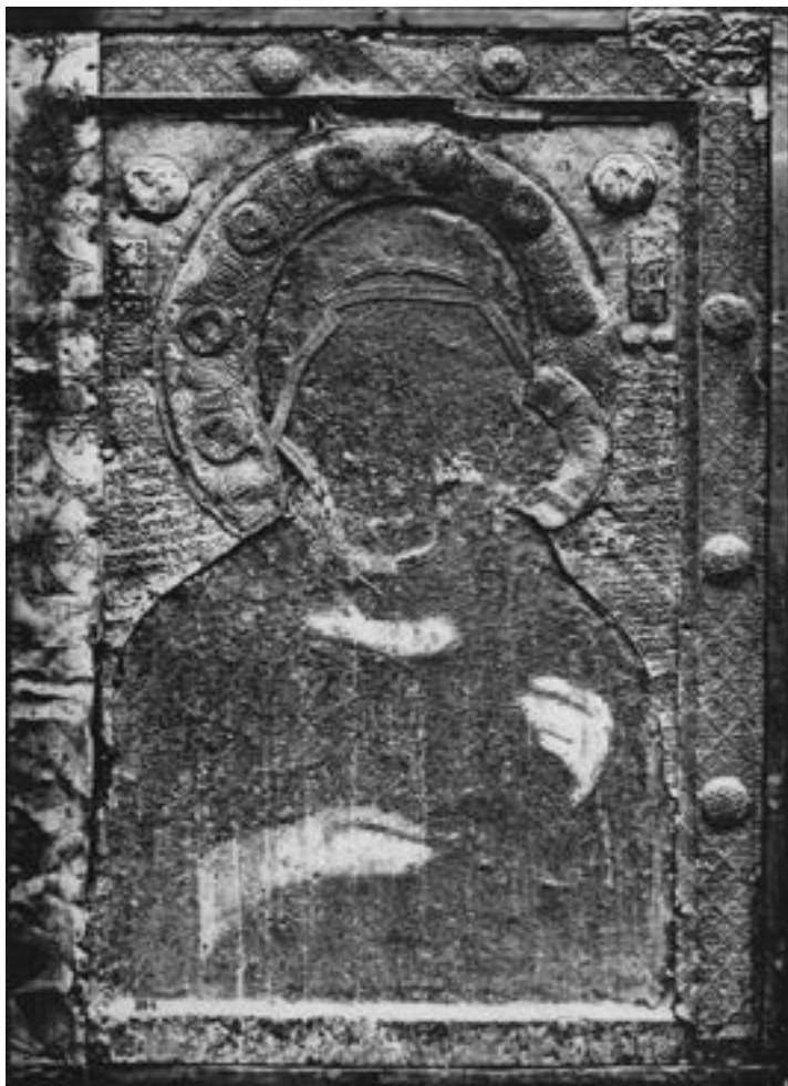
Патронална икона Богородице Петричке, Бачково, крај XI столећа

позлаћеног сребра, те његови уклоњени делови са руку Богородице и Христа, и данас сведоче о идентичном иконографском типу. Нарочито поштована икона у овом манастиру је своју оплату добила 1311, 191 како стоји у грузијском натпису испод епитета Υ ΒΛΑΧΕΡΝΗΩΤΗΝΣΑ. 192 Иако се