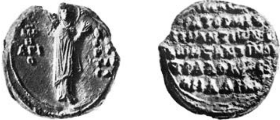
Печат Константина Стравовасилијаде, XIII век