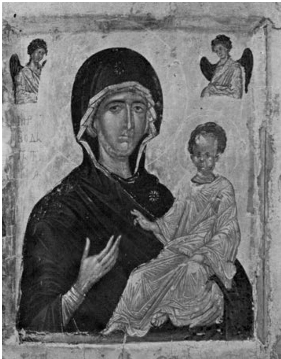
Икона из синајске збирке, прва половина XV века

јеромонаху Јовану, апостол Лука је икону Богородице послао свом ученику Теофилу у Рим, заједно са својим јеванђељем и Делима апостолским, PG 95, 321; Georgii Monachi Chronicon, II, 741; док се у писму тројице источних патријараха цару Теофилу из 836. истиче да је Лука Маријин лик насликао још за њеног живота, док је живела на Сиону,