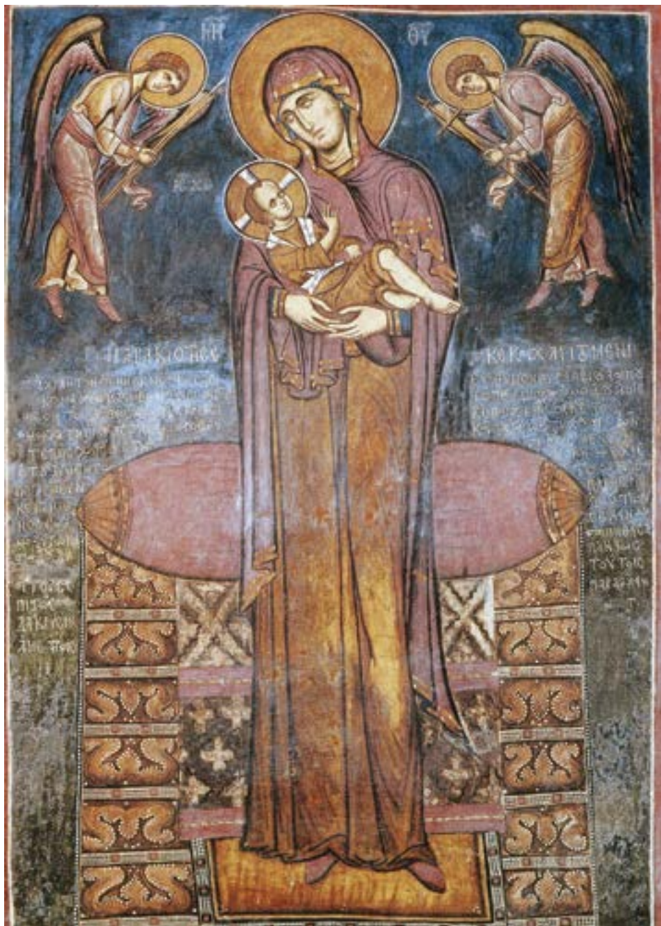
Фреска Богородице Страсне, Лагудера, 1192