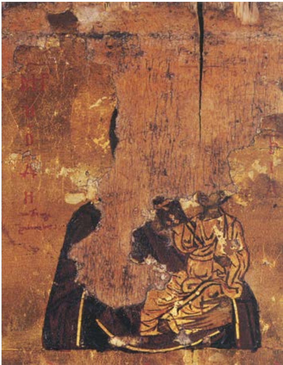
Оштећена Богородица Одигитрија са синајског хексаптиха

ца украшених истом техником, по жељи автократора Јована VI Кантакузина око 1350, постати део фигуралног украса оплате од позлаћеног