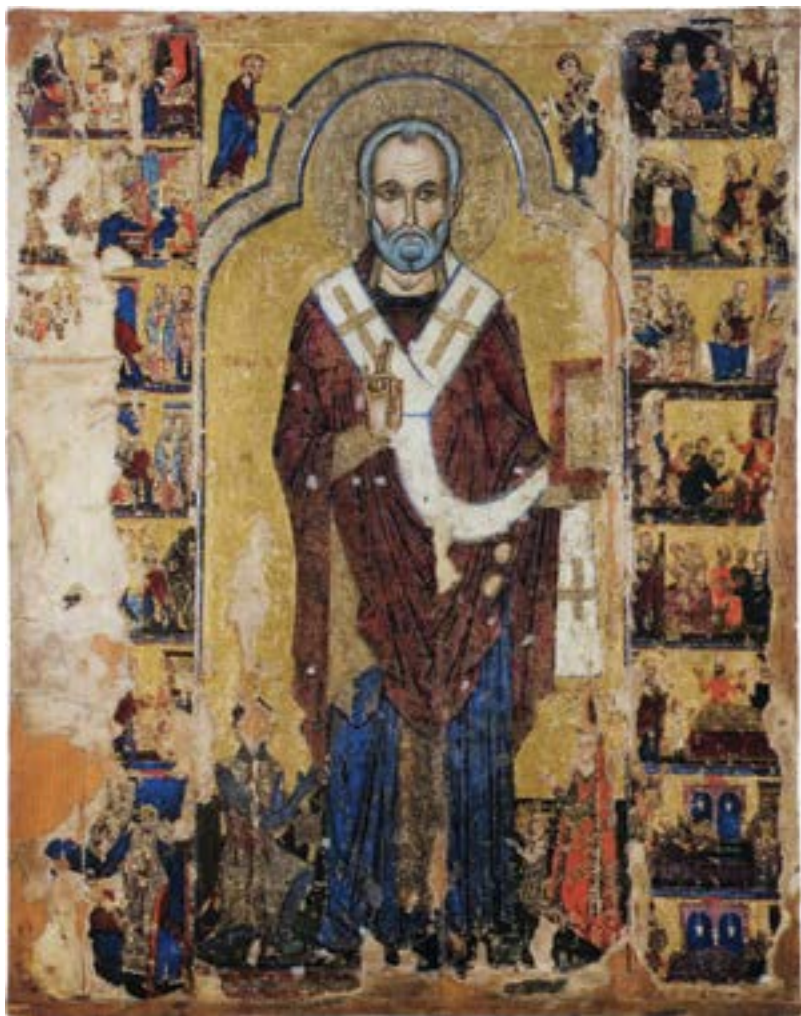
Икона светог Николе, Кипар, крај XIII столећа

τοῦ Ἐηρουχραφίου, који се такође налазио северно од Милета. 523 Топонимски епитети се јављају и на делима зидног сликарства и иконописа, такође као могуће реплике нарочито поштованих оригинала, попут