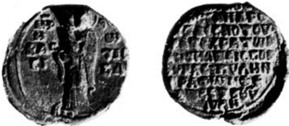
Печат севастократора Манојла, сина Андроника I Комнина, крај XII столећа