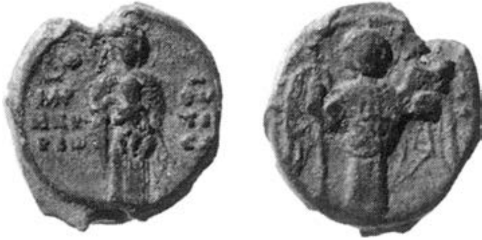
Печат Михаила Псела (?), крај XI столећа

пред својих груди и натписом \text{H KYPIOTICA} , док је на полеђини такође у пуној фигури арханђео Михаило у владарском орнату са инсигнијама. 348 Истом времену, првој половини XII столећа, припада и минијатура из псалтира похрањеног у венецијанској Марђијани (cod. gr. 565, fol. 50v – \eta \text{ Kyriwticca} ). 349 Најстарији пример у зидном сликарству потиче из престоничког храма који је у турско доба служио као исламска богомоља позната под именом Календер џамија. На источној страни пролаза између олтара и ђаконикона првобитне цркве, у зиду издубљеној, невеликој полукружној ниши, средином XII века је фреско-техником изведена Мати Божија ( \text{H KYPIOTNSA} ) како стоји на супеданеуму, док у наручју, фронтално испред груди, носи Богомладенца који левом руком држи свитак, а десном удељује благослов. Са Богородичине десне стране, у висини њених колена, насликан је наручилац фреске, који левом руком носи развијен свитак са данас готово нечитљивим текстом. Сама фреска је била нарочито поштована, трагови ексера указују да су нимбови Мајке и Детета имали металну плату, а оштећења бојеног слоја, која од Христових груди сежу до испод колена Богородице, најпре су настала у директном контакту са вернима – као последица целивања и бројних додира побожних