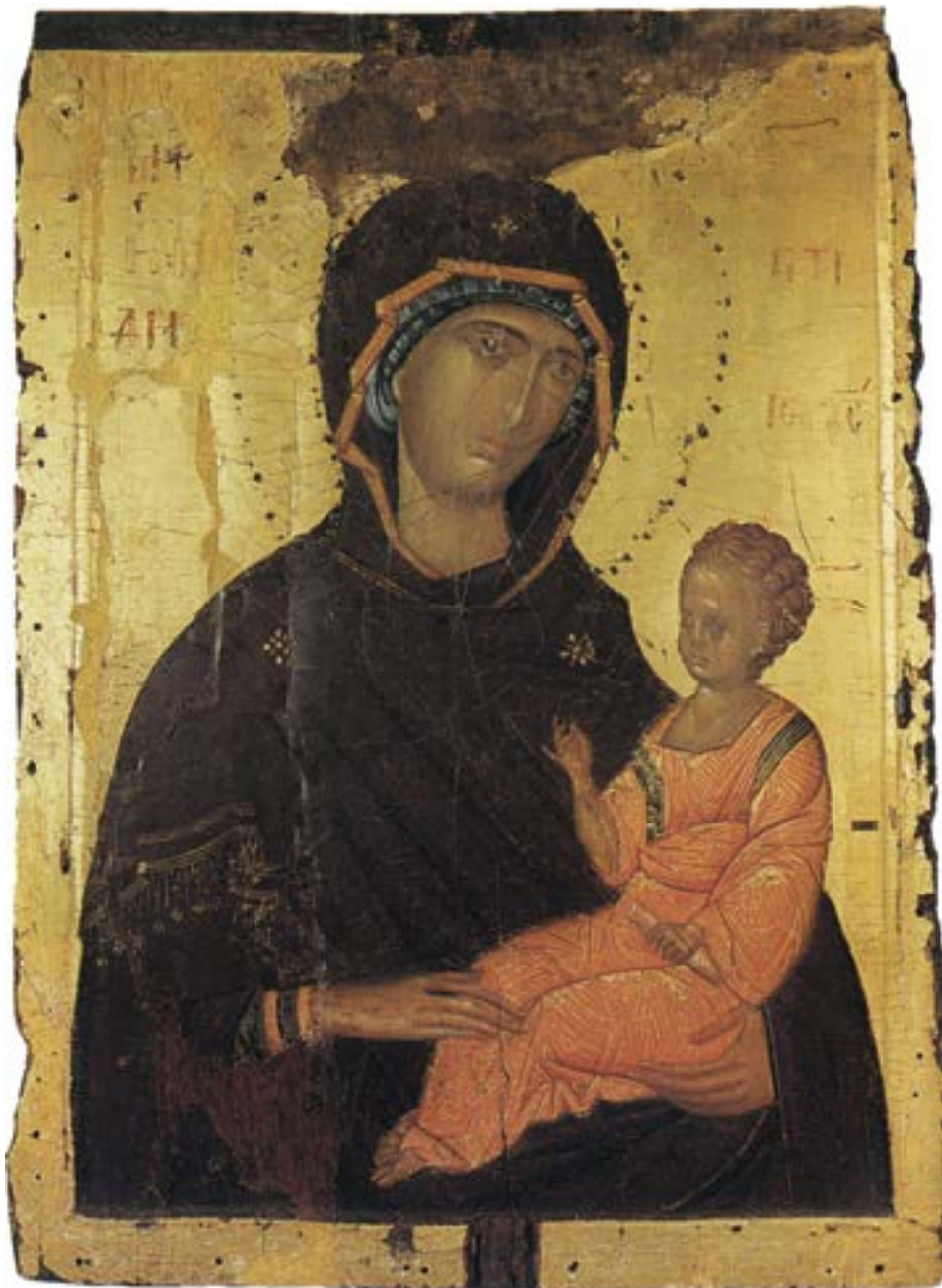
Литијска икона из атонског манастира Светог Павла, крај XIV столећа