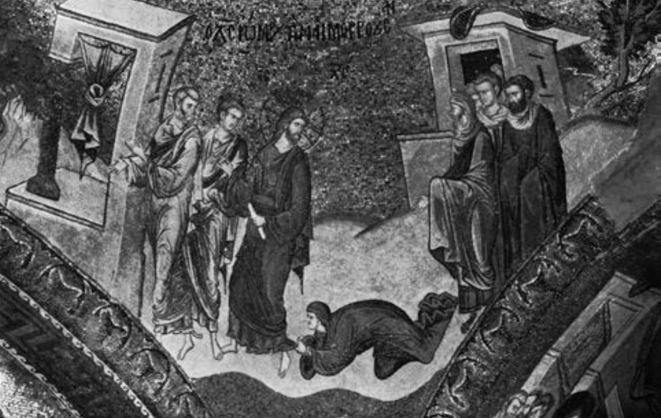
Исцељење крвоточиве жене, припрата Хоре, око 1320

роисточни пандантиф краси Исцељење Петрове таште. 218 Представе других Христових чуда, односно исцељења – човека са сухом руком, лепрозног, слепог и немог, двојице слепих, те мноштва болесних у јужном травеју, 219 иначе чине засебну целину у зидној декорацији унутрашње припрате, 220 па се може претпоставити да понављају пр-