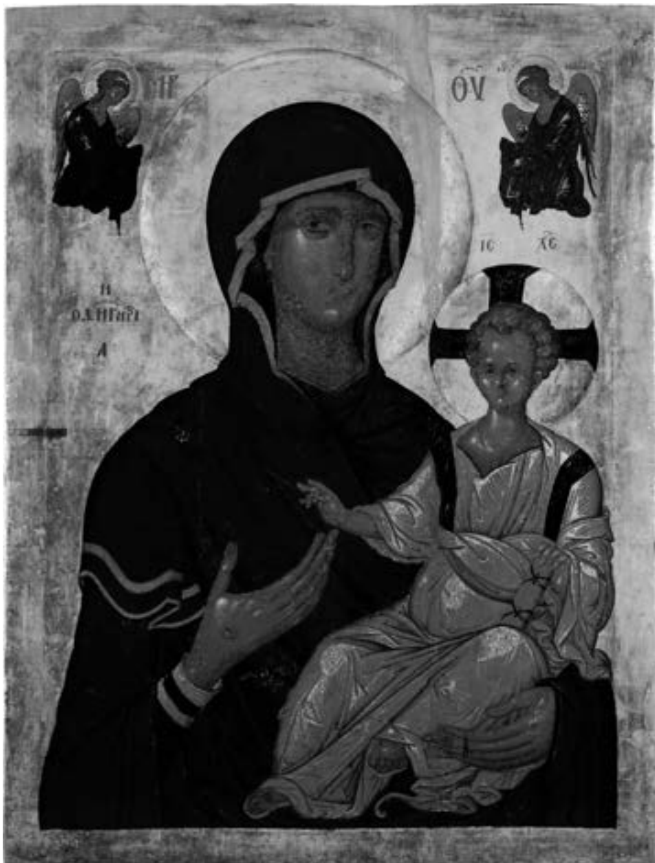
Престона икона Богородице Одигитрије, Марков манастир, пре 1395