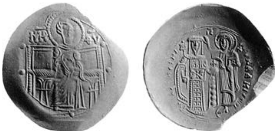
Сребрњак Јована III Ватаца, 1222

супрузи Алексија III Анђела (1195–1203). На аверсу је Христос који стоји на супеданеуму, у левој руци држи кодекс, док десном испред својих груди благосиља – ΙΗΣΟΥΣ ΧΡΙΣΤΟΣ Ο ΧΑΛΚΙΤΗΣ. 233 Исти иконографски тип понављају и два нешто млађа печата, неког Арона и Кли-