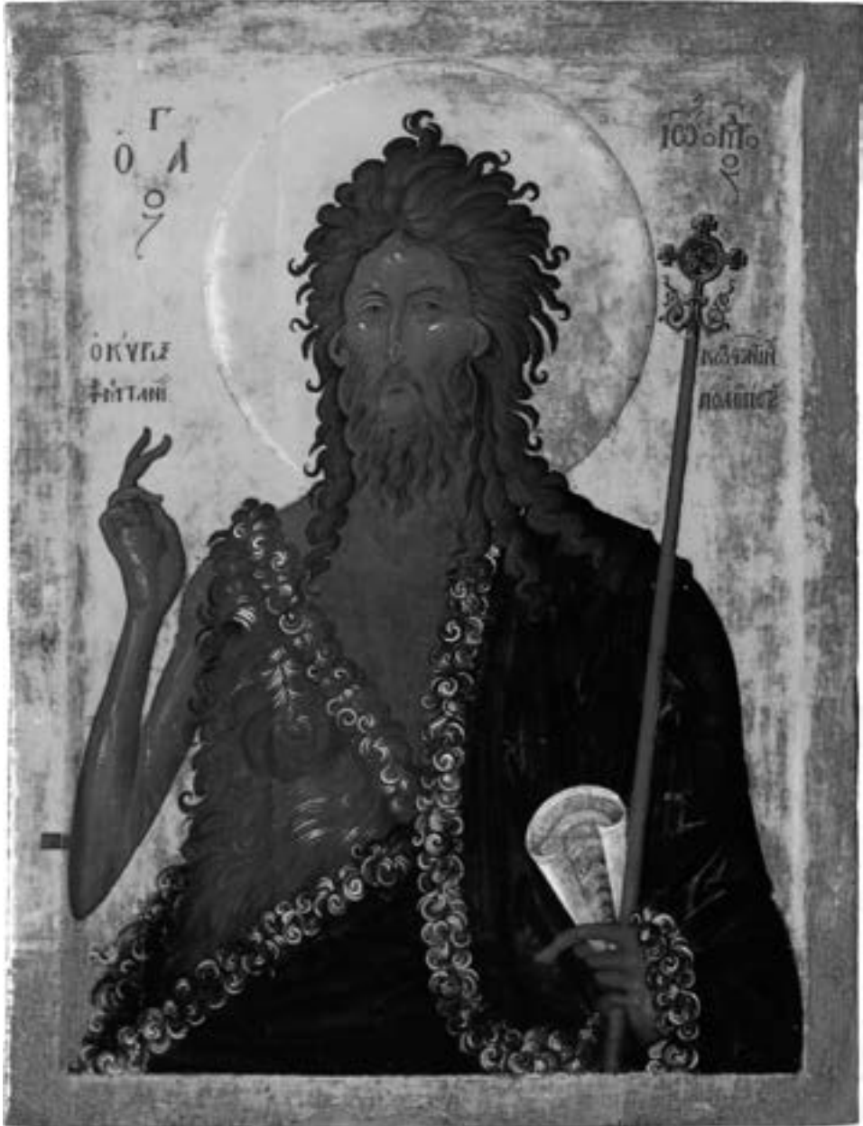
Икона светог Јована Претече са иконостаса Марковог манастира, пре 1395