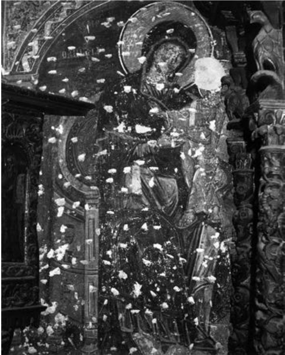
Фреска из Старе митрополије у Водену, крај XIV века

По угледу на престоницу, и други град Царства је имао своју икону Богородице зване тоῦ ὀδηγεῖν, која је такође показивала самовољу на литијама у којима је ношена по граду. На повратку са једне од њих дуго није дозвољавала носачима, чак и оним најпобожнијим, да је уне-