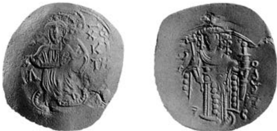
Никејски бакарни новац из времена Јована Ватаца (1222–1254)