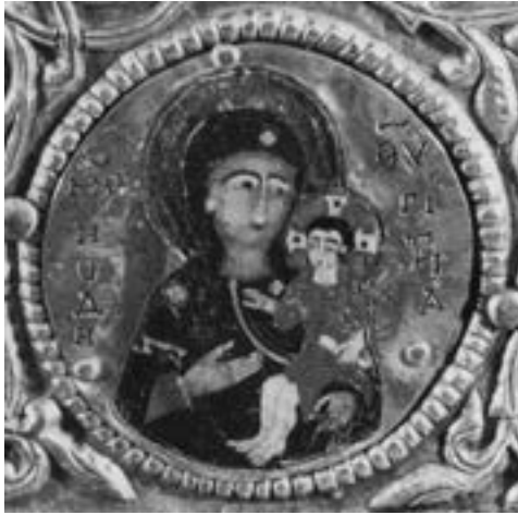
Медаљон украшен емаљем са корица јеванђелистара из Сијене, крај XII века