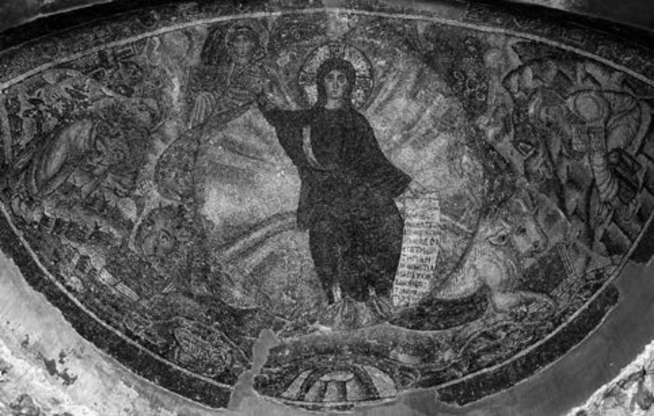
Мозаик из полукалите олтарске апсиде католикона манастира τὸν Λατόμων у Солуну, крај V столећа

ловитим ударом грома и подрхтавањем тла затекла га је самог у манастирском католикону. Лажни зид се урушава, а времешни монах, који је стајао по средини цркве, видевши како се из облака прашине светлуцајући помаља мозаични Христов лик, узноси хвалу Господу и истог трена испушта душу. Манастирско братство га сахрањује на месту где је пронађено његово беживотно тело. 102