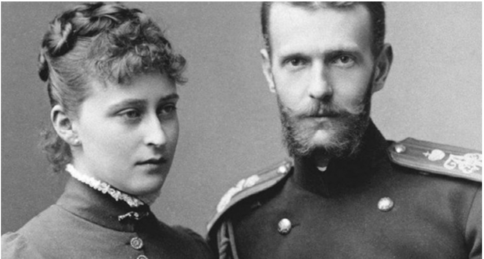
Јелисавета са мужем