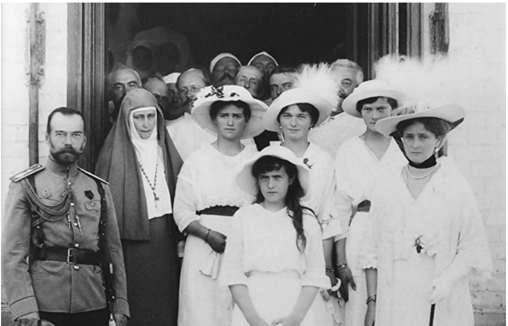
Јелисавета са царском породицом