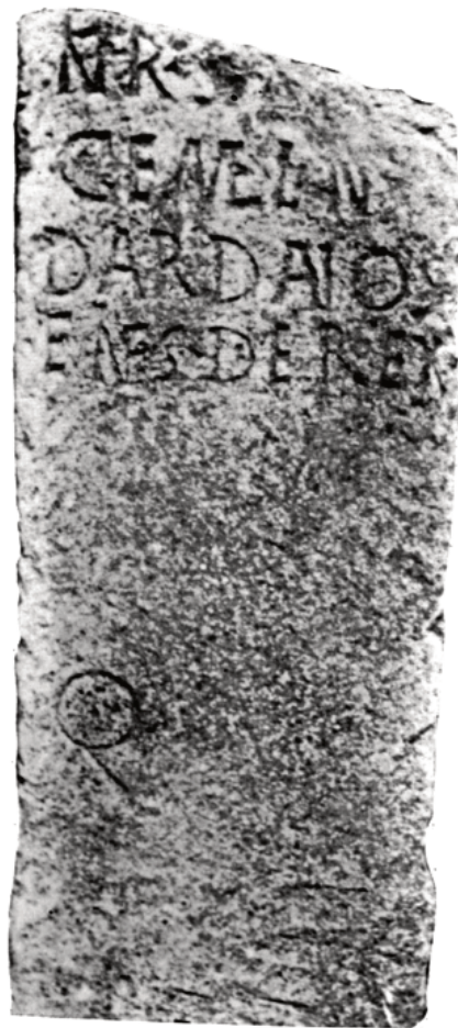
<Fig.2 IMS VI220 Boundary inscription of the community of the Dardanians>

The municipalisation of certain parts of the territories that were tributariae did not imply the cancelation of the civitates peregrinae , as it is clearly shown,