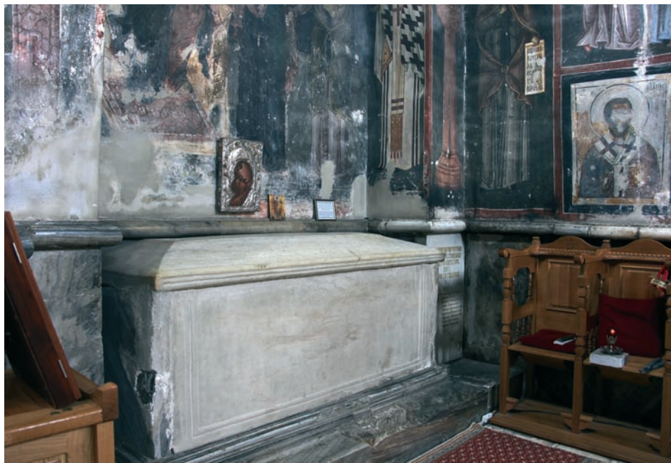
Манастир Студеница. Саркофаг Стефана Немање – св. Симеона

су показали да је обнова саркофага највероватније извршена почетком друге половине 16. века, када је израђена нова предња плоча и постављен масивни, рустични поклопац. Оштећене бочне плоче том приликом су грубо закрпљене каменом и малтером, па сада нарушавају првобитни, репрезентативни изглед ктиторског гроба. Стога би требало покренути иницијативу да се на споменику изврши мања, делимична обнова, која би се састојала од надоградње оштећених делова бочних плоча и угаоних профила одговарајућим сивим мермером, налик оригиналном. Таква интервенција не би захтевала измене садашње конструкције, а саркофагу светог Симеона вратила би нешто од изворног изгледа, монументалности и лепоте. Коначно, да би се потврдили или оспорили изнети археолошки закључци о владарским сахранама у Студеници, било би неопходно да се изврше ДНК анализе земних остатака покојника – уколико се установи где се они сада налазе.