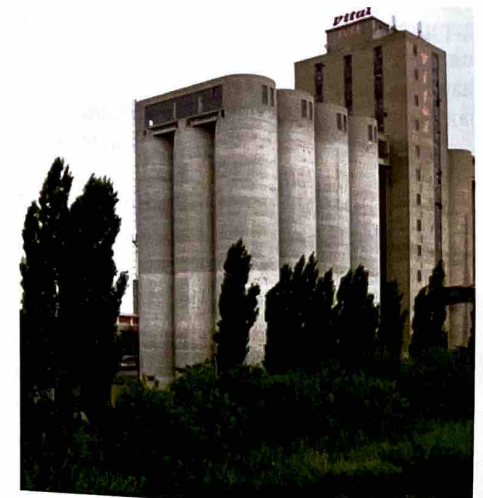
Фабрика „Витал“, Врбас

Под именом „Војводина“ (пун назив „Штерић и Лењи – прва српска фабрика уља Војводина Нови Врбас“) регистрована је 1928, у време значајног осавремењавања: 1927, 1928. и 1932. набављена су три ротирајућа екстрактора, а 1929. уређај за рафинацију. Фабрика се бавила производњом и продајом уља за јело, за техничке сврхе, товатне масти и кита, као и продајом