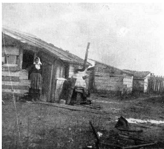
Слика 7. „Станови за ренту“ на имању Фабрике авионских мотора у Добрачиној улици (Видаковић, Стамбена беда )

Figure 7 “Apartments for rent” at the estate belonging to the Factory of Aircraft Engines in Dobračina Street