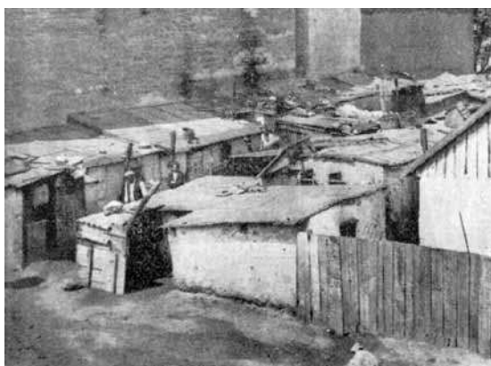
Слика 4. Низ „барака“ у Добрачиној 57, око 1933. (Видаковић, Стамбена беда )