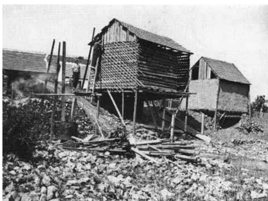
Слика 2. Изградња чатмаре у делу насеља западно од Електричне централе, око 1926–1927. (Ћирић, Градски номад , 114)

Figure 2 Construction of a wattle-and-daub house to the west of the Electric Power Station, ca. 1926–1927