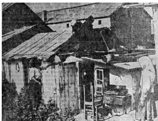
Слика 8. Рушење кућа у делу поред Електричне централе, 1928. („Нема више Пиштољ-Мале“)