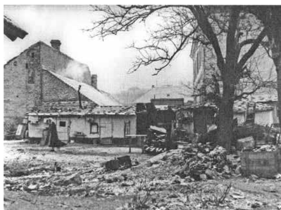
Слика 5. Део Пиштољ-мале унутар формираних градских блокова, 1927. (Ђирић, Градски номад , 118)