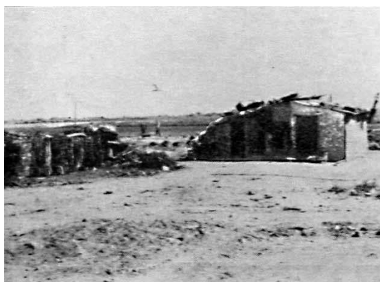
Слика 3. Импровизована станишта на градском сметлишту, око 1930.