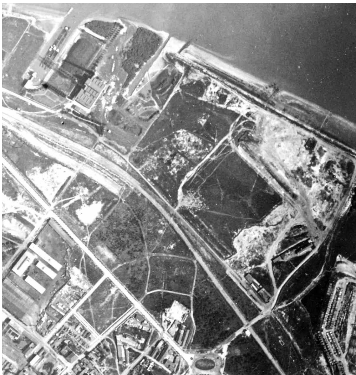
Слика 9. Авионски снимак једног дела простора на коме се налазила Пиштољ-мала, 1938. Figure 9 Aerial photograph of a section of the area covered by Pištolj-Mala, 1938

Претпостављамо да је њихов највећи број био у старим градским блоковима, углавном од Француске до Светозара Милетића улице, док је други, према Полиџикином тексту из 1936, био измешан са сметлиштем. У другој