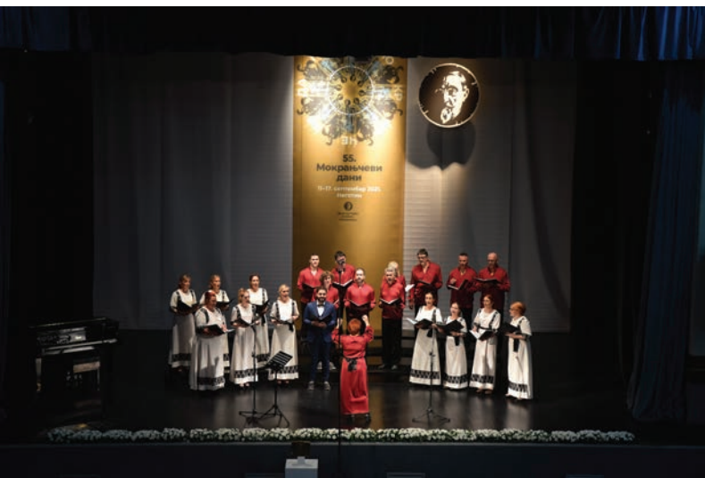
Хор из Врбаса