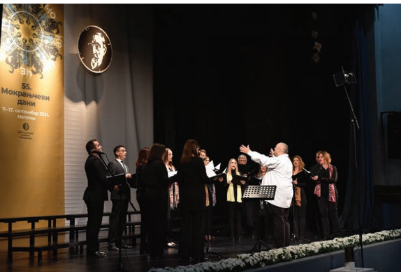
Крагујевачко певачко друштво