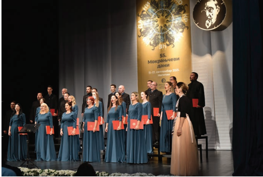
Победнички хор Мокрањац из Београда