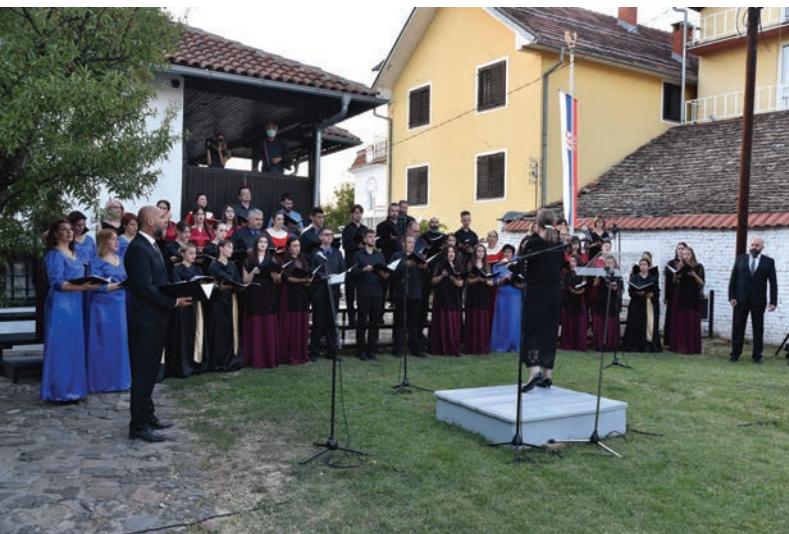
Извођење Шесте руковети на отварању Фестивала