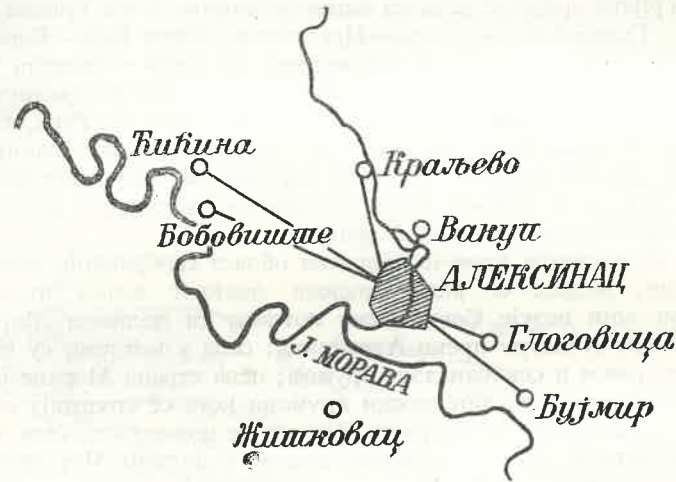
Ск. 3. — Најужа зона алексиначког тржишта: зона снабдевања млеком.

тржишту. Но стока није једини производ којим се овде тргује, тако да је за одређивање тржишне зоне узета у обзир и продаја других производа, као например млека. Овај артикал има веома узану зону и обухвата свега неколико села из најближе околине Алексинца. То су села: Бујмир, Глоговица, Вакуп, Краљево, Бобовиште и Ћићина. Удаљеност ових села креће се 2—7 км, пошто је млеко такав производ који не подноси дуг транспорт. Најближе граду је село Вакуп (2 км), а најудаљенија Ћићина (7 км). Највећи број млекара имају Краљево и Бобовиште. Број млекара се стално мења и у Бобовишту се креће од 20—30. Млекари Бобовишта и Ћићине имају, поред Алексинца, ново тржиште у Алексиначком Руднику.