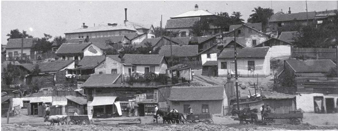
Sl. 2. Sirotinjsko naselje Jatagan-mala, oko 1930. godine