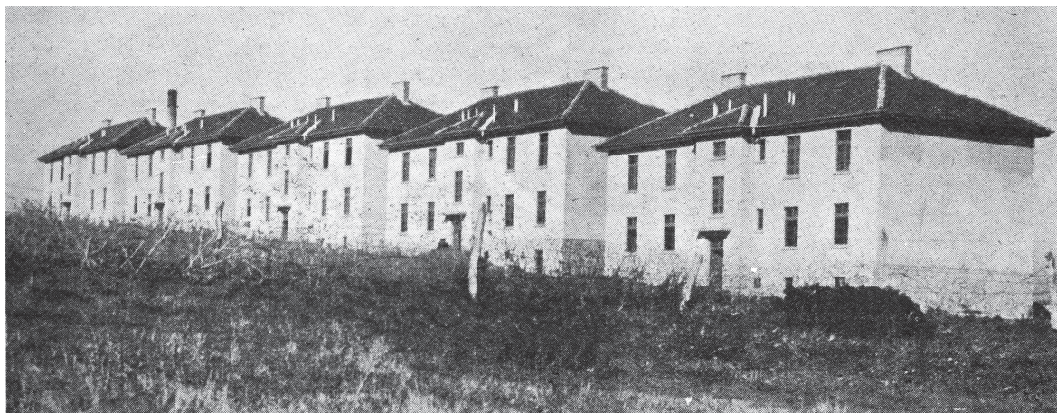
Sl. 4. Branko Maksimović, Zgrade sa opštinskim stanovima u Humskoj ulici, Beograd, 1930. godina