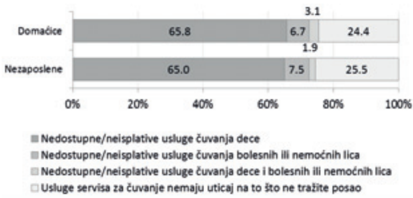
Слика 3. Узроци неактивности услед бриге о деци или одраслим неспособним лицима, жене 25 до 54 године, према главном статусу

Слика 3 указује на основне узроке неактивности код жена које су неактивне услед бриге о деци или одраслим неспособним лицима. Скоро две трећине жена из ове групе узрок своје неактивности виде у недоступним или неисплативим услугама чувања деце (65,8% домаћица и 65% неактивних незапослених), а додатних око 7% у недоступним или неисплативим услугама чувања болесних или немоћних лица.