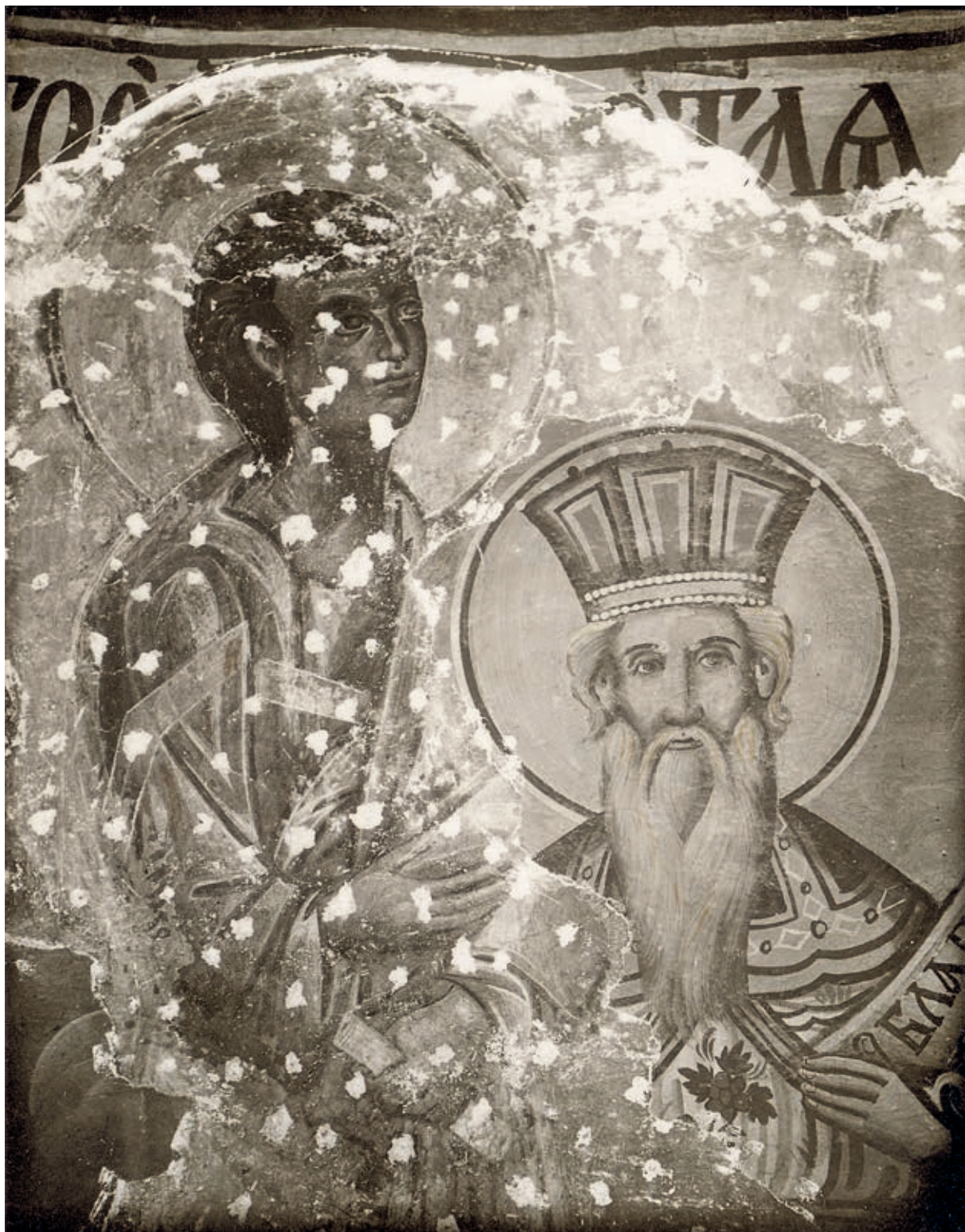
Сл. 379. Свети апостоли у Пећи, купола, фреске из XIII века под слојем живописа из 1875, снимак начињен током конзерваторско-рестаураторских радова из 1931–1932. године