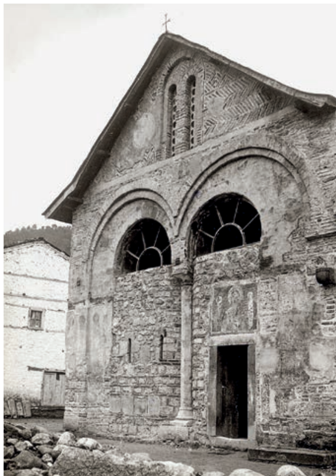
Сл. 382. Пећка патријаршија, јужна фасада припрате по завршетку радова из 1931–1932. године