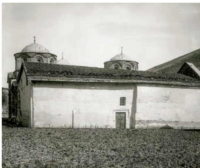
Сл. 377 и 378. Пешка патријаршија, јужна и западна фасада пре конзерваторско-рестаураторских радова из 1931–1932. године