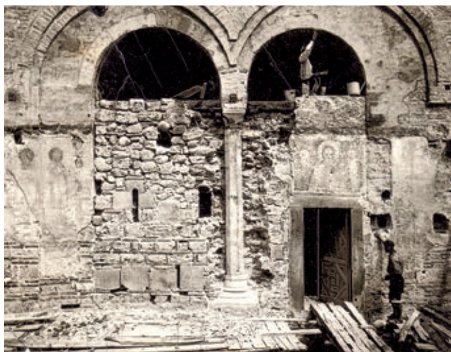
Сл. 380 и 381. ПЕЊКА ПАТРИЈАРШИЈА, ЈУЖНА ФАСАДА ПРИПРАТЕ ТОКОМ КОНЗЕРВАТОРСКО-РЕСТАУРАТОРСКИХ РАДОВА ИЗ 1931–1932. ГОДИНЕ

стова и студија монографског карактера у којима су манастири и цркве на том подручју, услед ширег интересовања за њихово истраживање, тумачени са историјскоуметничког аспекта. Њихови аутори, за разлику од старијих испитивача старина,