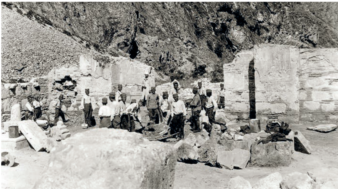
Сл. 387. Свети Арханђели код Призрена, археолошко ископавање у манастиру, снимак из 1927. године

Први покушај организоване заштите у Краљевини Срба, Хрвата и Словенаца повезује се с формирањем Комисије за чување и одржавање историјско-уметничких споменика при Министарству вера 1923. године. 69 Под надзором и контролом те комисије, прикључене 1930. Синоду Српске православне цркве и привремено укинута 1934, извођени су, када је реч о споменицима у косовскометохијској области, радови на обнови Пећке патријаршије и цркве Светог Стефана у Бањској. 70 Након двогодишњег прекида, увидевши потребу за даљом стручном сарадњом, Синод је 1936. године основао Саветодавну комисију за чување архитектонских споменика. Упркос разним потешкоћама у раду, њени су чланови на неколико седница одржаних до почетка 1938. године разматрали могућности извођења радова неопходних за збрињавање и санацију манастира Бањске и Дечана, то јест за спречавање њиховог даљег пропадања. 71