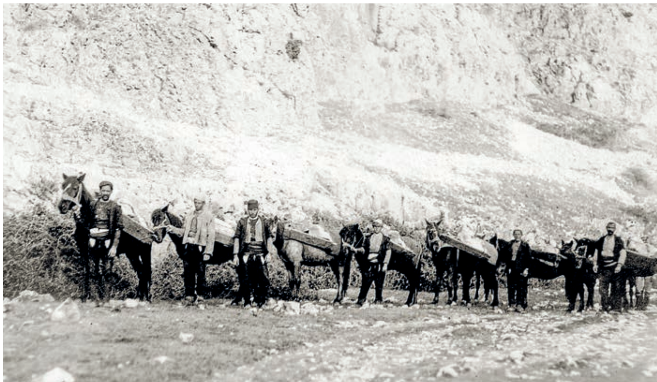
Сл. 388. Свети арханђели код Призрена, преношење археолошких налаза из Душанове задужбине у Куршумли-хан у Скопљу