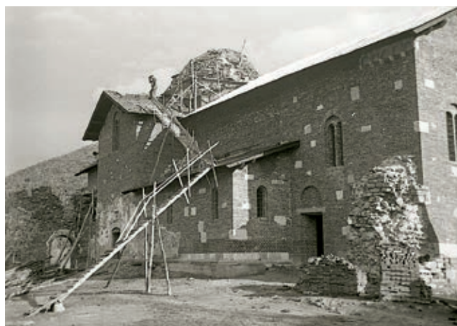
Сл. 385 и 386. Црква Светог Стефана у Бањској током радова, снимци из 1938. и 1939. године

живописа и проналазе им аналогije. О представама историјских личности – владара, племића и црквених лица – у Грачаници, Богородици Љевишкој, Дечанима и Богородици Одигитрији у Пећи писало је