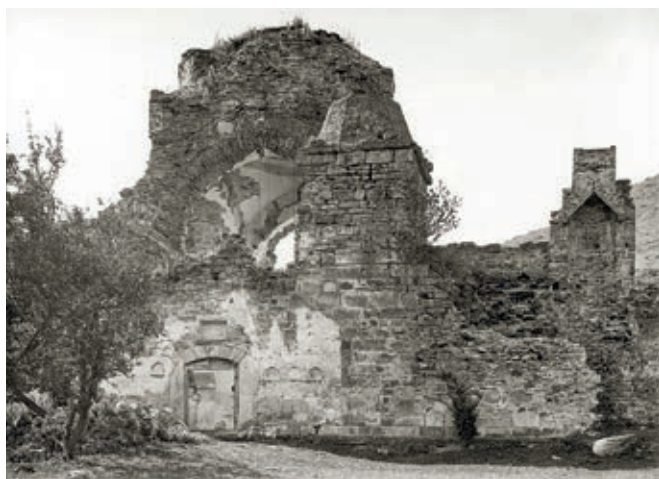
Сл. 383 и 384. Црква Светог Стефана у Бањској пре конзерваторско-рестаураторских радова, снимци из 1934. године

и скулптура потоњег манастира и током наредне две године, 1939. и 1940. Тада је музеј обавио последње снимање неког средњовековног споменика, а даљи теренски рад спречен је избијањем Другог светског рата. Током свих поменутих кампања начињено је око 1.500 снимака споменика на Косову и Метохији и урађен је велики број акварела с распоредом живописа и приказом архитектуре. 37