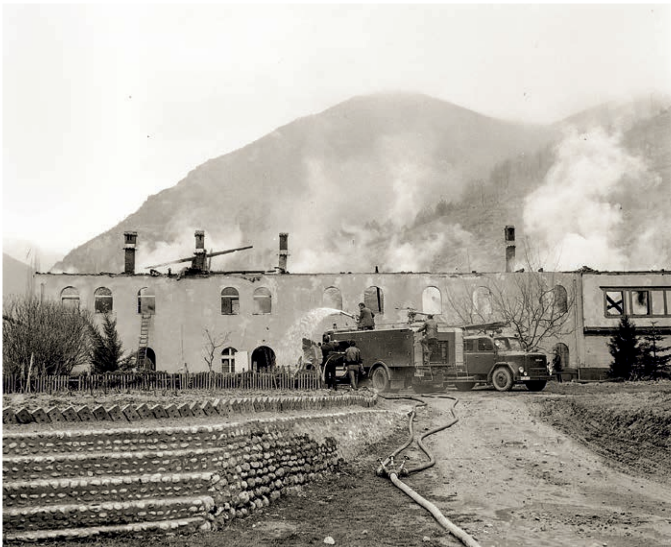
Сл. 349. Пећка патријаршија, западни конак током пожара 1981. године

матски уништавана, па старо српско сеоско гробље из времена пре Велике сеобе у Горњој махали села Раушића код Пећи више не постоји, срушени су стари надгробници у селу Чабићи код Клине Метохијске, у Драгалевцу код Урошевца, у Малој Круши, у Ораховцу, у Љутоглаву и Дворанима код Призрена, у Великој Реци код Вучитрна, порушена су педесет два споменика у Коретини код Косовске Каменице, а у Рогачици „сви до једнога“, док је у Тополници гробље преорано. Порушен је и Споменик ратницима српске војске из Првог светског рата у селу Љубенић.