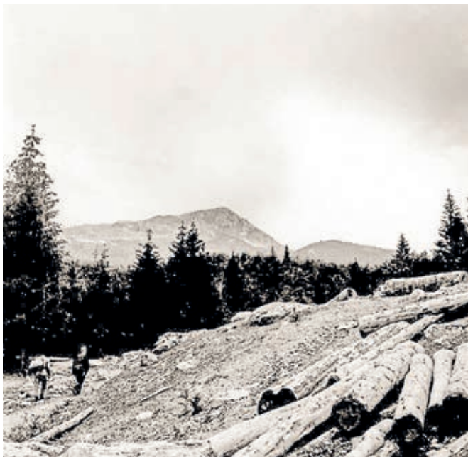
Сл. 343. Бесправна сеча манастирских шума, снимак из 1966. године

и Богородице Љевишке. Данашња сазнања о њима дугујемо искључиво Светозару Матићу, који је рукописе прилежно описао и из појединих начинио исписе пре но што су претворени у пепео и прах. 39