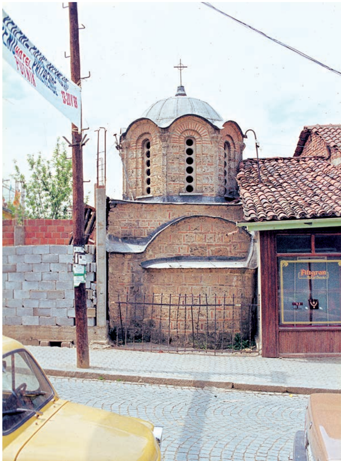
Сл. 347. Призрен, Свети Никола Тутијев, источни изглед пре 1987. године