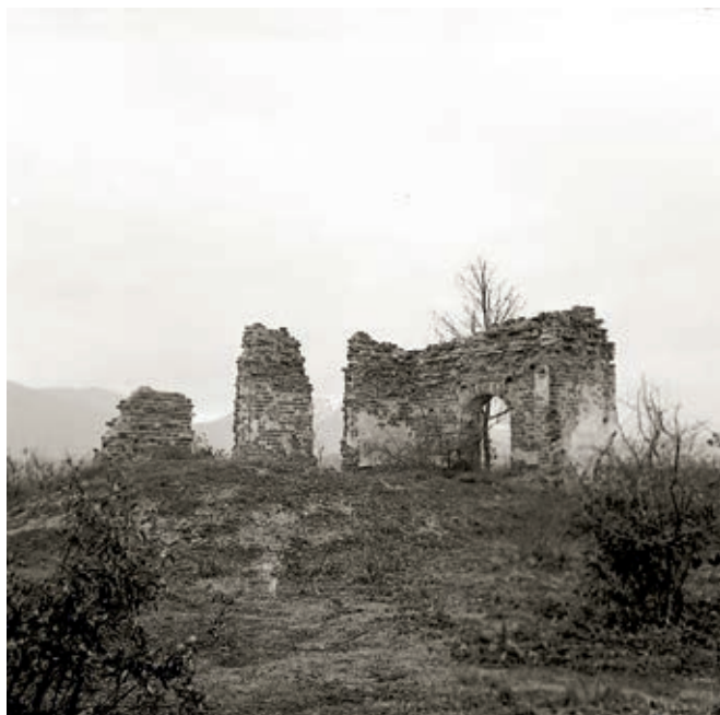
Сл. 340. Нећ код Ђаковице, остаци цркве срушене 1941, снимак из 1967. године