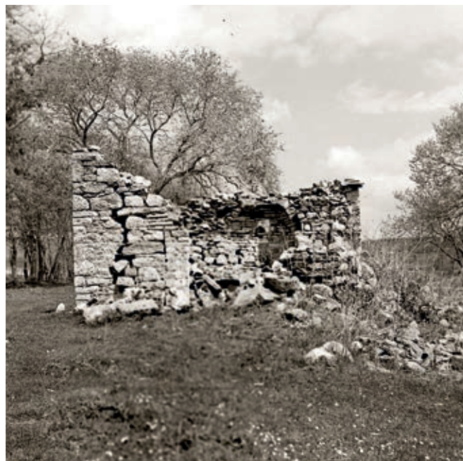
Сл. 341. Брњача код Ораховца, остаци цркве Свете Недеље, срушене 1941. године

новоформиране државе Краљевине Срба, Хрвата и Словенаца, проглашене 1. децембра 1918. године (Краљевина Југославија од 1929. године). 26 Парадигму поверења у нову државу и оптимистичког погледа у будућност представљао би један поступак девичких монаха. Почетком рата, како је поменуто, они су пребегли опробаном начину скривања ризничких драгоцености од могуће похаре – закопавању. 27 Очувавши сребрно посуђе у бурним ратним годинама од насртаја и разарања како војске тако и локалног иноверног становништва, свест о ширем културном значају сасуда исказали су 1920. тако што су их предали на бригу надлежној установи – Народној музеју у Београду. 28