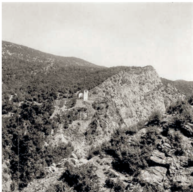
Сл. 337. Манастир Светог Марка Коришког, снимак из 1963. године

следећи активни манастири: Свети Марко, Света Тројица, Грачаница, Драганац, Бинач, Девич и Соколица. 7