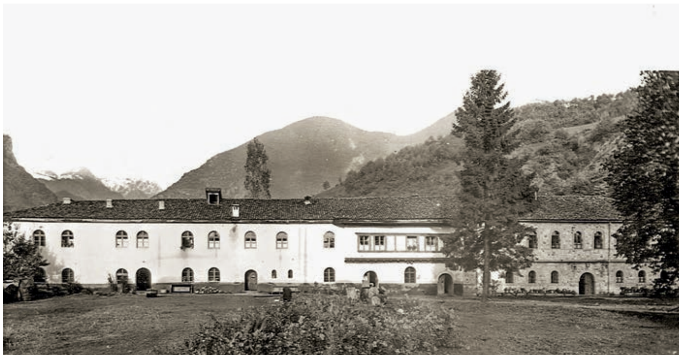
Сл. 348. Пећка патријаршија, западни конак, снимак из 1963. године

пет дана после насилних демонстрација Албанаца у Приштини у којима је захтевана Република Косово, у ноћи 16. марта 1981, у старом спратном конаку Пећке патријаршије избио је пожар (сл. 348–350). Изгорела је зимска капела са црквеним утварима и богослужбеним књигама, као и собе, радионице за штрикање, шивење, каширање икона и магацин с књигама. Све старине сабране у манастирској ризници су, срећом, спасене. Званично изнесене претпоставке да је до пожара дошло због неисправних електричних инсталација или непрописно изведених димњака и пећи на чврсто гориво оспорене су нападним вештачењима, 63 па се једино могло закључити да је пожар подметнут. Исте године страдало је и неколико храмова: на цркви Светог цара Уроша у Урошевцу раздијени су сви прозори, у Неродимљу је обијена Богородичина црква, док су у црквеној згради крај храма у Урошевцу и у цркви у Долцу код