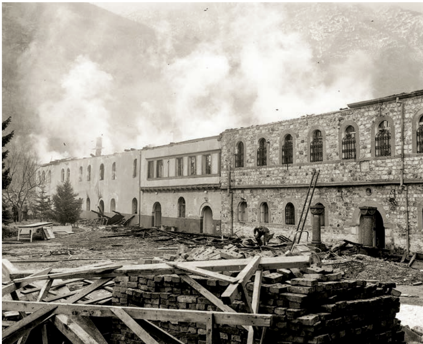
Сл. 350. Пећка патријаршија, западни конак током пожара 1981. године

Клине у Метохији, сеоске цркве у Сићеву и Млечанима, изграђене и осликане убрзо после обнове Пећке патријаршије 1557, као и средњовековни манастирски комплекс у Доброј Води, биле су конзервиране и рестаурисане 1967. и 1968, да би две деценије касније зјапиле без врата, руиниране унутрашњости и тешко оштећених фресака, по којима су урезиване паролe непријатељске садржине.