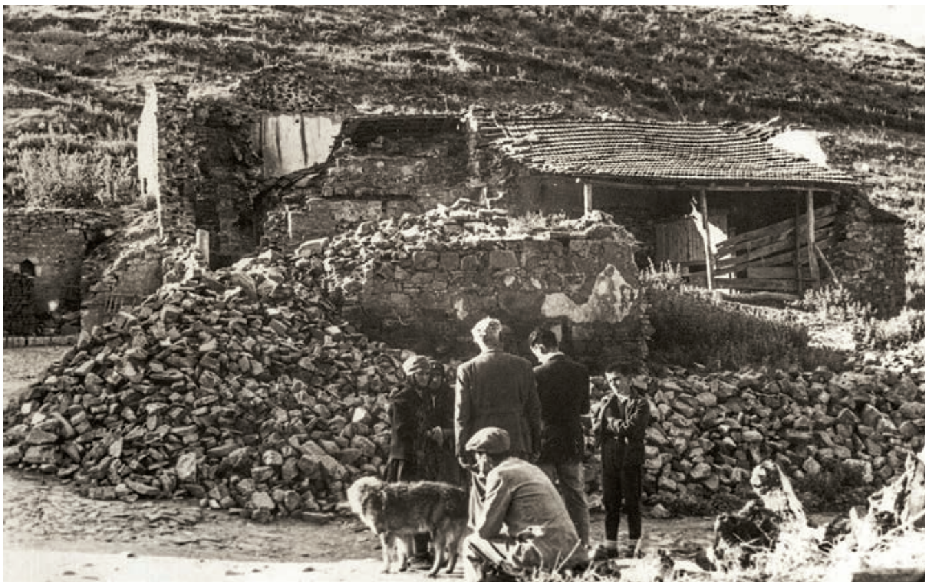
Сл. 342. Манастир Девич на почетку обнове 1948. године

Оскудно образовање и неизграђена свест о трајном значају споменичке баштине узроковали су и на други начин штету на споменицима. Тако је, рецимо, вучитрнски срески поглавар затражио дозволу за рушење такозване Војиновића куле у Вучитрну, вредног сведочанства српске прошлости у том крају (сл. 339). 35 Мермерна плоча у спомен заједништва Француске и Србије у Првом светском рату, поклон француског маршала Франше д'Епера, уграђена је 1923. у југозападни стубац наоса грачаничке цркве, чиме је уништена фреска из друге деценије XIV века. 36 На припрати цркве манастира Дечана сва троја врата из XVIII века замењена су новима. 37