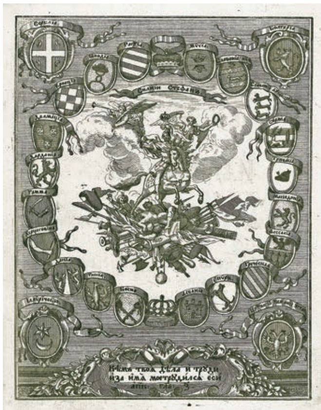
Сл. 71. Христофор Жефаровић, Цар Душан у слави, БАКРОРЕЗ

косовских парадигми: рушена од Турака, затим од аустроугарских војника у Првом и балиста у Другом светском рату, 37 а у наше време од албанских националиста током Погрома 2004. године, она и даље одолева насиљу и зрачи својом недодирљивом харизмом.