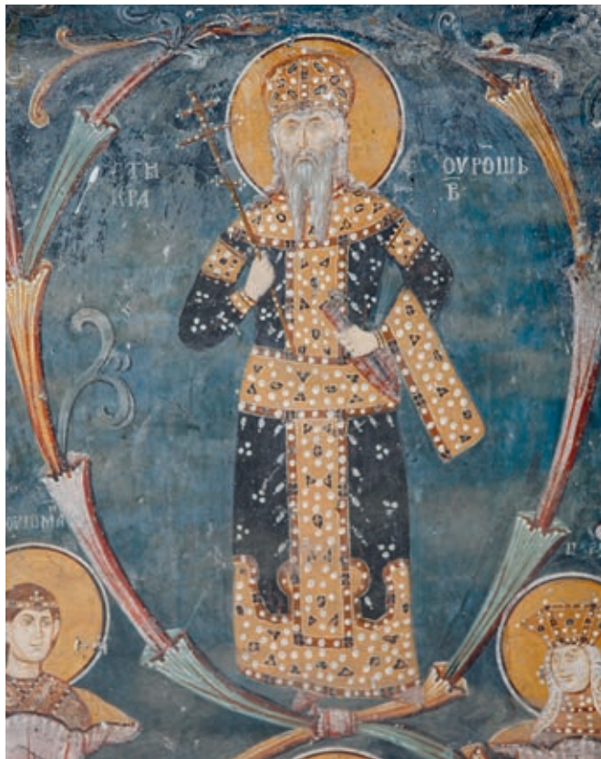
Сл. 63. Пеџка патријаршија, Лоза Немањића, свети краљ Милутин

у околини данашњег Урошевца. 7 Економску основу свеопштег просперитета обезбеђивали су у значајној мери рудници сребра и злата у Новом Брду, где се у првим деценијама XIV века формирао трг, а потом и прави средњовековни град. 8 У таквим околностима подручје Косова и Метохије постаје простор веома динамичног духовног и културног развоја, који је као исход имао стварање нове и разгранате мреже српских светиња и култних жаришта. Реч је била о процесу дубоких корена, подстакнутом широким спектром утицаја. Осим византијског цивилизацијског стратума, столећима присутног на тим просторима, одлучујући утицај имали су облици монаштва и особена духовност што су зрачили са Свете Горе Атоске, као резултат све блиских и врло подстицајних међусобних додира. Ипак, пресудан чинилац