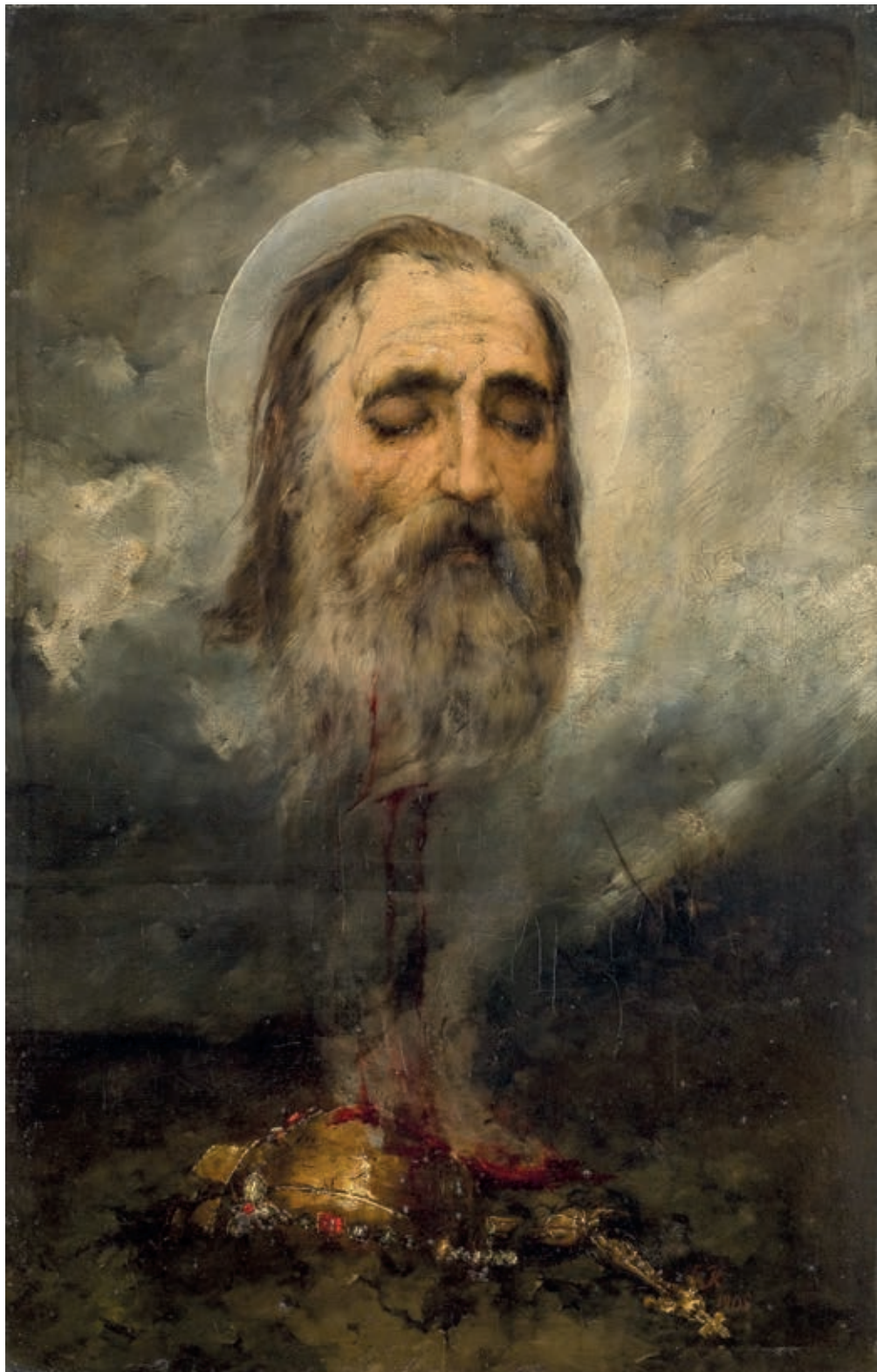
Сл. 77. Ђорђе Крстић, Обретење главе кнеза Лазара , 1905. (НМБ)