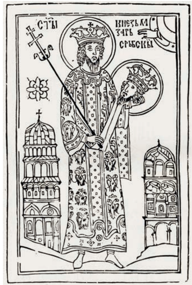
Сл. 70. СВЕТИ КНЕЗ ЛАЗАР КЕФАЛОФОР, ДРВОРЕЗ

Процват монашких ѿусѣиња и свѣтих ѿра , снажно подстакнут ширењем исихастичког покрета по читавом Балкану, створио је услове за појаву многих, углавном анонимних монаха подвижника, али и неких врло истакнутих светих. Подручје Косова и Метохије и у том погледу показује се као незаобилазно. Ту је деловао Јефрем, писац и потоњи српски патријарх, који је обитавао у неким од најугледнијих монашких