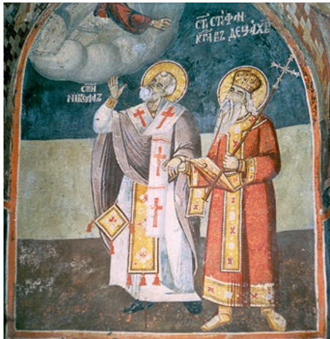
Сл. 74. Манастир Драча, свети Никола и свети Стефан Дечански

Снажењу тих култова с наглашеним патриотским порукама битно су допринели прославни састави,