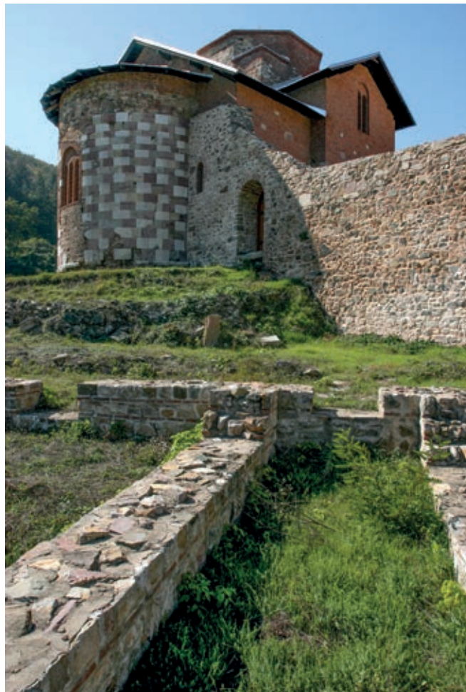
Сл. 64. Манастир Бањска

Већ и само заснивање велелепног дечанског храма, посвећеног Вазнесењу Господњем, збило се у нарочитим околностима. Он не само што је подигнут на „красном месту“, изузетном по климатским својствима и лепоти предела, 19 већ је и избор тог простора био руковођен „вишим“ разлозима. Према дечанској оснивачкој повељи, било је то место које је пронашао и благословио сам свети Сава, а његове молитве помогле су Дечанском да га поново „открије“. 20 Успостављањем такве споне овај дотад „празни“ простор у области Метохије укључен је у немањићко наслеђе, преузевши и део харизме ктиторског