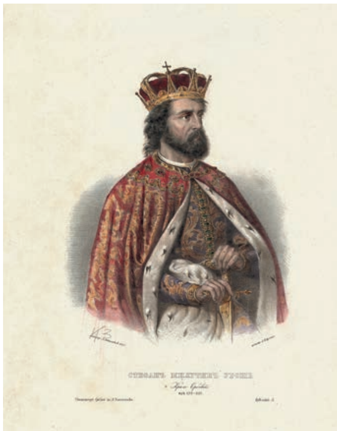
Сл. 75. Анастас Јовановић, Краљ Милутин, литографија

и у идеолошки осмишљеном зидном сликарству, чији је врхунски израз остварен у Крушедолу. 57