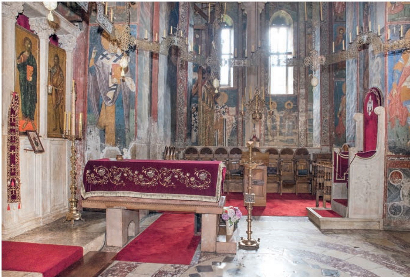
Сл. 66. Манастир Дечани, кивот Светог краља

светог претка. „Одуховљење“ манастирске околине добило је и друге појавне облике. У врлетној и тешко приступачној али веома сликовитој клисури Дечанске Бистрице устројене су келије намењене анахоретима опредељеним за највише облике монашког живота. Ту су обитавали највећи дечански духовници, посвећени молитви, аскези, али и књижевној делатности. Нешто од некадашње ауре и духа тог „монашког раја“, одавно запустелог, преостало је све до наших дана. 21