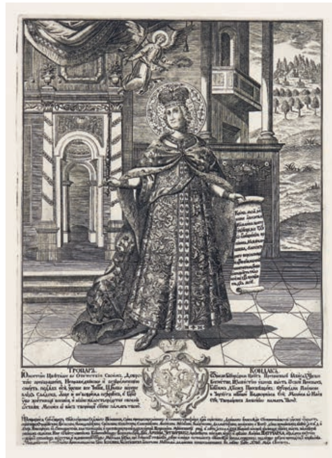
Сл. 72. Христофор Жефаровић, Цар Урош, бакрорез

године. Косово и његове светиње тада су се нашли у средишту програма духовног и културног препорода чији су носиоци били српски патријарси етнарси, међу којима се посебно истичу Макарије Соколовић (1557–1571) и Пајсеј Јањевац (1614–1647). Идејна окосница тог програма пронађена је у немањихким државним, црквеним и уметничким традицијама, схваћеним на суштински и сврсисходан начин. 47 У светлу таквог особеног историцизма треба сагледавати обнову епископских катедр у Пећи и Грачаници, а нарочито оживљавање култова српских светих. Поред култа „свештене двојице“ – Симеона и Саве – нов замањ добија прослављање управо оних светаца чији су култови поникли на Косову и