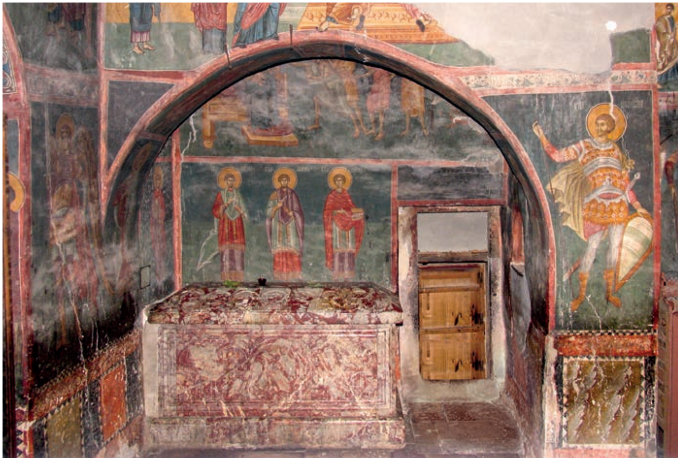
Сл. 68. Пешка патријаршија, црква Богородице Одигитрије, гроб архиепископа Данила II

месџо – у клисури реке Бистрице код Призрена, са старом црквицом посвећеном арханђелу Михаилу – које је било на гласу по чудотворности. 25 Вољом судбине и стицајем прилика, међутим, Душанова раскошна задужбина, с монументалним гробом оснивача, није задобила сакралну ауру својих претходника. Разлоге треба тражити у изостанку култа њеног ктитора, владара који се „дрзнуо“ на царство, као и у чињеници да је манастир страдао већ 1455. године, после турског освајања Призрена. Ипак, харизму коју није стекао међу савременицима Душан „Силни“ задобио је накнадно, столећима касније, када је постао отелотворење и главни јунак славног „Царства Немањића“.