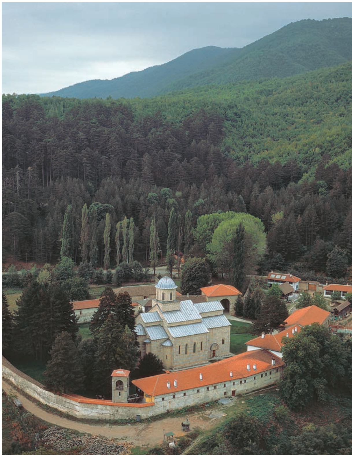
Сл. 65. Манастир Дечани