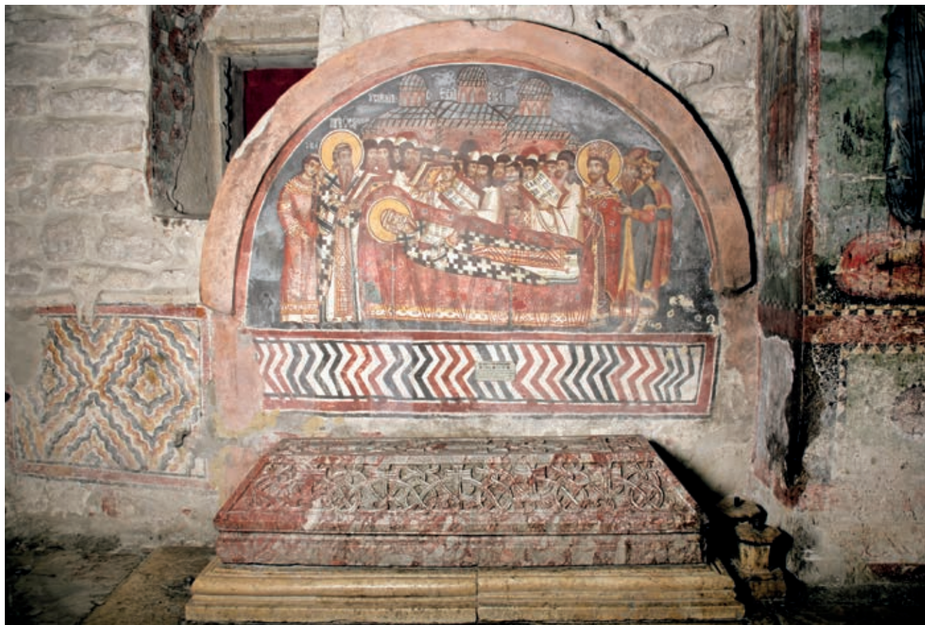
Сл. 67. Певка патријаршија, црква Светих апостола, гроб архиепископа Саве II

приликама – након гашења династије Немањића, у време борбе за опстанак пред турском најездом.