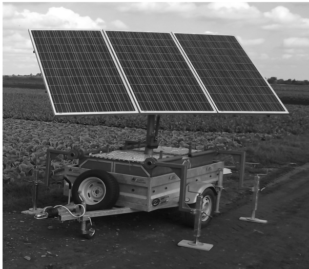
Слика 1. Мобилни роботизовани соларни електрогенератор [1]

Почетком 2015. године у Институту „Михајло Пупин“ из Београда, развијен је мобилни роботизовани соларни електрогенератор [1], односно енергетски ефикасан еколошки уређај који не захтева никакву грађевинску и енергетску инфраструктуру. Ради се о новом производу, јединственом на тржишту Србије и земаља региона, који је пројектован с циљем унапређења пољопривредне производње, а намењен мањим и средњим потрошачима енергије којима може да омогући интензивно и економично наводњавање усева без буке и загађења околине (слика 1).