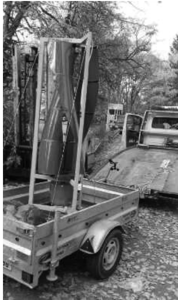
Слика 2. Ветрогенератор мале снаге с вертикалном осовином

У Институту „Михајло Пупин“ су такође анализирани и различити модели ветротурбина. Једно од интересантних техничких решења је ветротурбина чије се коло покреће без обзира из ког правца дува ветар, захваљујући иновативном облику лопатичног кола (слика 2) [4].