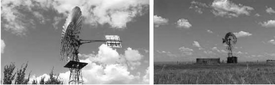
Слика 3. Водена пумпа с погоном на ветар звана „Банат“

представљају чисто механичке уређаје (слика 3). Ради се о веома ефикасним механички оптимизованим уређајима, који функционишу тако што ваздушна струја покреће роторско коло, а оно посредством механичког преносника претвара ротационо кретање у линеарно кретање клипова једне водене пумпе [4].