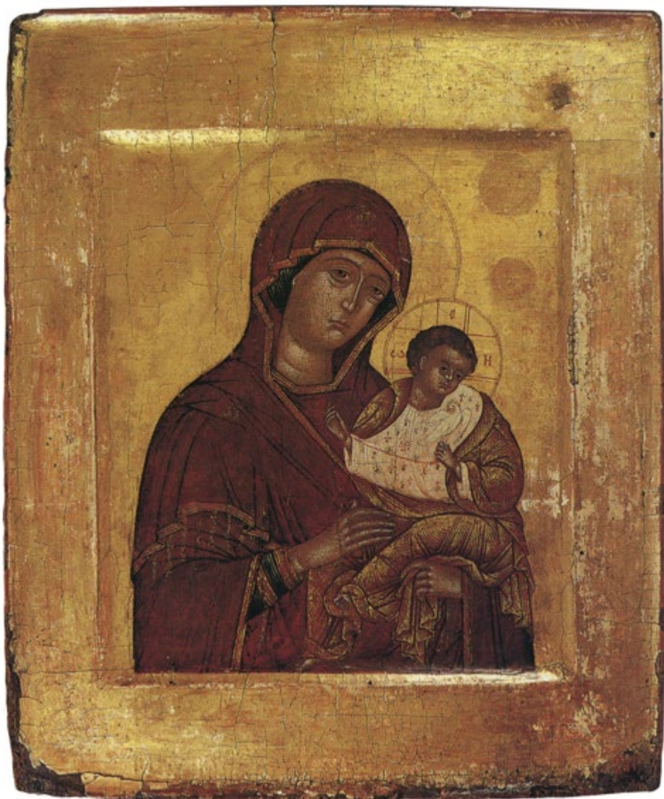
СЛ. 3. БОГОРОДИЦА С ХРИСТОМ И ГОЛУБОМ СВЕТОГ ДУХА, 1592, ДРЖАВНИ РУСКИ МУЗЕЈ, САНКТ ПЕТЕРБУРГ