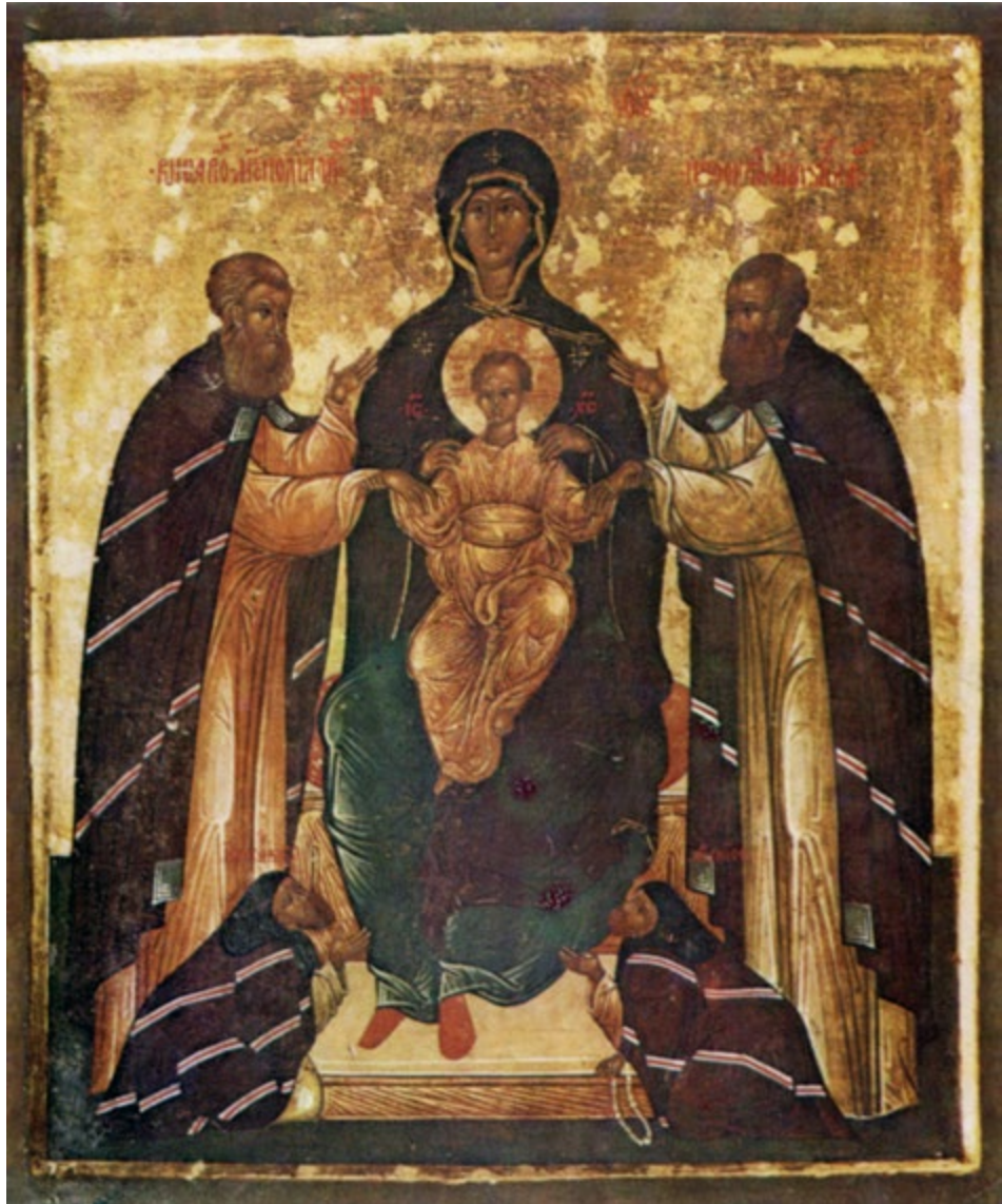
СЛ. 1. БОГОРОДИЦА С ХРИСТОМ И ЛАРИСКИ МИТРОПОЛИТИ ВИСАРИОН И НЕОФИТ, КТИТОРИ МАНАСТИРА ДУСИКА, ЕПИСКОП СТАГА ЈОАСАФ И АРСЕНИЈЕ, 1592, ВИЗАНТИЈСКИ МУЗЕЈ, АТИНА