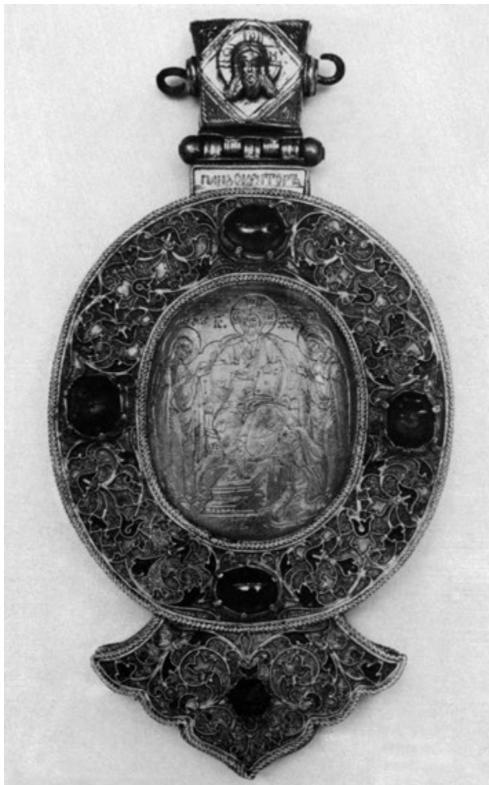
СЛ. 2. СРЕБРНИ ЕНКОЛПИОН, 1595/1596, МУЗЕЈ ИКОНА ГРЧКОГ ИНСТИТУТА, ВЕНЕЦИЈА