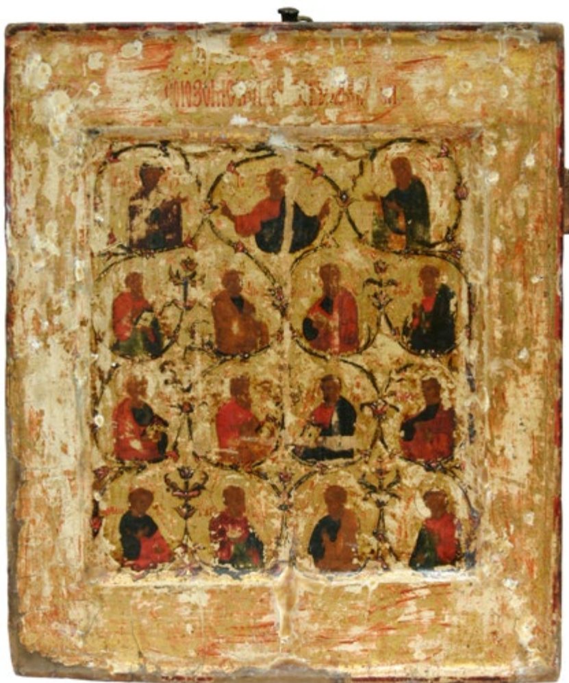
СЛ. 4. ХРИСТОС, БОГОРОДИЦА, СВЕТИ ЈОВАН ПРЕТЕЧА И АПОСТОЛИ, 1594/1595, ХИЛАНДАР