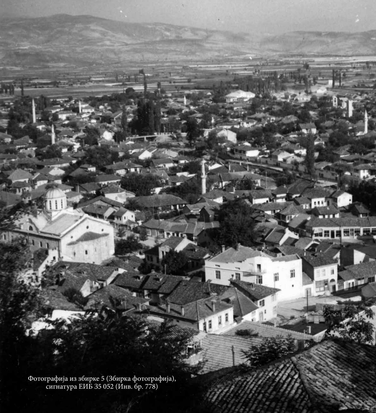
Фотографија из збирке 5 (Збирка фотографија), сигнатура ЕИБ 35 052 (Инв. бр. 778)