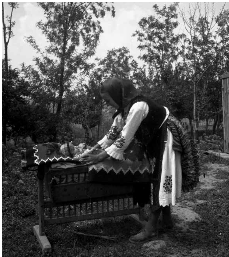
Фотографија из збирке 4 (Збирка негатива), сигнатура ЕИБ 34 228

Испитивачке групе на терену бавиле су се проучавањима Призрена са становишта антропогеогра-