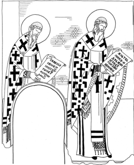
Арсеније I и Сава II, око 1265, Сопоћани

познато тумачење грчких отаца, по којима је кружна тонзура на симболичан начин опонашала Христов трнов венац, што најбоље потврђују у виду венца уплетени праменови косе око обријаног темена, као на портретима Арсенија и Саве II из Сопоћана, Данила II у пећкој Богородици Одигитрији или патријарха Пајсија из Равене, 44 а готово увек их прати и један реалистичан детаљ, минуциозно исликане подрасле власи косе на постриженом делу главе.