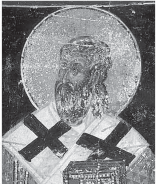
Сл. 17. Патријарх Јован, 1619/20, Свети апостоли у Пећи