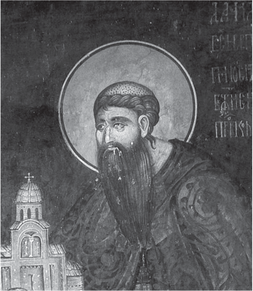
Сл. 13. Данило II, пре 1337, Богородица Одигитрија у Пећи