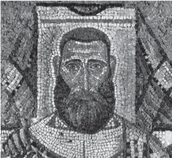
Сл. 4. Архијереј непознатог имена, око 630, Свети Димитрије, Солун