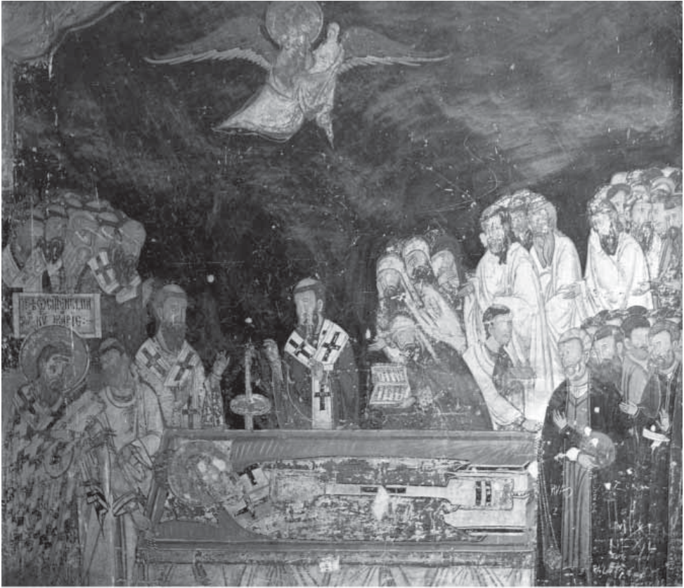
Сл. 16. Опело митрополита Дионисија, 1570, Грачаница