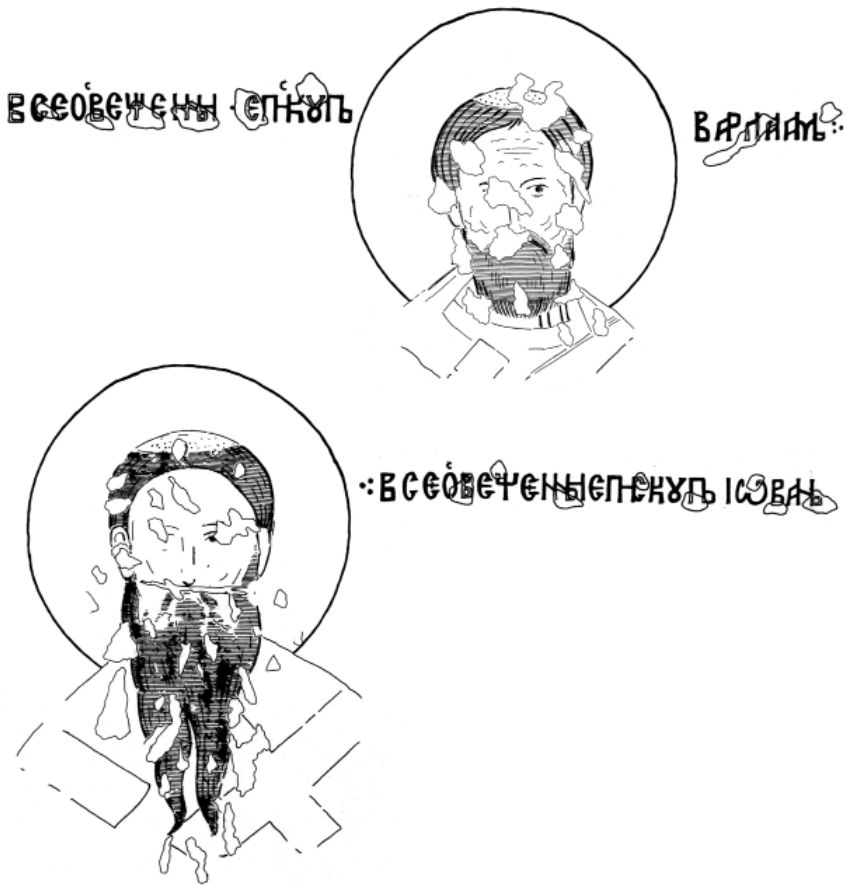
Призренски епископи, Варлам и Јован, после 1310, Богородица Љевишка

савременик, Константин Кавасила, на једној од своје две најстарије представе, у охридској Перивлепти (1294/5), изгледа насликан са кружном тонзуром. 49 Да ли су солунски митрополит Константин Месопотамит и његови суфрагани Никола јеришки, Михаило касандријски и Димитрије ардамеријски, које је Сава, по речима својих животописаца, 50 упознао још као млад светогорски монах пре Четвртог крсташког рата, носили кружни постриг, те тиме били евентуалан Савин узор, може се само претпостављати. Могуће је да се оснивач српске цркве руководио и чисто пастирским разлозима, односно да је бивши атонски монах и овим видљивим обележјем код себе и својих епископа настојао да приведи сународнике католике у Приморју ка правој вери. Не треба заборавити да је