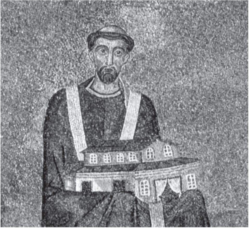
Сл. 3. Папа Хонорије I, око 630, Sant'Agnese fuori le mura, Рим