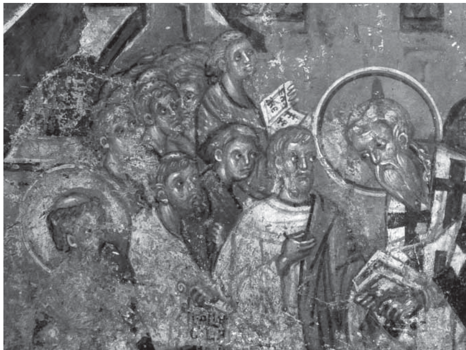
Сл. 14. Опело патријарха Јоаникија, око 1356, Свети апостоли у Пећи