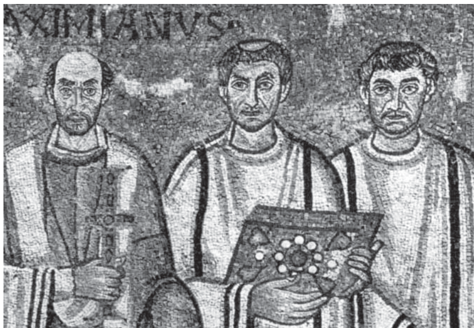
Сл. 1. Архиепископ Максимијан са ђаконима, 546–548, Свети Виталије, Равена