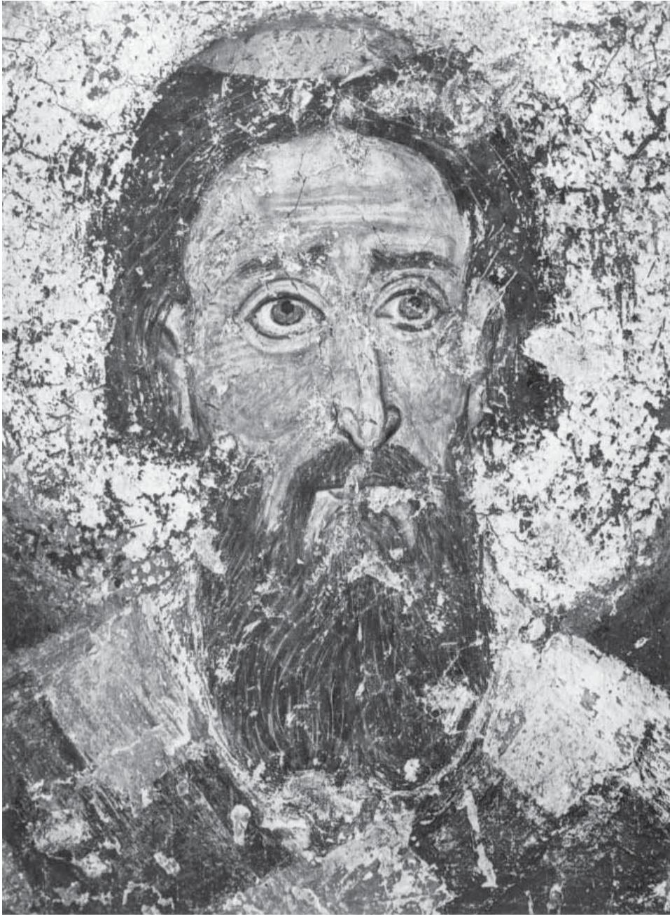
Сл. 12. Сава I, пре 1227, Милешева