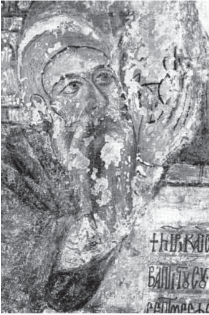
Сл. 7. Јеромонах Неофит, крај XII столећа, Пафос, Кипар