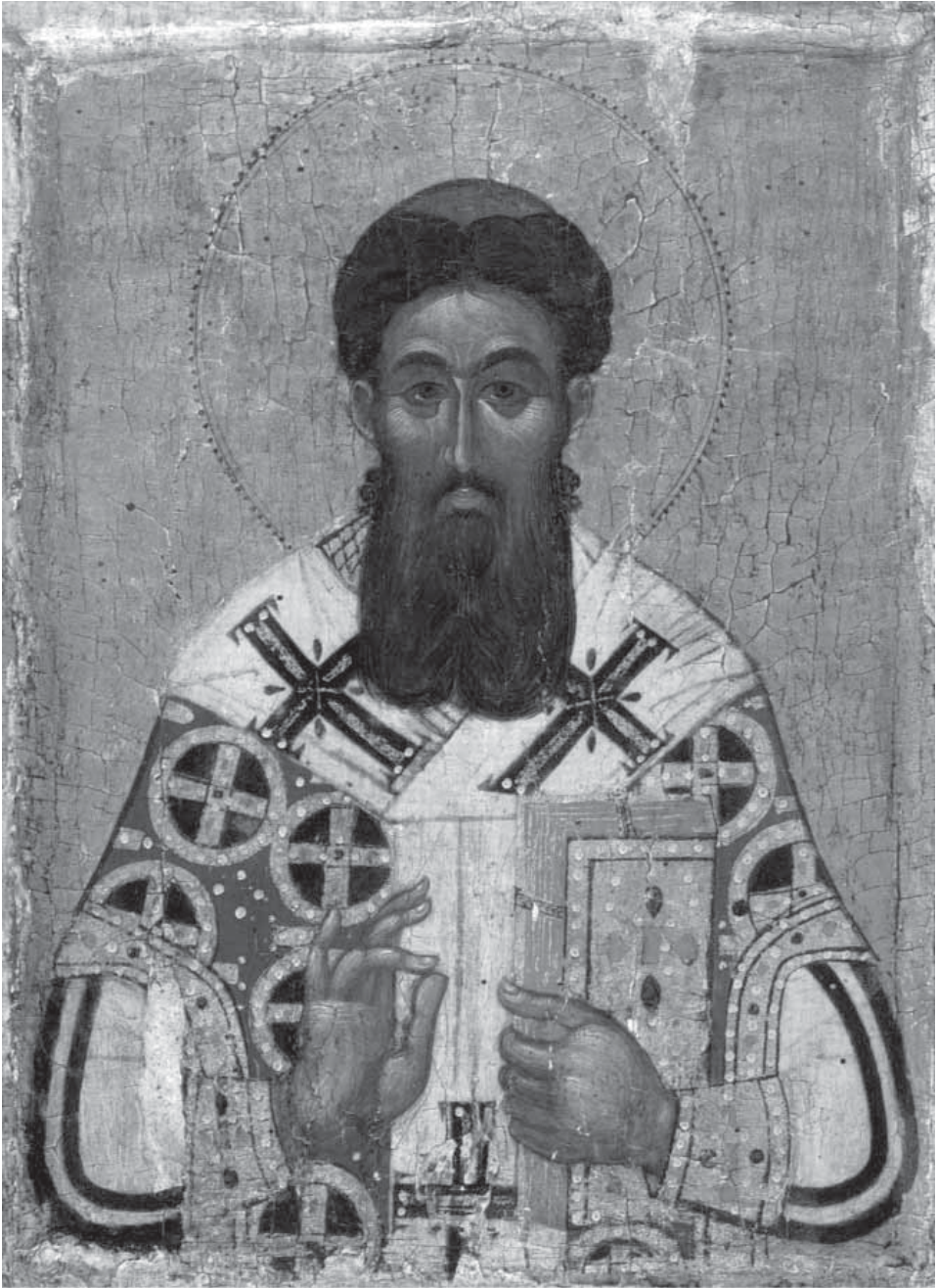
Сл. 11. Свети Григорије Палама, после 1368, Пушкинов музеј, Москва