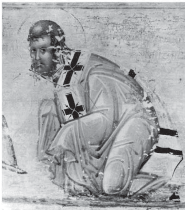
Сл. 15. Митрополит Никанор, прва половина XVI столећа, Грачаница