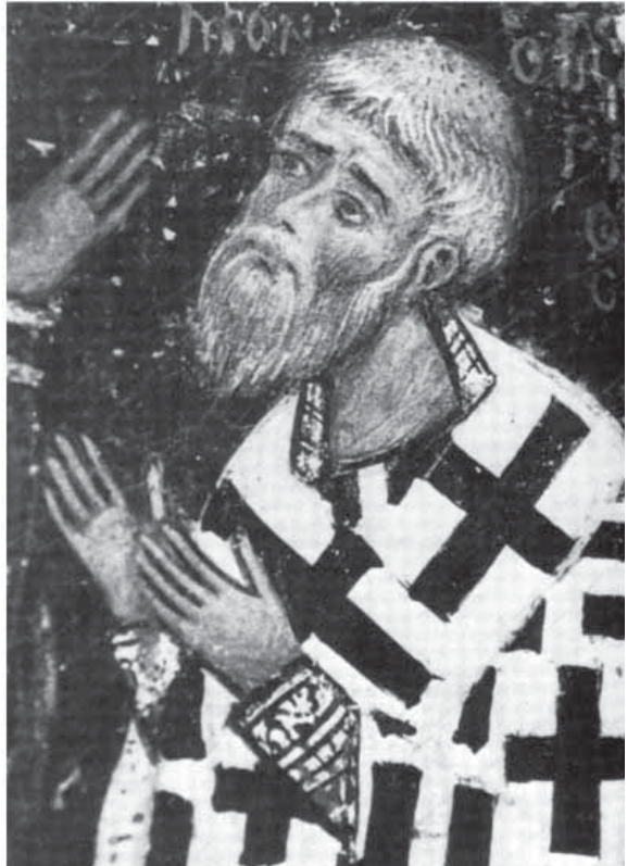
Сл. 9. Јерусалимски патријарх Евтимије II, после 1224, Синај.