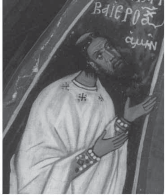
Сл. 8. Јеромонах Варнава, 1332/3, Асину, Кипар