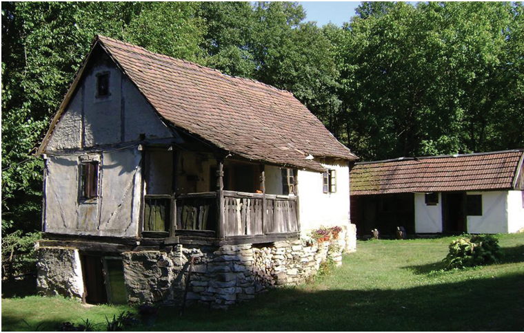
Сл. 5. Етно-кућа на породичном имању „Љесков конак“ Каоци.

ТО Бијељина локација се налази од 2003. године, а 2015. године забиљежено је близу 4.000 посјета.