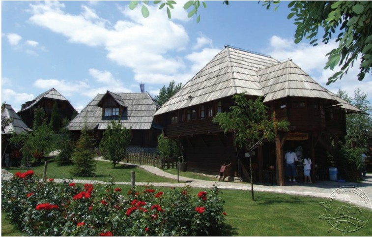
Сл. 4. Етно-село „Станишићи“ Бијељина.