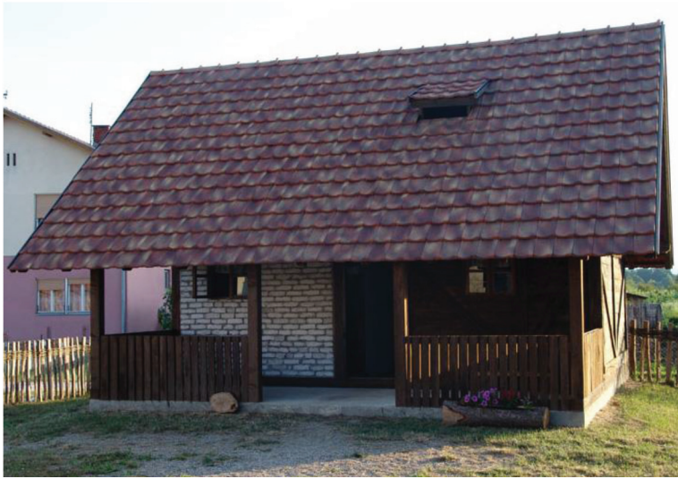
Сл. 2. „Поткозарска етно-кућа“ Пискавица.