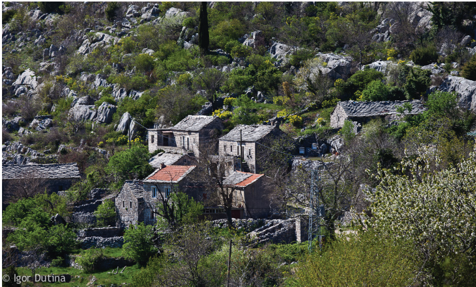
Сл. 1. Етно-село „Увијећа“ Требиње.

је напуштено и као занимљивост се издваја податак да је у њему 2014. и 2015. године сниман филм „На млијечном путу“ Емира Кустурице. Ова амбијентална етно-цјелина је једно од три подручја која се налазе на Националној листи споменика Босне и Херцеговине. У упитнику добијеном од запослених у ТО Требиње овај податак није назначен. Поред тога, Увијећа се не налазе у понуди на интернет страницама ТОРС-а ни ТО Требиње.